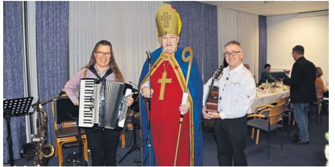
Der Nikolaus im Gespräch mit den Musikern.