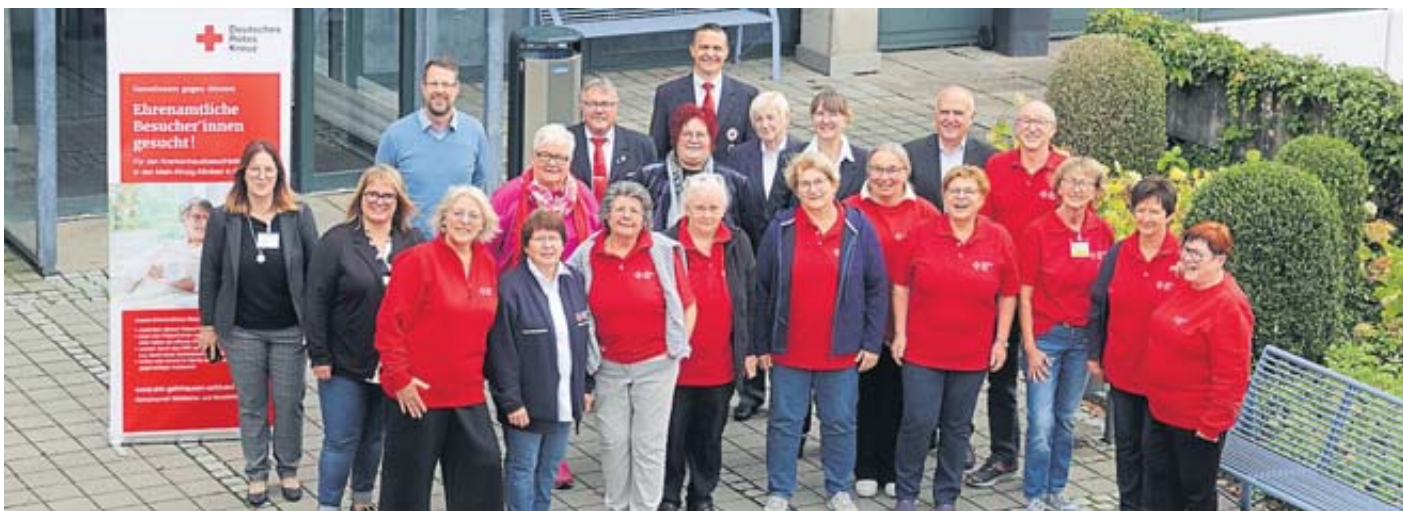
Gemeinsam wurde die Gründung des DRK-Besuchsdienstes im Krankenhaus Schlüchtern gewürdigt und gefeiert.