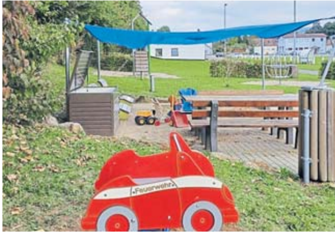
Die Federwippe „Feuerwehrlitzi“ und das neue Sonnensegel schmücken den Kinderspielplatz.