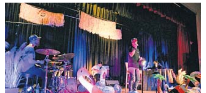
Cocktail-Musik erklingt im festlich geschmückten Spessart Forum.

Eine liebgegewonnene Tradition ist das Weihnachtsingen im Lichterglanz des riesigen Kinder-Weihnachtsbaums mitten im Kurpark am 23. Dezember um 16.30 Uhr. „Gänsehaut pur, wenn gemeinsam mit Silke und Andi Knoll von der Musikschule Musik Total bekannte Weihnachtslieder angestimmt und die Gäste mit einem warmen Glühwein oder Punsch in der Hand zum Chor werden“, freut sich Kurdirektor Stefan Ziegler auf das Event. Im festlich geschmückten Spessart Forum spielt das Südhessische Kammerorchester zum Jahreswechsel gleich mehrfach: Am 24. Dezember um 10.30 Uhr zum festlichen Weihnachtskonzert mit Werken aus aller Welt; am 2. Weihnachtstag um 15.30 Uhr verzaubert das Kammerorchester die Zuhörer gemeinsam mit der talentierten Pianistin Valerie Gumbin (Förderverein junge Künstlerinnen) mit Werken wie „Weihnachten“ von Engelbert Humperdinck. Zum musikalischen Jahresabschluss am 30. Dezember präsentiert Musikdirektor Jaroslav Bilik um 15.30 Uhr beschwingte Melodien wie Jean Gilberts „Glück“ oder „Memory“ aus dem Musical Cats von Andrew Lloyd Webber. Am 27. Dezember, von 15 bis 17 Uhr, verwandelt der Kurbetrieb das Spessart Forum in einen fröhlichen TanzTreff. „Schwingen Sie zu den flot-