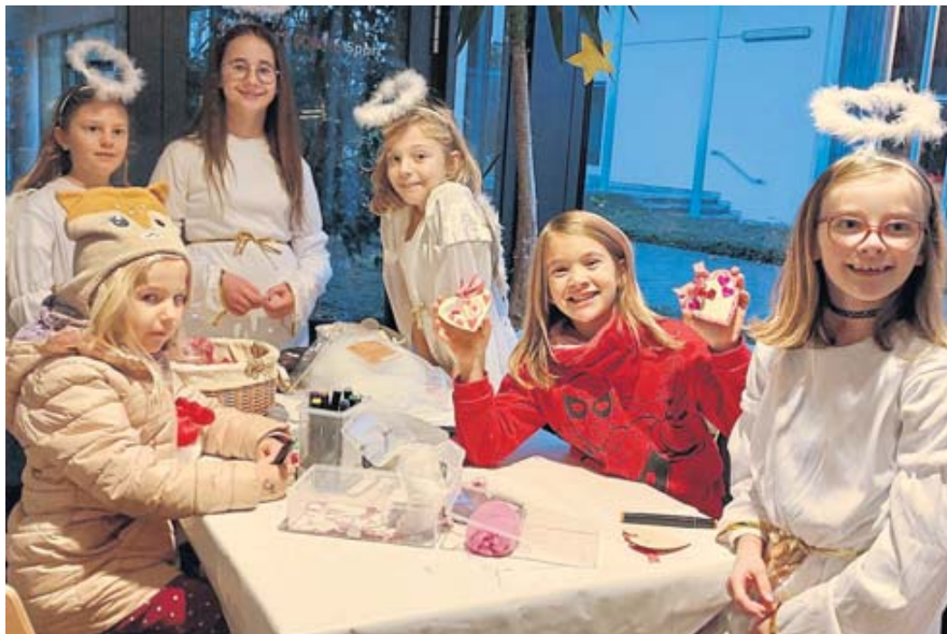
Hübsche Adventssachen kreierte die Kinder in der kfd-Bastelecke.

UERZELL – Vereinsmitglieder, Feuerwehrkameradinnen und Feuerwehrkameraden sowie Mädchen und Jungen der Kinder- und Jugendfeuerwehr treffen sich zur Jahreshauptversammlung der Freiwillige Feuerwehr Uerzell/Neustall am Montag, 30. Dezember. Die Versammlung beginnt um 19 Uhr im Feuerwehrgerätehaus Uerzell. BWW