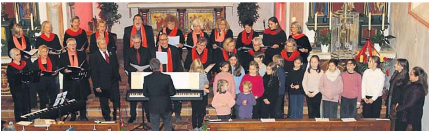
Beim Adventskonzert in der Marborner Kirche gefielen der Chor „Haste Töne“ und der Kinder- und Jugendchor St. Peter & Paul mit einem gemeinsamen Auftritt.