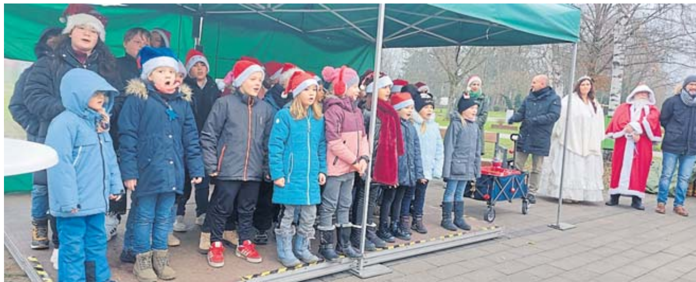
Die Kinder von der Grundschule an der Salz sangen Adventslieder zur Weihnachtsmarkteröffnung und erhielten dafür viel Applaus.

Salzprinzessin Tamara Klug eröffnete offiziell den Markt, und das bunte Marktgeschehen nahm seinen Lauf. Im