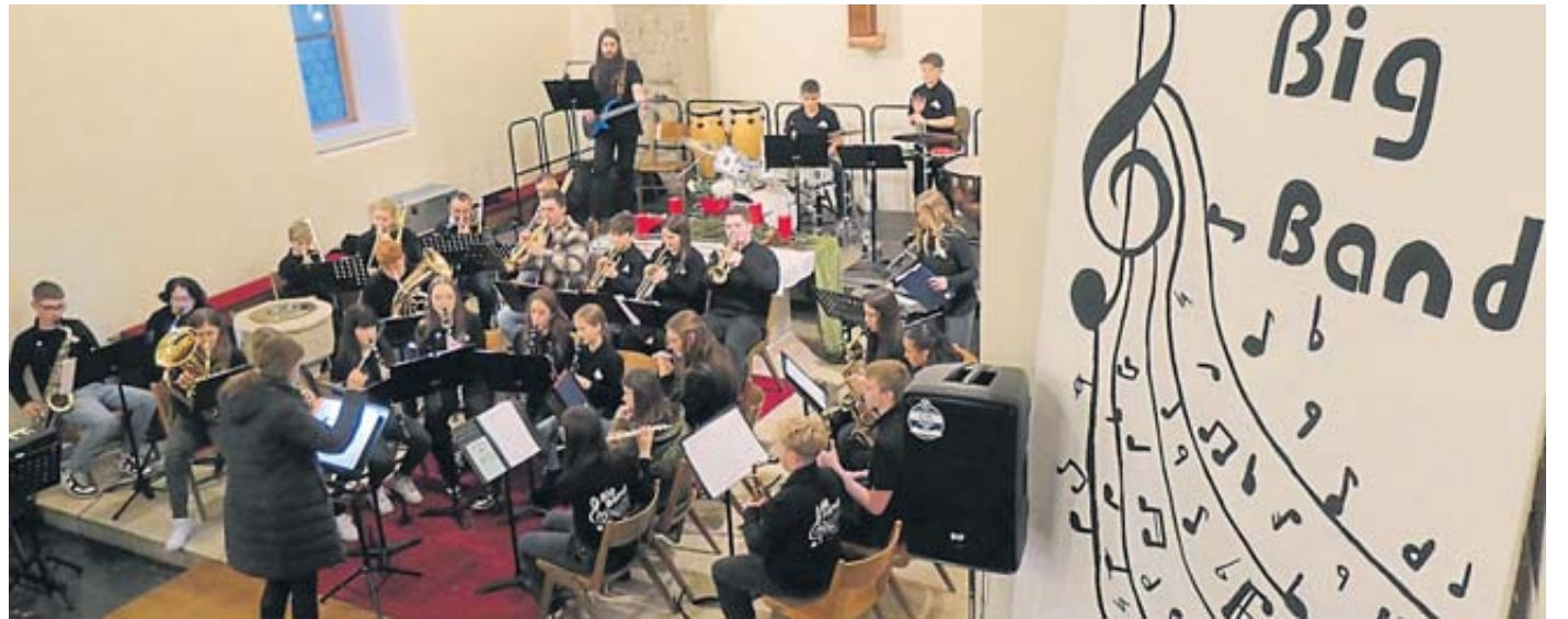
Das Weihnachtskonzert in der Christi-Himmelfahrt-Kirche hat in Altengronau Tradition.