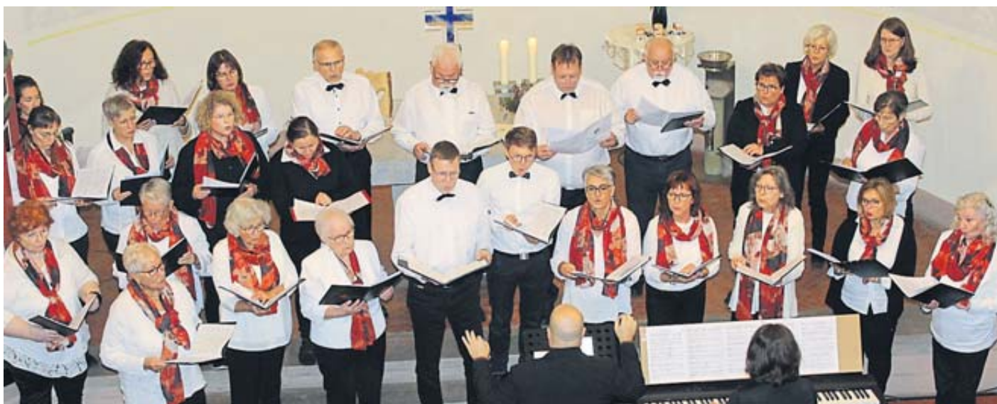
Der Lamm'sche Chor Niederzell mit seinem Stammchor und dem Projektchor „TonArt“.

Alte Bahnhofstr. 13 • 36381 Schlüchtern Tel. 06661/2526 • Fax: 71510