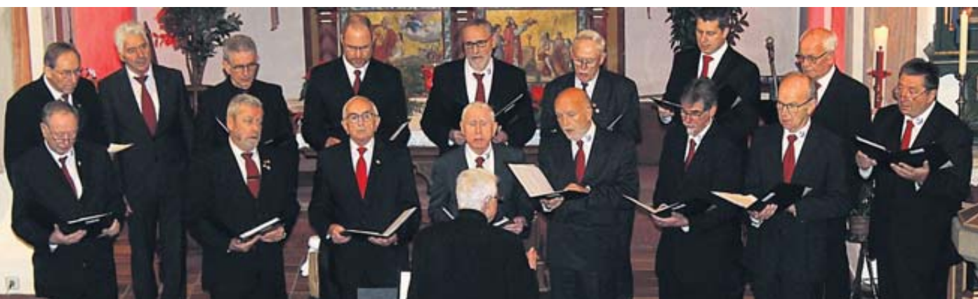
Der Männerchor des Gesangvereins Einigkeit Marborn eröffnete die Programmfolge.

Im Anschluss an das Konzert war an der Marborner Begegnungsstätte für das leibliche Wohl gesorgt. Auch gab es einen kleinen Basar mit hübschen weihnachtlichen Artikeln. Der Erlös wird an das Kinderhospiz Bärenherz gespendet. FGW