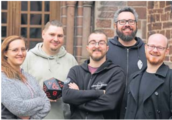
Das Foto zeigt den Vorstand der Würfelinitiative.

SCHLÜCHTERN – Fantasievolle Abenteuer erleben, kreative Geschichten erschaffen und dabei neue Freundschaften knüpfen – das sind die Ziele des neu gegründeten Vereins „Würfelinitiative“ in Schlüchtern. Seit dem 28. Juni bietet der Verein eine Plattform für alle, die sich für Rollen- und Brettspiele begeistern. „Der große Erfolg des Gratisrollenspieltages 2024 hat uns gezeigt, wie viel Interesse an Spielerunden in unserer Region besteht“, erklärt der Vorstand. „Wir möchten diese Begeisterung aufgreifen, um eine dauerhafte Gemeinschaft zu schaffen, in der sich alle willkommen und akzeptiert fühlen.“ Dabei spielt es keine Rolle, ob man kompletter Neuling oder erfahrener Rollenspieler ist. Die Gründungsmitglieder verbindet ihre langjährige Leidenschaft für Rollenspiele und der Wunsch, andere für dieses kreative Hobby zu begeistern. Im Fokus stehen die so-