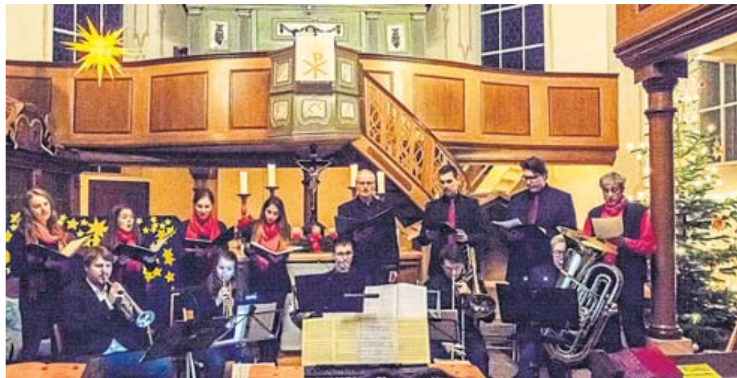
Sänger und Bläser des Hutten-Ensembles gestalten ein Weihnachtskonzert in der Ramholzer Kirche.