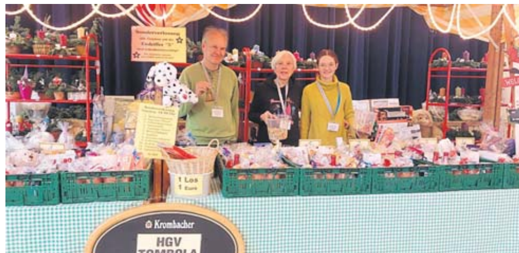
Der Heimat- und Geschichtsverein organisierte seine riesige Tombola.

Den ganzen Nachmittag über herrschte reges Markttreiben, die Gäste ließen sich Glühwein, Deftiges und Süßes schmecken und genossen ganz einfach das gesellige Zusammensein. PK