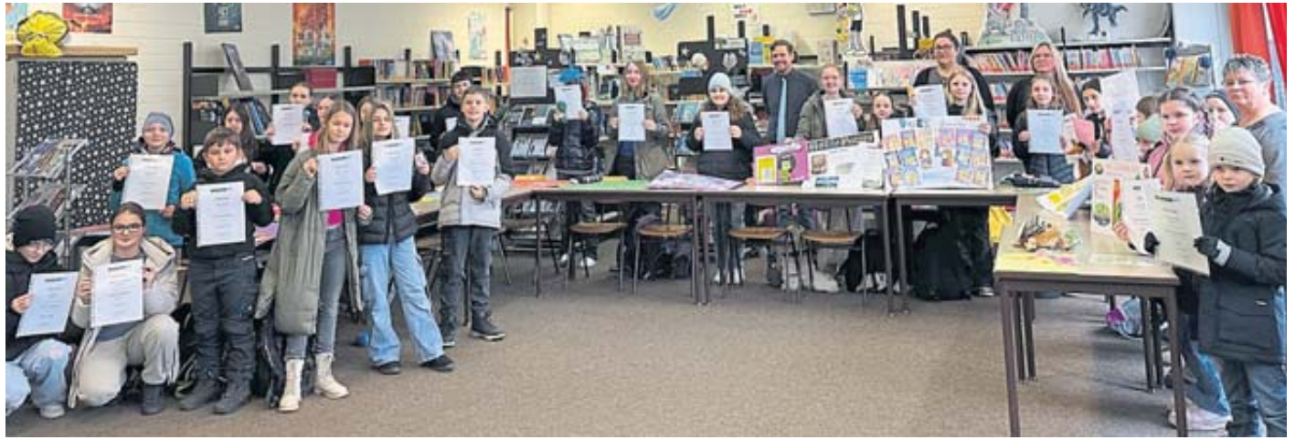
Die Gewinner des Wettbewerbs aus Grund- und Sekundarstufe in der Bücherei der Henry-Harnischfeger-Schule.

Infos und Anmeldung bildungspartner-mk.de