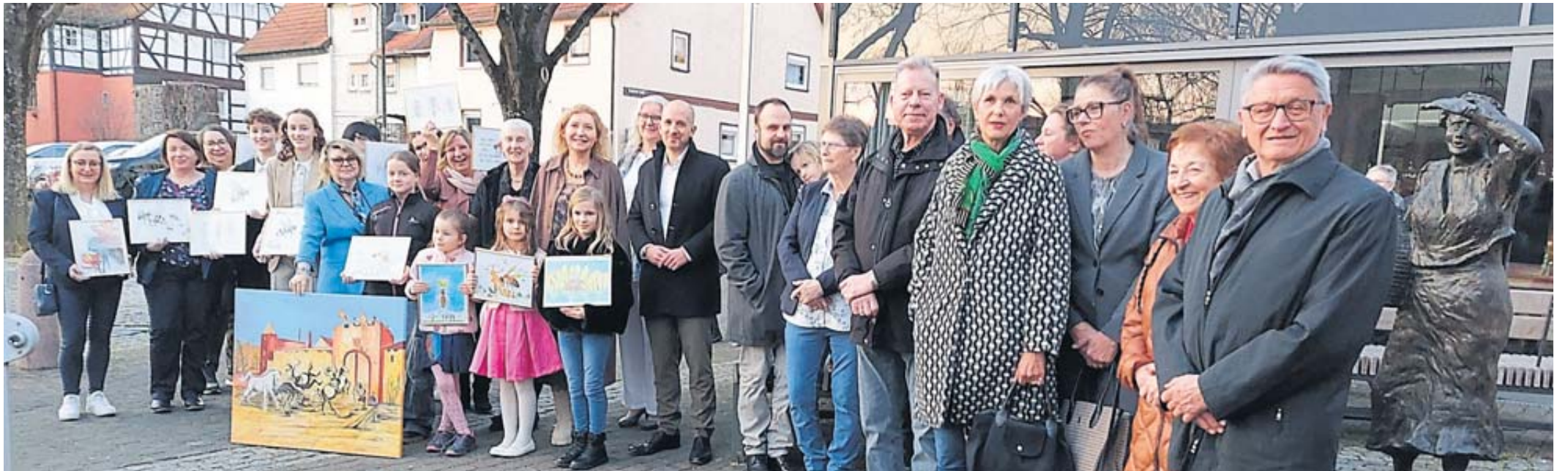
Auf dem „Platz der tapferen und mutigen Frauen“ hatten sich zahlreiche Bürgerinnen und Bürger eingefunden, um die Namensgebung gebührend zu begleiten.