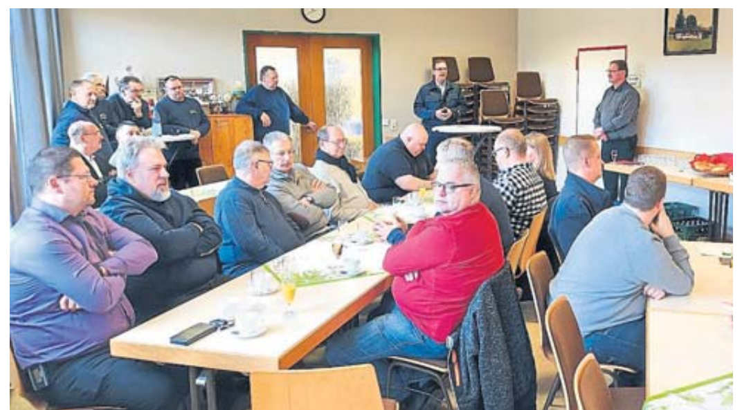
Einige Teilnehmer des Neujahrsempfangs des Feuerwehr-Unterverbandes Schlüchtern im Niederzeller Feuerwehrhaus.

Wie Schauburger mitteilte, findet die diesjährige Verbandsversammlung des Feuerwehr-Unterverbandes Schlüchtern am 10. Mai in Breitenbach anlässlich des 100-jährigen Jubiläums der Breitenbacher Feuerwehr statt. FGW