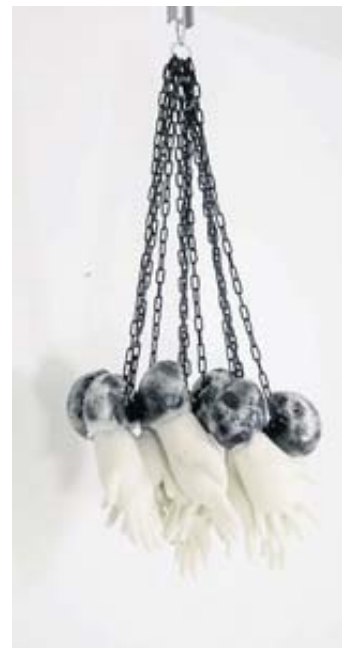
Ein Werk von Lars The Zun Kempel.

In Schlüchtern: Kinzigtal Nachrichten, Obertorstraße, The Stage, Gartenstraße 50 online: kulturwerk2010.de