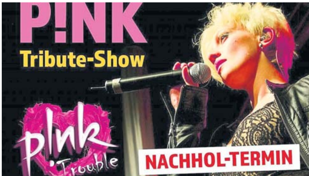
Die P!nk Trouble-Show integriert nicht nur die kraftvollen Balladen von P!NK, sondern auch Elemente aus Rock, Pop, und sogar einem Hauch von Deutschrock.