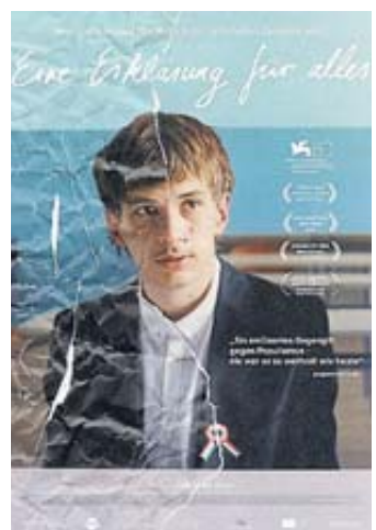
„Eine Erklärung für Alles“ ist ein vielfach preisgekrönter Film.

nalfeiertag am 15. März trägt – dieser wird seit 2002 in besonderer Weise von der Fidesz-Partei als Symbol der nationalen Einheit verwendet. Abel fällt durch die Prüfung, was der leistungsorientierte Vater, ein glühender Orbán-Anhänger, nicht auf sich sitzen lässt: Er gibt Abels andersgesinntem Lehrer Jakob die Schuld. Aus der nichtbestanden Abiturprüfung wird ein Medienskandal, der einen Einblick in das Leben in einem politisch tief gespaltenen Land gewährt. Analogien zu anderen Ländern sind dabei durchaus möglich. Der Eintritt ist frei, über eine freiwillige Spende freuen sich die Veranstalter. BWB Internet europa-akademie-schluechtern.de