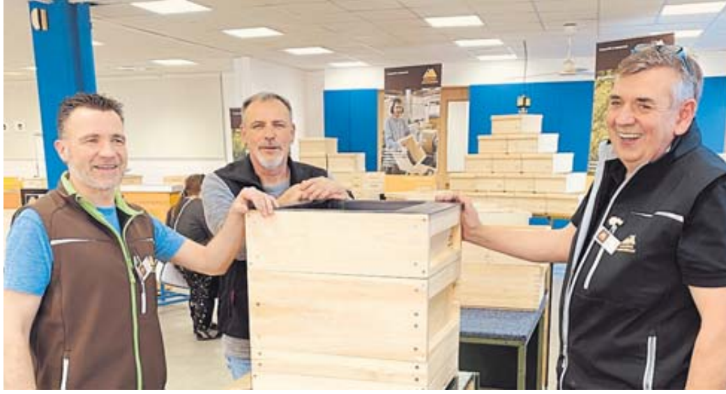
Das kompetente Team der Bergwinkel-Werkstätten beriet zur Ausstattung rund um die Imkerei.