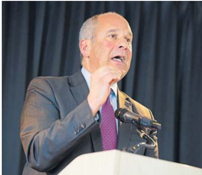
Roman Poseck, Hessischer Minister des Innern, für Sicherheit und Heimatschutz.