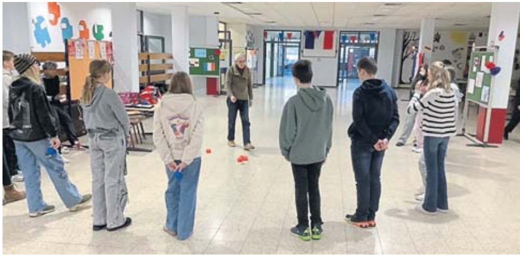
Gemeinsames Boulespiel in der Pausenhalle der Henry-Harnischfeger-Schule.

Die Französischlernenden durften sich an diesem Tag über spezielle Angebote freuen: Eine Filmvorführung auf Französisch, Indoor-Boule,