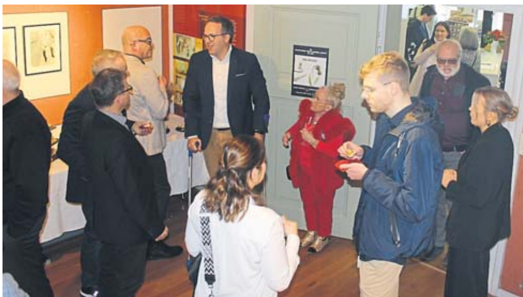
Der Neujahrsempfang bot, bei Häppchen und Getränken, Gelegenheit zu Gesprächen.