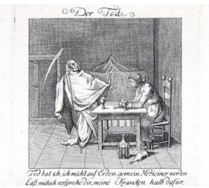
Das Bild eines unbekanntes Künstlers aus dem 18. Jahrhundert zeigt einen Medizinstudenten in einer Begegnung mit dem Tod. Reproduktion: privat

Der Rückzug des Todes in die höheren Altersgruppen hatte Auswirkungen auf dessen Wahrnehmung: Ein öffentliches Sterben, das von den Ritualen der Kirche bestimmt und verwaltet wurde, entwickelte sich hin zu einem aus dem Alltag ver-