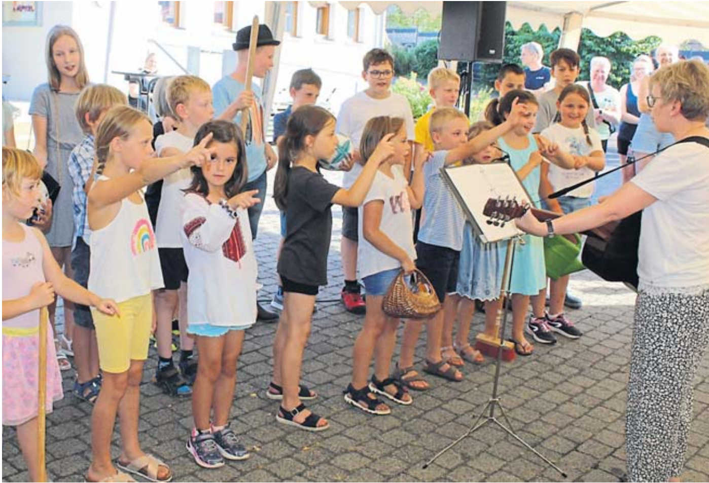
Nachwuchsarbeit hat beim Wallrother Gospelchor „New Spirit“ einen großen Stellenwert.