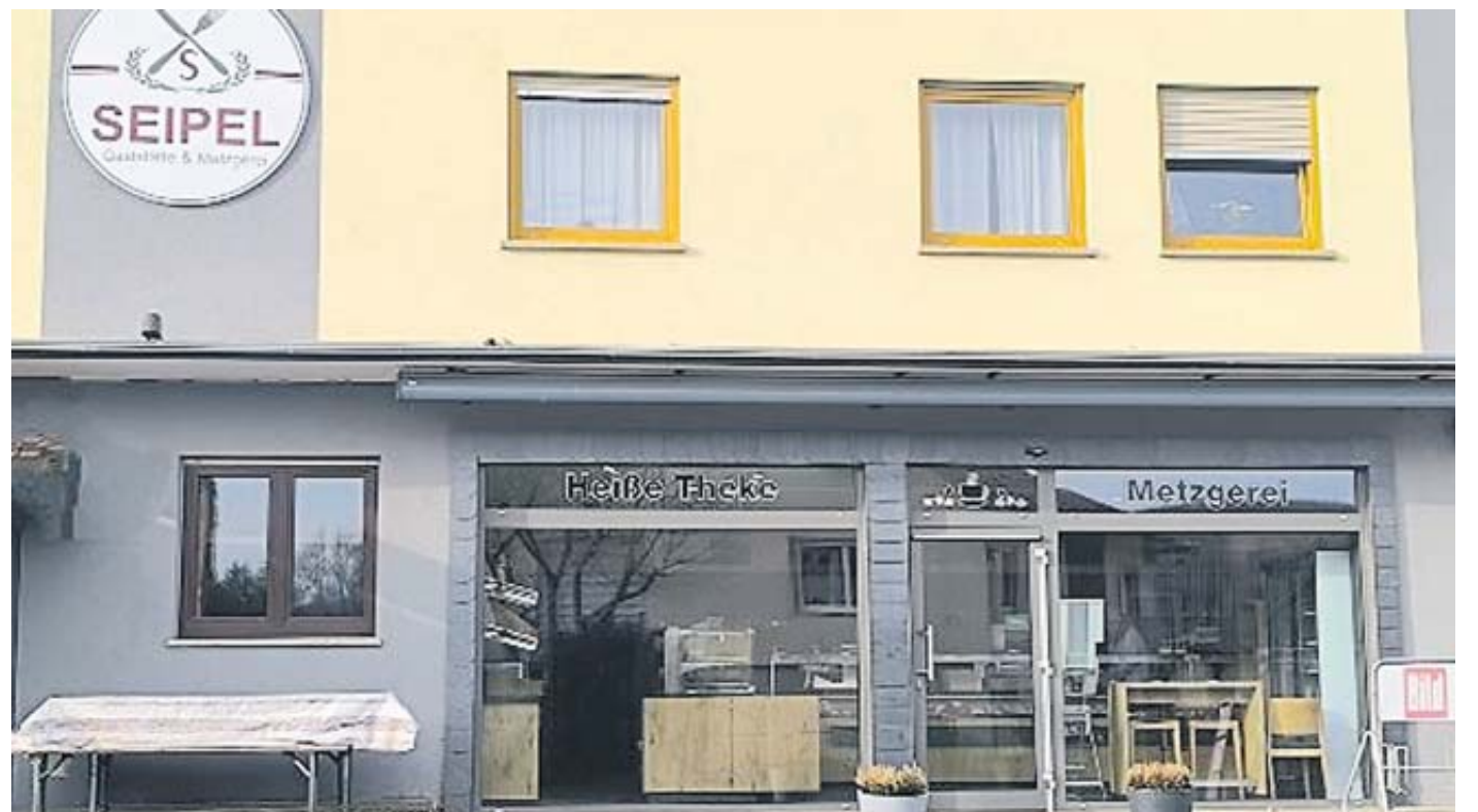
Die Metzgerei Seipel kümmert sich in der dritten Generation um das leibliche Wohl der Kunden.