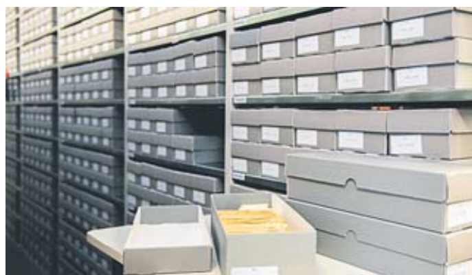
Die Zentrale Namenskartei birgt Daten zu 17,5 Millionen Menschen. Sie zählt heute zum Weltdokumentenerbe. Große Teile der Bestände sind bereits digitalisiert.

sik. Einlass ist ab 19 Uhr. Der Kartenvorverkauf zur Veranstaltung findet dann am Samstag, 8. Februar, von 14 bis 15 Uhr, ebenfalls im Landgasthof Deutsches Haus statt. BWW