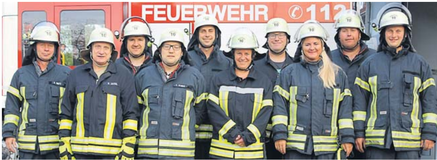
Die erfolgreiche Wettkampfmannschaft der Feuerwehr Uerzell/Neustall hatte sich für die Teilnahme am Landesentscheid der Hessischen Feuerwehr-Leistungsübungen qualifiziert.