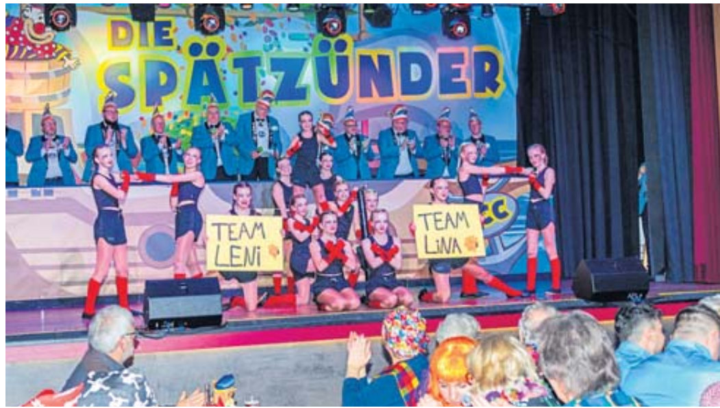
Ein buntes Programm erwartet die Gäste bei den beiden Faschingsitzungen des Schlüchterner Carneval-Clubs „Die Spätzünder“ in der Stadthalle.

Öffnungszeiten: Mo. - Fr. 9:00-20:00 Uhr *Neu*Neu* Samstag 8:30-20:00 Uhr Angebote gültig vom 25.01. - 31.01.2025 Höbäckeweg 24 - 36381 Schlüchtern