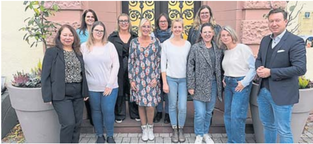
Das Kindertagespflegeteam der Stadt Schlüchtern wächst weiter.