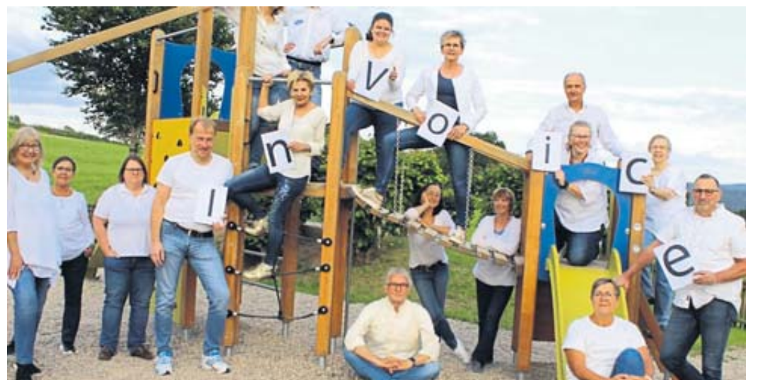
Der Chor des Liederkranzes Breitenbach nennt sich jetzt „InVoice“ und bereitet sich auf ein Konzert-Projekt vor.