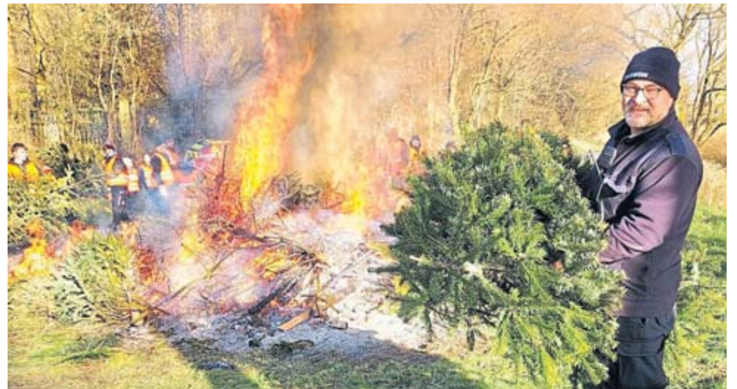
Wer, wenn nicht die Feuerwehrleute selbst, hätten den Brandschutz beim Verbrennen der Weihnachtsbäume, unser Bild zeigt den Platz in Salmünster, sicherstellen können?

Die Feuerwehr Alsbereg sammelte ebenfalls Weihnachtsbäume ein und verbrannte sie auf einem Grundstück unweit des Bolzplatzes vor dem Ort. Das gemeinsame Mittagessen hatte die Feu-