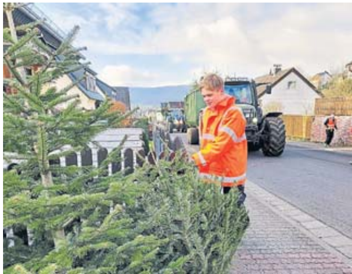
Im Huttengrund waren 25 Kräften in drei Teams unterwegs.

treuer, Helfern aus den Einsatzabteilungen und Land-