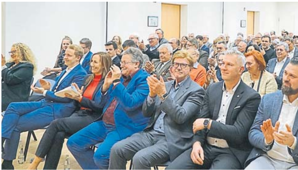
Etwas mehr als 80 meist geladene Gäste nahmen an der offiziellen Eröffnung der Europa-Akademie Schlüchtern im Kultur- und Begegnungszentrum teil.

SCHLÜCHTERN – Die Europa-Akademie Schlüchtern hat nun eine feste Adresse: im neuen Kultur- und Begegnungszentrum (KuBe). Allerdings wurde am Montagabend dort gemeinsam mit Landtagspräsidentin Astrid Wallmann (CDU) keine Eröffnung gefeiert, sondern eine Wiedereröffnung.