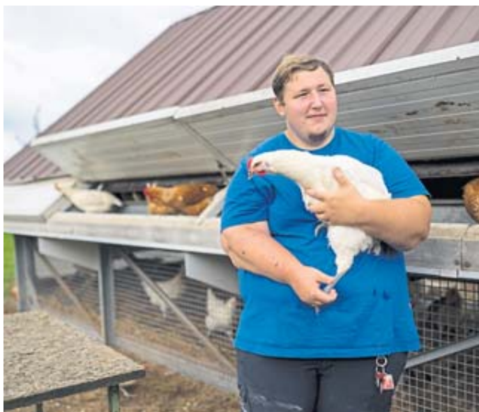
Ein Mitarbeiter des Hofguts Marjoß mit einem Zweinutzungshuhn der Rasse „Cream“, erkennbar am weißen Gefieder.