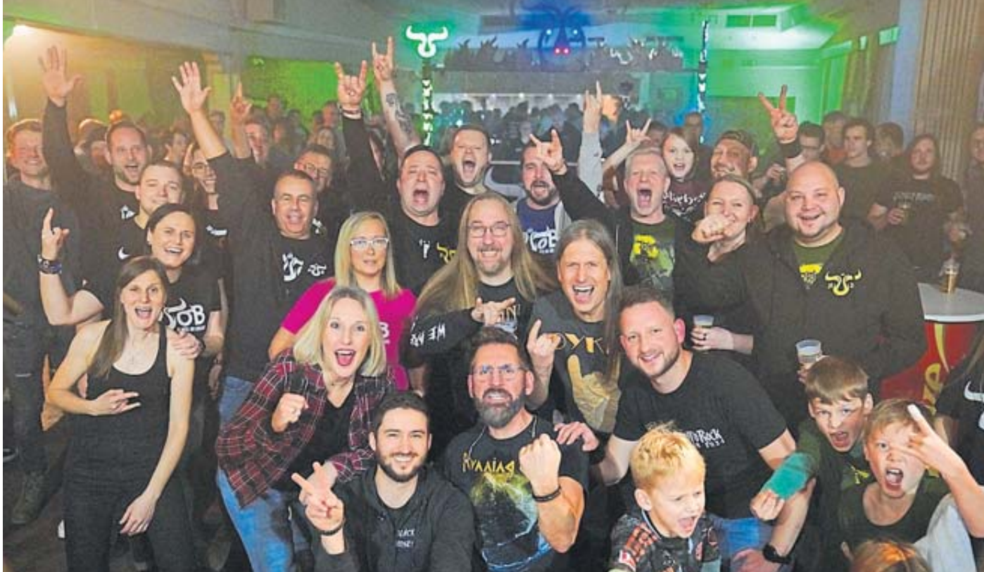
Jede und jeder Einzelne auf diesem Foto hat beim Benefiz-Konzert des Vereins „Ulmich om Braand“ einen Teil dazu beigetragen, dass der Förderverein der Bilzbergschule Ulmbach eine Spende in Höhe von 2025 Euro bekommt.