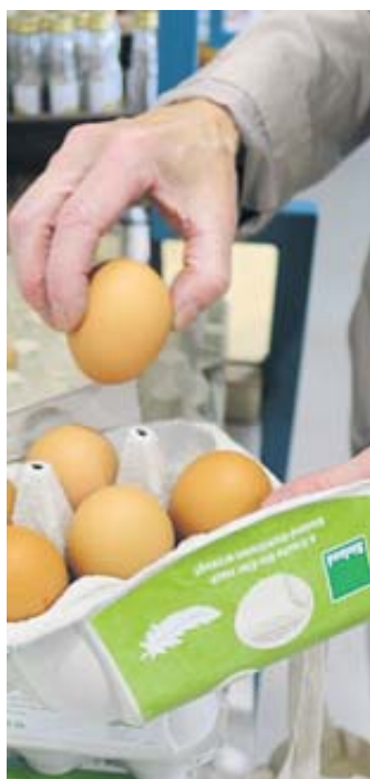
Auf dem Bioland-Hofgut Marjoß werden die Eier für den Verkauf vorbereitet.

AUTOVISION MÖLLMANN Am Elmacker 2 | 36381 Schlüchtern www.autovision-moellmann.de