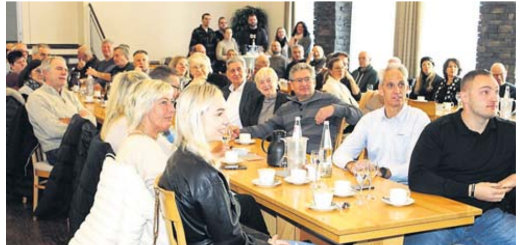
Voll besetzt war der Saal des Landgasthofes Druschel beim Wallrother Jahresempfang.

Zur Sprache kamen auch die Sanierung der noch bestehenden drei Dorf-Backhäuser so-