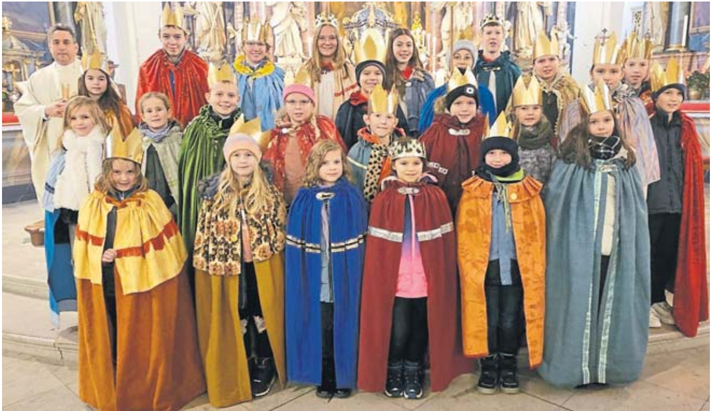
Die Sternsinger der katholischen Kirchengemeinde sammelte 7.200 Euro für die Aktion „„Erhebt Eure Stimme! – Sternsingen für Kinderrechte“.“

Zahnarzt: Für Notfälle außerhalb der Sprechzeiten ist der diensthabende Arzt über die Zentrale Notdienstnummer für den Bereich Zahnmedizin unter (01805) 607011 zu erfragen.