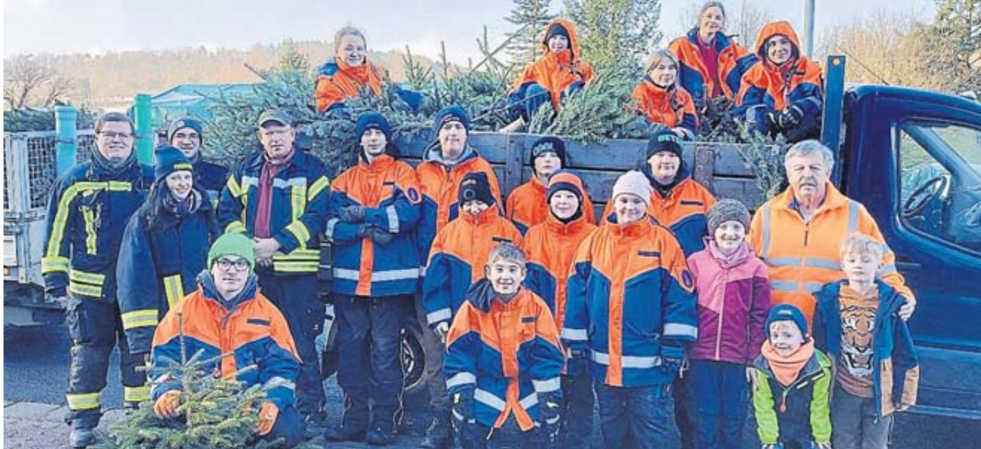
152 Weihnachtsbäume, die ihren Dienst erfüllt hatten, sammelten die Kinder und Jugendlichen in Mernes ein.

Unterstützt wurden die jungen Leute durch ihre Be-