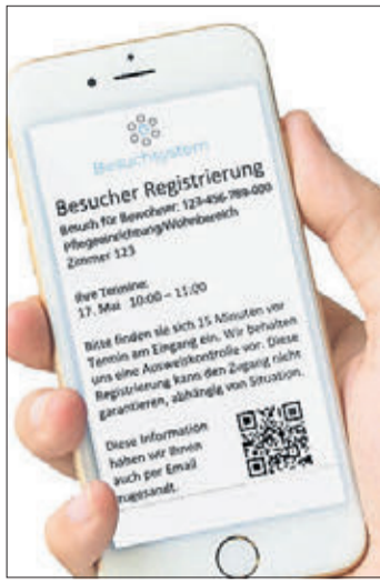
Noch schneller zum Wunschtermin: Ab 14. September können Bewohner-Besuche über das neue Buchungssystem registriert werden.

REGION (BWB). Bewohner von Pflegeeinrichtungen waren und sind in besonderem Maße von der Corona-Krise betroffen. Die Schutzmaßnahmen haben den Alltag der Bewohner nachhaltig verändert, und ein Ende ist vorerst nicht in Sicht.