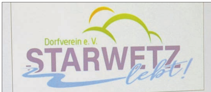
Das Logo des neuen Dorfvereins.

keit abgestimmt wurde. Die Förderung von Kunst und Kultur ist der maßgebliche Satzungszweck des neuen Dorfvereins.