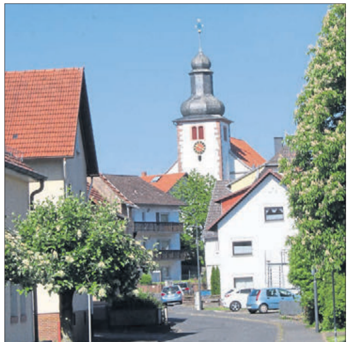
Ein Blick in den alten Sterbfritzer Ortskern mit der Kirche.

WALLROTH (BWB). Der Ortsbeirat Wallroth lädt die Bürger zu einem Pflegetermin für den Friedhof ein. Unter Einhaltung der allgemeinen Corona-Schutzregeln wird am Donnerstag, 10. September, von 17 bis 20 Uhr unter anderem Unkraut und Moos von den Gehwegen und vom Parkplatz entfernt sowie teilweise die Hecke geschnitten. Es wird gebeten, Schubkarren und Gartengeräte mitzubringen. Für einen Feierabendimbiss wird gesorgt.