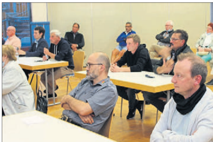
Einige Teilnehmer der Gründungsversammlung in der Mehrzweckhalle.