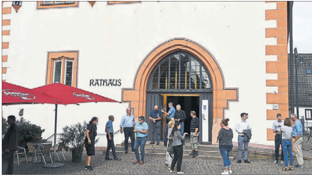
Der Wahlausschuss tagte in der Markthalle des Rathauses. Zur öffentlichen Sitzung waren etliche Zuhörer gekommen.