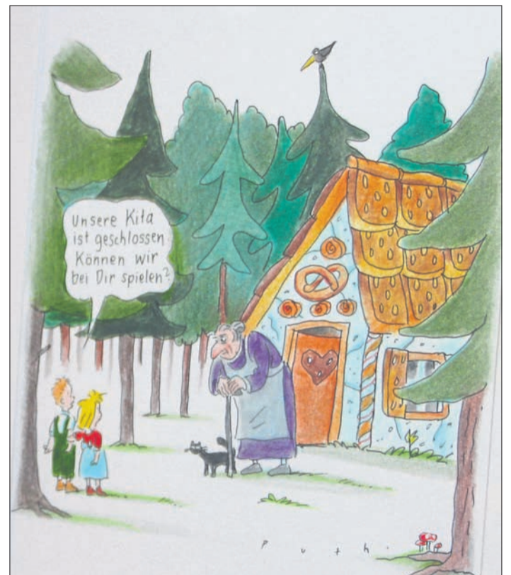
Die Corona-Comics sind ein Hingucker.

Die Ausstellung ist im Steinauer Brüder-Grimm-Haus bis zum 11. Oktober täglich zwischen 10 und 17 Uhr zu sehen.