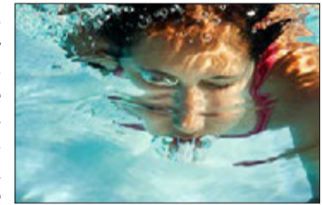
Einen Schwimmkurs für Erwachsene bietet die Spessart Therme an.

Kosten betragen 159 Euro. Anmeldung telefonisch unter (06056) 744198 oder online unter: shop.spessart-therme.de .