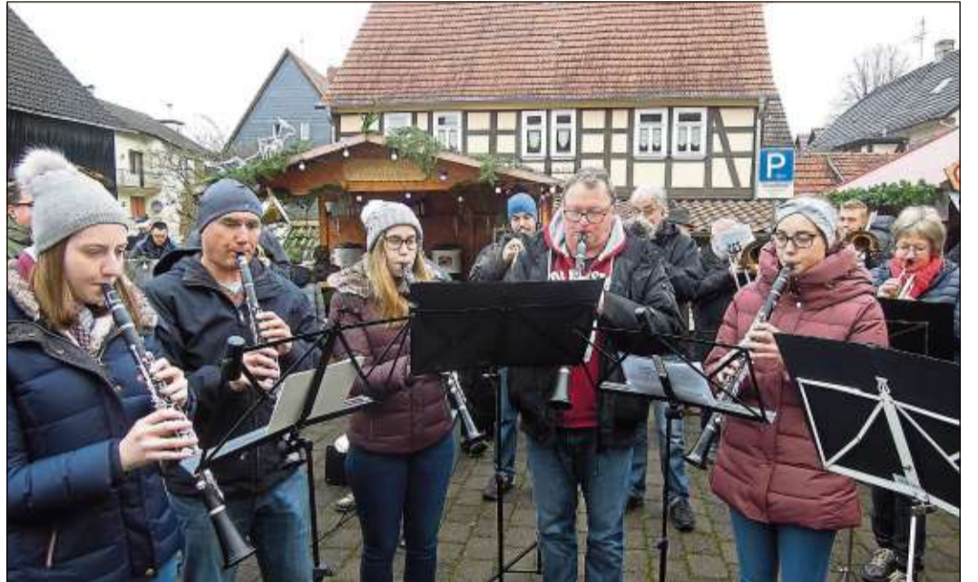
Der Musikverein Salmünster eröffnete den Adventsmarkt mit weihnachtlichen Melodien.