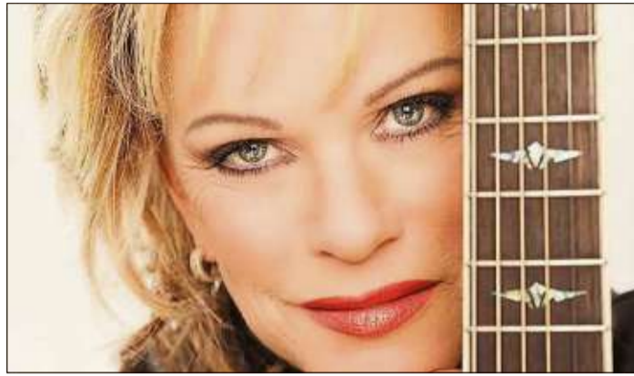
Powerfrau, Kultfigur, sexy Rocklady – Lisa Fitz haften viele Etiketten an.

Zum Inhalt: Den Flüsterwitz erzählt man hinter vorgehaltener Hand. Er könnte Menschen in Hörweite beleidigen, sensible Damenohren kränken oder so wahr sein, dass er Machthabern gefährlich wird. Eigentlich ist der Flüsterwitz ein politischer Witz. Wenn man mit einem autoritären System haderte oder Repres-