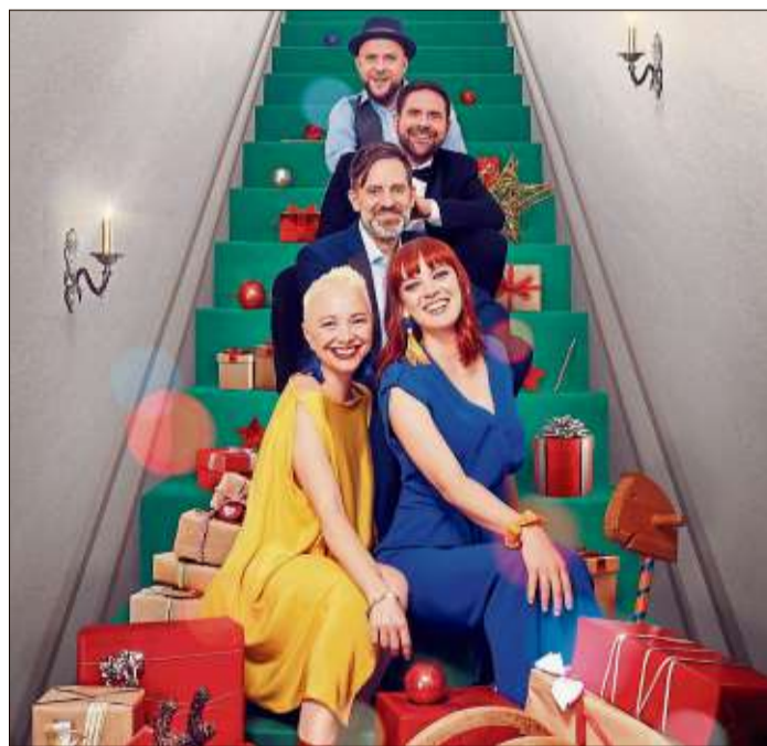
„So this is Christmas“ heißt es am 19. Dezember mit ONAIR in der Katharinenkirche in Steinau.