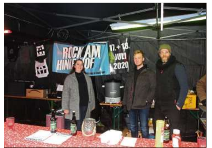
Die Macher von „Rock am Hinkelhof“ hatten sich um die Musiker gekümmert.