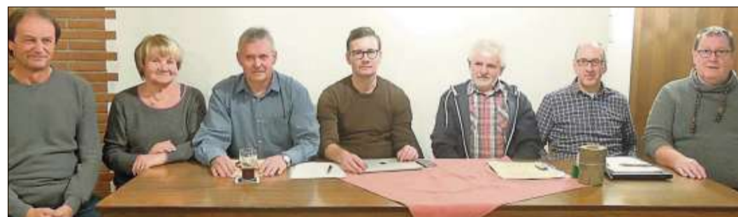
Der neu gewählte Vorstand der Sportgemeinschaft Ahl.

Die Pfadfinder möchten alle Menschen willkommen heißen, das Licht am Sonntag, 15. Dezember, entweder um 17.30 Uhr