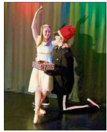
In der Nacht, als Clara nach ihrem Nussknacker sehen will, wird er lebendig.

ginnlänge, jeweils am Samstag- und Sonntagnachmittag. Eine Jubiläumsvorstellung am Samstagabend mit Jubiläumsrede, Sekt und Kanapees vom Silentium, und für die ganz kleinen Zuschauer gibt es am Sonntag um 11 Uhr eine Matinee, eine 60-minütige Kindervorstellung mit Erzähler (Herbert Schirmer) und Bühnens-Tafelau für Kinder im Alter von 2 bis 9 Jahren. Das Ballettsaal-Team lädt alle ein mitzufeiern und in Weihnachtsstimmung zu kommen. Die Vorstellungen finden in der Stadthalle statt.