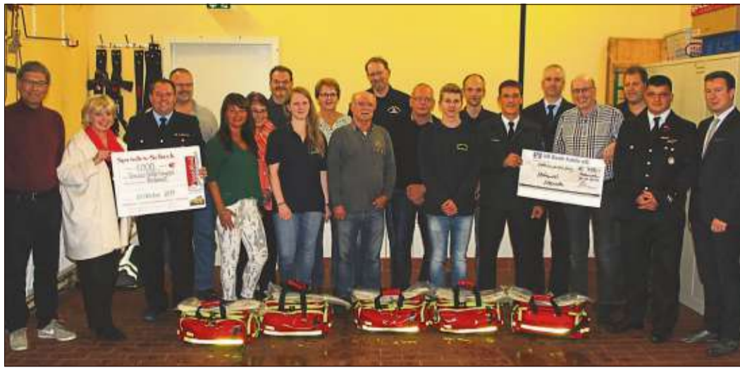
Die neu gegründete Voraushelfer-Gruppe der Feuerwehren Niederzell und Hohenzell zusammen mit den Verantwortlichen und den Sponsoren.

18 Personen aus Niederzell und Hohenzell haben sich bereiter-