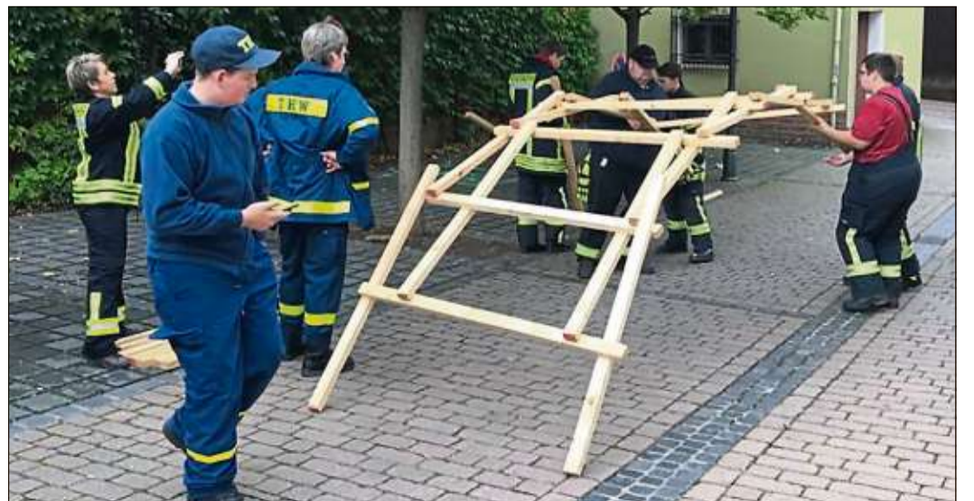
Nur mit Holzstäben musste eine „Leonardo-Brücke“ zusammengebaut werden.

Bei den Bambini ging die Jugendfeuerwehr Steinau I mit 57,6 Punkten in Führung. Es folgten die Jugendfeuerwehr Hintersteinau mit 53,5 Punkten und die Jugendfeuerwehren Steinau II und die Jugendfeuerwehr Sterbfritz mit jeweils 51,25 Punkten.