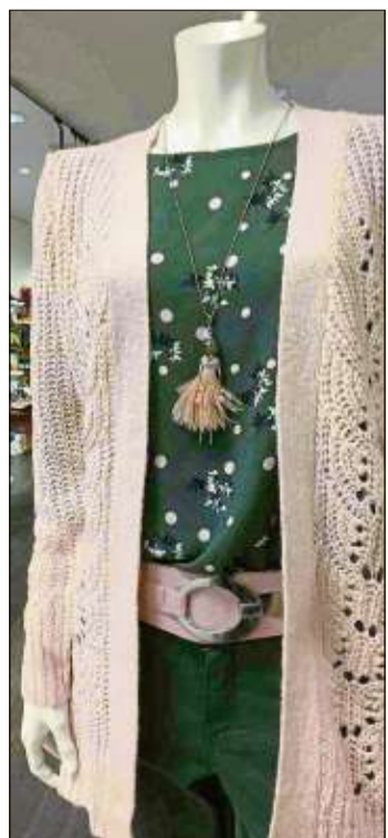
Moderne Outfits für jeden Geschmack findet die Kundin bei Rech – bei dem tollen Angebot fällt die Auswahl manchmal schwer.

und As98 gibt's 20 Prozent Rabatt sowie auf camel Active Schuhe auch für Männer – es kommt also niemand zu kurz.