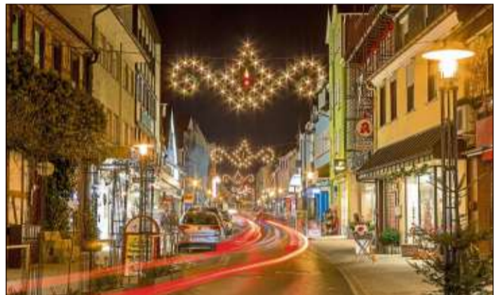
Im festlichen Glanz präsentiert sich die Stadt Schlüchtern in der Vorweihnachtszeit.

der Hauptstadt des Weltreiches“. An dem Abend gibt es Gulaschsuppe und einen Ausblick auf das Jahresprogramm 2020. Die Europa Union firmiert nunmehr unter dem Namen „Europa Union Main-Kinzig“ und wird damit seinem Wirkungs- und Mitgliederkreis im Beinamen gerecht.