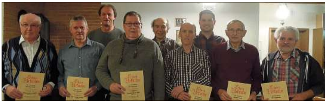
Zahlreiche Mitglieder wurden für 25 Jahre und 50 Jahre Vereinstreue geehrt.