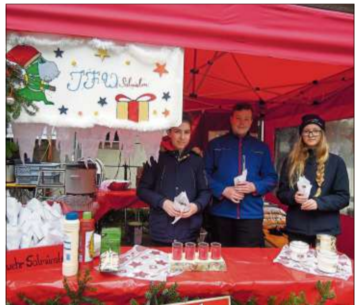
Die Jugendfeuerwehr bot Deftiges und Süßes an.

Der Nikolaus war auf dem Markt unterwegs und beschenkte die Kinder. Stadtführerin Doris Mü-