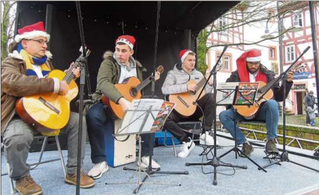
Schüler der Musikschule „Viva musica“ musizierten auf der Außenbühne.