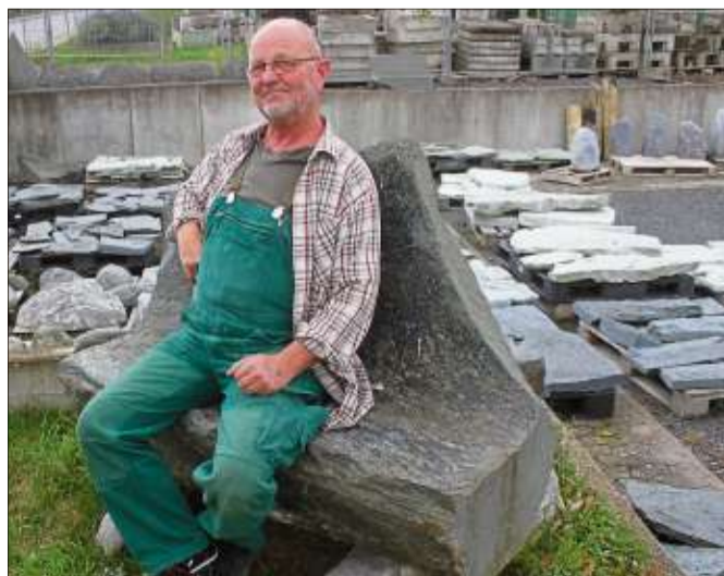
Eine naturgeformte Bank aus Serpentin mit Füßen aus Tessiner Granit.