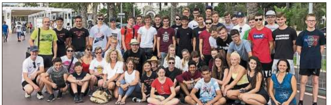
Eine ereignisreiche Woche verbrachten die Abschlusschüler der Altengronauer Hans-Elm-Schule und der Stadtschule Schlüchtern bei sommerlichen Temperaturen in Nizza.

Sowohl für die Schüler als auch für die Lehrkräfte steht fest, dass dieses Gemeinschaftsprojekt glücklich ist und fortgeführt werden sollte.