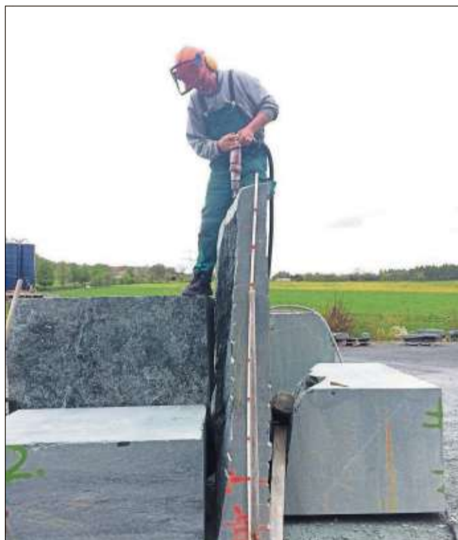
Die Bearbeitung der Unikate ist reine Knochenarbeit.