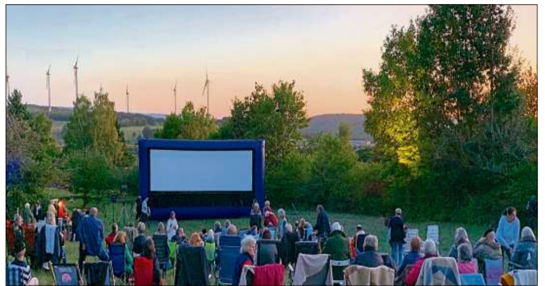
Spätsommerblick über Breitenbach. Die Zuschauer nehmen die Wiese in Beschlag.