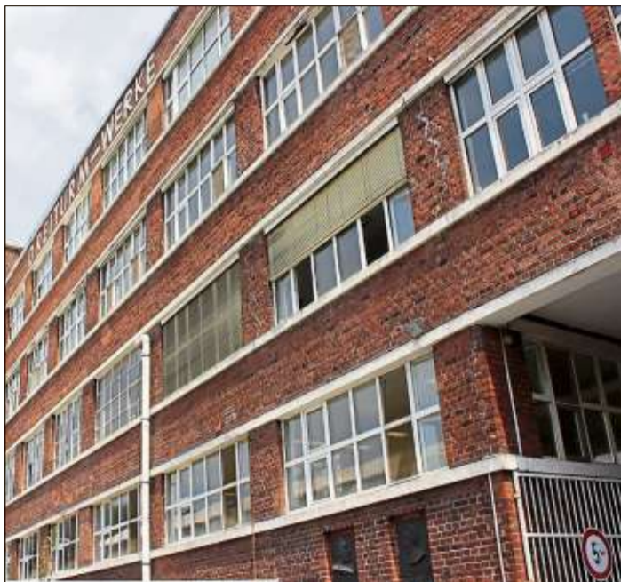
Die denkmalgeschützte Fassade der Dreiturm-Werke in Steinau. Hier wird bereits am 7. September der Tag des offenen Denkmals eröffnet.

Die gut erhaltene denkmalgeschützte Fassade ist damit ein geeignetes Beispiel für Umbrüche, wie sie für die erste Hälfte