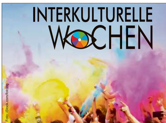
Insgesamt 58 Veranstaltungen bieten die Interkulturellen Wochen im Main-Kinzig-Kreis.

Vernissage zu einer ausgesuchten Biografie-Ausstellung in den Räumen der Interkulturellen Frauentreffs Gelnhausen statt. Frauen aus verschiedenen Herkunftsländern stellen sich hier mit ihrer persönlichen Geschichte, ihren Zielen und Träumen vor. Im Anschluss lädt der Interkulturelle Frauentreff – wie an jedem weiteren Montag im September – zu Austausch und Gesprächen bei internationalen Köstlichkeiten ein, jeweils von 15 bis 17 Uhr. Am gleichen Tag um 18 Uhr wird auch im Familienzentrum Nidderau eine Fotoschau mit Kurzbiografien und Ausschnitten aus dem interkulturellen Leben im Ort eröffnet. Diese Ausstellung ist bis zum 23. September zu sehen.