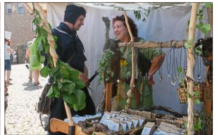
Das Kräuterweib bot seine Waren feil.