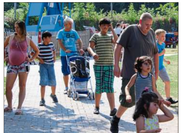
Jung und Alt bevölkerten den Steinauer Erlebnispark.