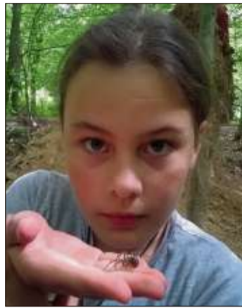
Große Forscherinnen haben keinen Angst vor Spinnen.

Auf Abenteuer, Entdeckungs- und Forschungsreise können Kinder während des diesjährigen Herbstferienprogramms der Schloss-Akademie Steinau gehen. Das „Spürnasen-Ferienabenteuer“ findet in der Zeit vom 30. September bis 4. Oktober (auch am Feiertag gehen wir raus) und dann noch einmal vom 7. bis 11. Oktober immer von 9 bis 12.30 Uhr für Kinder im Alter von 6 bis 12 Jahren im Wald bei Steinau statt. Unter Anleitung des Diplom-Biologen und Wissenschaftspädagogen Uli Brenner erforscht das