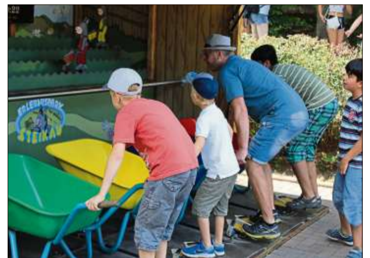
Spannend war das Schubkarrenrennen im Stand.