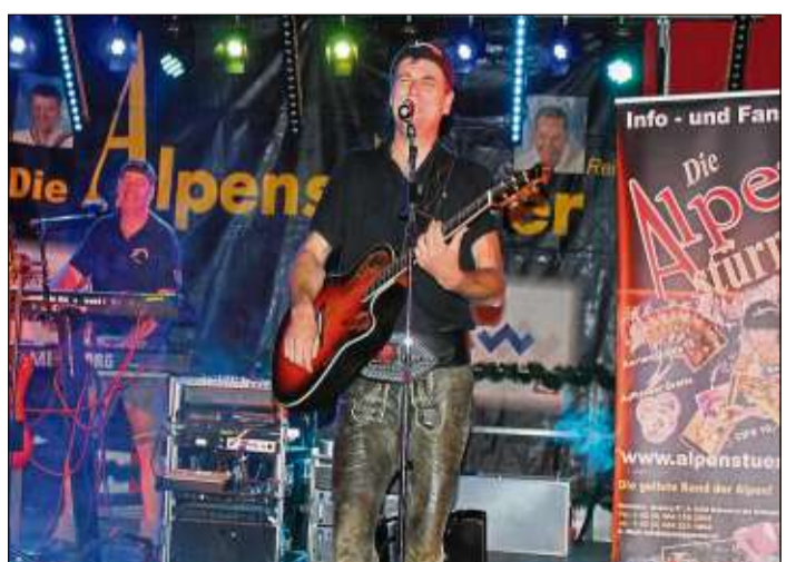
Sorgen für ordentlich Wiesn-Gaudi und Partystimmung im Festzelt: das Duo „Alpenstürmer“ aus Tirol.

Weitere Informationen gibt es auch auf der Homepage der Stadtkapelle unter: www.stadtkapelle-schluechtern.de