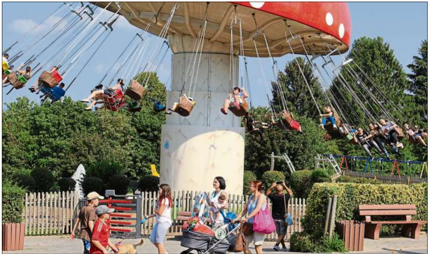
Begehrt wie eh und je ist das Pilz-Kettenfliegerkarussell.