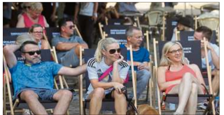
Entspannte Stimmung herrschte auf dem Stadtplatz vor dem Rathaus.