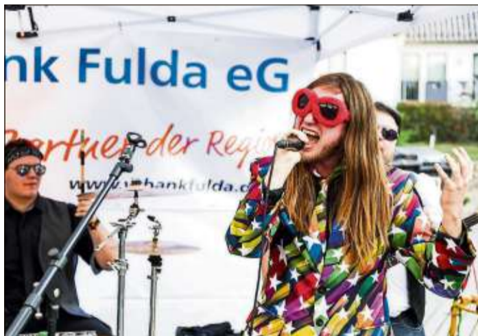
Freche Sprüche, lustige Lieder, schräges Outfit: die „Steckbeckenzecken“ aus Leverkusen.

Bereits vor zwei Jahren war die fetzige Frauenrockband „Tante Käthe and the Husband Shakers“ beim Straßenmusikfestival dabei. „Hier ist alles super orga-