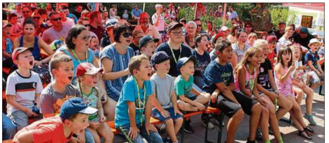
Hochbetrieb und gute Laune herrschten bei den Auftritten des Kindertheaters „Hops & Hopsi“.

STEINAU (ST). Jubiläum in Steinau: Der Erlebnispark feierte sein 25-jähriges Jubiläum. Bei bestem Sommerwetter strömte eine große Menschenmenge in den Freizeitpark. Groß und Klein waren von den vielen Attraktionen begeistert. Zu Gast war auch Hit Radio FFH.