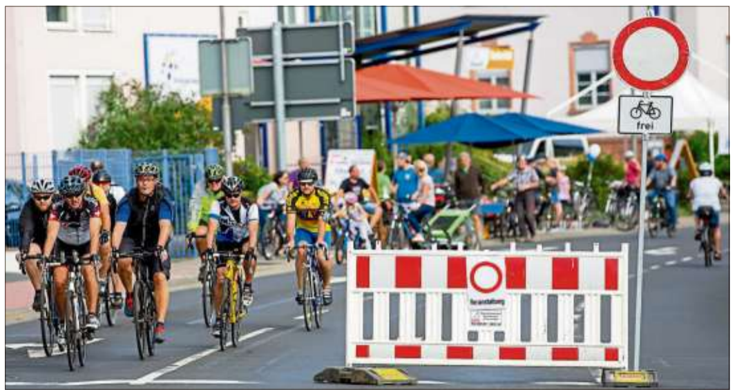
Am 8. September gehören die Straßen zwischen Sinntal und Hanau wieder den Radfahrern.