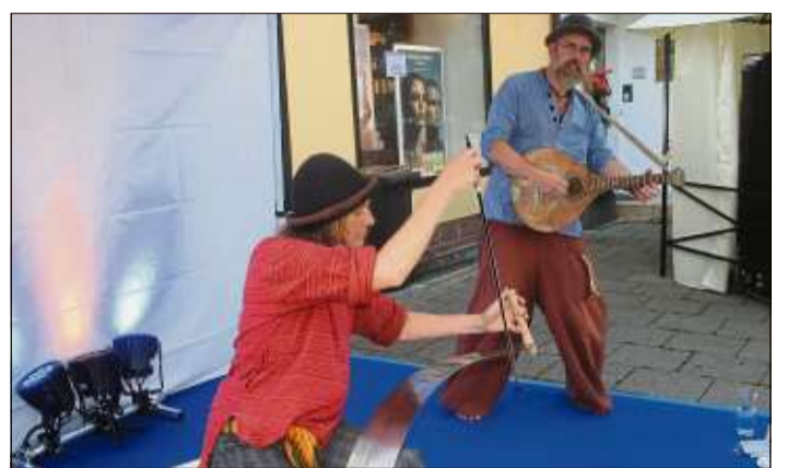
Das Folk-Duo Lauscher mit der singenden Säge.