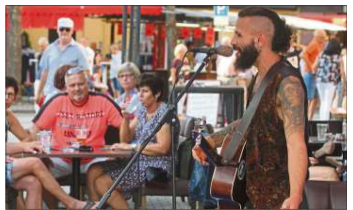
Psychedelischer Sound mit Groove: Santana.

Kurzfristig hatte Del_F64.0 abgesagt und fand im Mädels-Trio Weitblick einen ansprechenden Vertreter.