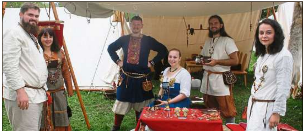
Nette Gespräche an den Marktständen.

STEINAU (CS). Jubel-Rufe brandeten beim historischen Umzug durch die Steinauer Gassen. Bereits zum zehnten Mal begab sich die Trimbunger Ritterschaft mit mehr als 600 Teilnehmern auf eine Zeitreise ins Mittelalter. Zauberei, Jonglage, Feuershow, Schwertkämpfe, Tavernenspiel, „allerley Zauberei“ und Sauflieder zogen Tausende am Kumpen und im Schlossgraben in ihren Bann.