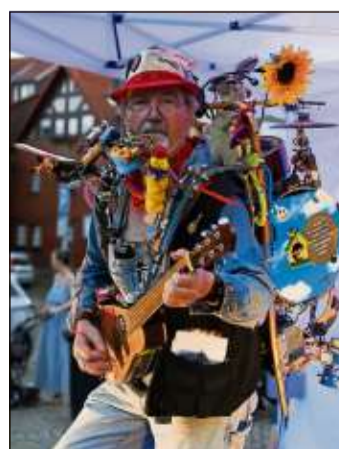
Defuxdeiwelswilde in Aktion.