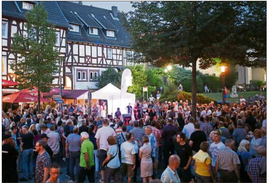
Besucherrekord beim Straßenmusikfestival: Tausende Menschen waren an diesem Abend unterwegs.