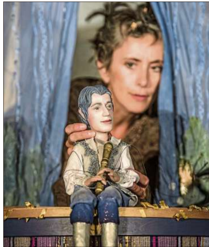
Beim Dinnertheater wird zum krönenden Abschluss der 27. Steinauer Puppenspieltage das Stück „Die Zauberflöte“ aufgeführt.

Das Theater Con Cuore präsentiert das Stück „Schweinchen Wilbur und seine Freunde“. Und gespannt sein dürfen alle Kinder auf die Pyromantiker und ihre Inszenierung „Stühlchen Himmelblau“.