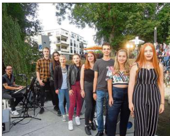
Acht junge Nachwuchskünstler begeisterten ihr Publikum an der Salz.