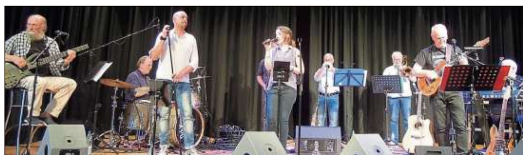
Rock und Gebläse mit „Groovin“ im Spessart Forum.

Am Dienstagabend hieß es „Shake meets die MusikLounge“ in der Arena in der Salz. Die Gäste erlebten einen besonderen Open-Air-Mix, ehe das Südhessische Kammerorchester am Mittwoch die diesjährigen Wasserspiele mit seinem Klassik-Konzert beendete.