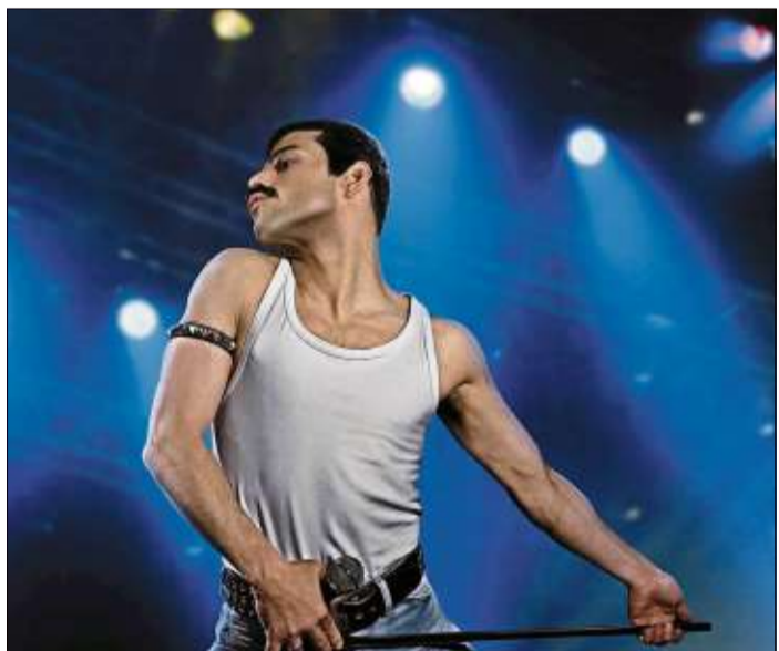
Der Film „Bohemian Rhapsody“ feiert auf mitreißender Art die Rockband Queen, ihre Musik und ihren außergewöhnlichen Leadsänger Freddie Mercury.

krankt ist, gelingt es ihm, seine Bandmitglieder noch einmal zusammenzutrommeln und beim Live Aid einen der legendärsten Auftritte der Musikgeschichte hinzulegen. Queen zementiert damit das Vermächtnis einer Band, die bis heute Außenseiter, Träumer und Musikliebhaber gleichermaßen inspiriert.