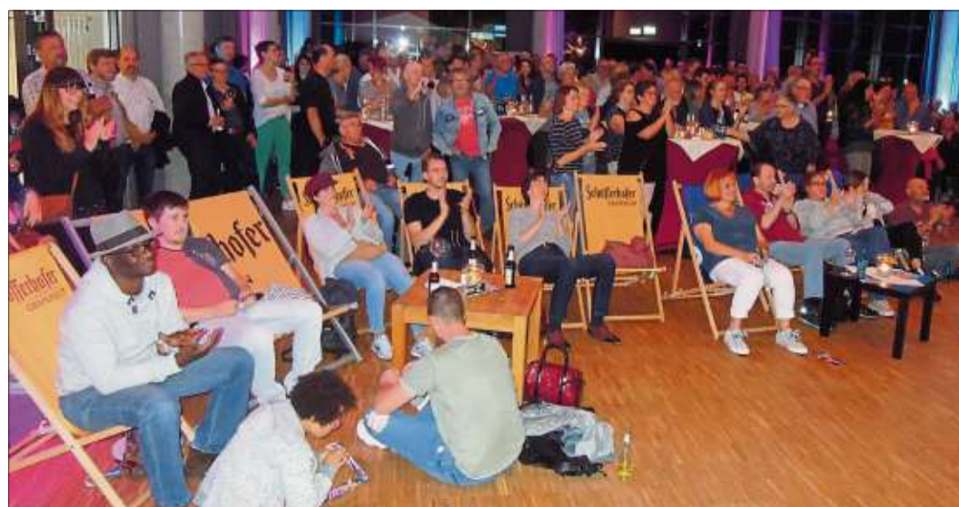
Liegestühle sorgten für Urlaubsgefühle im Spessart Forum.