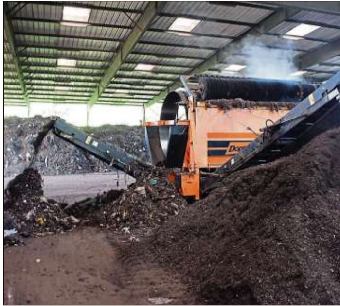
Vor der abschließenden Verwendung müssen die Störstoffe aus dem Bioabfall entfernt werden.

REGION (BWB). Mit der getrennten Sammlung unter anderem von Bioabfällen wird die Müllmenge insgesamt reduziert und wertvolle Rohstoffe werden in kurzer Zeit wieder nutzbar gemacht. Damit der Bioabfall, der einen erheblichen Anteil an der Gesamtmenge des Abfalls darstellt, sinnvoll genutzt wird, wurde im Main-Kinzig-Kreis bereits 1992 die Biotonne eingeführt.