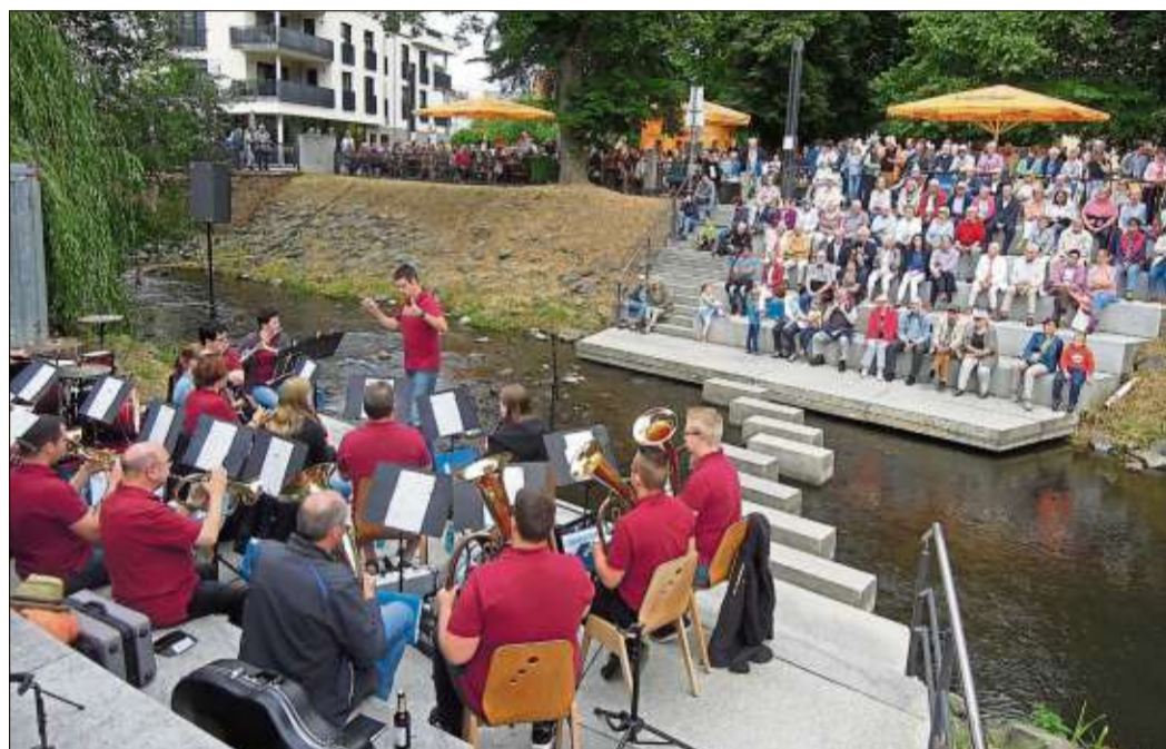
Blasmusik am Wasser: Der Musikverein Salmünster spielte in der Salzarena auf.

an. Natürlich durfte Musik der Gruppe „Santiano“ nicht fehlen, denn schließlich war man an den Wassern der Salz „Frei wie der Wind.“ Das Team des Kurbetriebs bewirtete die Gäste und sorgte für einen reibungslosen Ablauf der im Vorfeld sicherheitshalber an beiden Standorten geplanten Veranstaltungen „Wasserspiele“ an der Salzarena oder alternativ im Forum – eine beliebte Musikveranstaltung in der Kurstadt.