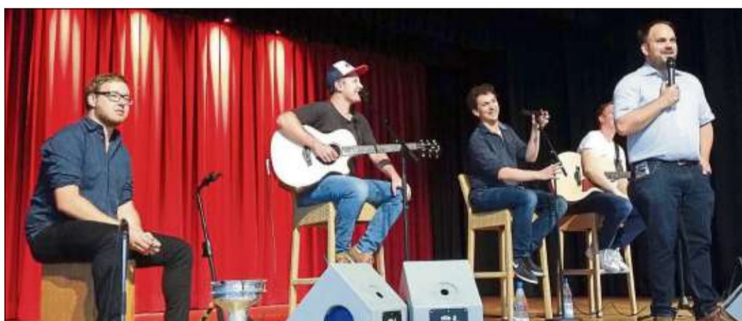
Die Band „Shake“ sorgte für einen gelungenen Auftakt der „Wasserspiele“.