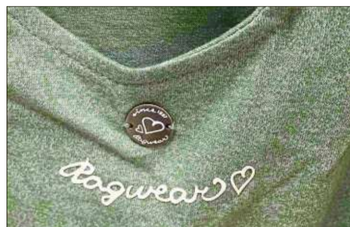
Erstmals zeigt Rech vegane Mode von Ragwear.