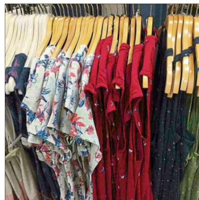
Der Sommer wird bunt.