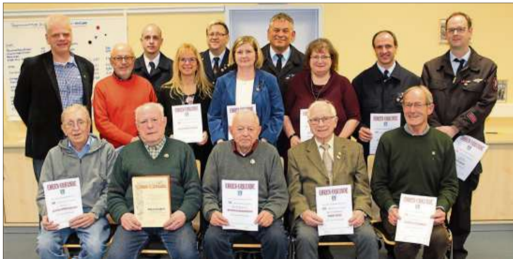
Einen Ehrungs-marathon gab es in der Jahreshauptversammlung der Feuerwehr Steinau Innenstadt. Eine Vielzahl langjähriger Vereinsmitglieder wurde geehrt.