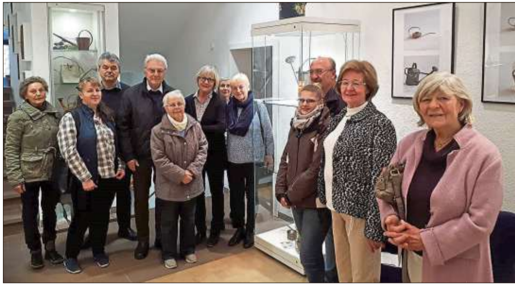
Zur Ausstellungseröffnung kamen interessierte Gäste ins Bergwinkel-Museum.

SCHLÜCHTERN (NO). Fast jeder hat eine zu Hause, um dürstende Pflanzen auf dem Fensterbrett oder im eigenen Garten zu wässern: eine Gießkanne. Das Bergwinkel-Museum widmet ihr jetzt eine eigene Sonderausstellung, die vor Kurzem mit einem kleinen Sektempfang für geladene Gäste eröffnet worden ist.