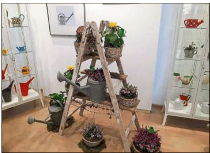
Blumen und Gießkannen – das gehört untrennbar zusammen.

so der Rathauschef, der laut eigenem Bekunden zunächst etwas