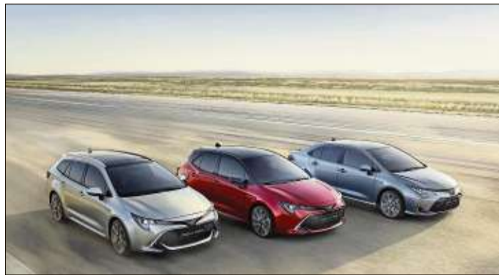
Hybrid by Toyota ist die intelligente Kombination aus Benzin- und Elektromotor.