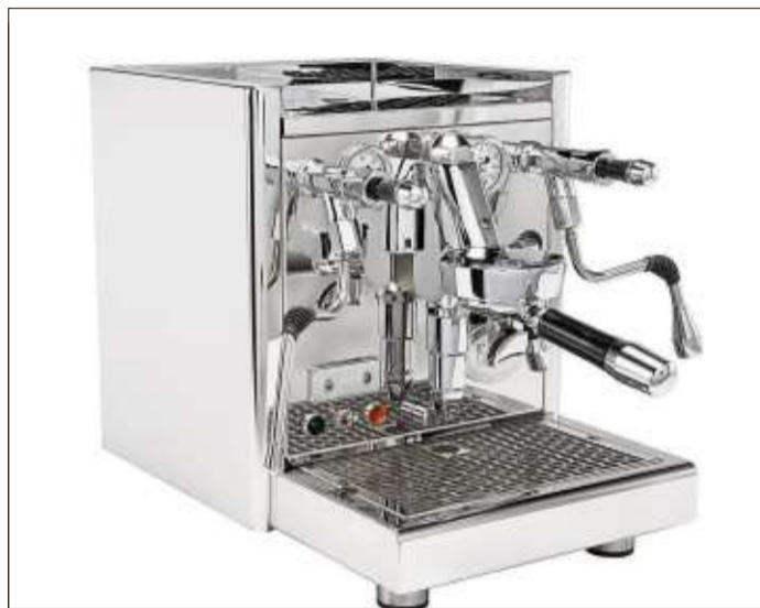
Die ECM Technika V Profi PID wirkt mit dem hochwertig verarbeiteten Gehäuse mit abgerundeten Kanten besonders elegant.

Als eine Weltneuheit stellt das Brühwerk am Helle Markt die ECM Technika V Profi PID vor. Sie ist das Nachfolgemodell der legendären ECM Technika IV Profi. Das neue Flaggschiff der ECM Zweitkreis-Espressomaschinen wartet mit einigen Neuerungen auf. So ermöglicht die integrierte