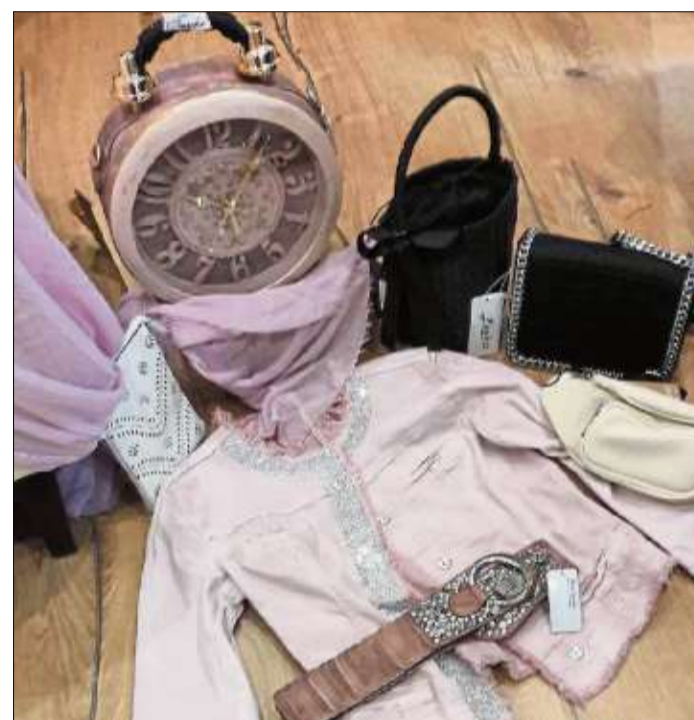
Ausgefallene italienische Mode und die passenden Accessoires. Im Hintergrund eine Uhr als Handtasche – und das Besondere daran: Die Uhr funktioniert.