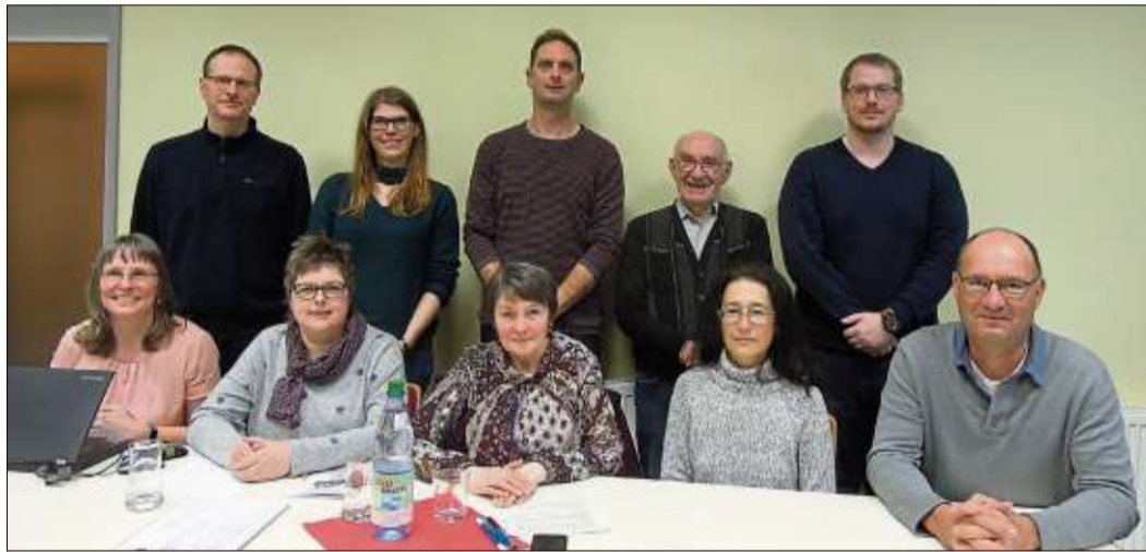
Der neu gewählte Vorstand des Musikvereins Germania Steinau.