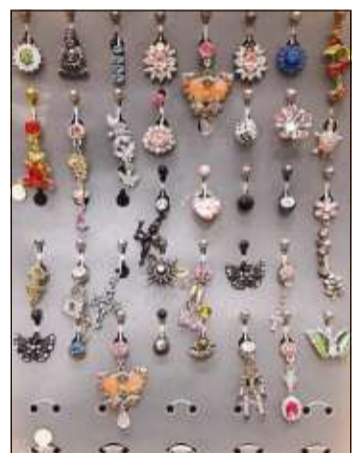
Piercing-Schmuck in großer Auswahl und für jeden Geschmack finden die Kundinnen und Kunden im Bodystudio Ilona.

Piercings werden selbstverständlich auch heute noch gestochen. Höchste Hygienemaßstäbe sind dabei selbstverständlich.