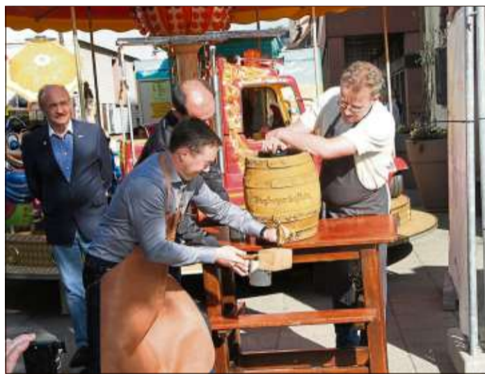
Tolles Wetter gab es letztes Jahr zur Eröffnung des Helle Marktes.