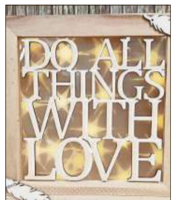
Leuchtrahmen mit Spruch werden am 13. Februar gefertigt.

In den Abendkursen kann jedermann spielend leicht kreativ werden und sein persönlich kreiertes Werk gleich mit nach Hause nehmen. Die nächsten Kurse sind am 5. Februar: Engel aus Papierdraht; am 13. Februar: Leuchtrahmen mit Spruch und am 14. Februar: Rustikale Holzdeko. Fotos und nähere Infos zu allen Themen unter www.kreativwelt.eu .