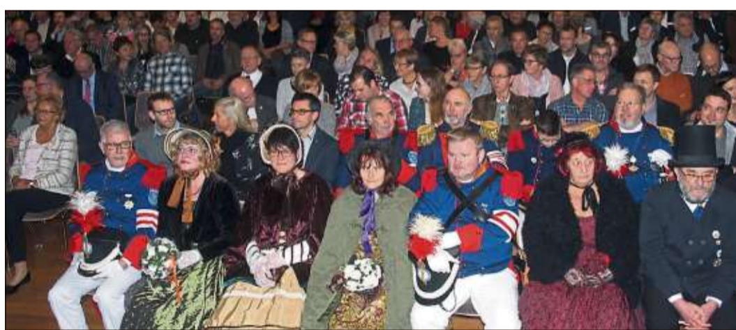
Bürgergarde und Biedermeiergruppe standen vor der Stadthalle Spalier, ehe sie zum Jahresempfang Platz nahmen.

In Schlüchtern passiere derzeit unglaublich viel. Rund 10,3 Millionen Euro würden in die Entwicklung des Langer-Areals, die Baugebiete in der Kernstadt und Wallroth, die Sanierung des Freibades und die Dorferneuerung und Wirtschaftsförderung in diesem Jahr investiert. Erstmals seit langer Zeit sei es mit Hilfe der Hessenkasse und geschicktem Verhandeln gelungen, alle Kassenkredite abzubauen. Und dies ohne die Grundsteuer A und B und die Gewerbesteuer zu erhöhen. Der Bürgermeister teilte mit, dass die Entwicklung und der Ankauf des Langer-Geländes mit fünf Millionen Euro gefördert werde. „Es war die einzig richtige Entscheidung, das Areal zu erwerben und es unter dem Arbeitstitel Leben, Wohnen, Arbeiten selbst zu entwickeln. Wir alle waren mutig genug, diesen Schritt zu gehen.“ Möller berichtete, dass am Samstag, 13. April, im Erdgeschoss des ehemaligen Kaufhauses umfassende über alle anstehenden Projekte informiert werde. „Unsere Stadt muss als Marke weiterentwickelt werden. Ansiedlung von Wirtschaft und jungen Familien