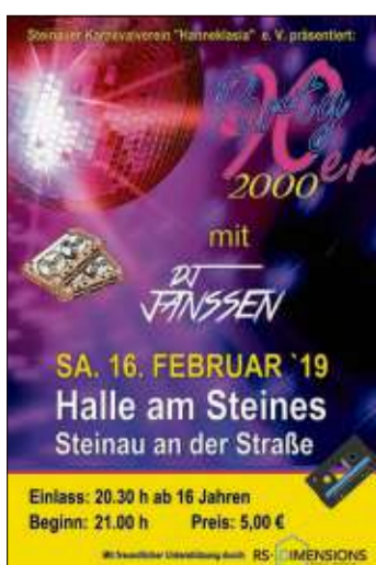
Zum ersten Mal lädt der SKV zu einer 90er & 2000er-Party ein.

Beilagen- und Redaktionsschluss Montag 10 Uhr Anzeigenschluss Dienstag 12 Uhr