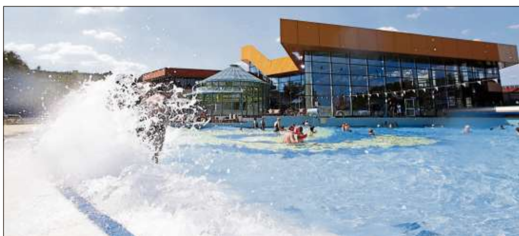
Unter dem Dach der Spessart Therme verbirgt sich ein einzigartiges Gesundheitsangebot – und im Außenbereich sorgt ein Wellenbad für Abwechslung und Erfrischung.

Der Gang in die icelab-Kältekammer ist bewährt in der Rheuma- und Schmerztherapie, zur Regeneration und Leistungssteigerung im Sport sowie bei Schlafproblemen. Angebot zu den Gesundheitstagen: statt 19 nur 15 Euro.