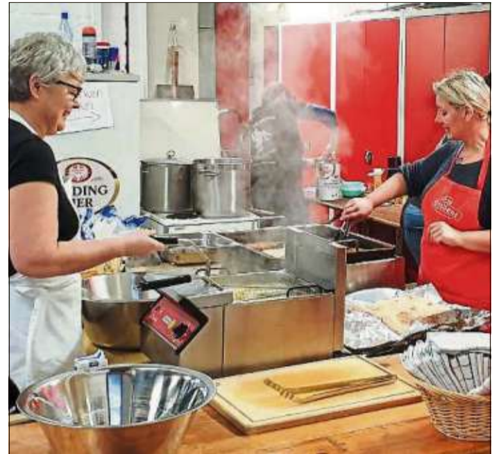
Für alle Helfer wurde ein leckeres Mittagessen zubereitet.