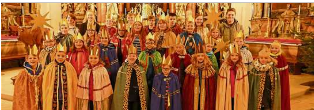
Mehr als 14000 Euro sammelten die Sternsinger für bedürftige Kinder in aller Welt.

stützt. Straßenkinder, Flüchtlingskinder, Aids-Waisen, Kindersoldaten, Mädchen und Jungen, die nicht zur Schule gehen können, denen Wasser und Nahrung fehlen, die in Kriegs- und Krisengebieten oder ohne ein festes Dach über dem Kopf aufwachsen – Kinder in mehr als 100 Ländern der Welt werden jedes Jahr in Projekten betreut, die mit Mitteln der Aktion unterstützt werden. Gemeinsam mit ihren Jugendlichen und erwachsenen Begleitern hatten sich die Sternsinger der Pfarrei St. Peter und Paul auf ihre Aufgabe vorbereitet. Sie kennen die Nöte und Probleme von Kindern und sorgen mit ihrem Engagement für die Linderung von Not in zahlreichen Projektorten.