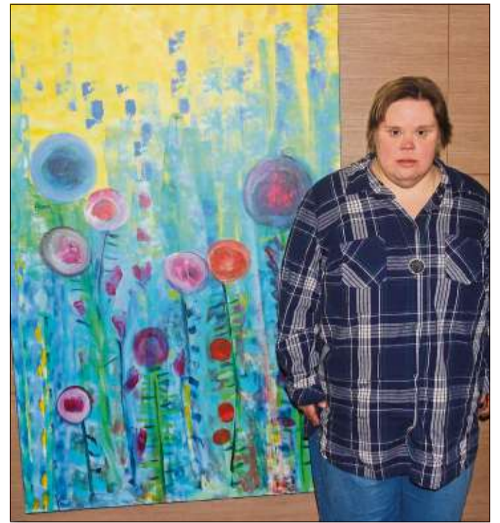
Denken und Fühlen in der Malerei ausdrücken: Dies gelingt der jungen Künstlerin vorzüglich.