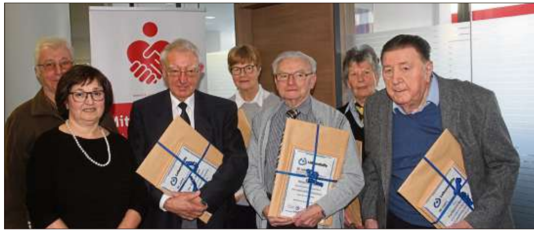
Mit einer Urkunde und Jahreskalender bedankte sich die Lebenshilfe bei ihren Gründern.