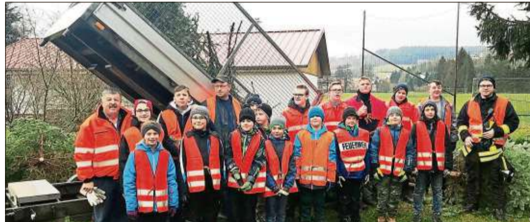
Wie überall im Stadtgebiet von Bad Soden-Salmünster waren auch in Mernes fleißige Helfer am Werk.