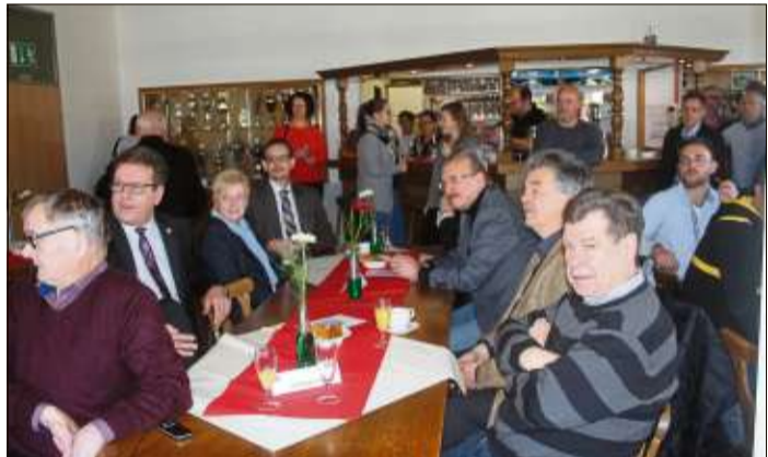
Prominente Gäste beim Neujahrsempfang der SG Schlüchtern.