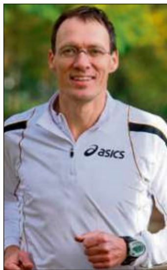
Langstreckenläufer Dieter Baumann spricht zur Eröffnung der Gesundheitstage.

Die Besucher können sich von den gesunden Rezeptkreationen der Netzwerkköche verführen lassen und Anregungen der Fachleu-