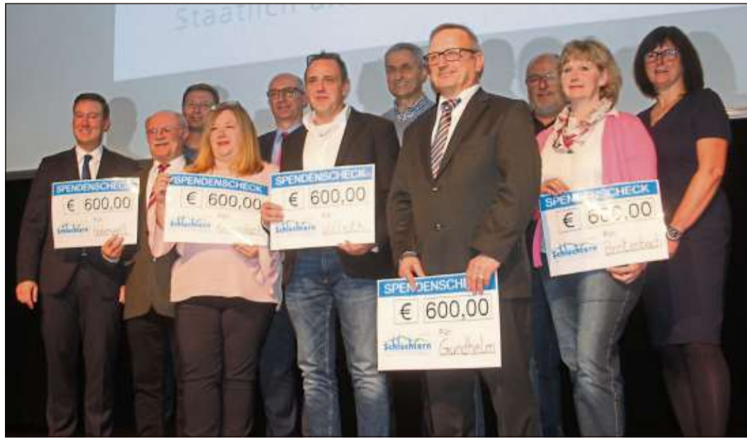
Die Macher der 850-Jahr-Feiern wurden stellvertretend für die große Zahl an Bürgern ausgezeichnet, die sich bei den Veranstaltungen engagierten. Sie erhielten jeweils einen symbolischen Scheck über 600 Euro.