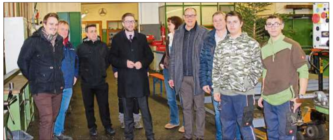
Landrat Thorsten Stolz (Bildmitte) beim Besuch im Jugendhilfzentrum Don Bosco in Sannerz.

Das Don-Bosco-Prinzip: „Damit das Leben junger Menschen gelingt“ wird dabei zu Grunde gelegt.