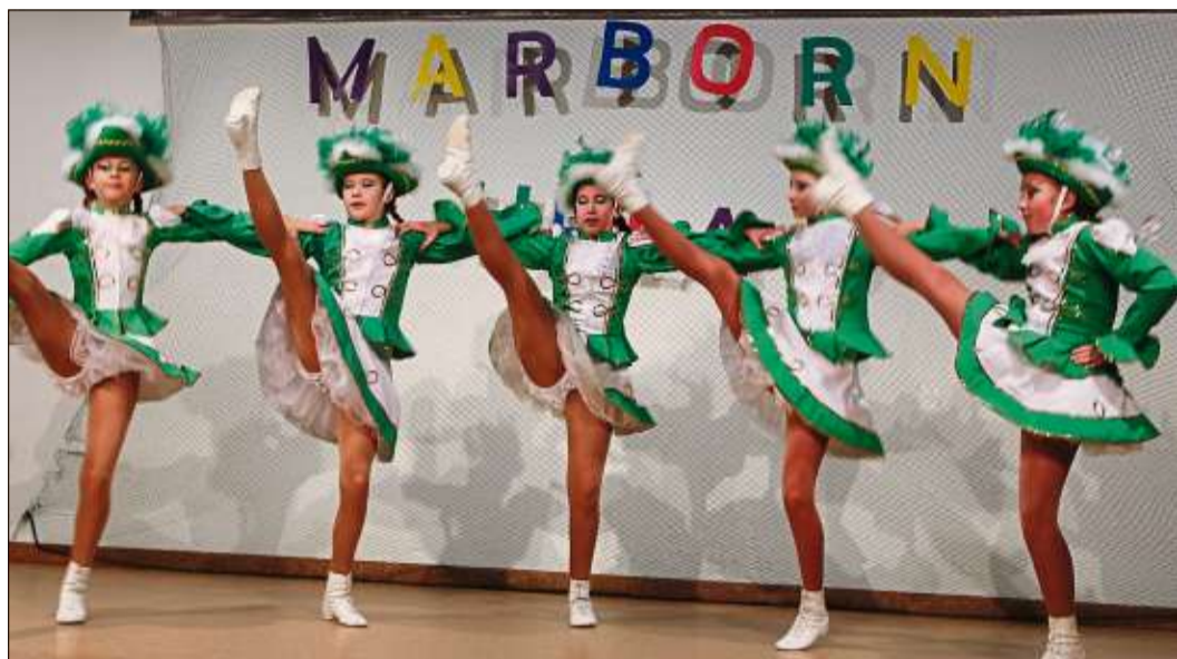
Die gastgebende Marborner „Grüne Garde“ eröffnete den Garde- und Showtanztage.