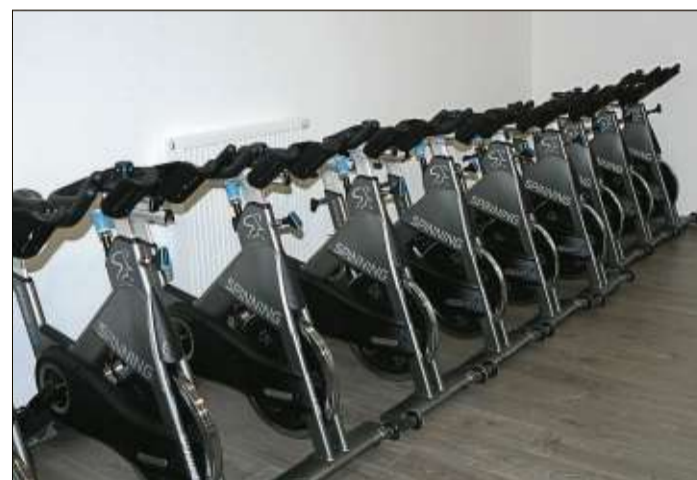
Mit Spaß und Dynamik die Fettreserven angreifen, ist mit einem Spinning-Kurs möglich. Ausreichend Geräte stehen im zweiten Kursraum bereit.

Das Frauenfitness-Studio „Formidabel“ bietet jede Menge Abwechslung. Neu sind nun zwei Infrarotkabinen, die Wärme durch Infrarotstrahler abgeben. Neben einem Gerätezirkel für die Kraft kann auch die Ausdauer trainiert werden. Laufbänder, Crosstrainer, Fahrräder und Rudergeräte stehen den Mitgliedern zur Verfügung. Kerstin Rittinger unterstreicht, dass sie und ihr Team großen Wert auf ein individuelles Sportprogramm legen und auf die persönlichen Wünsche und gesundheitlichen Problematiken der Mitglieder eingehen. Die neuen Räumlichkeiten bieten von nun an alle Möglichkeiten für ein zukunftsorientiertes und gesundes Training.