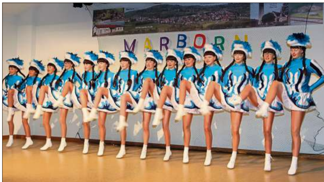
Einen zackigen Gardetanz präsentierte die „Funkelgarde“ aus Wallroth.