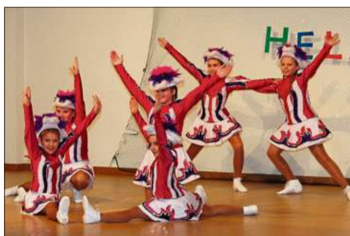
Die „Pinke Garde“ des Steinauer Karnevalvereins war am Samstag mit von der Partie.

Bei keiner närrischen Veranstaltung dürfen die Wallrother „Wellblooe“. Deren „Funkel-Garde“ überzeugte ebenso mit einem Gardetanz wie auch die „Schnoten-Schnucke“ mit dem Showtanz „Evolution of Dance“. Stark