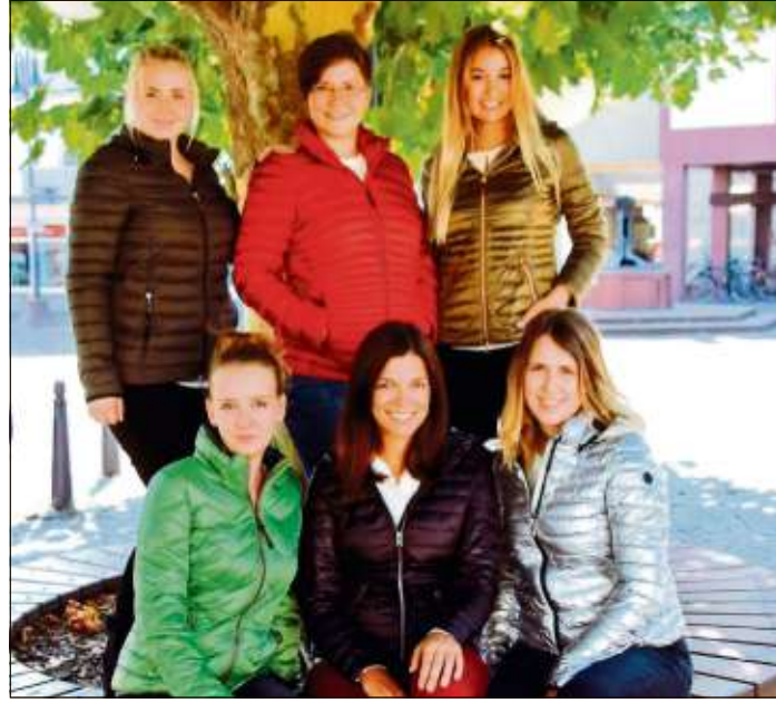
Winterjacken in vielen Farben und Varianten finden modebewusste Kunden bei Rech. Bis zum 24. Dezember gibt es 30 Prozent.