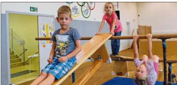
Die Kinder machen sich mit dem „Turnen am Barren“ vertraut und versuchen ihn in allerlei Variationen zu erklimmen und erklettern. Balancieren, rutschen, hängen, auch mal kopfüber, schwingen und sogar ein Felgabzug wird von einigen Kindern schon mal getunt.