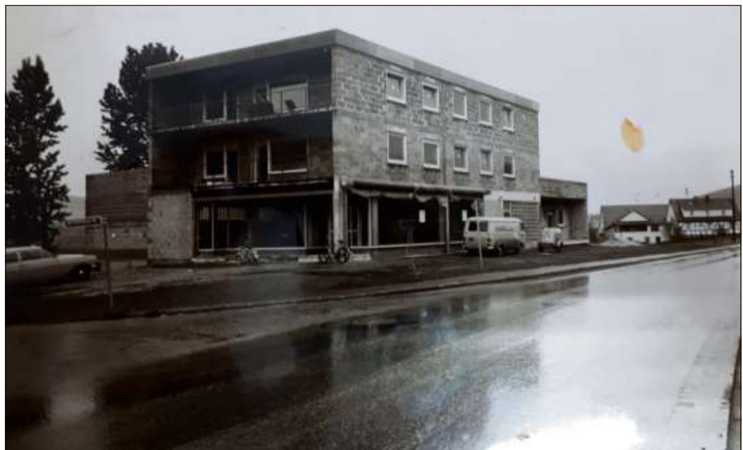
Der Umzug ins neue Geschäftshaus erfolgte im Jahre 1974.