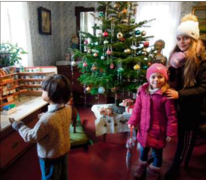
Die Kinder staunten über das altertümliche Weihnachtszimmer im Heimatmuseum.