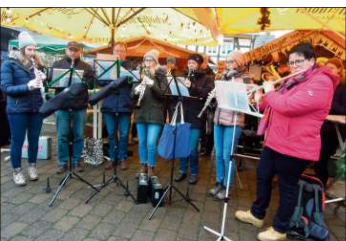
Der Musikverein Salmünster eröffnete den Adventsmarkt musikalisch.