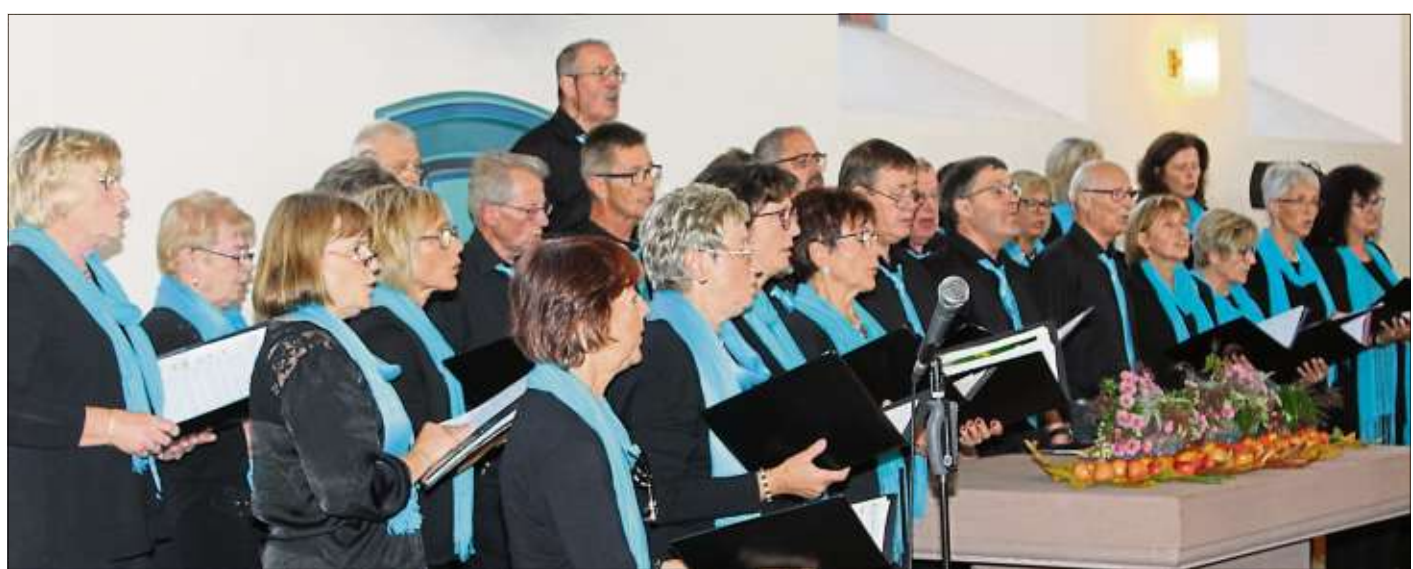
Der gemischte Chor der Chorgemeinschaft Ulmbach begeisterte mit modernen Hits.