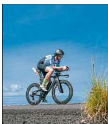
Kein Schatten auf dem Highway und dazu drückend heiß.

„Die Platzierung bei der Triathlon-Weltmeisterschaft war für mich weniger entscheidend. Es galt nur, ins Ziel zu kommen. Dafür habe ich ein ganzes Jahr lang hart gearbeitet“, berichtete der 34-Jährige und kündigte an: „Das war nicht mein letzter Ironman auf Hawaii.“