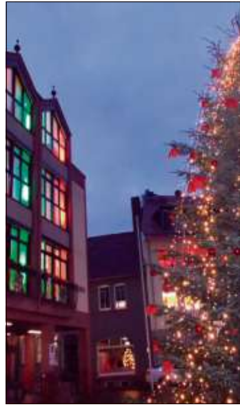
Schlüchtern leuchtet – besonders eindrucksvoll sichtbar auf dem Stadtplatz.

ge Highlights und Kostbarkeiten geboten. Auf der Adventbühne am Stadtplatz werden sich regionale Künstlerinnen und Künstler, ob Groß oder Klein, präsentieren. Von der Big Band Route 66, die auf ihrer „Swinging Christmas-Tour“ in Schlüchtern am Freitagabend Halt machen wird, bis zu beliebten und bekannten Straßenmusikern wie George St. George und Wild im Wald. Kitas werden sich zeigen sowie Chöre und Solisten, aber auch ein bekannter Märchenerzähler wird auftreten.