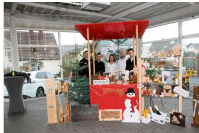
Die Mitarbeiter hatten gemeinsam die Idee für einen Adventsmarkt entwickelt.

Zunächst sei hier der „Intelligent Drive Assist“ zu nennen, den es in Kombination mit der neuen Achtgang-Automatik gebe. Er bestehe aus einer intelligenten Geschwindigkeitsregelanlage mit Verkehrsschilderkennung, einem Stauassistenten mit Stop-und-Go-Funktion sowie einem Fahrspur-Piloten. Das ausgestellte, brandneue Modell gebe es mit einem 1,5-Liter-Benzinmotor mit 150 PS und der neuen Euro 6d temp-Norm.