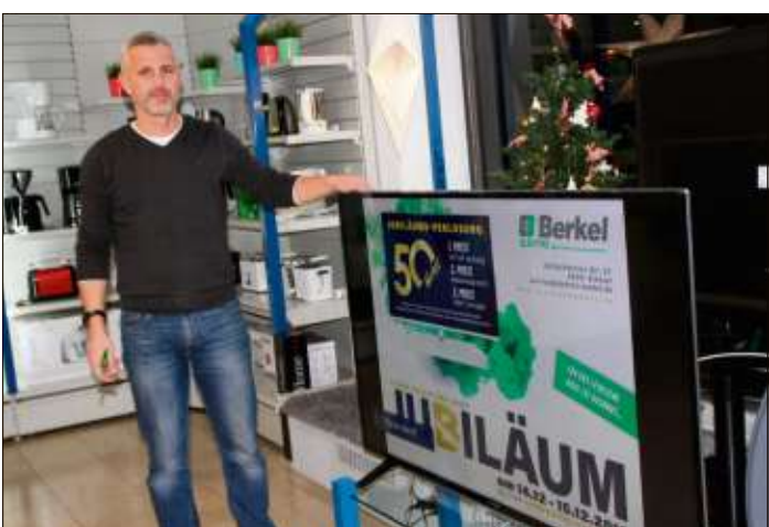
Tolle Preise gibt es bei der Jubiläumsverlosung wie ein LED TV 40 Zoll.