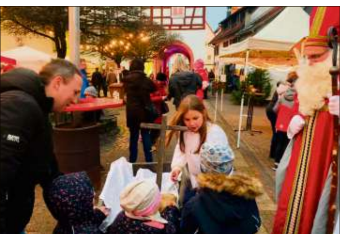
St. Nikolaus und ein Engel beschnitten die Kinder auf dem Adventsmarkt im idyllischen Schleifraschhof.