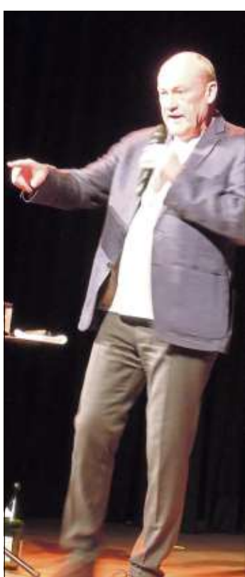
Bodo Bach unterhielt sein Publikum im Spessart Forum aufs Beste.

höre zum Ikea-Besuch der Verzehr eines Hotdogs: „Labberwurst in Schwammbrötsche, weil’s günstig is.“ Beim Zusammenbau des neuen Ikea-Küchenschrankes er-