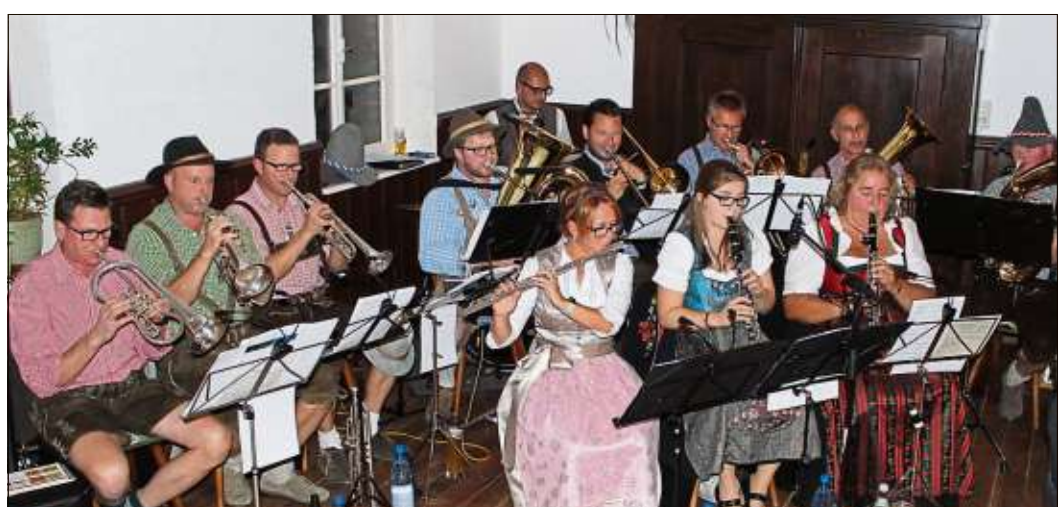
Die Elmbachtaler Musikanten gaben eine zünftige Wirtshausmusik.

Ein gut gelaunter Bodo Bach traf ein Publikum, das gekommen war, um sich zu amüsieren. „Ich kann bis heut’ net verstehe, dass Leut’ Geld ausgabe, um mich zu gucke“, sagte Bodo Bach an einer Stelle. Das Publikum wusste es aber genau, lachte Tränen und kam voll auf seine Kosten. Mit viel Applaus verabschiedeten die Zuschauer den hessischen Komiker, der „viel zu sagen, daheim aber nix zu melden“ hat.