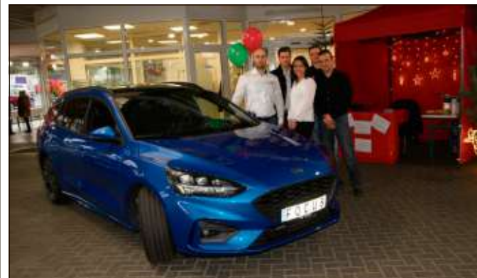
Eine Klasse für sich ist der neue Ford Focus.