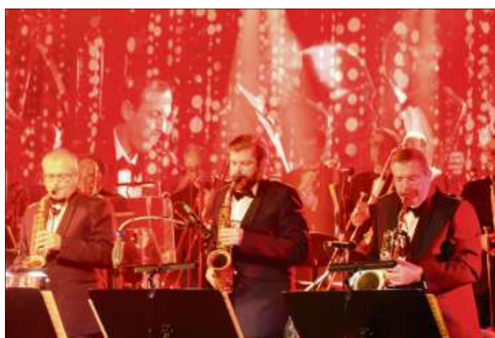
Swing war der Rahmen, Licht und Choreographie das I-Tüpfelchen einer perfekten Show.