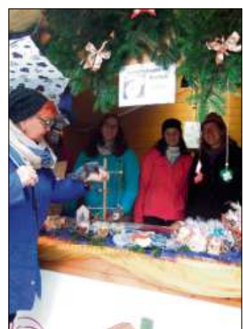
Hübsch dekoriert war der Stand des Sportkindergartens.