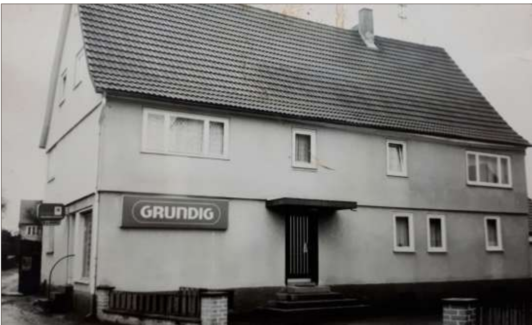
Die Anfänge der Firma Berkel im Jahre 1968.