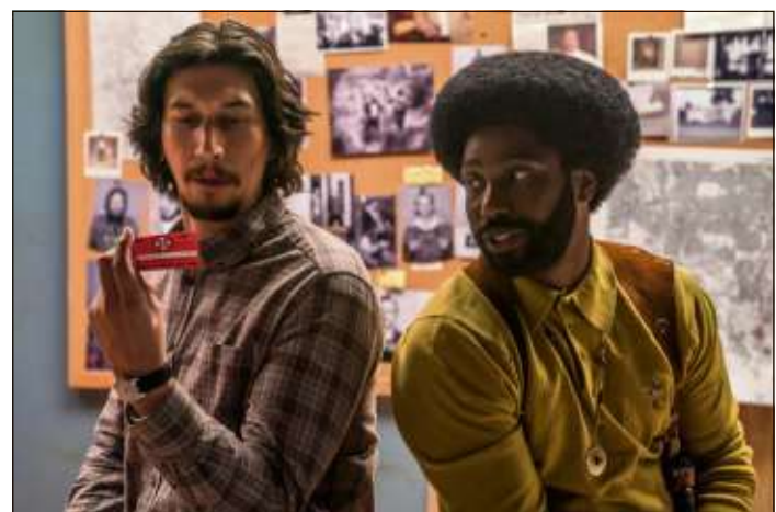
Eine Perle des US-Independent-Kinos: In „BlacKkKlansman“ erzählt Regisseur Spike Lee von einem afroamerikanischen Cop, der den Ku-Klux-Klan bloßstellen will.

Auf ein Glimmerlicht dürfen sich Fans des amerikanischen Independent-Kinos freuen, nämlich auf Spike Lees neuesten Streich „BlacKkKlansman“ – eine wahre Geschichte aus den 1970er Jah-