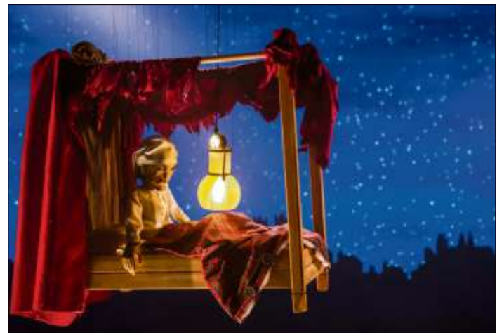
Die Augsburger Puppenkiste hat Charles Dickens Klassiker „Geister der Weihnacht“ für die große Leinwand adaptiert – ein nostalgisches Erlebnis für Groß und Klein.