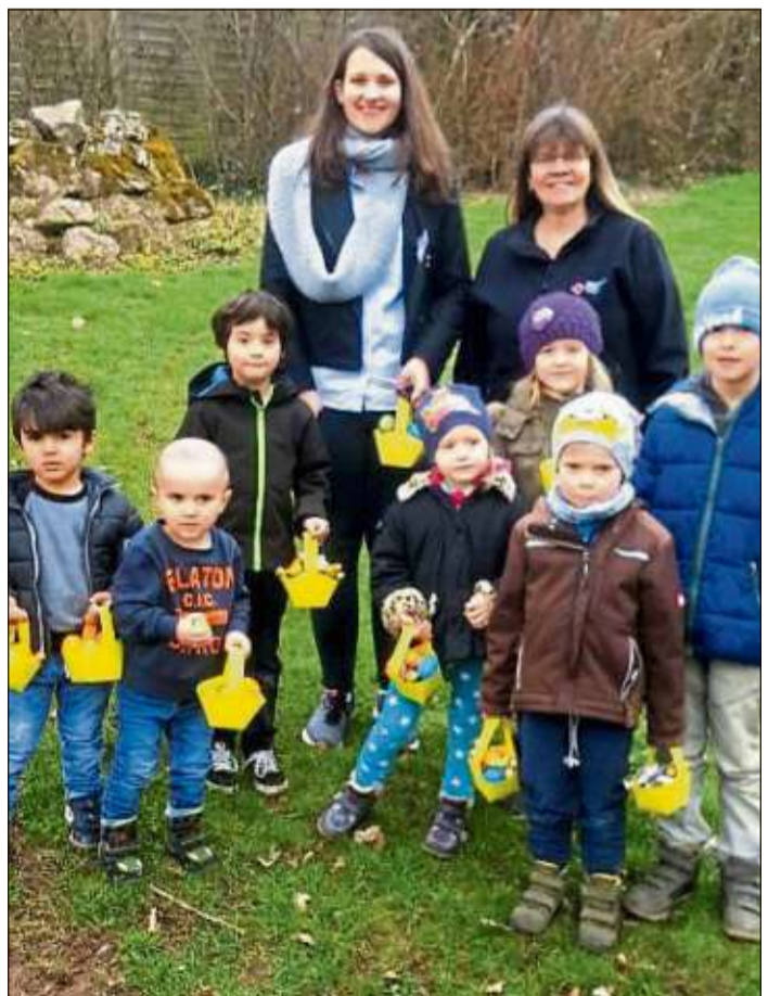
Die Kinder freuten sich über die österlichen Süßigkeiten.