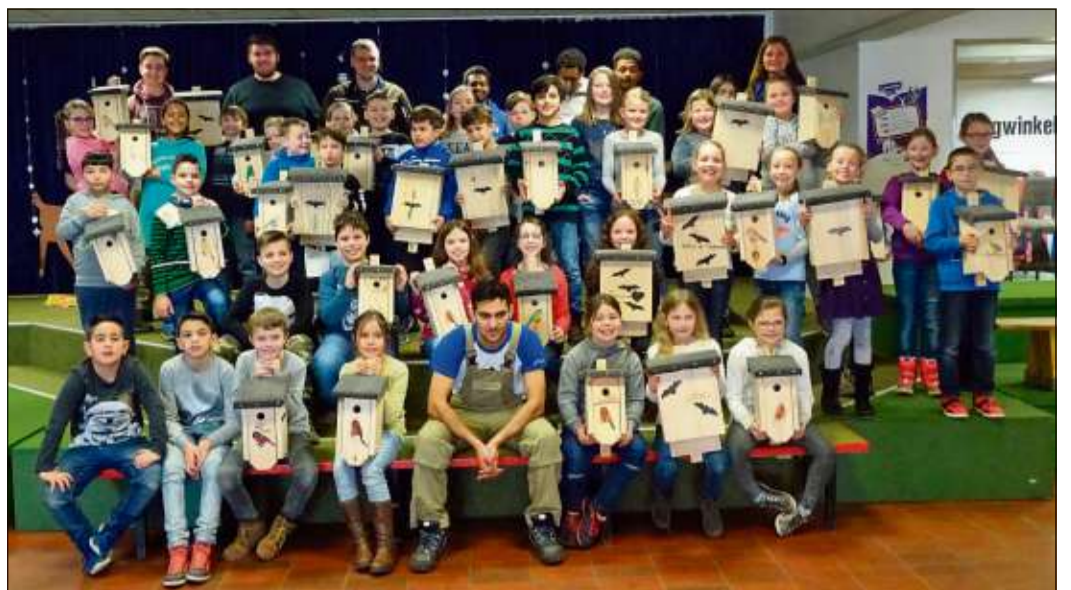
Die Drittklässler der Bergwinkel-Grundschule waren stolz auf die von ihnen selbst gebauten Nistkästen. Und auch die Azubis von Don Bosco freuten sich über die Ergebnisse.