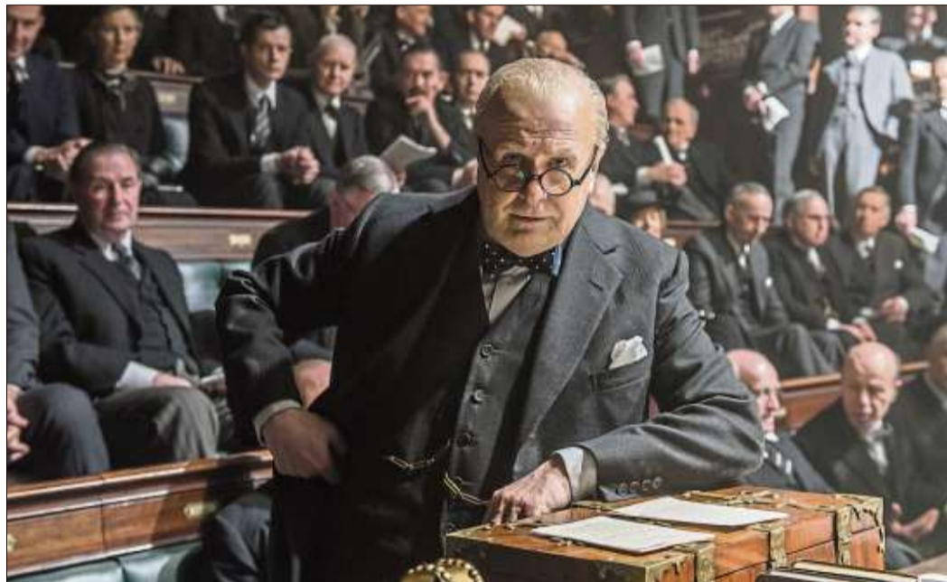
Oscar-Preisträger Gary Oldman brilliert in dem packenden Politthriller „Die dunkelste Stunde“ als britischer Premierminister Winston Churchill.