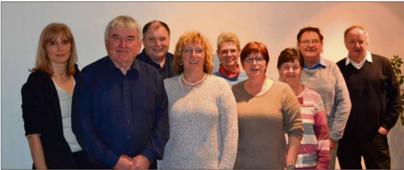
Der neugewählte Vorstand des Freundeskreises Märchenstraße.