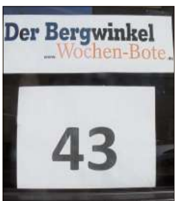
In der Krämerstraße 43 ist die neue Geschäftsstelle des Bergwinkel Wochen-Boten beheimatet.

lichkeiten bieten ausreichend Platz für die Mitarbeiter des Bergwinkel Wochen-Boten. „Wir freuen uns, nun mitten in unserem Verbreitungsgebiet zu sein“, sagt