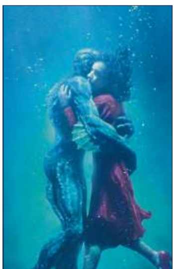
Das poetische, mit vier Oscars ausgezeichnete Fantasydrama „Shape of Water – Das Flüstern des Wassers“ erzählt eine ungewöhnliche Liebesgeschichte.

Verbissen begibt er sich auf die Jagd nach dem Übeltäter. Die Auseinandersetzung droht erst