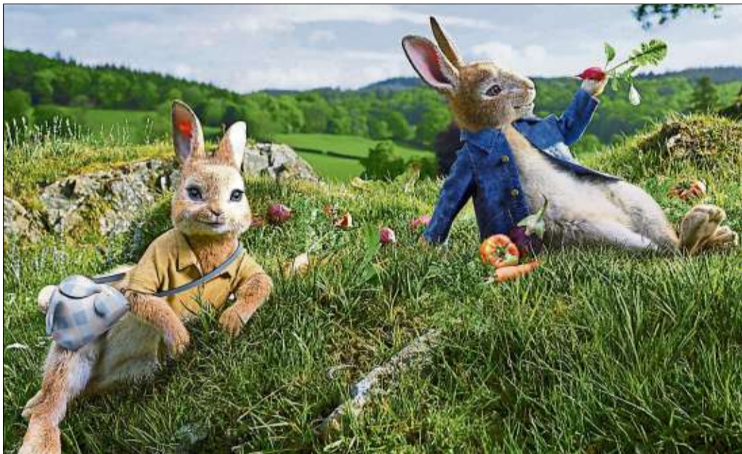
Ein witziges Leinwandabenteuer für die ganze Familie nach einem englischen Kinderbuchklassiker: „Peter Hase“ läuft ab dem heutigen Donnerstag im Kuki.