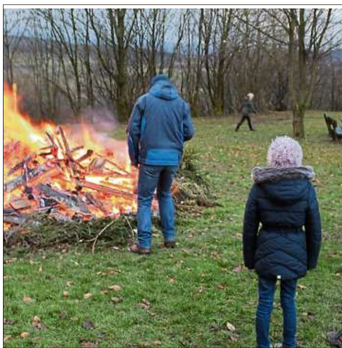
Als Brennmaterial für das Osterfeuer dienten die eingesammelten Weihnachtsbäume.

Wir kaufen Wohnmobile + Wohnwagen 03944-36160 www.wm-aw.de Fa.