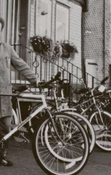
Klaus Donnecker vor dem ersten Firmensitz in der Frankfurter Straße in Salmünster.

Und im Motorradladen gibt es eine Gaudi mit einer Fußball-Dartscheibe, an der Prozente „erschossen“ werden können. Neben dem Jubiläum ist der alljährliche Orange Day (Einführung der neuen KTM Modelle) Grund der Veranstaltung.