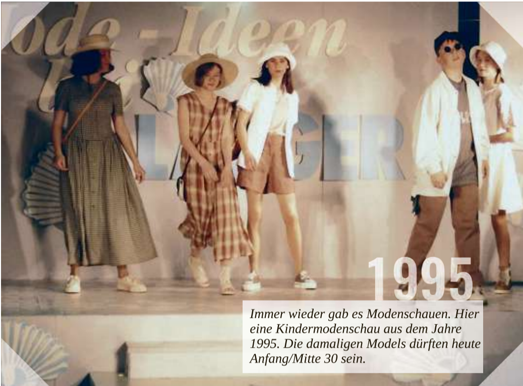
Immer wieder gab es Modenschauen. Hier eine Kindermodenschau aus dem Jahre 1995. Die damaligen Models dürften heute Anfang/Mitte 30 sein.