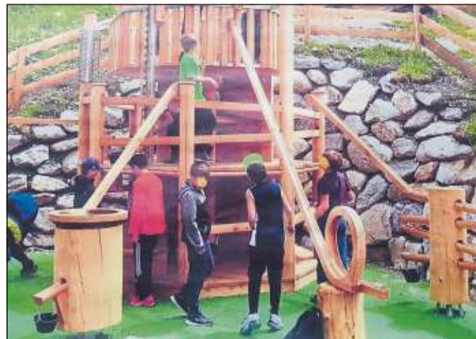
Im KUGELTURM werden Holzmurmeln in Laufrippen auf die Reise geschickt.