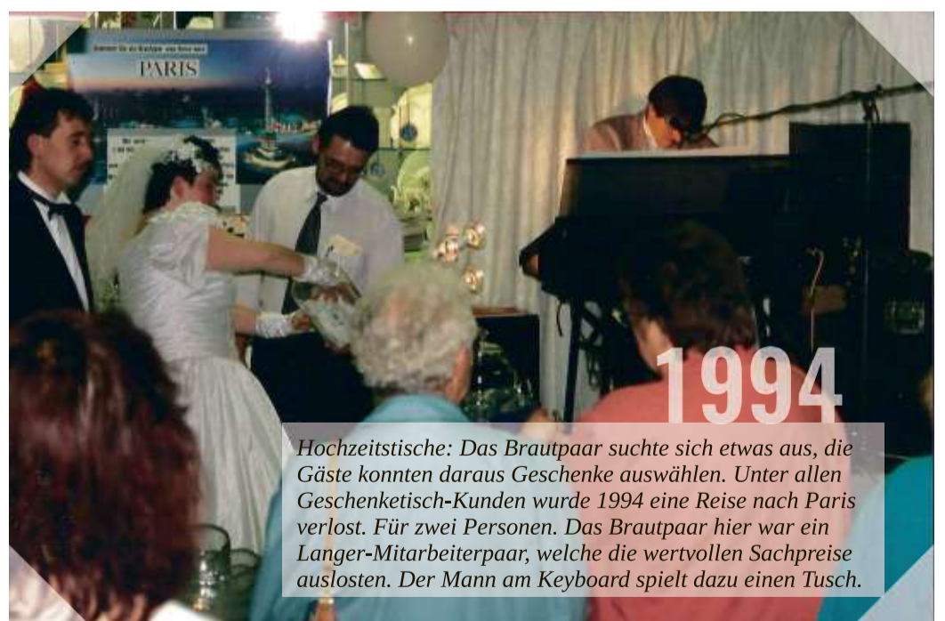
Hochzeitstische: Das Brautpaar suchte sich etwas aus, die Gäste konnten daraus Geschenke auswählen. Unter allen Geschenketisch-Kunden wurde 1994 eine Reise nach Paris verlost. Für zwei Personen. Das Brautpaar hier war ein Langer-Mitarbeiterpaar, welche die wertvollen Sachpreise auslösten. Der Mann am Keyboard spielt dazu einen Tusch.