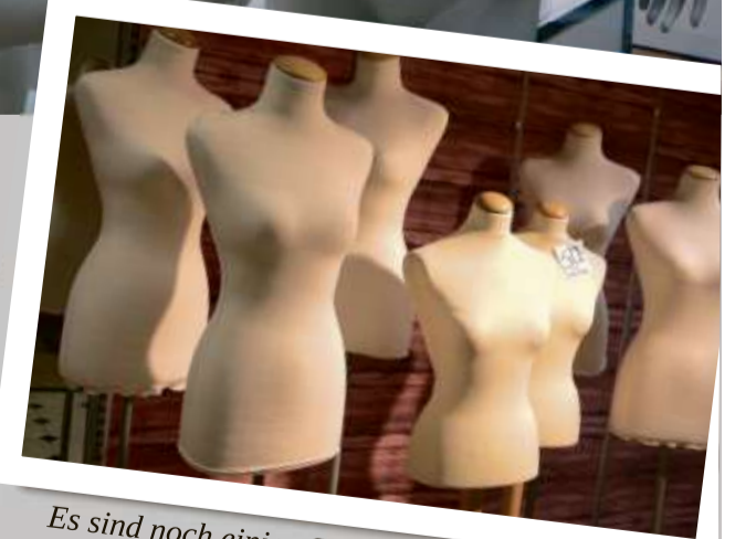
Es sind noch einige Schneiderbüsten da.

Schlüchtern/ Bad Orb. Neben den vielen tausend Artikeln, ob Mode, Sport oder Wäsche, findet man auch noch Schaufensterpuppen, Torsen, Schneiderbüsten und Warenträger unterschiedlichster Art. Oder hochwertige Kleiderbügel, ob aus Metall, Kunststoff oder Holz schon drei Stück für einen Euro.