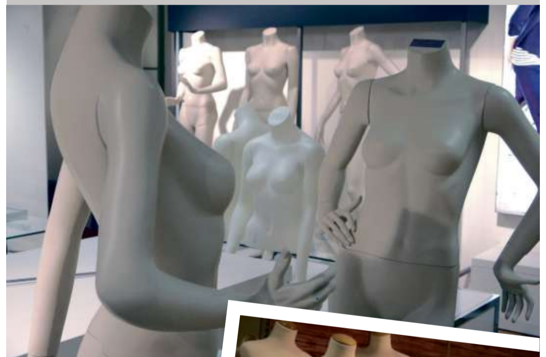
Schaufensterfiguren in den unterschiedlichsten Posen

Schaufensterfiguren, Warenträger, Dekoration und vieles mehr