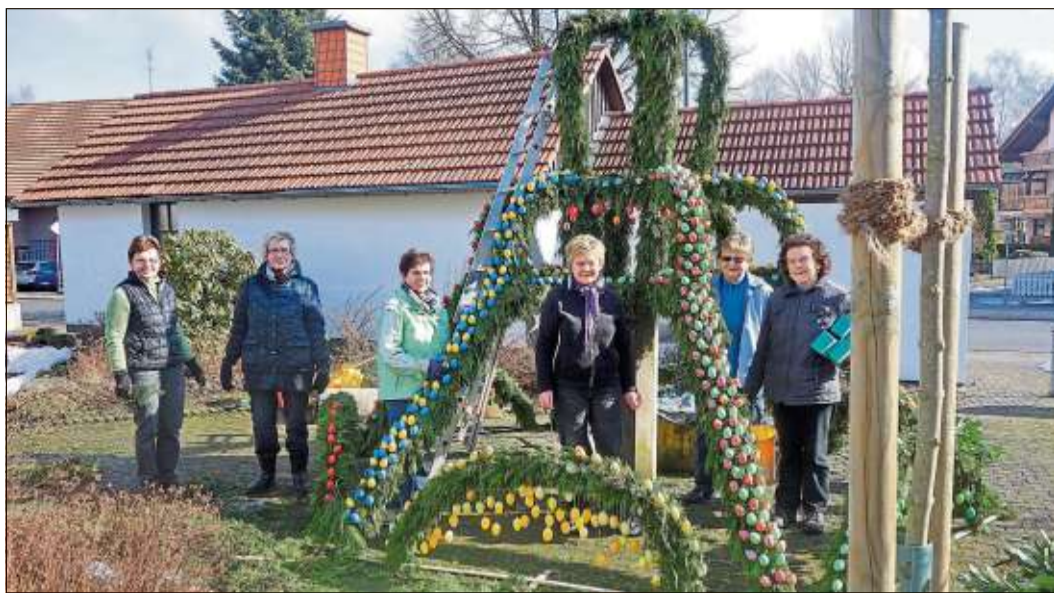
Die Landfrauen schmückten die Krone des Osterbrunnens mit mehr als 2000 Ostereiern.