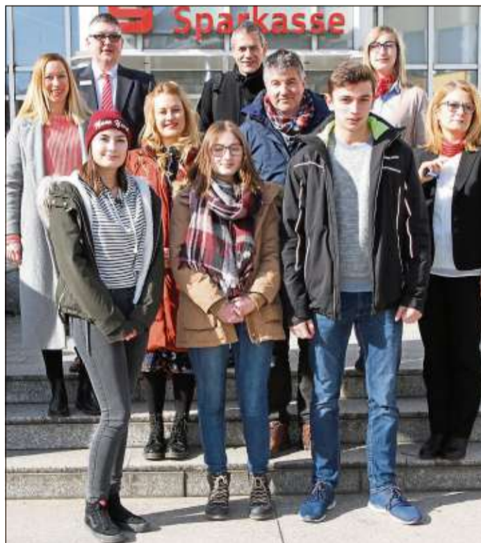
Bei der Kickoff-Veranstaltung in der Kreissparkasse präsentierten die Schüler ihre Geschäftsidee „pimp & live“.

vier Kinzig-Schülerinnen mit ihrer Wunder-Eiswaffel bundesweit den 149. Platz von insgesamt 826 Teams belegt.