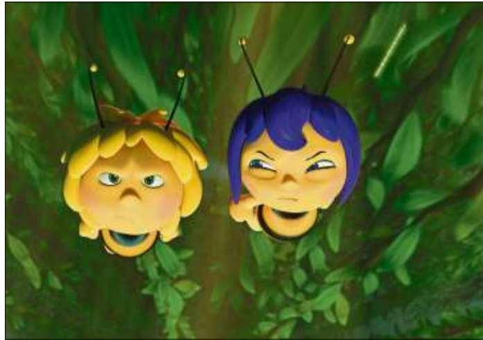
In der Animationsfilmfortsetzung „Die Biene Maja 2 – Die Honigspele“ treten Maja und ihre Freunde bei einem Wettbewerb an, der ihrem Bienenstock die ganze Honigernte kosten könnte.

Im Abendprogramm stehen unter anderem die Glanzlichter der letzten Oscar-Verleihung auf dem Spielplan: das sensationelle, von den Kritikern weltweit gefeierte Fantasyepos „Shape Of Water – Das Flüstern des Wassers“, die herrlich schwarze Komödie „Three Billboards Outside Ebbing, Missouri“ mit einer fantastischen Frances McDormand in der Hauptrolle, Steven Spielbergs brillante, starbesetzte Charakterstudie „Die Verlegerin“, das packende Biopic „Die dunkelste Stunde“, in dem Gary Oldman als Winston Churchill beeindruckt,