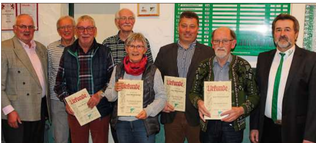
Gehrt wurden diese Mitglieder für 40- und für 25-jährige Vereinstreue.