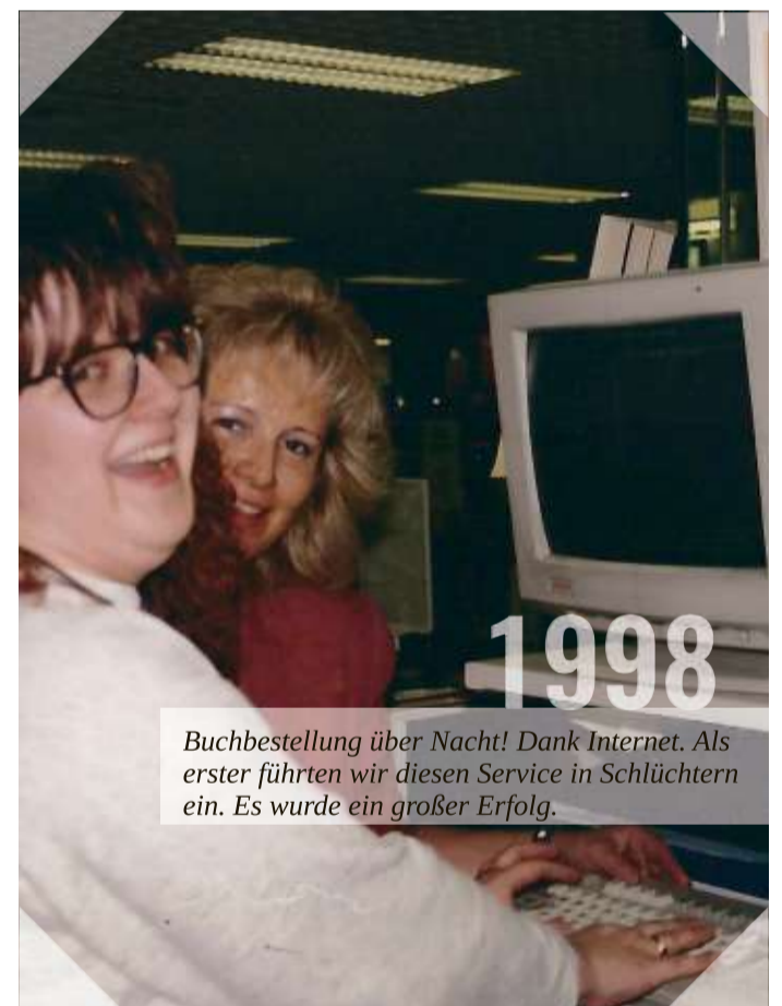
Buchbestellung über Nacht! Dank Internet. Als erster führten wir diesen Service in Schlüchtern ein. Es wurde ein großer Erfolg.