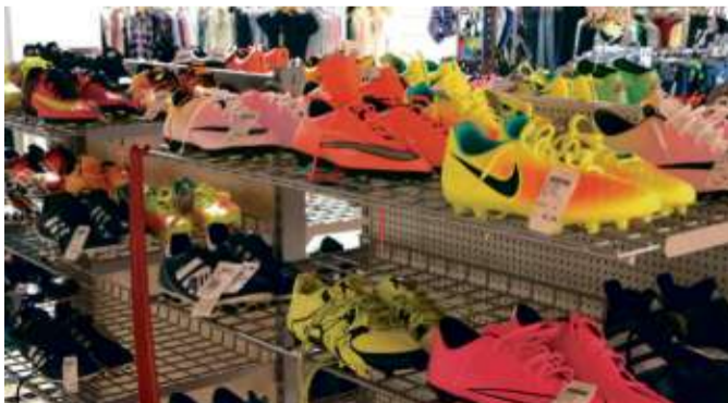
Sport- und Fußballschuhe in allen Farben

Alles muss raus! Das gilt auch für Fußballschuhe und Sportschuhe. Zwar sind nur noch Einzelpaare vorhanden, dafür gibt es aber Rabatte bis zu 70 Prozent. Hier lohnt sich der Weg nach Schlüchtern. Ob Nockenschuhe oder Hallenschuhe, Nike oder Adidas, hier findet jeder was.