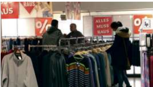
Auswahl in der Herrenmodeabteilung