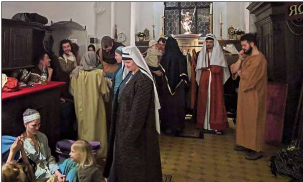
Hinter den Kulissen der Passionsspiele 2018.

„Neben der Überzeugung, welche die Passionsspiele erst möglich machen, und dem Spaß; den