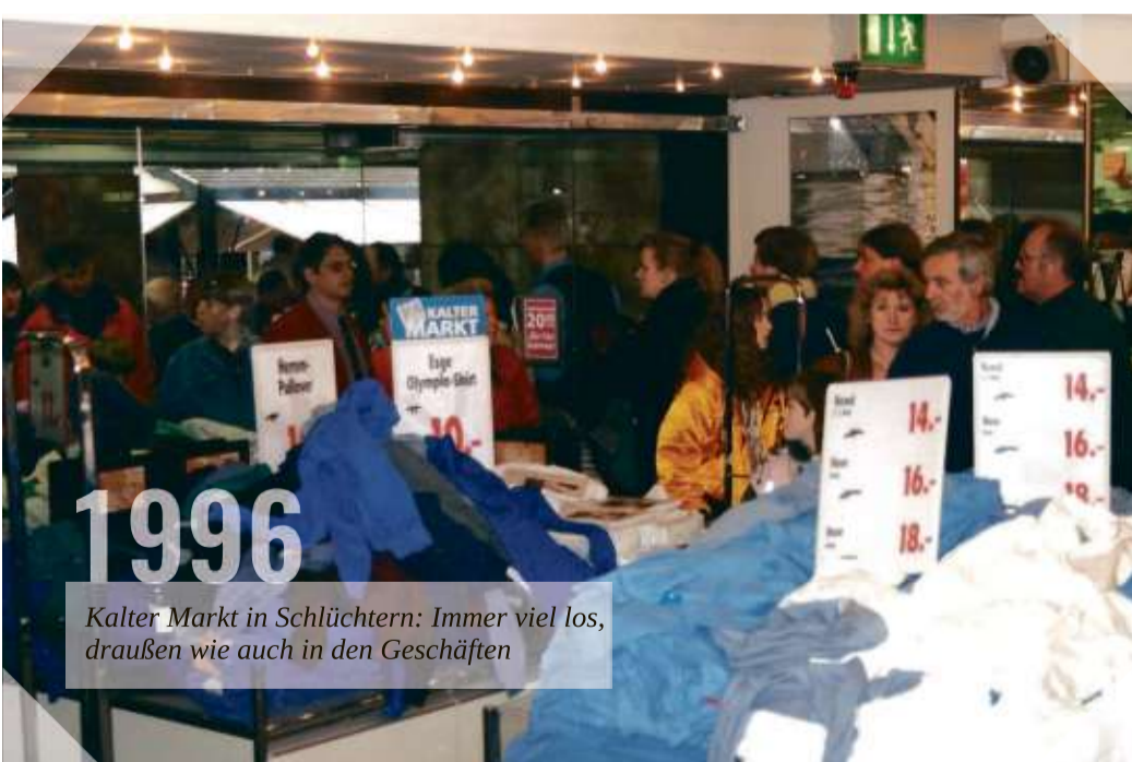
Kalter Markt in Schlüchtern: Immer viel los, draußen wie auch in den Geschäften