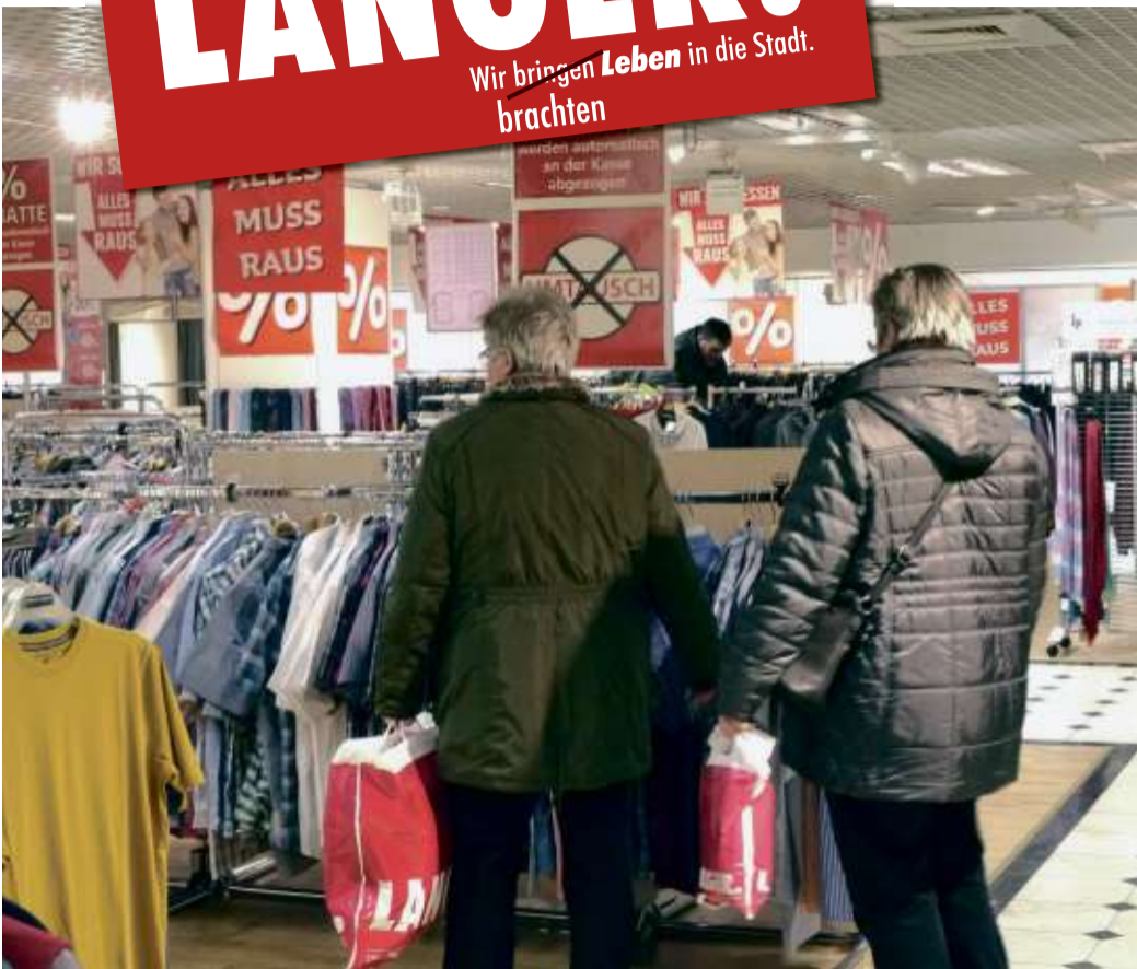
Immer noch große Auswahl macht Lust auf Schnäppchenjagd.

Wir bringen Leben in die Stadt. brachten