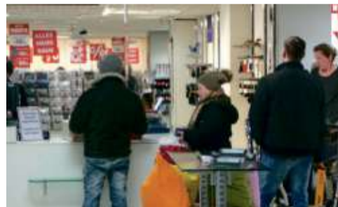
Schlange an der Kasse im Erdgeschoss