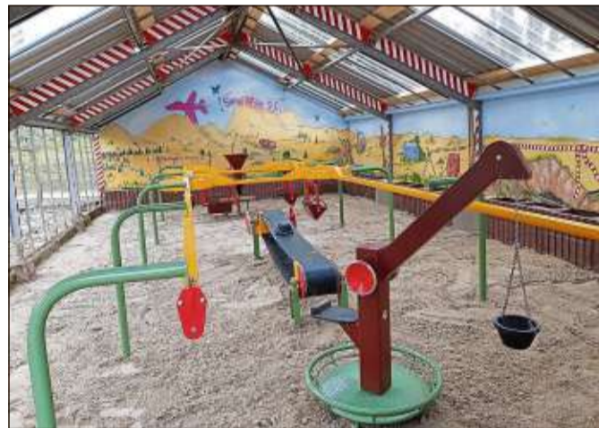
Im SANDwerk wird die Großbaustelle organisiert.