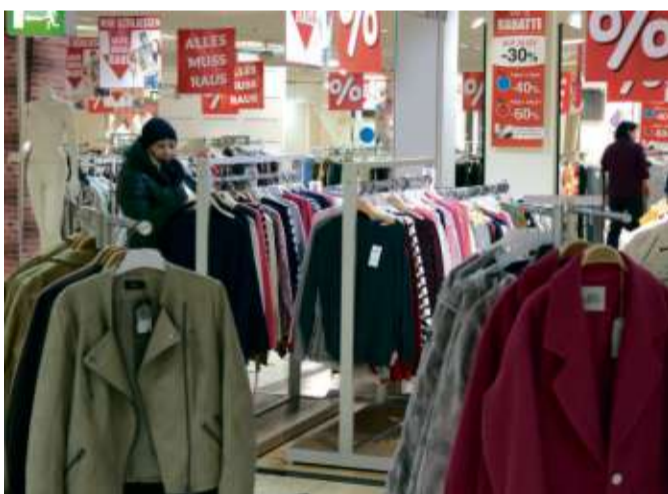
Ein Schnäppchen wird immer gefunden

Schlüchtern/ Bad Orb. Jetzt gilt es nochmal: Die Rabatt-Prozente wurden nochmals angehoben. Jetzt mindestens 40 Prozent Rabatt auf Alles und 60 Prozent auf mit Sternen-Aufkleber ausgezeichnete Artikel und sage und schreibe 70 Prozent auf die Artikel mit Smiley-Aufkleber. Jacken, Mäntel, Hosen, Blusen, Hemden, Shirts sogar in großen Größen findet man in der Damen-Modeabteilung und bei Herrenmode. Hier lohnt sich das stöbern an den Ständern mit Markenmode und viele Kundinnen und Kunden nutzen das täglich ausgiebig.