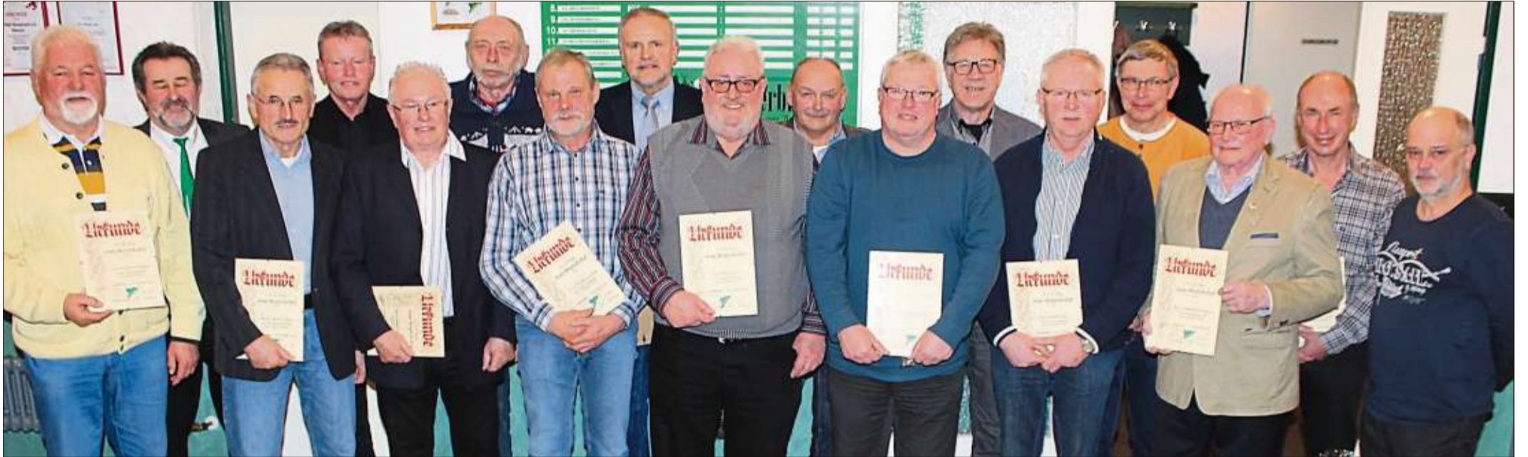
Diese Gründungsmitglieder und „50-Jährige“ wurden beim Kommers zum 50-jährigen Jubiläum des Sportvereins Niederzell ausgezeichnet.