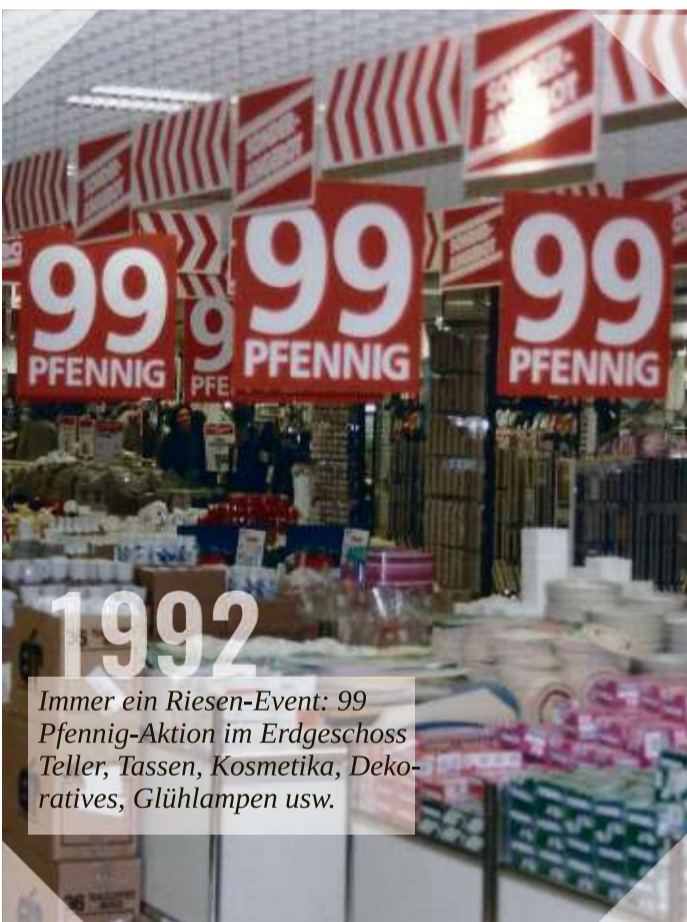
Immer ein Riesen-Event: 99 Pfennig-Aktion im Erdgeschoss Teller, Tassen, Kosmetika, Dekorative, Glühlampen usw.