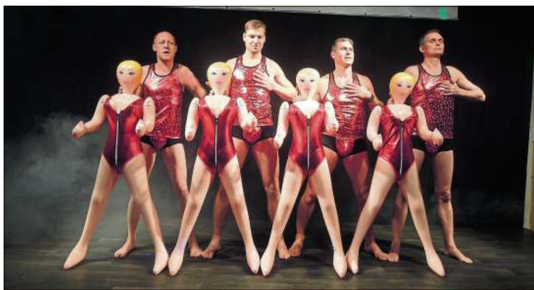
Die „Magic Rubberdolls“ aus Ahl zeigten eine Tanzformation mit Luftballon-Puppen.

Sie können unter der Rubrik „Zu verschenken“ Ihre Angebote kostenlos aufgeben. Bitte übermitteln Sie uns den Anzeigentext nur unter Fax (06051) 78 80 37 00 oder per E-Mail Anzeigen@Wochen-Bote.de. Geben Sie Ihre komplette Adresse für unsere Unterlagen mit an.