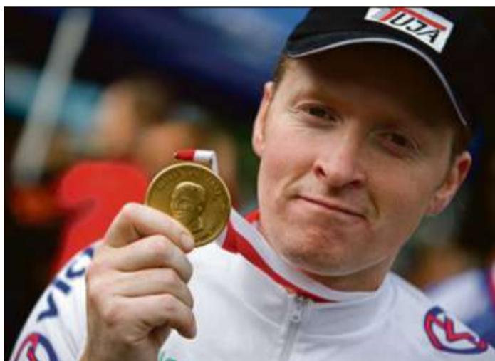
Joey Kelly spricht zum Thema „No Limits – Wie erreiche ich mein Ziel“.

zen Sie den Schwung des neuen Jahres und Ihre eigenen guten Vorsätze. Informieren Sie sich bei den vielfältigen kostenfreien medizinischen Fachvorträgen und in der begleitenden Messeausstellung in der Brunnenpassage der Spessart Therme. Lassen Sie sich von den gesunden Rezeptkreationen der Netzwerkköche verführen und nehmen Sie die Anregungen der Fachleute mit in die eigene Küche.“