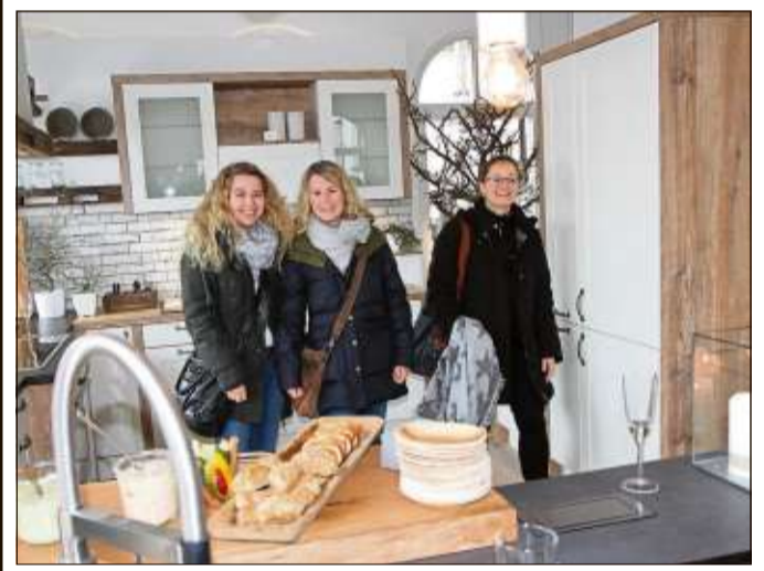
Die Gäste waren von der Kücheneinrichtung hellauf begeistert.