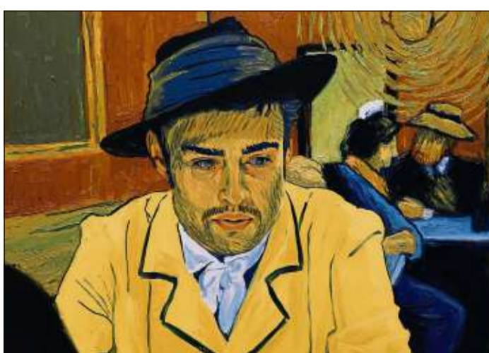
Visuell berauschend und ein einmaliges Seherlebnis: In „Loving Vincent“ erwachen die Bilder von Vincent Van Gogh zum Leben.

In den zwei darauffolgenden Jahren wurden die realen Filmbilder von insgesamt 125 Malern aus aller Welt in Ölgemälde übertragen. Dabei wurden über