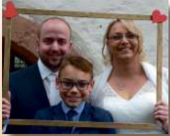
Schlüchtern-Wallroth, im Januar 2018

Was wären wir ohne unsere Familie, ohne unsere Freunde, ohne unsere Kollegen und Nachbarn?