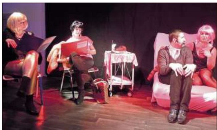
Die Praktikantinnen des ältesten Gewerbes pflegen sorgfältig ihre Praktikumsmappen.