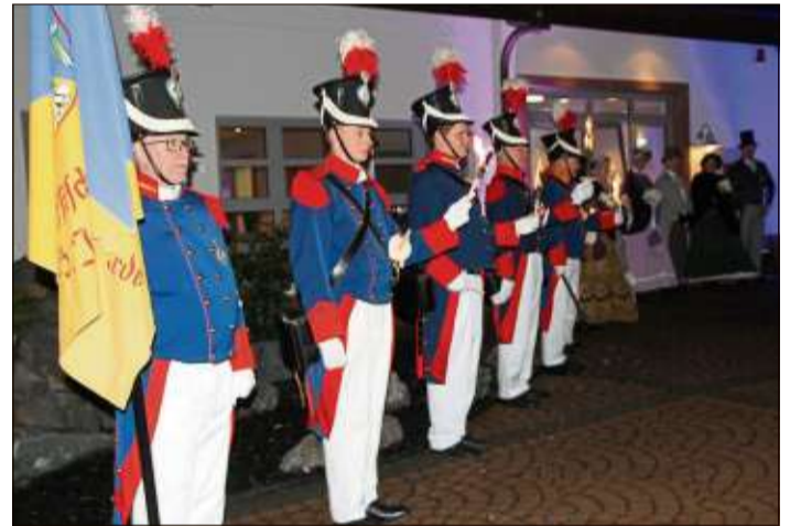
Die Bürgergarde und die Biedermeiergruppe standen vor der Stadthalle Spalier und begrüßten die Gäste.