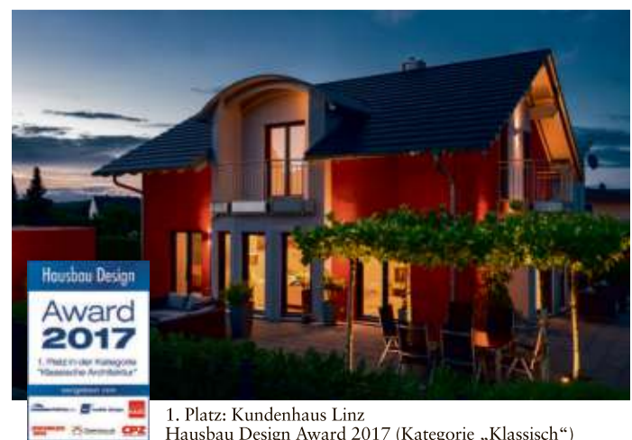
1. Platz: Kundenhaus Linz Hausbau Design Award 2017 (Kategorie „Klassisch“)