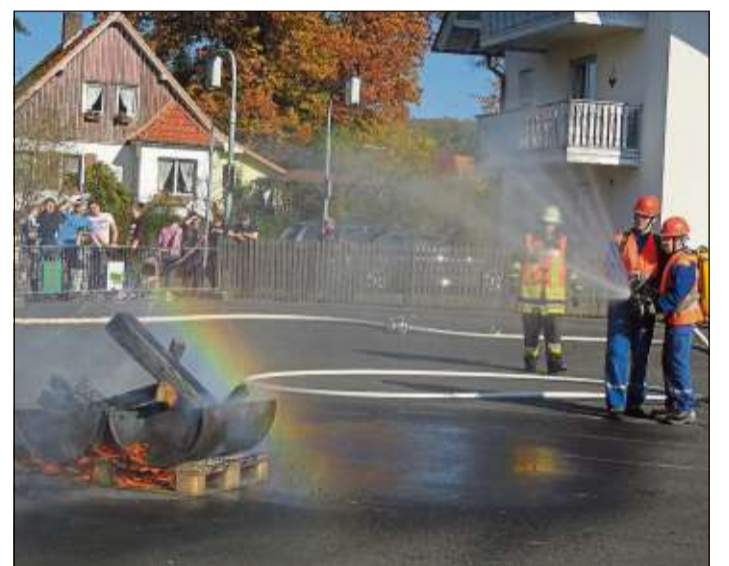
Die „Flächenbrände“ auf dem Romsthaler Schulhof hatten die Jugendfeuerwehrleute rasch im Griff.