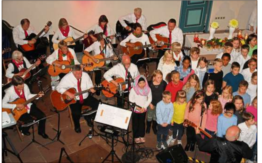
Gitarrengruppe und Kinderchor von der Empore aus abgelichtet.