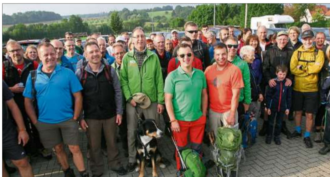
Aus dem ganzen Land kamen leidenschaftliche Wanderer zur Bergwinkelroute.

24-Stunden-Tour keine einmalige Veranstaltung bleibt. Das ist eine wunderbare Sache.“