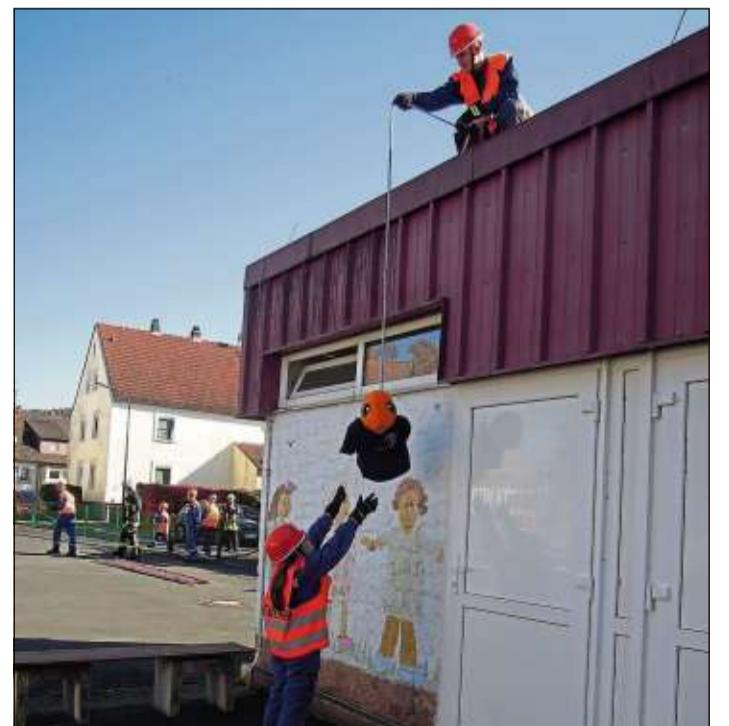
Auch „Tierrettung“ vom Dach gehörte zur Abschlussübung.

Nachdem sich alle am Samstagmorgen im Feuerwehrgerätehaus eingerichtet hatten, führte der erste Alarm Richtung Marborn, wo auf einem Wirtschaftsweg ein Baum von der Straße zu schaffen war. Die Beseitigung einer Ölspur, ein Gefahrguteinsatz in Romsthal, ein Brand am Sportplatz, die Suche nach einer vermissten, verwirrten Person am Waschweier unter Einsatz der Wärmebildkamera, die Erste-Hilfe-Leistung einer verletzten Person am Palmusacker und die Bergung eines Unfallfahrzeuges hielt die Nach-