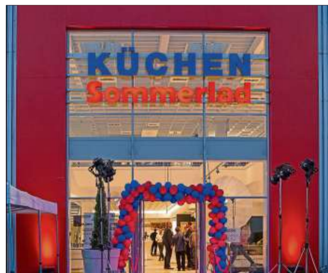
Küchen Sommerlad eröffnete in Künzell.

Küchen Sommerlad Justus-Liebig-Straße 8 36093 Künzell www.kuechen-sommerlad.de Öffnungszeiten: Montag bis Freitag: 9.30 bis 19 Uhr / Samstag: 9.30 bis 18 Uhr