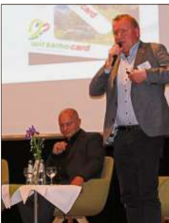
Bürgermeister Brandauer stellte sanfte Mobilität im Salzburger Land vor.