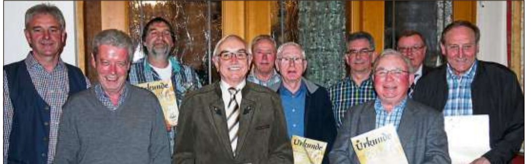
Mit einer Urkunde und einer Anstecknadel wurden Sänger und treue Mitglieder geehrt.