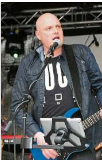
Doc Rock begeisterte.