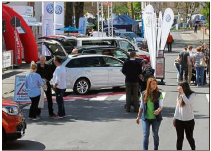
Die führenden Schlüchterner Autohäuser stellten auf der Fahrzeugmeile ihre neuesten Modelle vor.