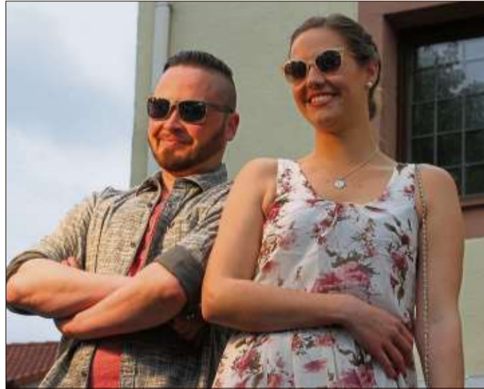
Die Mode, die die Models auf dem Catwalk zeigten, machte Lust auf Sommer pur.