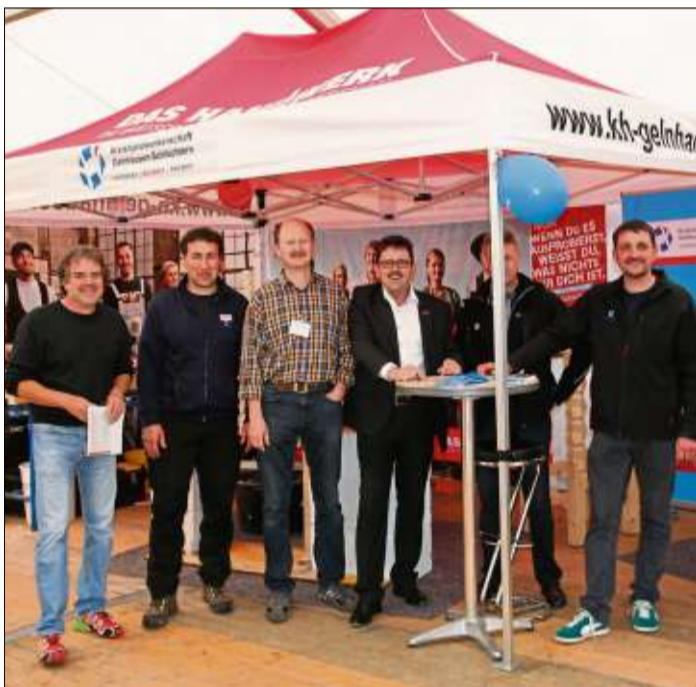
Im Gewerbezelt präsentierte sich das heimische Handwerk den interessierten Besuchern.