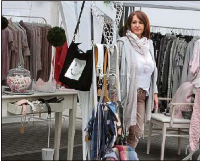
Dekorativ und anspruchsvoll präsentierten sich viele Stände auf dem Hellen Markt.