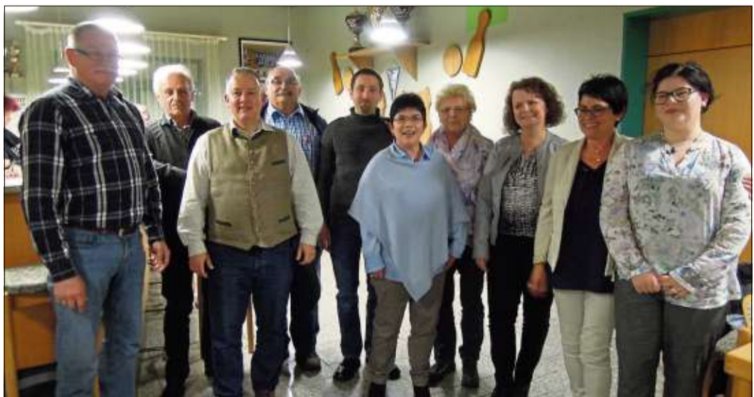
Der neu gewählte Vorstand des Ski- und Wanderclubs Huttengrund.

Bad Soden-Salmünster-Romthal (rs). Der Ski- und Wanderclub Huttengrund lädt für Samstag, 13., und Sonntag, 14. Mai, zur 36. Europa-Volkswanderung in Grünberg-Lardenbach ein. Start und Ziel ist die Schutzhütte am Sportplatz. Veranstalter sind die „Speckmäuse“ vom Spiel- und Sportverein. Die Wanderstrecken sind 5, 10 und 14 Kilometer lang. Startzeit ist am Samstag von 12 bis 16 Uhr (Zielschluss 18 Uhr), am Sonntag von 7 bis 12 Uhr (Zielschluss 14 Uhr).