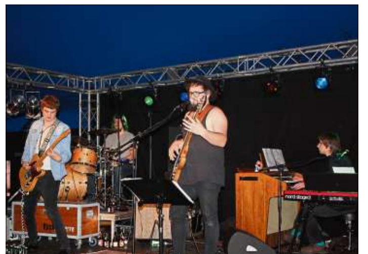
„Rockkonserve“ hat sich dem Oldschoolrock verschrieben.