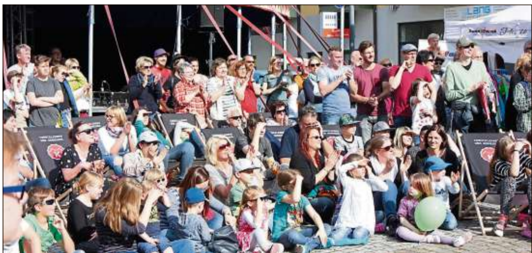
Eine große Schar an Besuchern zog es auf den Stadtplatz.

Die Weltklasse-Künstler, die unter anderem den Zirkuspreis in Monte Carlo gewonnen haben, beeindruckten mit Trampolinsprüngen vom Feinsten. Die