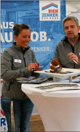
Beim Schlüchterner Häuslebauer trifft Handwerk auf High Tech.