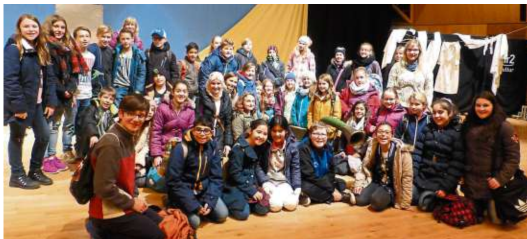
Das hr-Sinfonieorchester hatte Schüler der beiden letzten Grundschuljahre und der 5. und 6. Klasse weiterführender Schulen zu einem Mitmach-Projekt in seinen Sendesaal eingeladen.