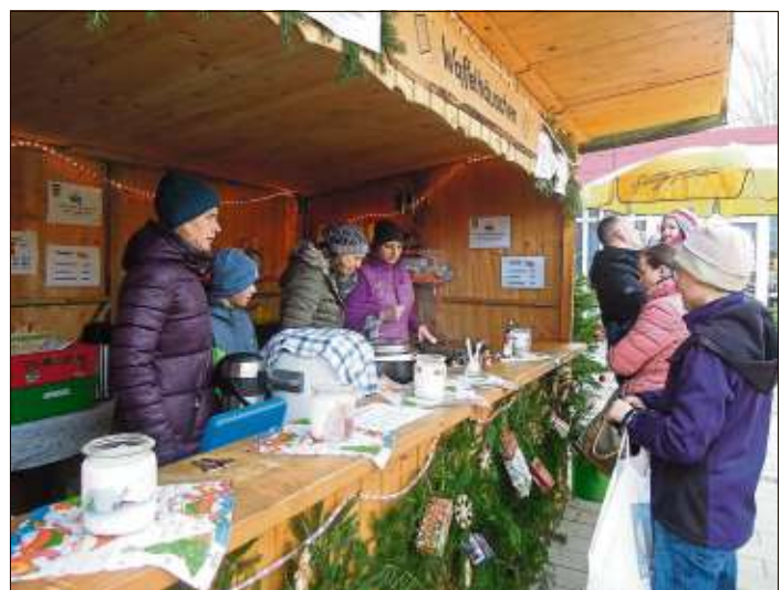
Frische Waffeln bei der SG Bad Soden.