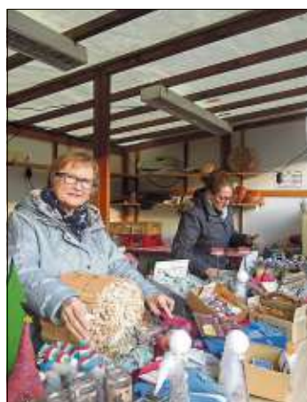
Hübsche Bastelarbeiten und spezieller Glühwein waren am Stand der Lebenshilfe zu haben.

In gemütlichen Runden beschlossen die Besucher den Samstagabend mit der Glühweinparty. Zum sonntäglichen Marktbeginn gab die Big Band Elm ein Frühkonzert, der Männerchor Frohsinn erfreute mit Weihnachtsliedern, die Kindergartenkinder