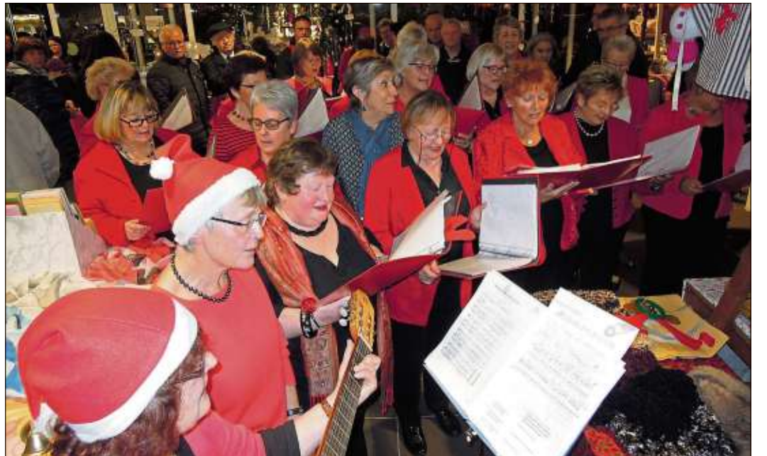
Die „Waffelsingers“ vom TV Soden-Stolzenberg überraschten die Freunde aus der Partnerstadt an deren Stand mit einem französischen Lied.

Viele Besucher versammelten sich an den Ständen im Außenbereich zu einem letzten Glas Glühwein zum Abschluss eines gelungenen Weihnachtsmarktes in der Kurstadt.