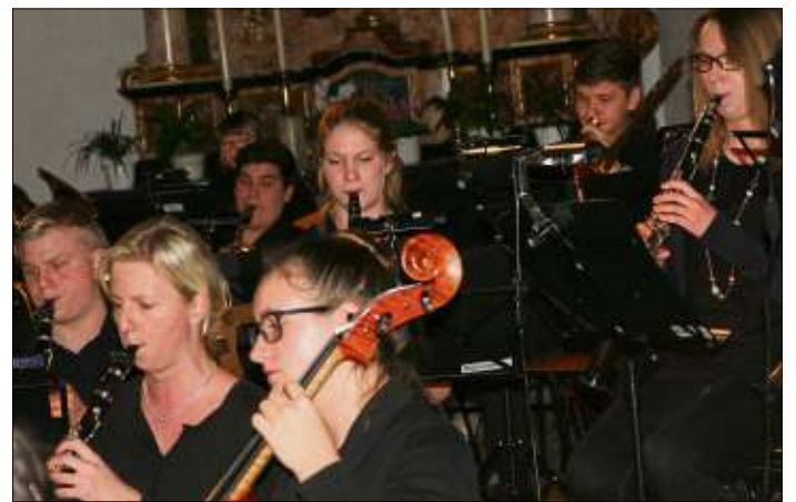
Das Oberstufenorchester des Ulrich-von-Hutten-Gymnasiums und „Hymne of Glory“.