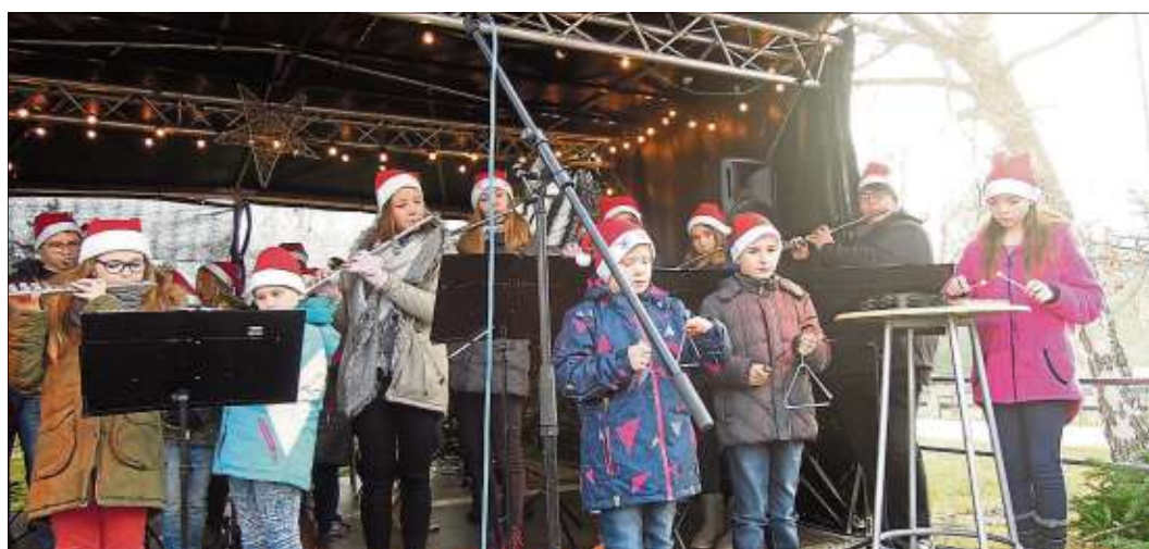
Weihnachtsweisen zur Markteröffnung mit dem Nachwuchsorchester des Musikvereins Cäcilia „Starker Sound“.