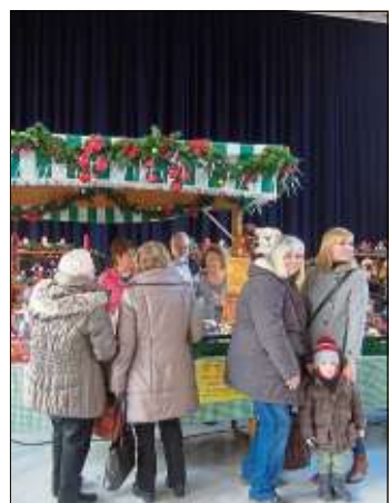
Eine Riesentombola hatte der HGV bestückt.