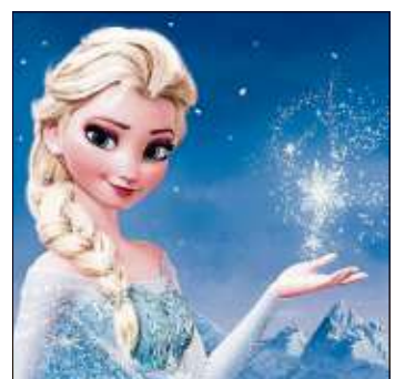
Ein Fest für alle Fans von „Die Eiskönigin – Völlig unverfroren“.

Der charmante Familienstreifen „Pettersson & Findus – Das schönste Weihnachten überhaupt“ erzählt von einem Heiligabend, der fast ins Wasser fällt. Denn Pettersson und Findus sitzen in der Tinte: Zwei Tage vor dem