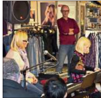
Beim letzten Auftritt im Kaufhaus lauschten viele Zuhörer den kleinen und großen Nachwuchskünstlern.

Die im gleichen Gebäude beheimatete Musikschule feierte schon mehrfach ihr weihnachtliches Konzert bei Langer. Die klei-