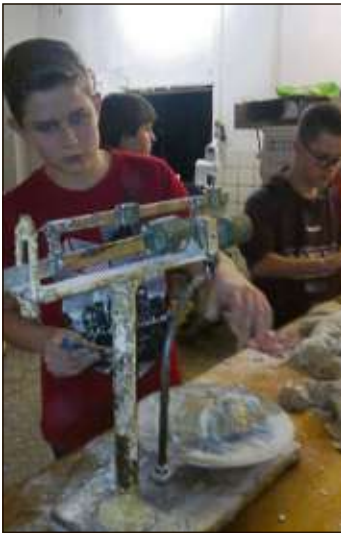
170 Brote entstanden in der Mühlenbäckerei.