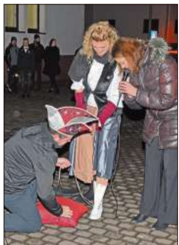
Der Schuh passt – und Sterbfritz hat eine Faschingsprinzessin.