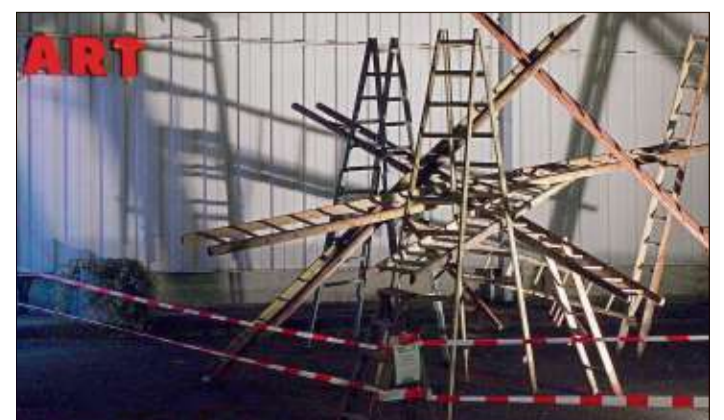
Die Skulptur „Leiter-Treffen“ von Gerwin von Monkiewitsch vor der KulturWerk-Halle.

Alle Veranstaltungen beginnen um 20.10 Uhr, soweit nicht anders angegeben. in der KulturWerk-Halle Gartenstraße 50. www.kulturwerk2010.de