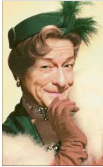
Schon zu Lebzeiten war er eine Legende: Heinz Rühmann.

Schlüchtern (rs). Ob Heinz-Rühmann-Revue oder Molière-Klassiker, bayerisches Volkstheater oder John-Steinbeck-Drama – die Theater- und Kultursaison 2016/17, präsentiert vom Magistrat der Stadt Schlüchtern, bietet wieder jede Menge Abwechslung und hochkarätige Inszenierungen. Wer noch nach einem passenden Weihnachtsgeschenk sucht, könnte also im Büro für Touristik, Kultur und Freizeit fündig werden. Karten sind ab sofort dort erhältlich.