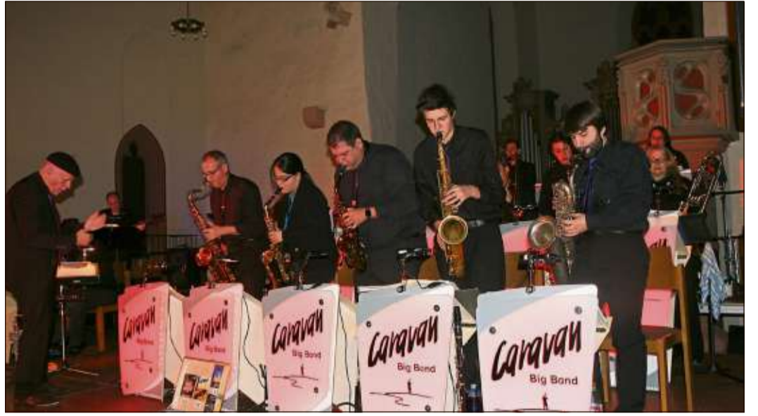
Die Big Band baut musikalische Brücken.