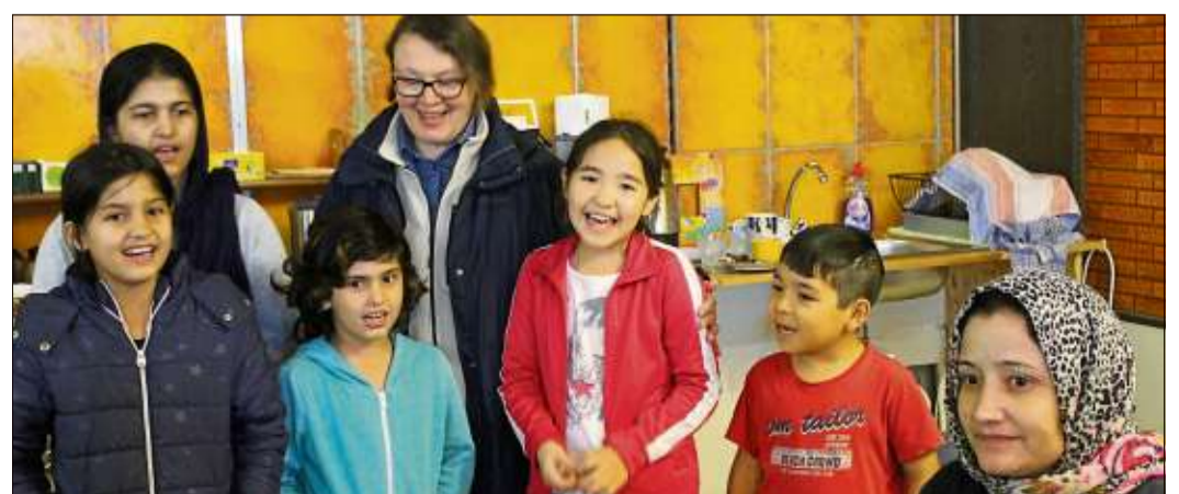
Wer hätte gedacht, dass „Weißt Du wieviel Sternlein stehen?“ so viele Strophen hat? Eine Gruppe afghanischer Kinder beeindruckt die Besucher mit alten deutschen Kinderliedern.

Weitere Informationen findet man auf Facebook bei OASE Ulmbach sowie unter der Telefonnummer (06667) 6309602.