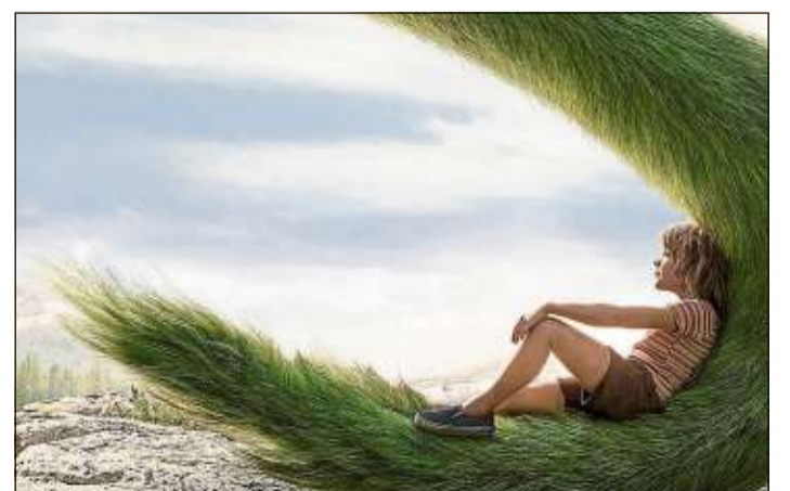
In dem spannenden Familienfilm „Elliot, der Drache“ wird der Waisenjunge Pete von einem echten Drachen aufgezogen, der versteckt in den Wäldern lebt.

Vorschau: „Willkommen bei den Hartmanns“ (ab 26. November), „Die Weihnachtsgeschichte“ – Augsburger Puppenkiste (Kids-Kino), „Kubo – Der tapfere Samurai“ (Kids-Kino).