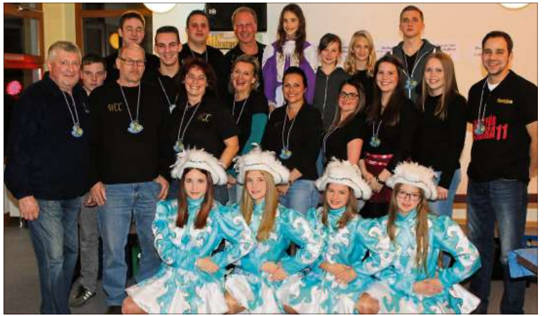
Die Tollitäten des Wallrother Carnival-Clubs „Die Wellblooe“ bei der Kampagneneröffnung.

Zahnarzt: Für Notfälle außerhalb der Sprechzeiten ist der diensthabende Arzt über die Zentrale Notdienst-Nummer für den Bereich Zahnmedizin, Telefon (01805) 60 70 11, zu erfragen.