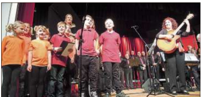
Der Stolz des Vereins: Das Nachwuchs-Ensemble begeisterte mit eigenen Liedbeiträgen.