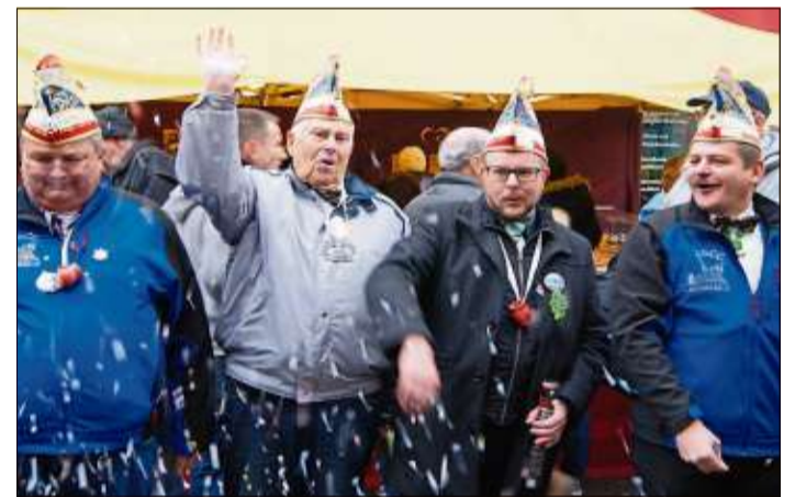
Fröhlich startete der Schlüchterner Elferrat in die neue Kampagne.

lett auf der Mauerwiese wieder die Weihnachtsbäume. Eine Woche später ist am 14. Januar Orde-fest und Inthronisation des Kinderprinzenpaares. Tags darauf startet der Vorverkauf der Eintrittskarten für die beiden Faschings-sitzungen am 11. und 18. Februar. Der Kinderfasching lockt am 12. Februar in die Stadthalle. Faschingsparty am 25. Februar sowie närrischer Umzug am 26. Februar beschließen die Kampagne.