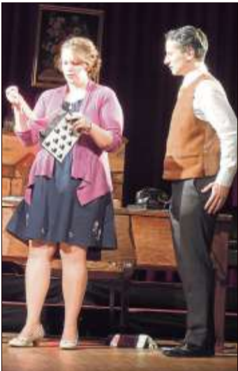
Dieses Geschenk kommt offensichtlich nicht so gut an.