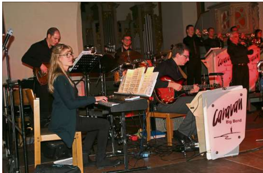
Die Rhythmusgruppe bei „Heartland“.

„Gib mir ein Lied, bei dem ich etwas fühlen kann, und es wird mir nie Arbeit machen“, hatte die begnadete Jazzsängerin Billie Holiday einmal gesagt. Vor einem