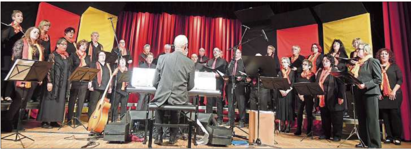
Der Familienchor des Gesangsvereins Liederkrantz konzertierte mit einem abwechslungsreichen Programm im Spessart Forum Kultur.