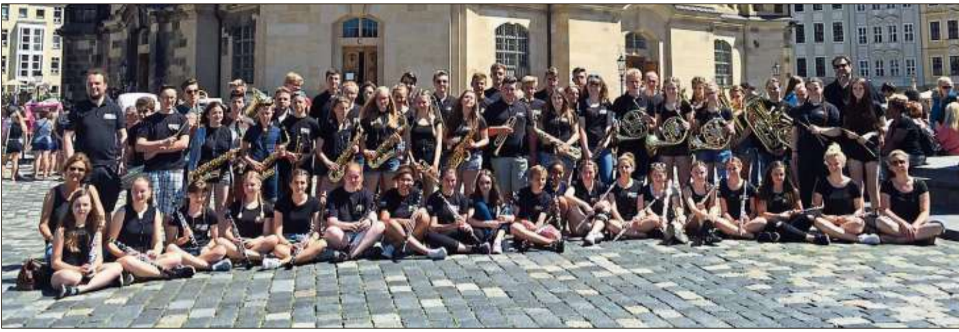
Lehrer und Schüler blicken auf eine gelungene Konzertreise mit vielen neuen Eindrücken zurück.