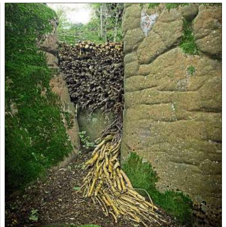
„Verfüllung/Ausfluss“ – Installation mit Naturmaterial von Werner Obländer.