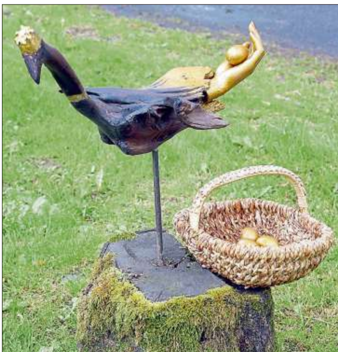
„Ganz im Glück“ von Norbert Blücher ist eines der vielen Kunstwerke.

Die Freiluftschau ist noch bis Anfang September geöffnet und wird mit einem Fest zum Finale am Samstag, 3., und Sonntag, 4. September, beendet.