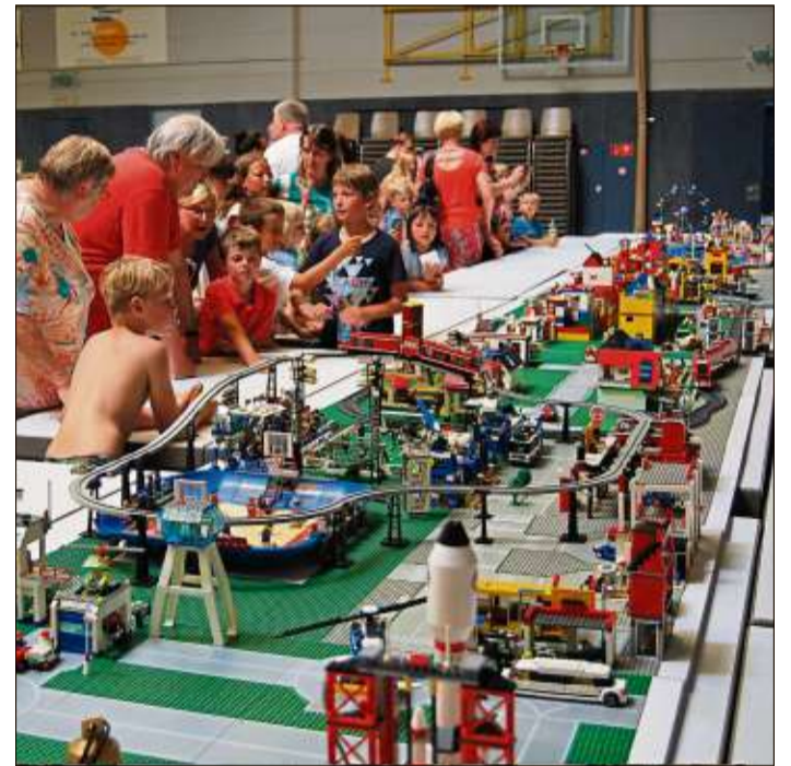
„Wir bauen eine Lego-Stadt“ war das Thema an dieser langen Tafel.

Die Graffitis zeugten vom Einfallsreichtum der kleinen Künstler. Die schönsten Graffitis können in der Steinauer Markthalle und in der Stadt bewundert werden. Vor der Halle am Steines hatten die Kinder jede Menge Spaß in den Hüpfburgen.