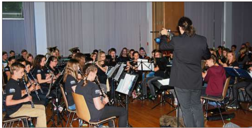
Die „Yong Band“ eröffnete das Sommerkonzert der Stadtschule.