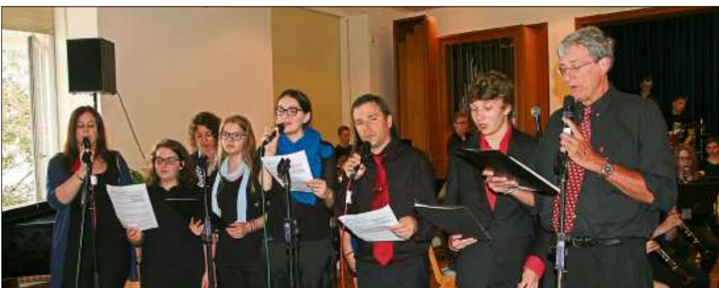
Big Band und Chor und der Song of Freedom.