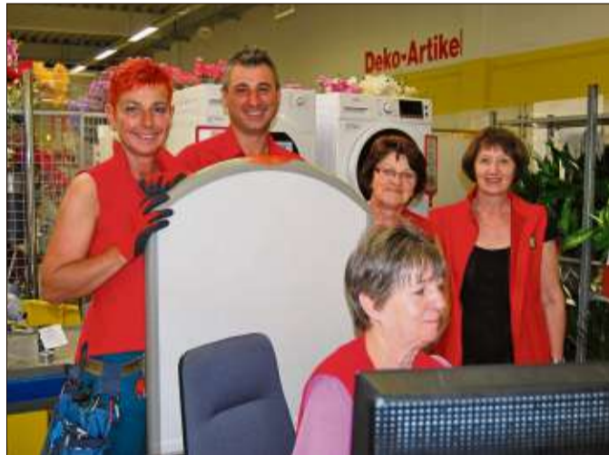
Das Team des HAFU freut sich auf das erste Sommerfest und viele Gäste.