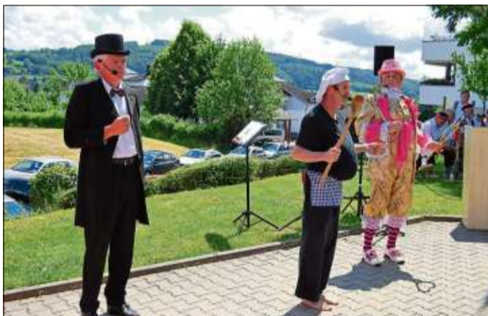
Das Hoftheater stellte des Kaisers neue Kleider vor.

Eine Ausstellung „So leben und wohnen Sie bei uns“ vervollständigte das Fest. Der „Sommer-nachtstraum“ – das Motto des diesjährigen Sommerfestes im „Haus im Bergwinkel“ – endete mit einem ökumenischen Gottesdienst.