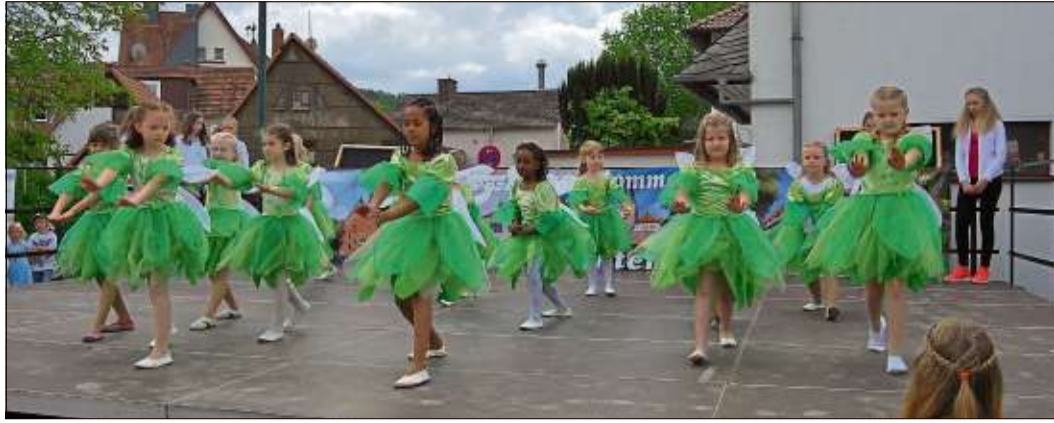
Als kleine süße Feen wirbelten die „Butterflys“ über die Bühne.

GÜLTIG AUCH IN DEN GETRÄNKESHOPS: Altengronau • Breunings • Weichersbach • Weipertz