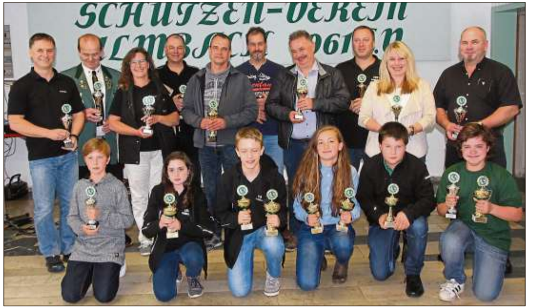
Zahlreiche Ehrungen gab es beim Kreispokalschießen.