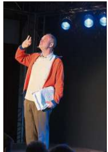
„Alfons“ begeisterte das Publikum mit seinem Programm: „Das Geheimnis meiner Schönheit“.

and man sieht Alfons auf der Leinwand mit seinem berühmten Puschel-Mikrofon durch Deutschlands Fußgängerzonen marschieren. Mit seinen herrlichen Fragen schafft er es, die deutsche Seele bloßzulegen. Nicht einmal vor Fragen zur Sexualität macht er Halt und will von einem deutschen Rentner wissen, was das Schärfste sei, das ihm seine Frau jemals präsentiert habe. Dieser antwortet: „Chili con carne.“ Das geheime Grauen von Schützenfesten, Fahrkarten-Automaten, AfD – es gibt nichts, was Alfons in seiner vermeintlich schusseligen Art nicht schonungslos offenlegt. Das Lachen könnte einem manchmal im Halse stecken bleiben.