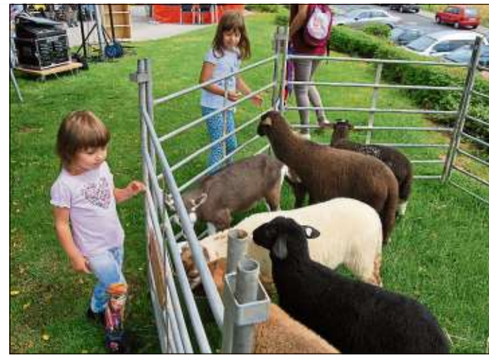
Anziehungspunkt für die Kinder war der Streichelzoo.