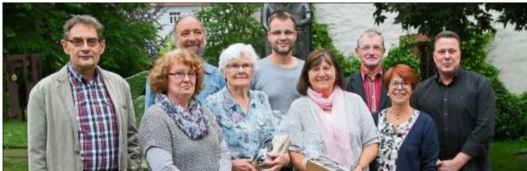
Ehrungen standen auf der Tagesordnung der Jahreshauptversammlung des Turnvereins.

Verlag H. G. Bernert Postfach 1205 63552 Geinhausen www.Wochen-Bote.de Anzeigen/Beilagen Prospektverteilung Tel. (06051) 78803-788 Fax (06051) 78803-700 Anzeigenschluss Dienstag 11.00 Uhr Beilagen- und Redaktionsschluss Montag 10.00 Uhr Info@Wochen-Bote.de Anzeigen@Wochen-Bote.de Redaktion@Wochen-Bote.de