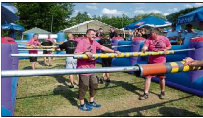
Höhepunkt bei Mauerwiese in Flammen wird wieder das Menschenkicker-Turnier sein.

Eine Initiative des Vereins WITO e.V. und des Bergwinkel Wochen-Boten