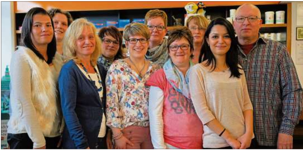
Unser Bild zeigt das Team der Einhorn-Apotheke im Jubiläumsjahr.