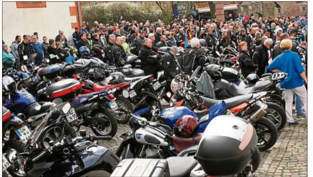
500 Biker beim Anlassen auf dem Kumpen.