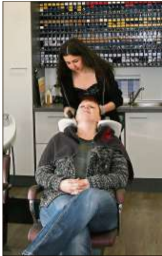
In der Hair Lounge arbeiten sechs Friseurinnen und zwei Praktikanten.

Zur Wiedereröffnung hat die Hair Lounge Roxana vom 18. April bis 31. Mai ein besonderes Angebot für Neukunden. Da gibt es Waschen, Färben, Intensivpflege mit Kopfmassage, Schneiden, Stylen schon ab 78 Euro inklusiv Gutschein für ein Wella Farbpflege-Shampoo.