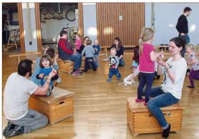
Kinder, Eltern und Großeltern hatten viel Spaß beim Frühlingsfest.

Die Kleinkinder-Turn-Angebote wie „Babys in Bewegung“ (8 Monate bis 3 Jahre) finden statt freitags von 16.30 bis 17.30 Uhr, Eltern-Kind-Turnen (3 bis 5 Jahre) von 15 bis 16.30 Uhr und Kinderturn-Club I Vorschulkind (4 bis 7 Jahre) mittwochs von 15.30 bis 17 Uhr, jeweils in der Halle am Schloss. Weitere Informationen bei Ursula Steinau, E-Mail: TV-Steinau.usteinou@gmx.de.