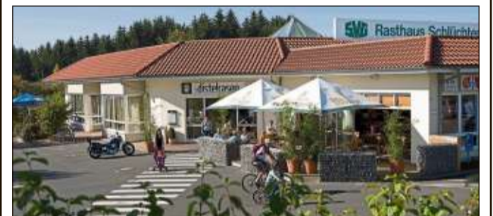
Beim ADAC-Tests von 40 Autohöfen erhielt der Schlüchterner Autohof die Note „gut“.