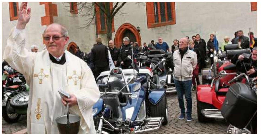
Segen für Mensch und Maschine.