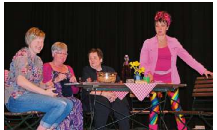
Mit einer nervigen Nachbarin befasst sich die Theatergruppe Sluohderin in der Stadthalle in Schlüchtern.

Eintrittskarten für das Theaterstück gibt es in der Rathaus-, in der Bergwinkel- und in der Lotichius-Apotheke (alle Schlüchtern), in der Tourist-Information Schlüchtern sowie an der Theaterkasse.