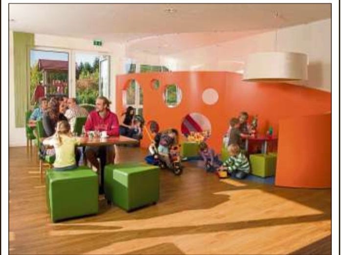
Der Autohof Distelrasen überzeugt mit freundlichem Ambiente.

Im EM-Garten mit großen Flachbildschirmen können ab Sonntag, 12. Juni, Spiele der Fußball-Europameisterschaft verfolgt werden. Dies ist auch Anlass zum bunten Familientag, bei dem das Kunterbunte Kinderzelt für Spiel, Spaß und Unterhaltung der jüngsten Gäste sorgt.