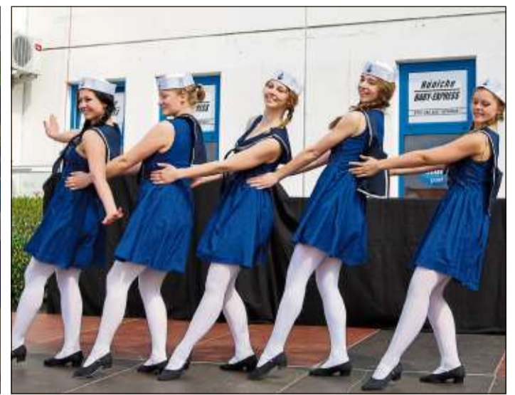
Die Damen vom Ballettsaal Opsahl erfreuten mit ihren Tänzen.