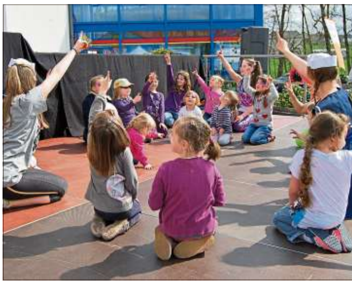
Die Kleinsten waren mit Eifer dabei, den Großen nachzueifern.