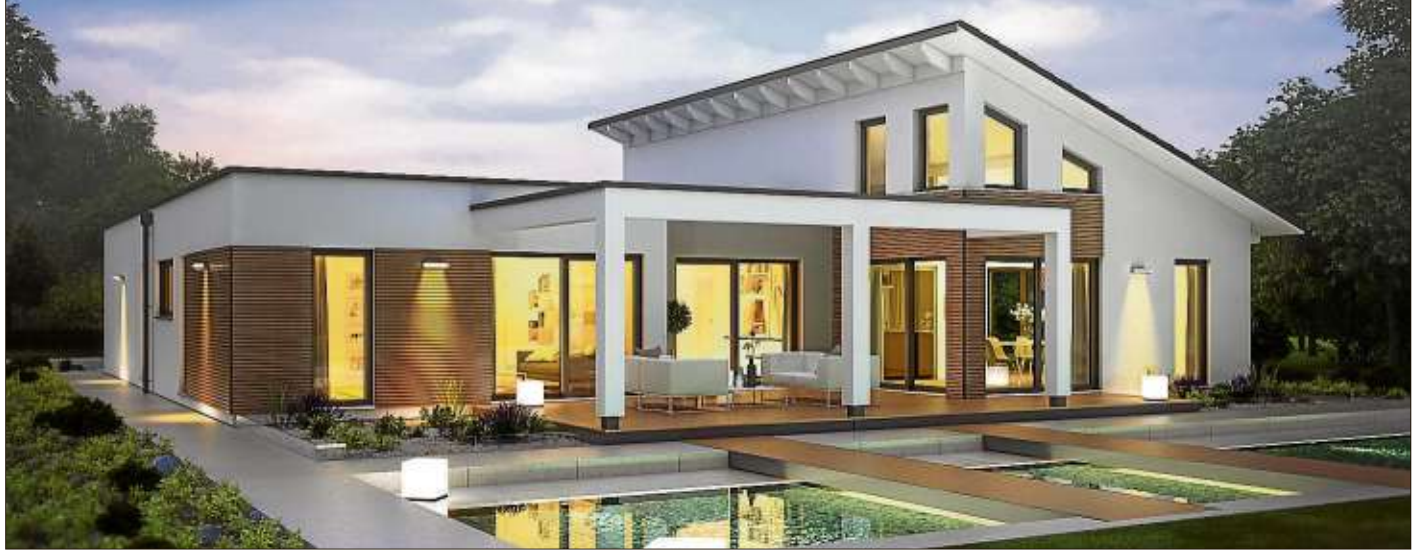
Als eines der ersten Holz-Fertigbauunternehmen bietet Rensch-Haus bereits seit letztem Jahr seinen Kunden serienmäßig das KfW-Effizienzhaus 40 an, hier das Haus Marseille L.

Generation verknüpft Rensch-Haus die Erfahrung von 140 Jahren mit innovativer Technik und zukunftsweisenden Baukonzepten. Das moderne und kompetente Fertighaus-Unternehmen bietet eine hohe Bauqualität für individuell geplante Häuser, abgestimmt auf die persönlichen Kundenbedürfnisse. Keine Massenproduktion, sondern eine Haus-Manufaktur mit ausschließlich nachhaltiger Produktion in Deutschland. Eine hohe Servicequalität mit Beratung, Termisicherheit, Gewährleistung und Kundendienst ergänzen die Bauleistungen.