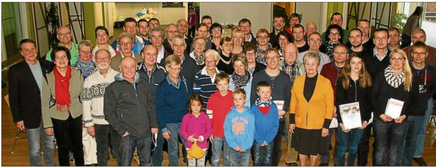
66 Erwachsene und 14 Jugendliche legten im Stützpunkt Salmünster das Sportabzeichen ab.