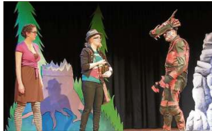
Julia und Schneider Tom überlisten den Drachen Dragomir.

Weitere Aufführungen gibt es am Freitag, 11. März, um 19 Uhr und am Samstag, 12. März, um 15 Uhr im Spessart Forum.