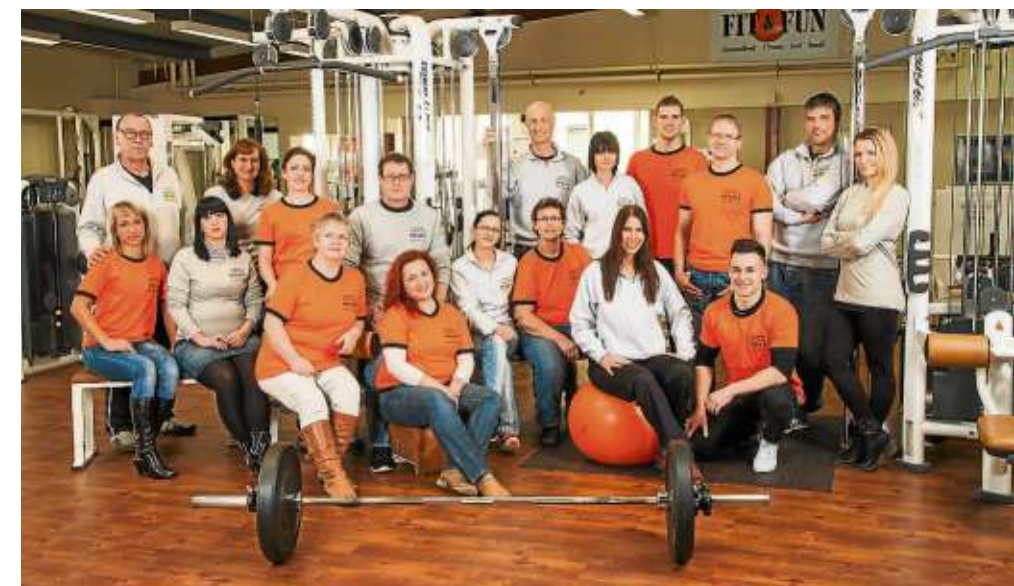
Ein kompetentes und motiviertes Team kümmert sich im Fit & Fun um die Trainierenden.

Apropos Kurse: Insgesamt 30 verschiedene Einheiten gibt es pro Woche, auch Samstag und Sonntag. Es ist eine große Vielfalt, wo jeder et-