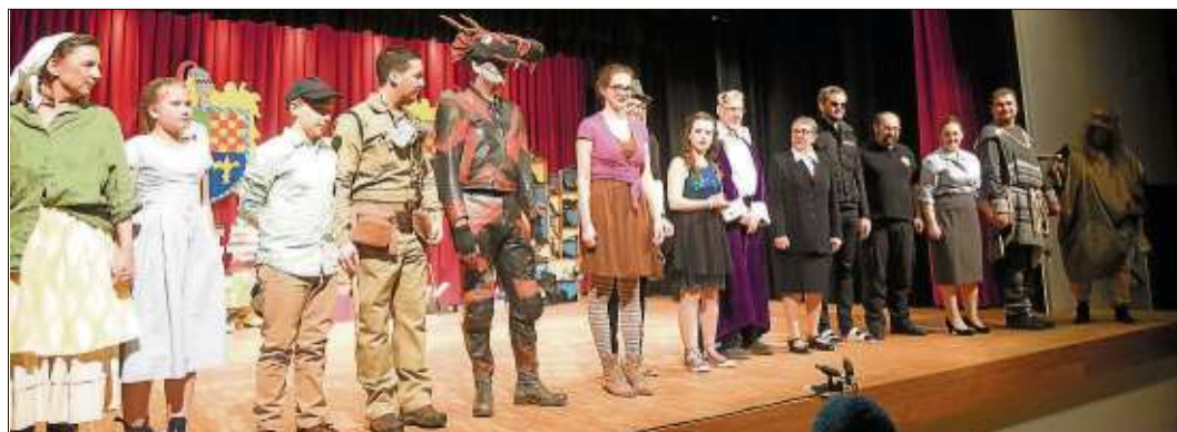
Viel Applaus belohnte die schauspielerische Leistung der Darsteller.