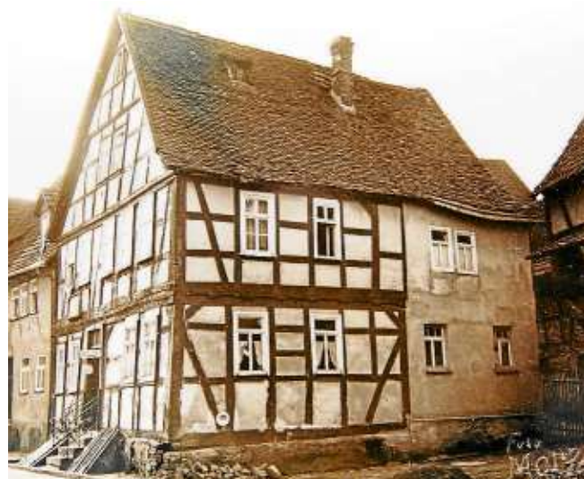
Zwischen 1951 und 1953 wurden im ehemaligen Wohnhaus der Grimms am Brückentor 7 Haare geschnitten.