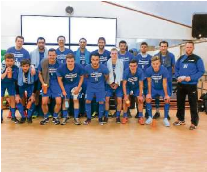
Auch viele Vereine, hier die 1. Mannschaft von Buchonia Flieden, nutzen für die Vorbereitung das umfassende und abwechslungsreiche Trainingsangebot des Studios.

Im Laufe der Zeit wurde viel Geld für Umbaumaßnahmen und Verbesserungen aufgewandt, ständig in neue und innovative Trainingsgeräte investiert. Die größte Aktion datiert auf das Jahr 2002, als ein kompletter Anbau entstand, inklusive neuen Umkleieräumen, Duschen, Toiletten und einem attraktiven, großen Saunabereich. Rund 400 Quadratmeter kamen auf diese Weise