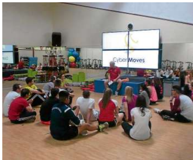
Die diversen Trainingsmöglichkeiten werden regelmäßig von den Schulen im Rahmen des Sportunterrichts genutzt.

Auch die Angestellten arbeiten gerne in dem Sportstudio: Viele sind schon über zehn Jahre im „Fit & Fun“ tätig, das verkehrstechnisch