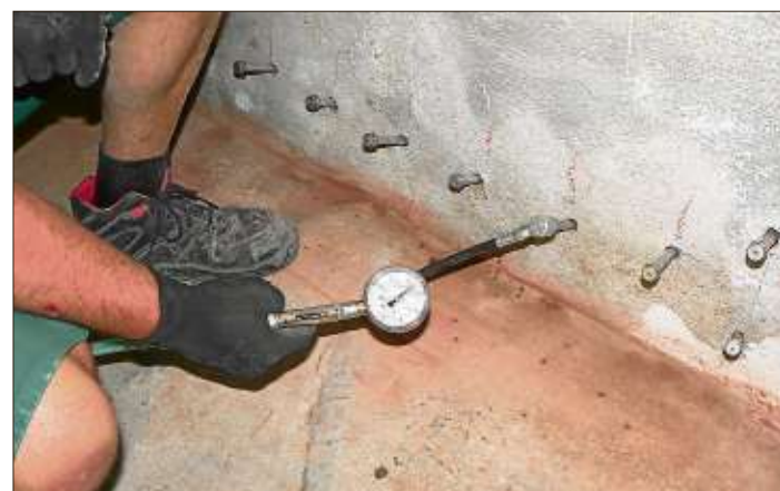
Beim Veinal®-Silikonharzsystem werden Injektionsmittel über Bohrkanäle in das Mauerwerk eingebracht.

Zunächst wurden in Sockelhöhe rund ums Haus im Abstand von wenigen Zentimetern Bohrkanäle in die Außenmauern gesetzt. Eine weitere Vorbehandlung war nicht nötig. Wegen der teils starken Durchfeuchtung der Vollziegelmauern entschieden die Fachleute vor Ort, die Injektion zusätzlich mit Druck durchzuführen. Nach zwei Tagen waren die Sperrn voll ausgebildet und funktionsfähig, die Mauern begannen zu trocknen. „Wir sind in jeder Hinsicht sehr glimpflich davongekommen. Letztendlich ging die Mauerentfeuchtung dann doch wesentlich zügiger und stressfreier, als bei der ersten Bestandsaufnahme befürchtet“, zeigt sich das Ehepaar erleichtert. Danach folgten die Renovierung des Innenbereichs und die Fassadendämmung. Der Anbau, den Silkes Großvater in den 80er Jahren errichtete, dient heute als kombiniertes Schlaf-Ankleide-Zimmer. Hier sorgen diffusionsoffene Kalziumsilikatplatten von Veinal nicht nur als wohngesunde Innendämmung für Behaglichkeit, sondern auch für zusätzlichen Schutz gegen Kondensfeuchtigkeit. Damit die schlaflosen Nächte ein für alle Mal ein Ende haben.