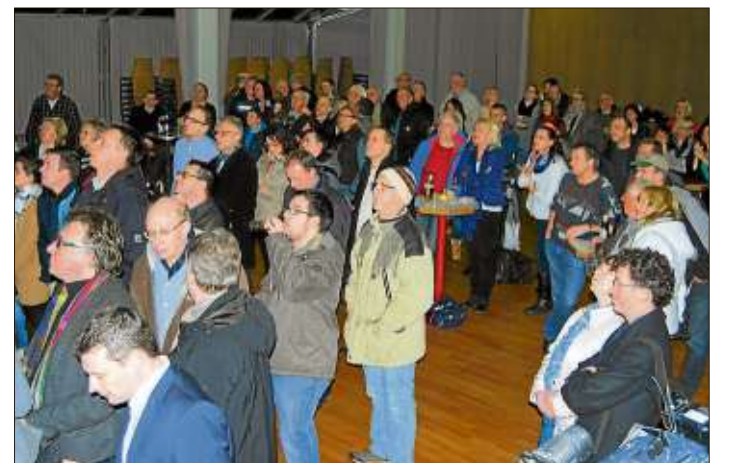
Mehr als 100 Wähler waren in die Stadthalle gekommen, um die Auszählung der Wahlbezirke live miterleben.