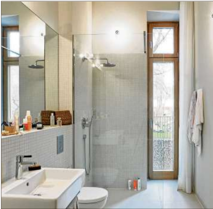
Die Wärme im Bad lässt sich mit dem Smartphone steuern

RWE SmartHome funktioniert nach dem Baukasten-Prinzip: Welche Geräte miteinander sprechen sollen, entscheidet jeder für sich. Praktisch ist auf alle Fälle die Fernsteuerung von unterwegs. Denn so hat man das Zuhause per Smartphone-App immer im Blick und kann mit einem Knopfdruck die Heizung, Licht oder Geräte ein- und ausschalten. Weitere Informationen, Aktionsangebote und Anwendungsbeispiele sind unter www.rwe-smarthome.de zu finden.