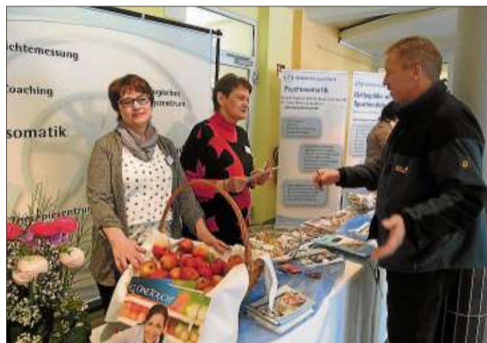
Beratung am Stand der Median-Kinzigtalklinik.