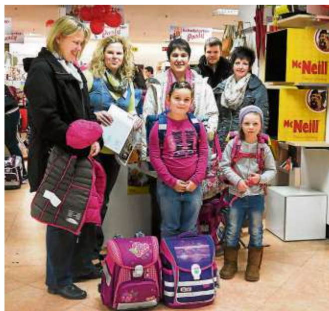
Glückliche Kinder und zufriedene Eltern – an den Schulstarter Tagen findet jeder den perfekten Begleiter für den Schulalltag.

Samstag, 13. Februar: unterstützende Fachberatung der Firmen Step by Step, Scout und Pelikan sowie Kinderschminken mit Sunnyfaces.