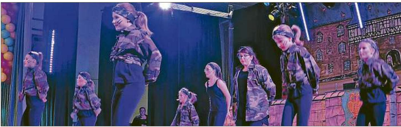
Die roten Funken des SKV präsentierten einen „Army-Tanz“.