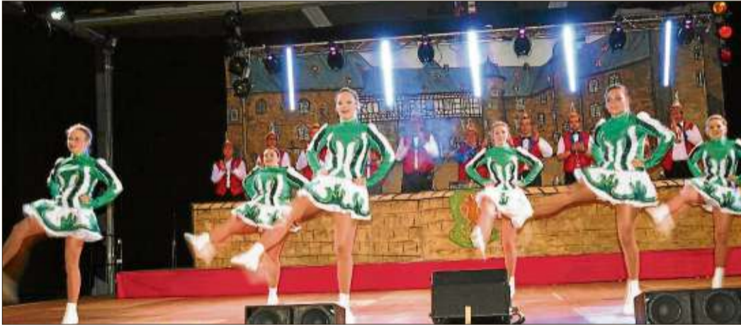
Einen gelenkigen Gardetanz boten die „Grünen Funken“.