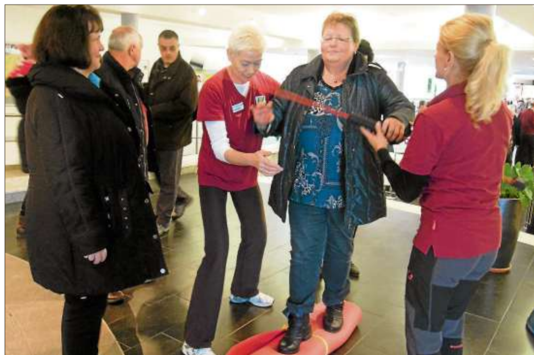
Sportlich betätigten sich Interessierte am Stand der Reha-Klinik Bellevue.