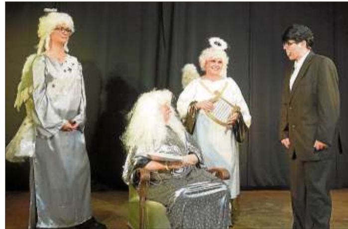
Beim Sketch „Petrus und die außergewöhnlichen Fälle“ waren mutige Entscheidungen gefragt.