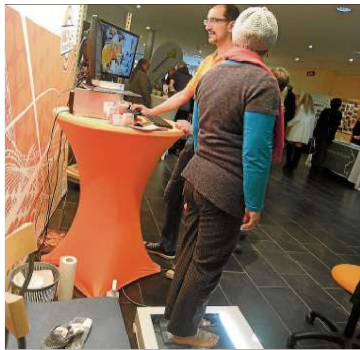
Einen intensiven Fuß-Check bot das Vitalzentrum Ruppert an.