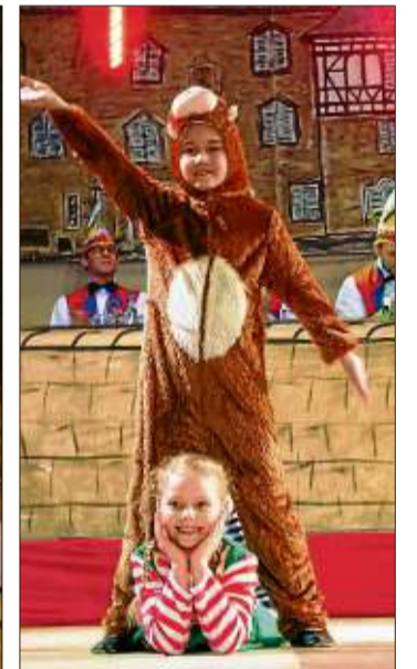
Die süßen Mini Funken mit ihrem Tanz „Pippi Langstrumpf“.