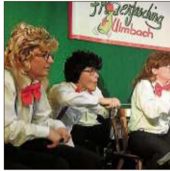
Ein großartiger Klangkörper: Das „Luftpumpenorchester“ Ulmbach.