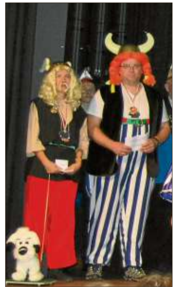
Asterix, Obelix und Idefix führten durch das Kinderprogramm.

Das Fitnessstudio „Formidabel“ in Schlüchtern zeigte „Zumba for Kids“. Mit ihrer Trainerin Tanja Habermann zeigten die Kinder, dass sie können, was die Großen können. Bevor die Kinderdisco mit fetziger Musik und Enrico Weider sowie einem großen Finale angesagt wurde, setzte die „Rasselbande“ mit einem Tanz den Schlusspunkt unter das Bühnenprogramm.