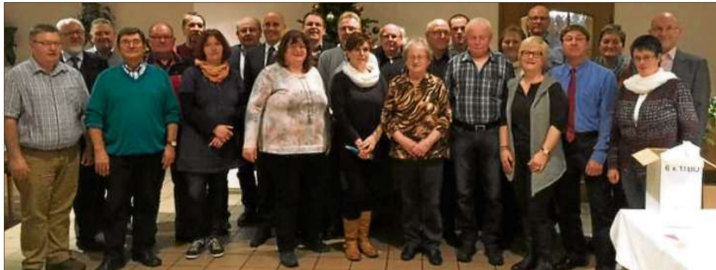
Die Kandidaten für die Kommunalwahl am 6. März stehen fest.

Zahnarzt: Für Notfälle außerhalb der Sprechzeiten ist der diensthabende Arzt über die Zentrale Notdienst-Nummer für den Bereich Zahnmedizin, Telefon (0 18 05) 60 70 11, zu erfragen.