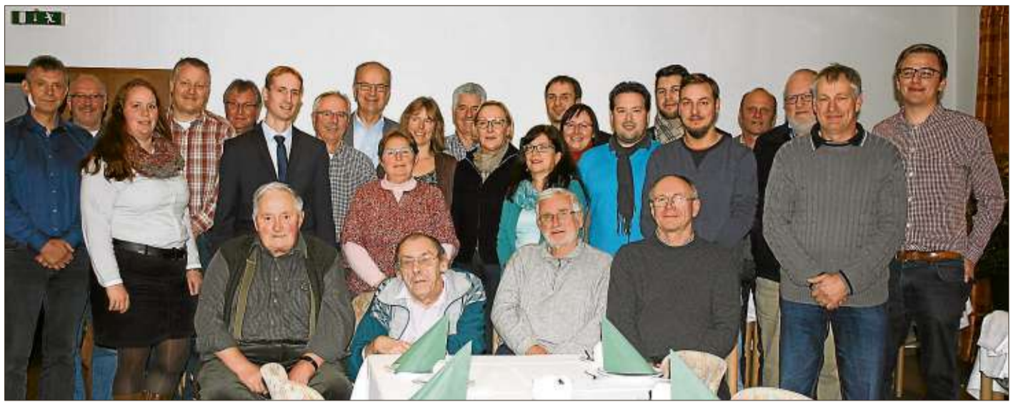
Mit 39 Kandidatinnen und Kandidaten ist die neue Liste sehr breit aufgestellt.