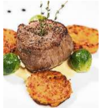
Das Auge isst mit.

Bad Soden-Salmünster (rs). Das Vier-Sterne-Hotel Birkenhof in Bad Soden-Salmünster bietet moderne Räumlichkeiten für Veranstaltungen bis zu 120 Personen an. Egal, ob ein gemütliches Sekstfrühstück, eine romantische Hochzeitsfeier oder eine lockere Grillparty auf der Dachterrasse, Familie Grauel und ihr Team finden den perfekten Rahmen für Ihre Wünsche.