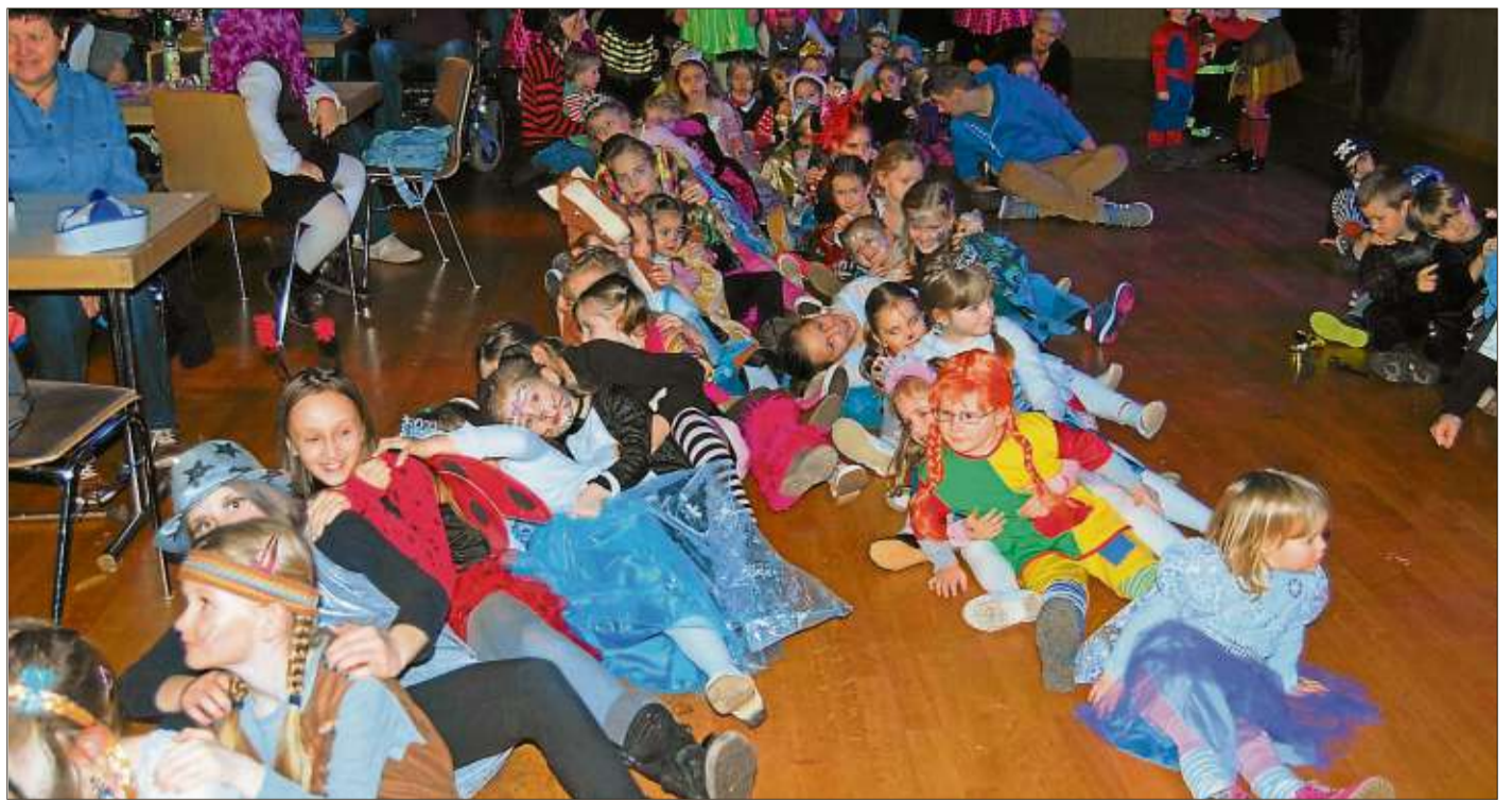
Riesenspaß hatten die kleinen Narren beim Selbstmitmachen.

GÜLTIG AUCH IN DEN GETRÄNKESHOPS: Altengronau • Breunings • Weichersbach • Weipertz