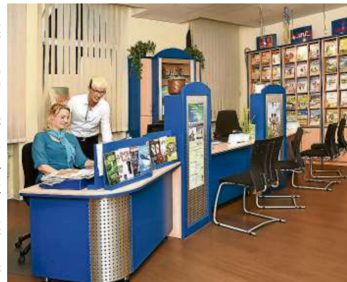
Den Jahreskatalog gibt es kostenlos in den Happ-Reisebüros.

Wichtig für das Gelingen einer Reise ist neben einer guten Unterkunft auch das Transportmittel bei der Ab- und Anreise. Hier verfügt das Reisebüro Happ neben hervor-