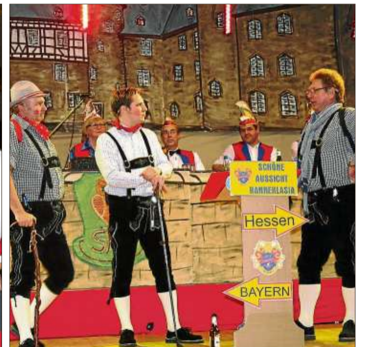
Drei Mochtegern-Bayern waren in Hessen unterwegs.