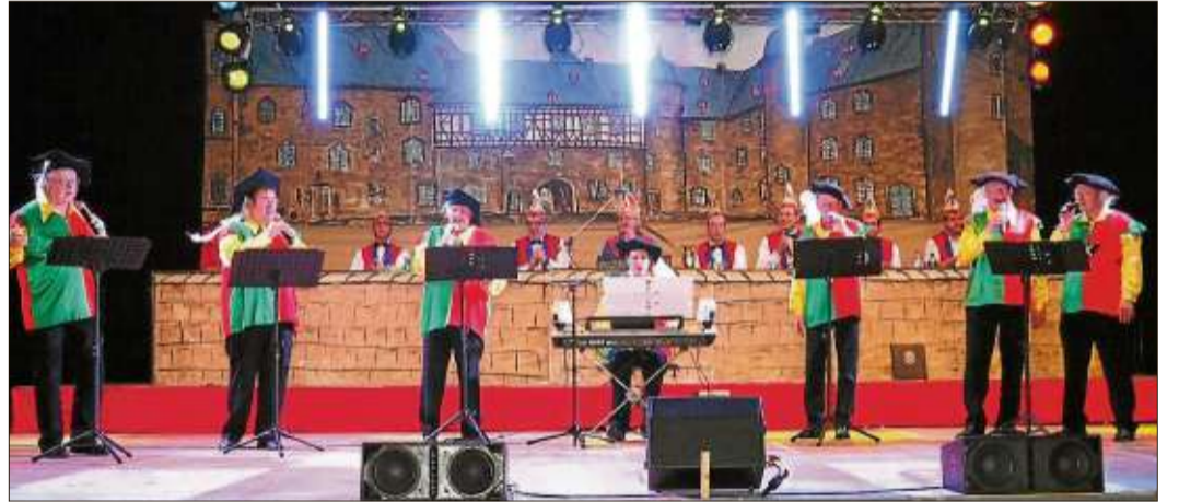
Die Steinauer Bänkelsänger sangen über aktuelle Geschehnisse in Steinau. So mancher bekam da sein Fett weg.