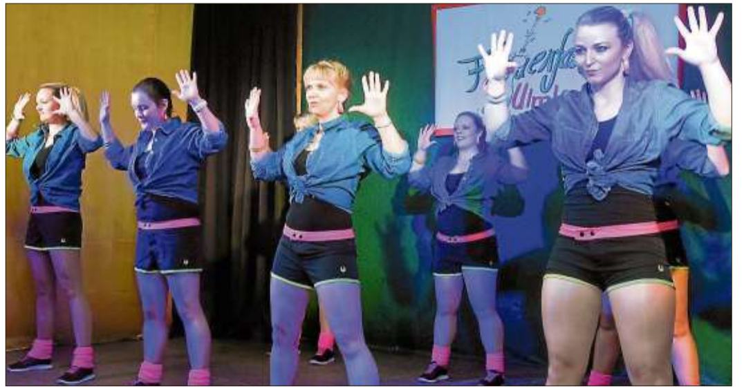
Die Tanzgruppe „Surprise“ begeisterte beim Frauenfasching.