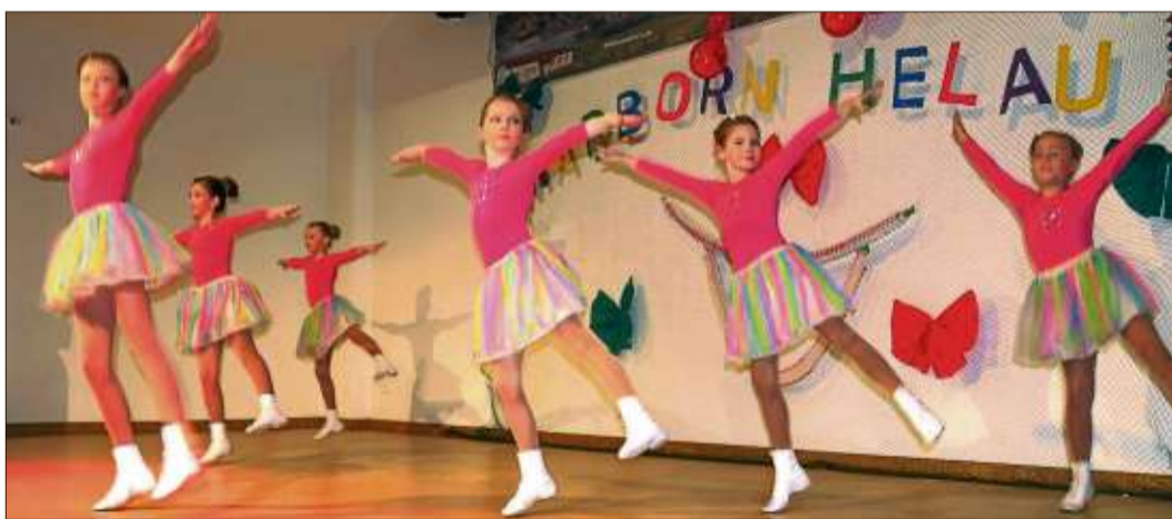
Den Mädchen der Marborner Sternchen macht das Tanzen sichtlich Spaß. Mit einem Lächeln im Gesicht tanzten sie synchron und ohne Fehler auf der großen Bühne.