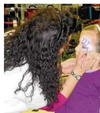
Kinderschminken mit Sunnyfaces passend zu dem Lieblings-Schulranzenmotiv.

Schlichtern (rs). Endlich ist es wieder so weit: Das Langer Einkaufsland in Schlichtern lädt von Donnerstag, 11., bis Samstag, 13. Februar zur großen Schulstarter-Party ein. Ob glitzernde Feen, niedliche Kätzchen und Rehe, Polizei, Feuerwehr, schnelle Autos oder wilde Dinosaurier – der Fantasie bei den Schulranzenmodellen von 2016 sind keine Grenzen gesetzt.