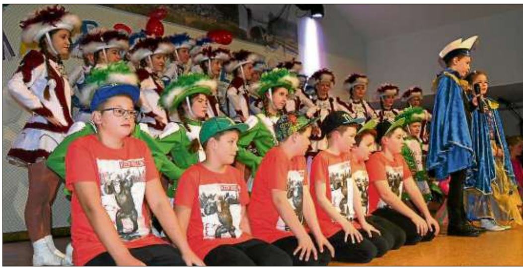
Prinzessin Saskia I. und Prinz Laurenz I. marschieren mit den Marborner Gardegruppen zum Auftakt auf die Bühne.