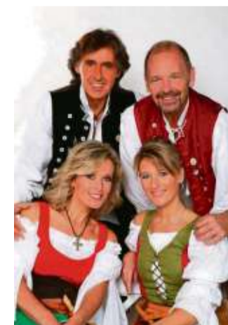
Patrick Lindner, Die Schäfer und Angela Wiedl sind live dabei!

Ein großes Aufgebot an Stars bekommen alle Fans der Volksmusik am Do., 3. 3. 16, um 19.30 Uhr in der Stadthalle Schlüchtern bei „Die Sternstunden des volkstümlichen Schlagers“, dem großen Fest der Volksmusik, geboten. Hier präsentieren Ihre Fernsehlieblingstars erstklassige Musik, große Hits aus Volks-