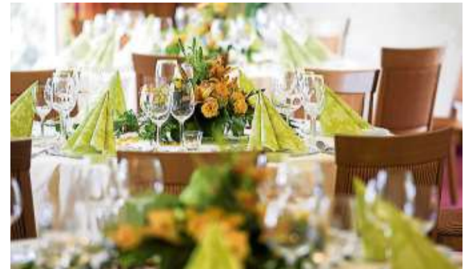
Die stilvoll eingedeckten Tische laden zum Genießen ein.

*** Lauwarmes Orangen-Nougatörtchen mit kandiertem Kakifächer