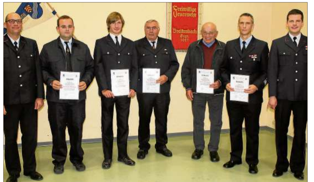
Langjährige Mitglieder wurden beim Kommers zum 90-jährigen Jubiläum der Feuerwehr Breitenbach geehrt.