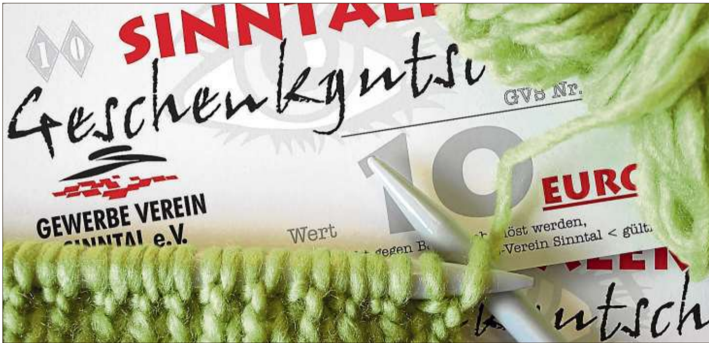
Erika's Woll-Nestchen in Altengronau ist neben den ortsansässigen Banken und der Sparkasse, der Gemeindeverwaltung und Euronics-Simon eine der Ausgabestellen des „Sinntalers“.