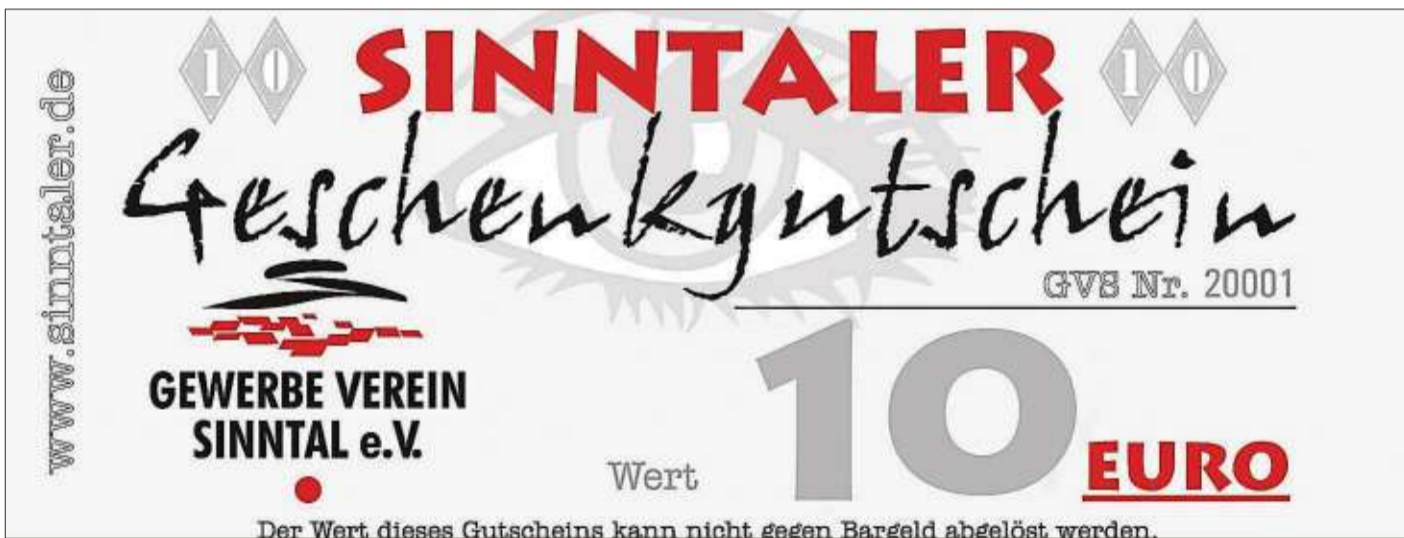
Den „Sinntaler“ gibt es als 5-, 10- oder 20-Euro-Gutschein.

Service und Qualität werden groß geschrieben. „Die Mund-zu-Mund-Propaganda ist für uns die beste Werbung“, so der Vorstand. Diese Tradition wird auf jeden Fall fortgesetzt. Alles Gute dem „Sinntaler!“