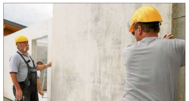
Montage einer fertigen Wand.

ses Info-Material zum neuen Massivbausystem – nach dem neuesten Stand der Technik – bekommt man auf www.dennert-baustoffe.de.