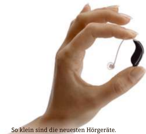
So klein sind die neuesten Hörgeräte.

Heini Weber steht schon seit über 85 Jahren für Akustik-Kompetenz im Raum Kassel. Ob beim Hörtest, bei der Hörgeräteanpassung oder Gehörschutz – bei allen Fragen rund ums bessere Hören sind die Akustiker von Heini Weber die richtigen Ansprechpartner.