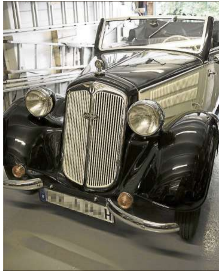
Ein DKW F8-700 Front Luxus Cabriolet aus dem Jahre 1940.

Die Teams von sixeyesmedia in Schlüchtern und Bergwinkel Wochen-Bote wünschen noch viele Jahre unfallfreien Fahrnuss.