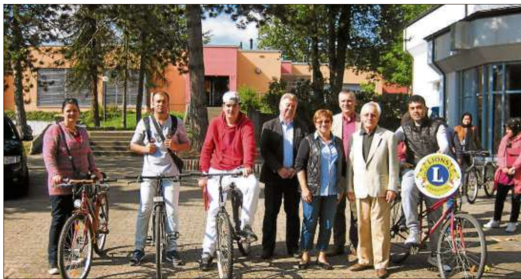
Mit gebrauchten Fahrrädern unterstützt der Lions Club Asylbewerber und Flüchtlinge.