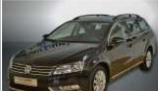
Deep Black Perleffekt

VW Passat Variant 2.0 TDI Comfortline Diesel, 103 kW (140 PS) EZ: 05/2013, 80.960 km DSG-Automatik, Navi, Tempomat, 2-Zonen-Klima, Sitzheizung, Parkensensoren vorne und hinten... nur 18.930,- €