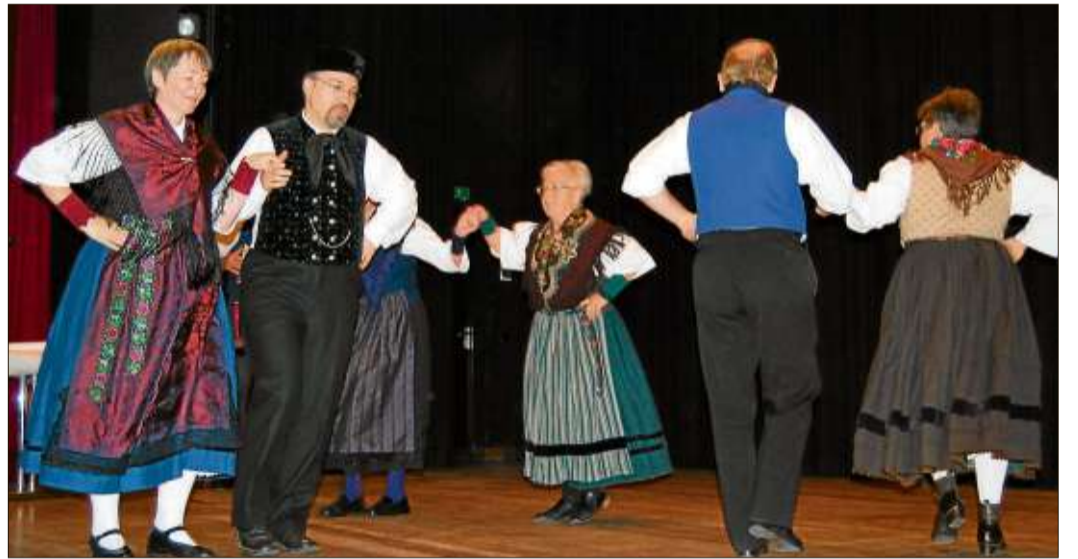
Die Trachtengruppe des Vereins 1200 Jahre Elm tanzte bei der Abschlussveranstaltung.

Der Heimat- und Geschichtsverein nahm die Kiste wieder an sich. Die Gäste wurden von den Mitarbeitern der Stadtverwaltung mit Würstchen, Brezeln und Getränken auf Kosten der Stadt bewirtet.