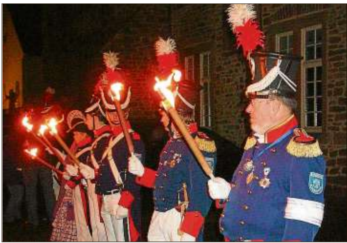
Die Historische Bürgergarde wird Spalier stehen und den Eingang mit Fackeln erleuchten.