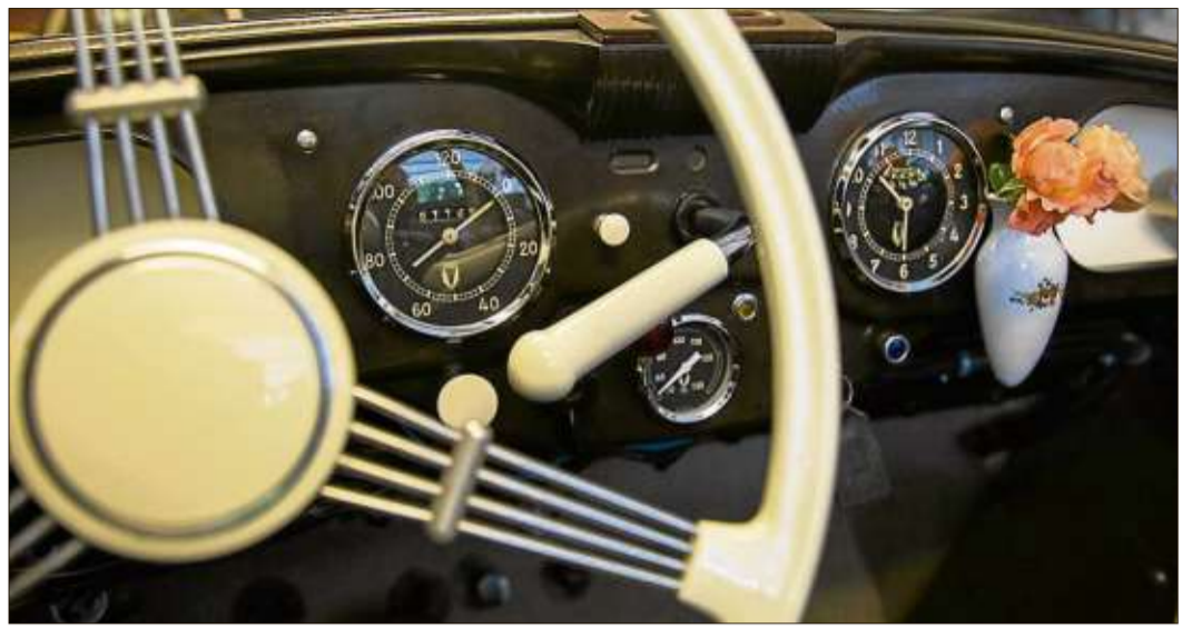
Das Design der verschiedenen Instrumentenanzeigen wurde nach genauen Vorgaben des Kunden vereinheitlicht.