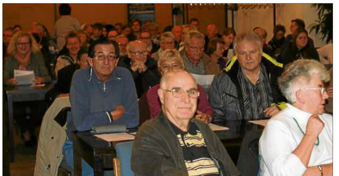
Der Andrang bei der Bürgerversammlung war groß.