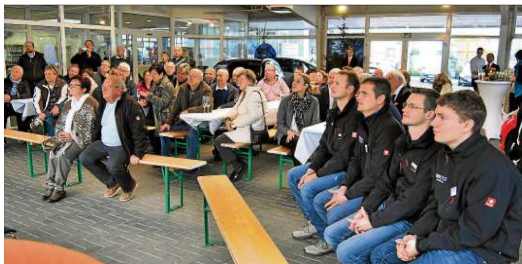
Zahlreiche Gäste waren zum 50-jährigen Jubiläum von Ford Sorg gekommen (rechts die Mitarbeiter des Hauses).

Mit der Kinderakademie Fulda konnten die Kinder in mehreren Kinderworkshops Autos basteln. Als Hauptpreis der großen Tombola winkte ein Ford Fiesta, den der Gewinner für ein Jahr, inklusive Steuern und Versicherung, fahren kann. Der Erlös der Tombola sowie der Erlös aus dem Verkauf von Speisen und Getränken geht an die Lebenshilfe Schlüchtern.