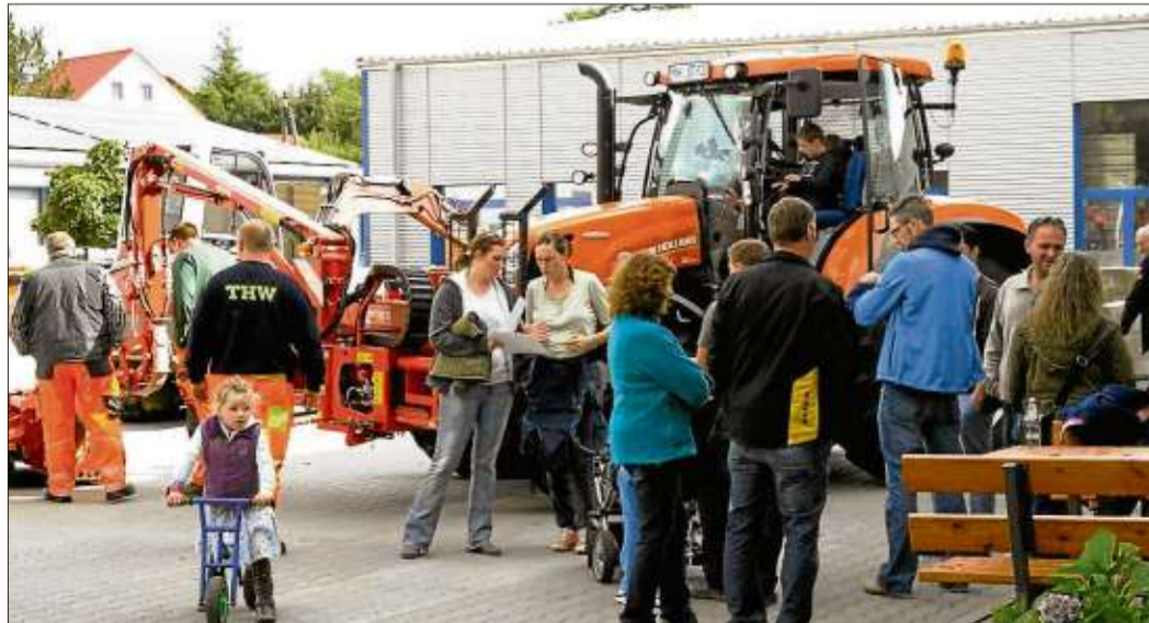
Viele Interessierte folgten der Einladung des städtischen Bauhofs in Steinau und entdeckten die Räumlichkeiten und Fahrzeuge.

ausstellung bekamen die Besucher Einblicke in die geleistete Arbeit. In den Räumen des Bauhofes befindet sich auch ein Teil des städtischen Archivs. Für die Kinder gab es neben den vielen Entdeckungen auch eine Hüpfburg, die das Technische Hilfswerk stellte. Die Ortsgruppe Steinau des Technischen Hilfswerks sorgte für das leibliche Wohl. Bei frisch gegrilltem Fleisch und kalten Getränken oder einer schönen Tasse Kaffee und einem leckeren Stück Kuchen konnte man es sich gut gehen lassen.