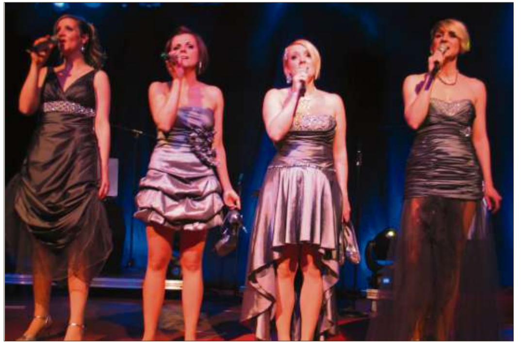
Ein musikalisches Erlebnis: Die „Medlz“ in der Steinauer Katharinenkirche.

„Steinau, es war ein Fest! Es war ein innerliches Gänseblümchenpflücken“, verabschiedeten sich die „Medlz“ nach dem begeisterten Applaus des Publikums und reichlich Zugaben. Ja, es war ein musikalisches Fest, das sahen die Zuschauer wohl ebenso.