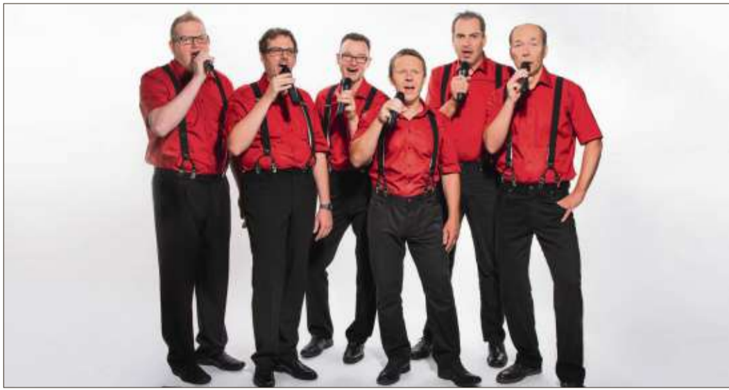
Die sechs Vokalartisten von „Alemundo“ sind in der Marborner Begegnungsstätte zu Gast.