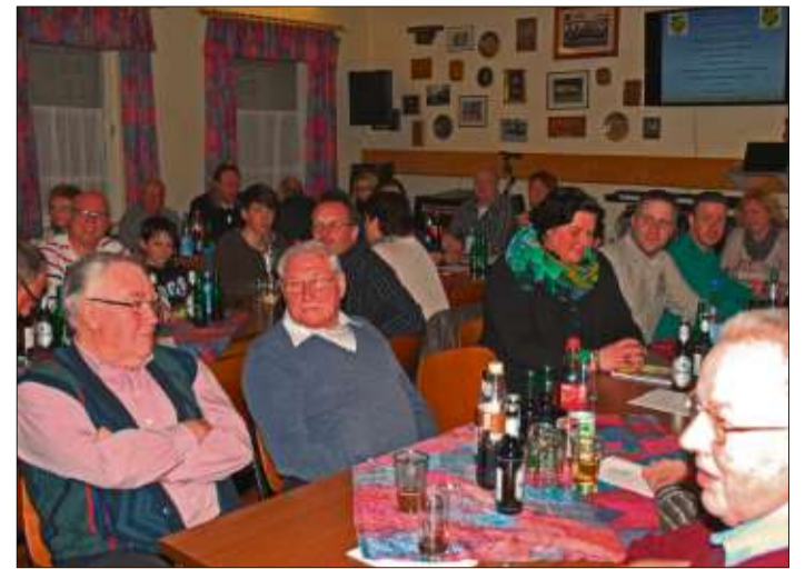
Gut besucht war die Jahreshauptversammlung des Musikvereins Weiperz.