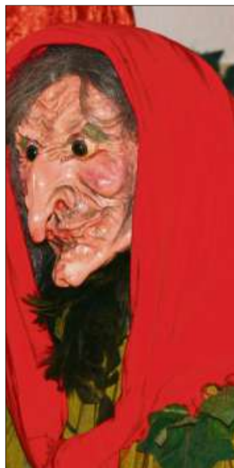
Die Hexe aus „Hänsel und Gretel“ bleibt die Lieblingsfigur der Künstlerin.