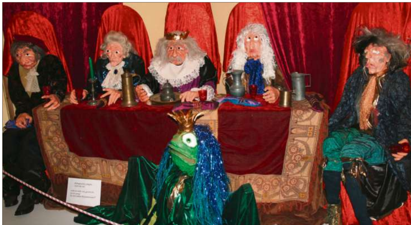
Die Königstafel und der Froschkönig.