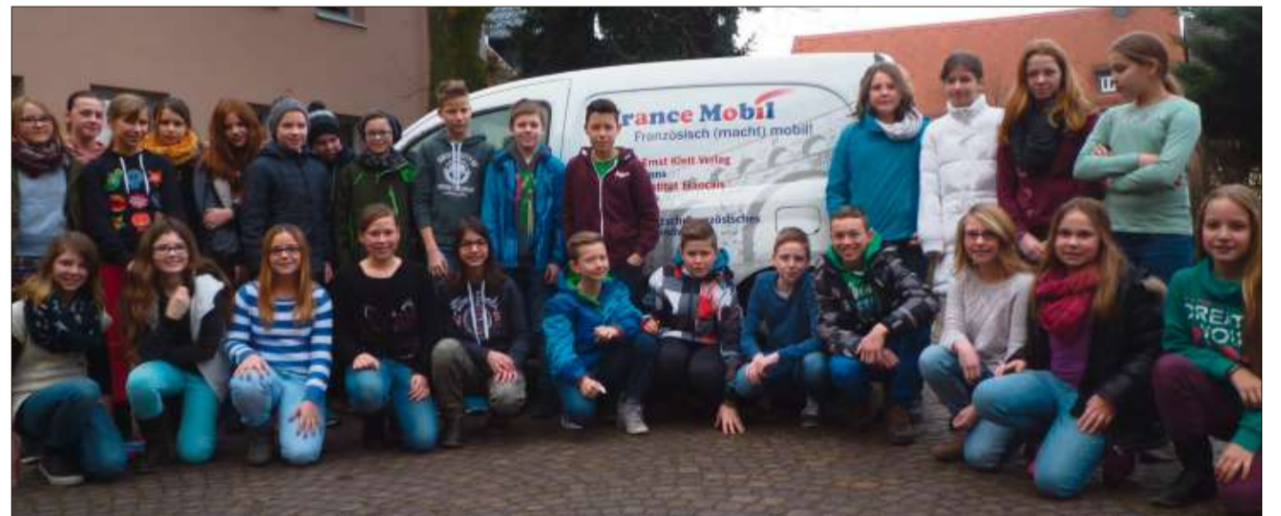
Die Sechstklässler beschäftigten sich einen Vormittag mit der französischen Sprache.

Alle Kompetenzbereiche einer modernen Fremdsprache wurden dabei berücksichtigt – es wurde gesprochen, geschrieben, gehört und gelesen und am Ende stellte sich heraus, dass es viele Vorteile hat, die Sprache unserer französischen Nachbarn zu erlernen.