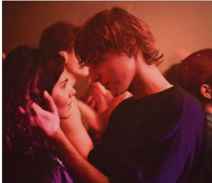
Fünf Freunde im Leipzig der Nachwendzeit: Andreas Dresens packendes Coming-Of-Age-Drama „Als wir träumten“ ist am Sonntag, 12. April, um 20 Uhr im KUKI zu sehen.

Karten gibt es an der Abendkasse im evangelischen Gemeindezentrum, Kirchstraße 32. Tickets können unter Telefon (06661) 608-410, täglich von 10 bis 12 Uhr, oder im Internet unter www.kukikino.de reserviert werden. Kinogutscheine sind in der Schlüchterner Buchhandlung „Karmann's Schöne Seiten“ erhältlich.