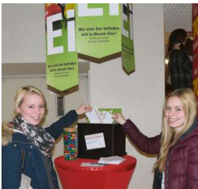
Die beiden jungen Damen schätzen die Anzahl der bunten Schokoladen-Ostereier.