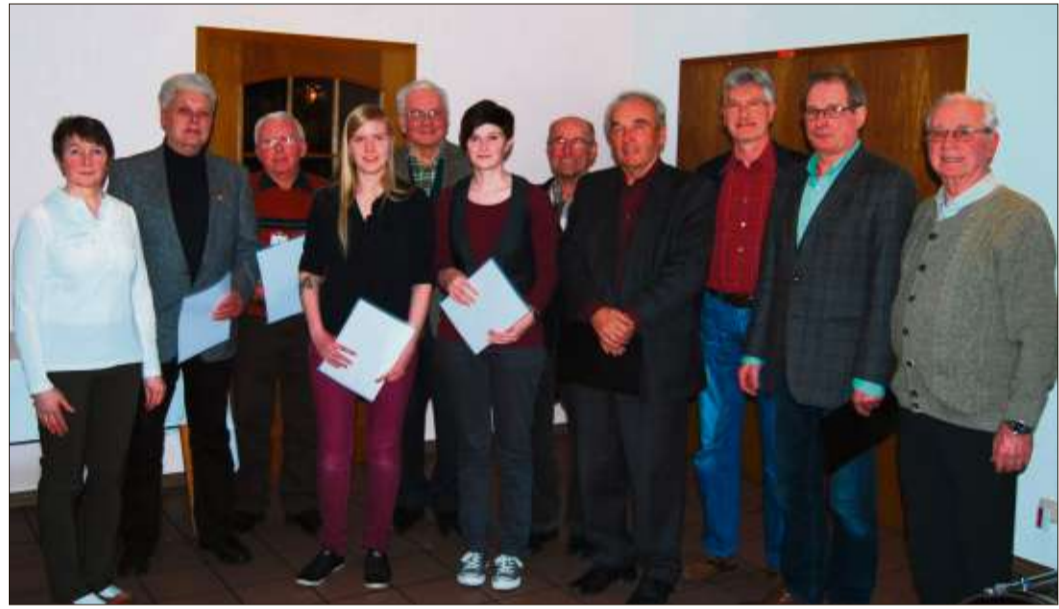
Zahlreiche Mitglieder wurden für ihre langjährige Treue zum Verein ausgezeichnet oder zu Ehrenmitglieder ernannt.