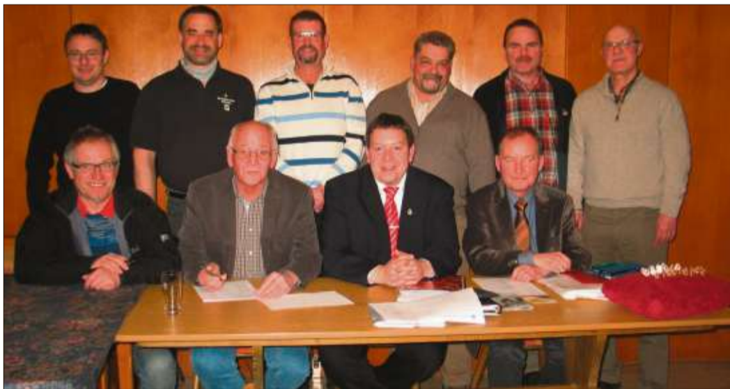
Mit diesem Vorstandsteam geht der Männerchor Frohsinn Bad Soden ins Jubiläumsjahr 2016.

Immer einen Stein(ent)wurf voraus ... ■ Individuelle Grabmale ■ Wohnen mit Naturstein ■ Kreative Außengestaltung