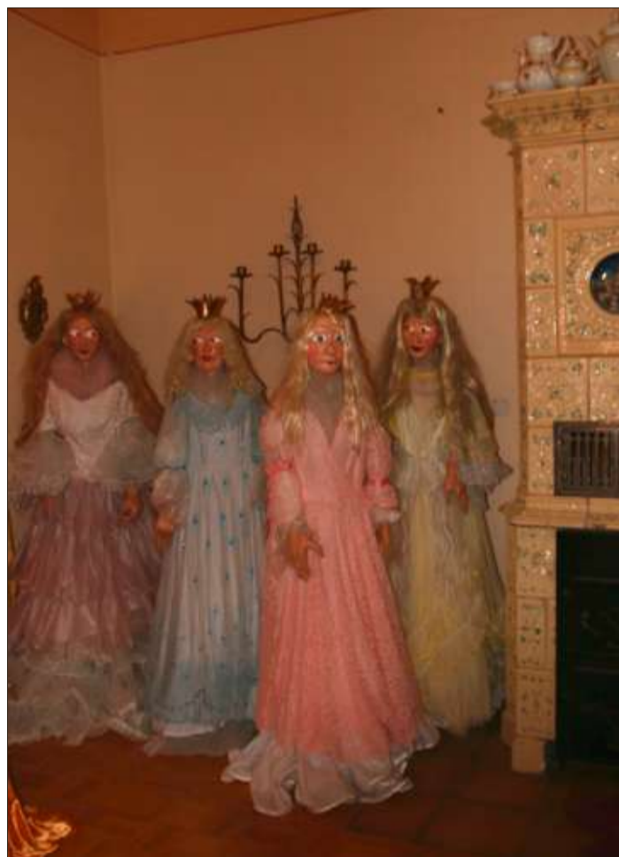
Eine Szene auf dem Märchen „Die zertanzten Schuhe“.