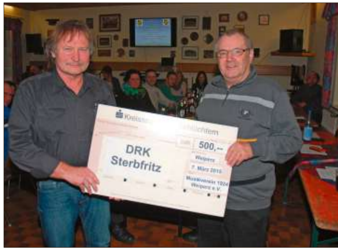
Eine 500-Euro-Spende erhielt das DRK Sinntal.

Bad Soden-Salmünster (rs). Der VdK-Ortsverband Salmünster sucht noch Teilnehmer für die vom Busunternehmen Klüh angebotene Halbtagesfahrt am Freitag, 24. April. Der Reisepreis beträgt 26 Euro pro Person. Im Reisepreis enthalten sind die Busfahrt und eine Schifffahrtsrundfahrt auf dem Main. Nähere Information bei F. Buse, Telefon (06056) 919596, oder G. Koch, Telefon (06056) 2465.