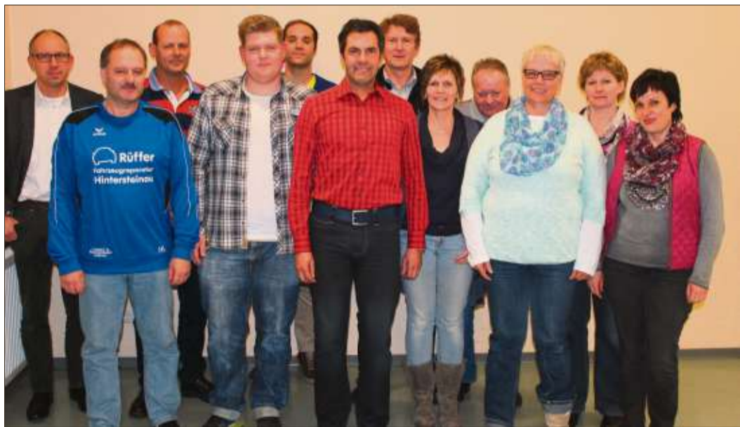
Der in der Jahreshauptversammlung des SV Breitenbach neu gewählte Vorstand.