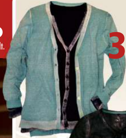
Cardigan cool wash