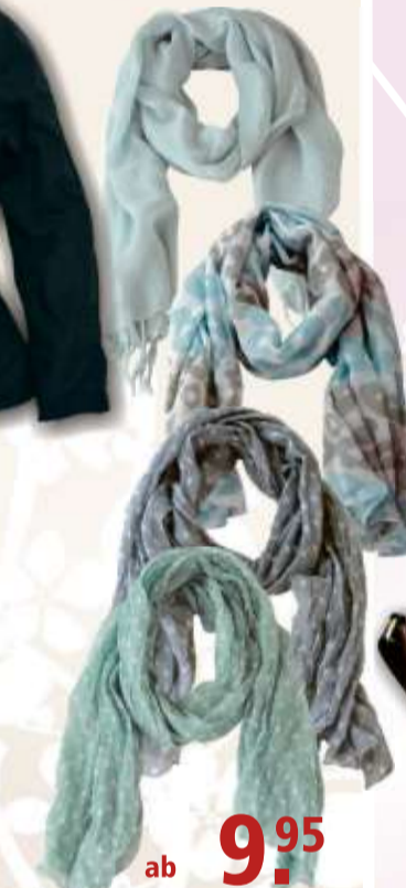
Schals viele Farben, verschiedene Dessins und Ausführungen