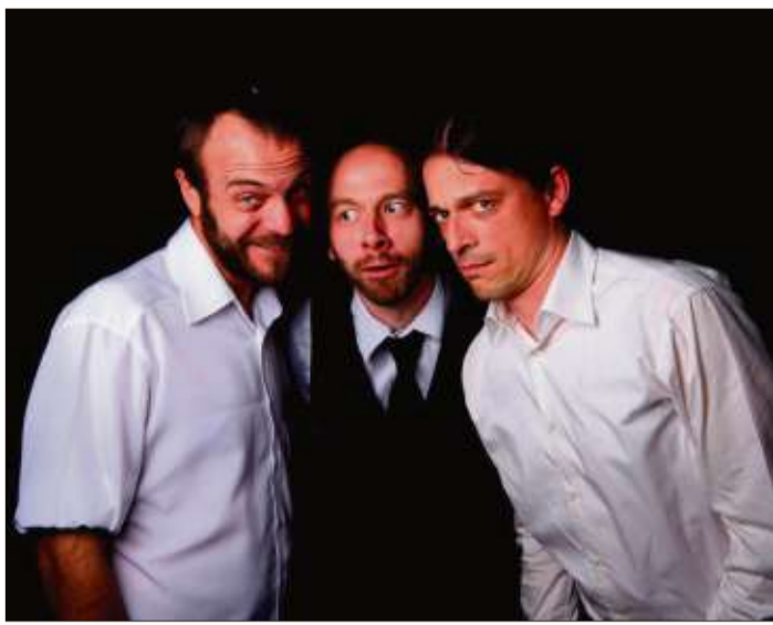
Die Sono-Bar feiert am Freitag, 13. März, ihr fünfjähriges Bestehen, und die Band Pap's Blue Ribbon wird den Partygästen ordentlich einheizen.