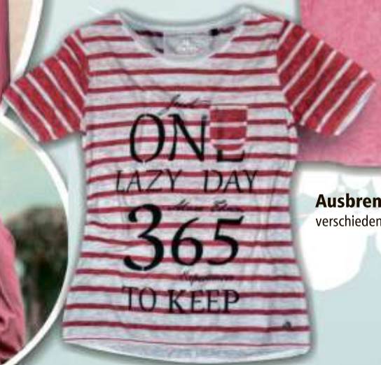
Ausbrenner-Shirt verschiedene Modelle