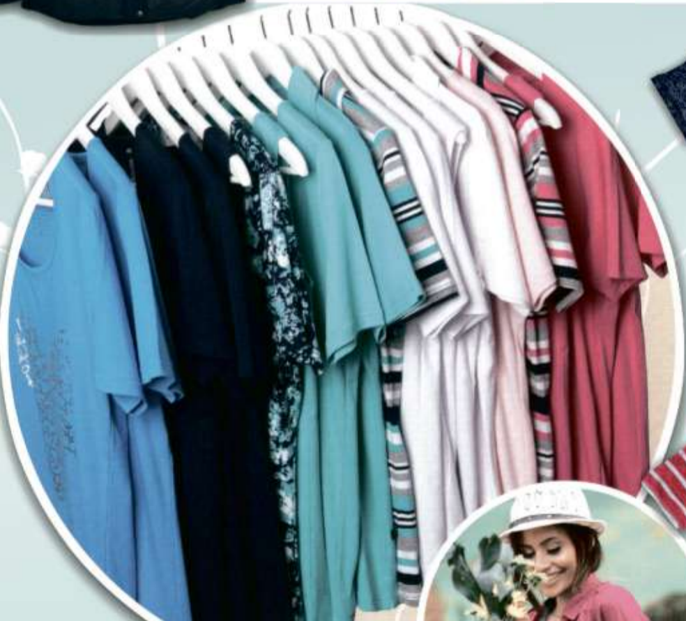
Basic Shirts, Tops & Polos