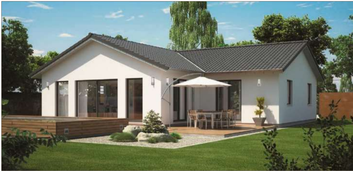
Das Wohnen auf einer Ebene wird immer beliebter. Beim Icon Winkelbungalow ist jedes Element bis ins Detail durchdacht.