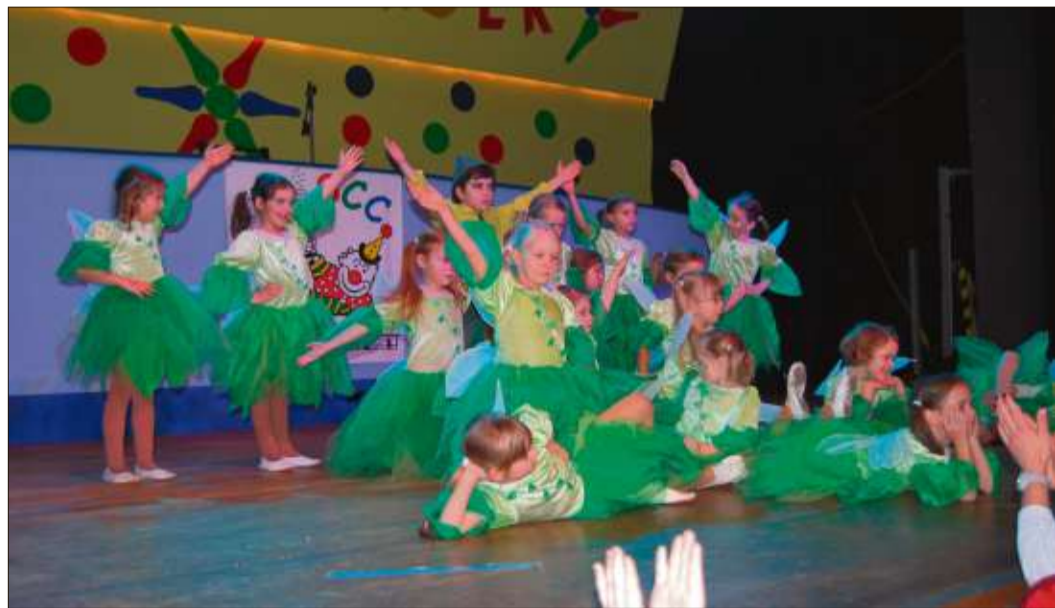
Die Geschichte von Peter Pan wurde von den „Mini Hoppers“ aus Wallroth getanzt.