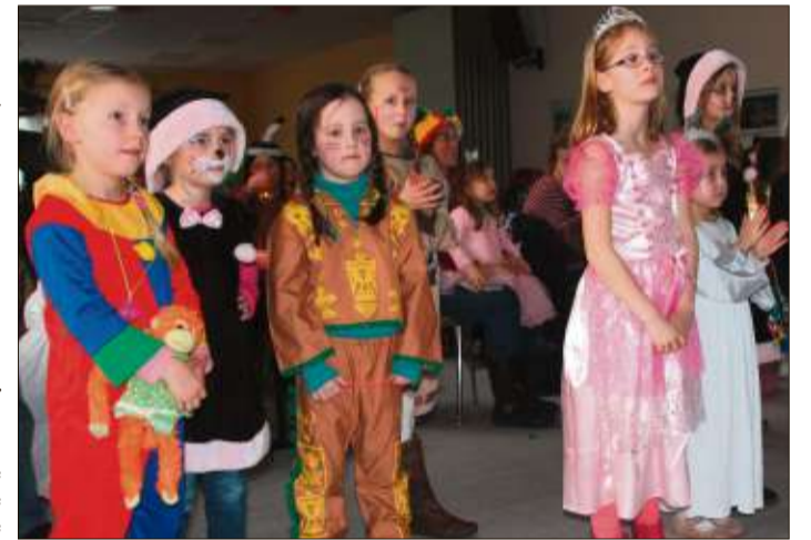
Die Faschingskostüme der rund 50 Kinder waren spitze.