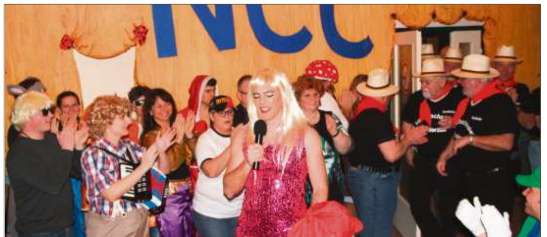
Einzug der Akteure beim bunten Faschingstreiben des NCC.

Schlüchtern (rs). Bei einem Informationstag an der Stadtschule Schlüchtern können sich Schüler der 4. Klassen der Grundschulen sowie deren Eltern über die Schule informieren. Die Veranstaltung findet am Samstag, 7. Februar, von 10 bis 14 Uhr statt. Eröffnet wird der Informationstag um 10 Uhr durch die Concert Band der Stadtschule und einer Kurzpräsentation. Anschließend laden Mitmachstationen, Informationsstände und Vorführungen dazu ein, die Lernangebote kennenzulernen. Für das leibliche Wohl sorgt in bewährter Weise der Förderverein der Stadtschule.