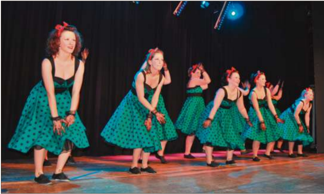
Mit den „Knallfröschen“ ging es in die 50er Jahre.