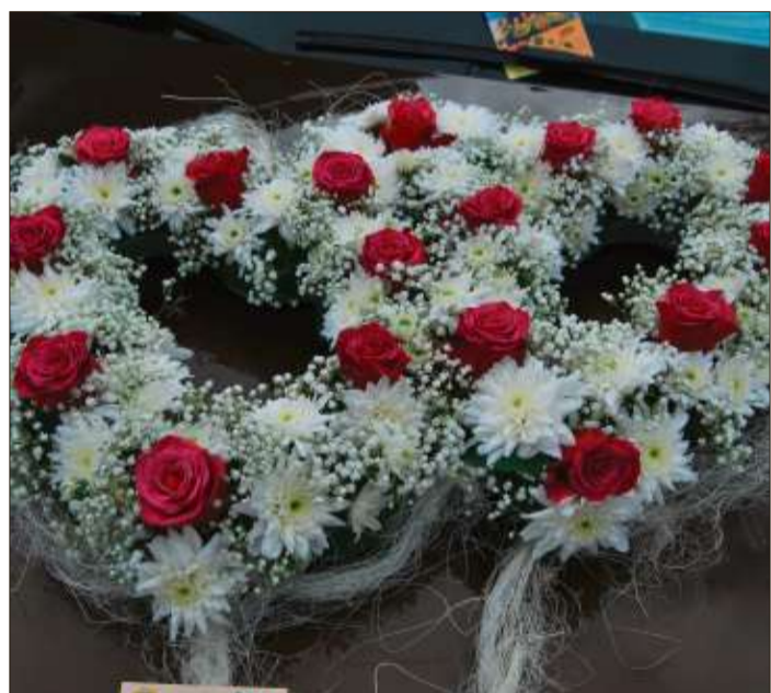
Eheringe aus Blumen, platziert auf der Kühlerhaube des Brautautos, sind ein toller Hingucker.

Die Blumen, ob Gestecke oder Brautstrauß, sollten bis spätestens vier Wochen vor der Hochzeit bestellt werden. Besonders in der Hochzeitsphase von Juni bis August sind viele Floristen sehr beschäftigt oder gar schon ausgebucht, so dass eine frühzeitige Terminierung wichtig ist.