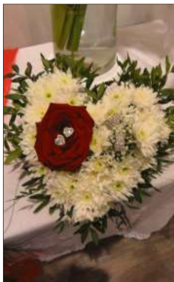
Das Herz als Symbol für die Liebe.