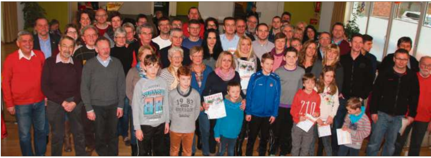
Im Stützpunkt Salmünster haben 13 Jugendliche und 69 Erwachsene im vergangenen Jahr das deutsche Sportabzeichen abgelegt.