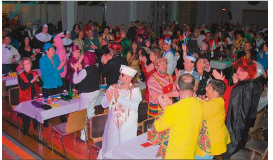
In der Stadthalle Schlüchtern steptte der Bär.