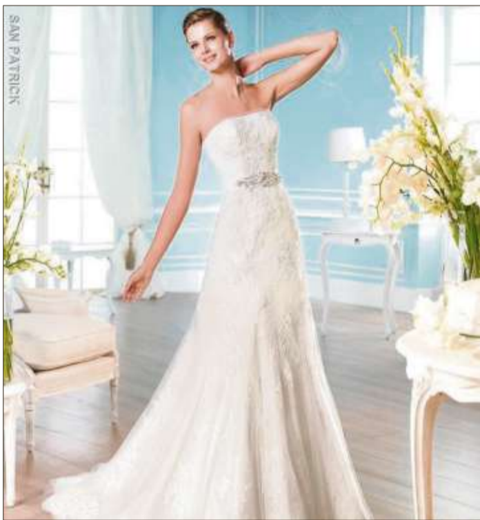
Wunderschöne Brautkleider gibt es im Le Mariage in Bad Soden.