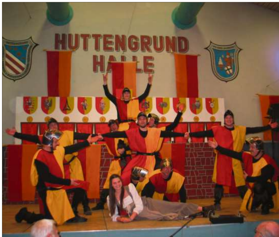
Die „Ritter vom heiligen Gral“ verstanden sich auf Tanz und Akrobatik.