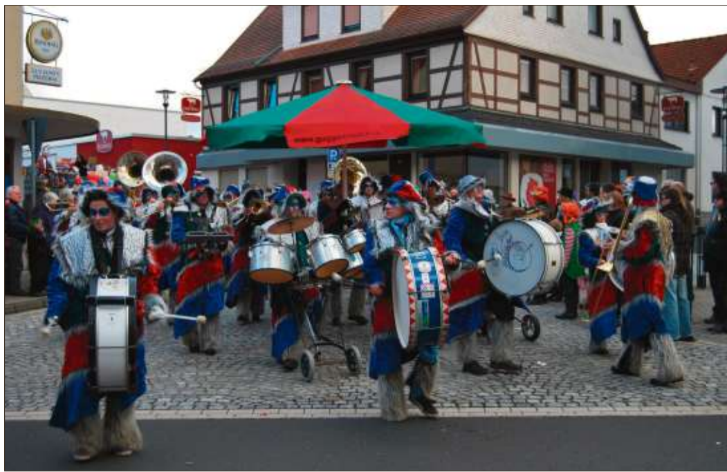
Besonders gern gesehene Gäste in Schlüchtern: Die Guggenmusiker aus Isny.