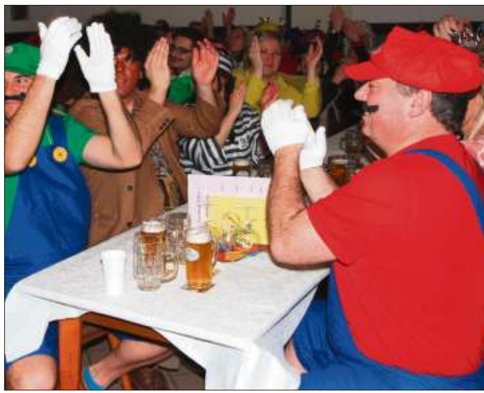
Die Niederzeller Narren feiern ausgelassen.