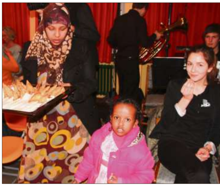
Eine junge Mutter und ihre Tochter reichen afrikanische Teigtaschen.