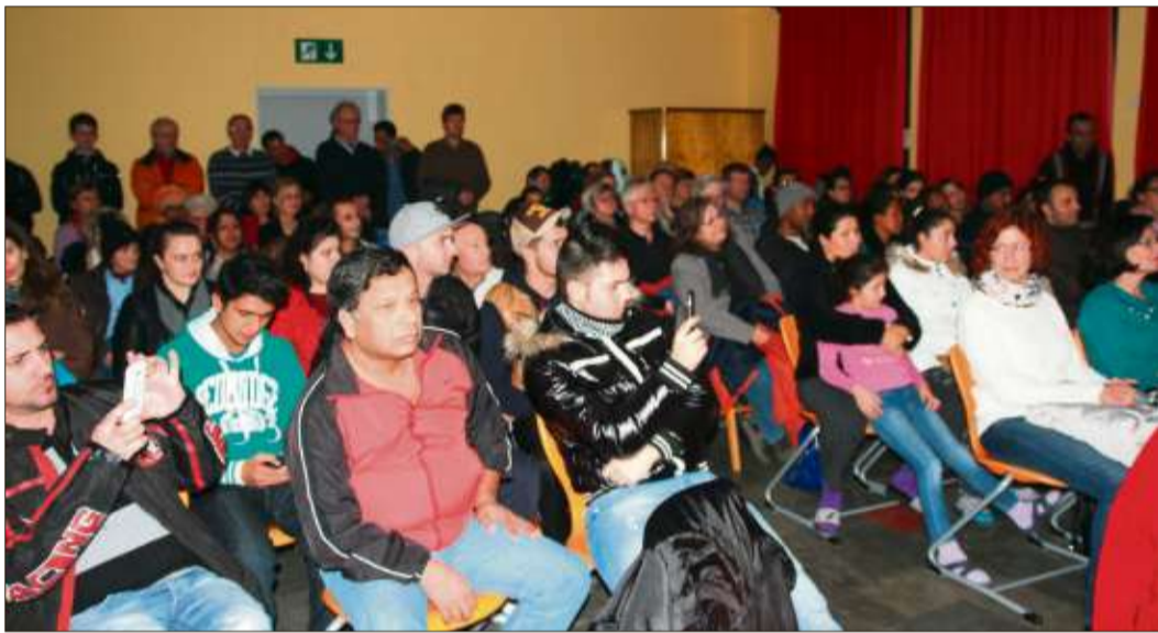
Willkommenskultur – Die Hof-Reith-Flüchtlinge und Schlüchterner Bürger beim Schwade-Konzert.

schaften oder Musikunterricht sowie besondere schulische Schwerpunkte, wie die Berufs- und Studienorientierung oder Hochbegabtenförderung, werden während des Tages der offenen Tür präsentiert. Das gesamte Schulleitungsteam steht interessierten Eltern und Schülern für alle Fragen in der Ansprechbar zur Verfügung. Auch die Kreisverkehrsgesellschaft gibt detaillierte Auskunft über die Busverbindungen zur Schule. Ein Höhepunkt des Tages der offenen Tür wird ein erster Einblick in die neu sanierten und hochmodernen naturwissenschaftlichen Räume sein. Los geht es um 17 Uhr in der Großsporthalle auf dem Gelände der Schule. Geschwisterkinder können von älteren Schülern betreut werden. Weitere Informationen über die Henry-Harnischfeger-Schule gibt es unter www.hhs-online.de.