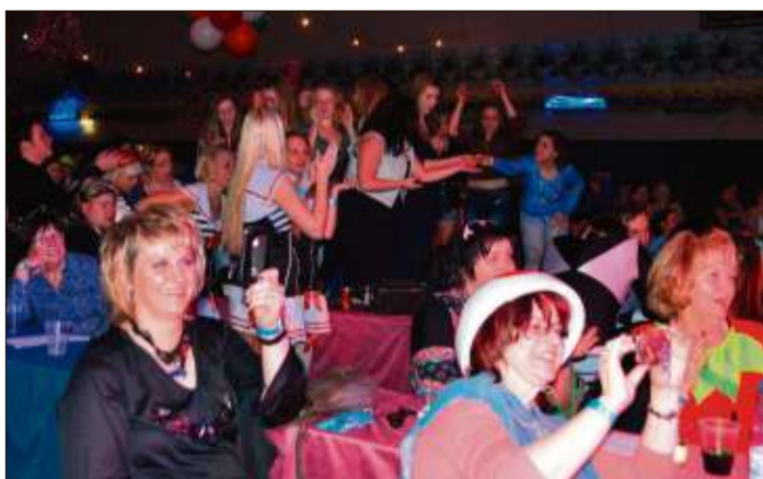
Ausgelassene Stimmung herrschte in der Halle am Steines.

Schlüchtern-Elm (fgw). Die Jahreshauptversammlung des Eisenbahner Musikvereins Elm findet am Samstag, 7. Januar, 20 Uhr, im Elmer Gemeinschaftshaus statt. Auf dem Programm steht neben den üblichen Jahresberichten auch die Ehrung langjähriger Mitglieder.