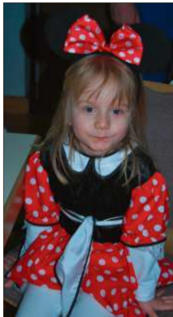
Diese kleine Mickymaus verfolgte gespannt das Geschehen auf der Bühne.

Stadthalle. Für das leibliche Wohl hatten die Frauen des SCC mit einer großen Kuchentheke gesorgt. Vor der Stadthalle gab es Pommes und Würstchen an einem SCC-Imbisswagen.