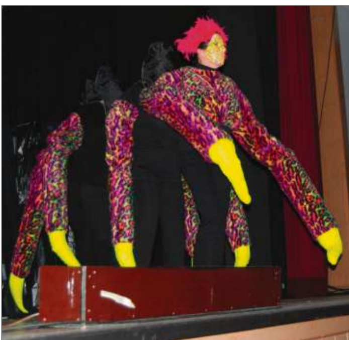
Eine riesige Spinne von den „Bergwinkel-Cindys“ krabbelte über die Bühne.