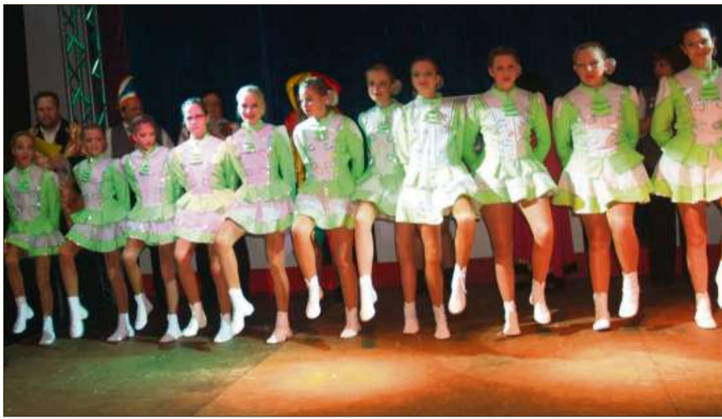
Die Ramba-Zamba-Garde, die gleich zu Beginn der Fremdensitzung mit dem Siebenerratt einzog.

Der Eintritt ist frei, eine Spende ist aber immer willkommen. Einlass ab 19.30 Uhr. In der Kirche in Wallroth wurden nach der Renovierung eine große Leinwand und eine Verstärkeranlage eingebaut, so dass das Kinoerlebnis professionelle Züge trägt. Die Zuschauer können vor der Vorstellung und während der Pause sich an einem Buffet bedienen.