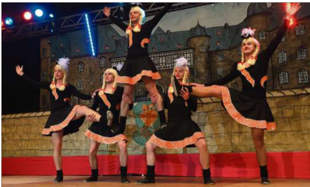
Die Prinzessinnengarde löste Jubelstürme aus.

Steinau (rs). Die Stadtverwaltung Steinau teilt mit, dass am Rosenmontag, 16. Februar, ab 13 Uhr alle städtischen Dienststellen geschlossen bleiben. Notdienste (Sicherstellung der Wasserversorgung, Kontrolle der Kläranlagen, Winterdienste) sind zu jederzeit sichergestellt. Das Notfall-Telefon der Wassermeister ist unter (01 71) 6 22 44 15 zu erreichen.