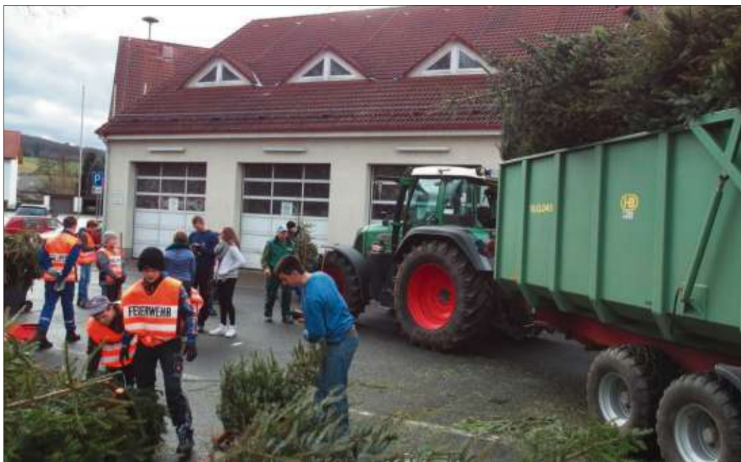
Die Jugendfeuerwehren sammelten über 1400 Weihnachtsbäume ein.