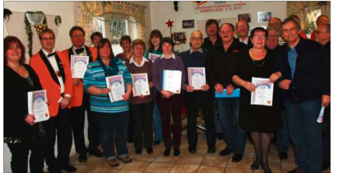
Ehrungen für 11, 22, 33 und 44 Jahre.