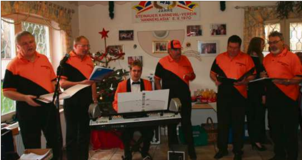
Die Bänkelsänger gestalteten den Neujahrsempfang musikalisch.