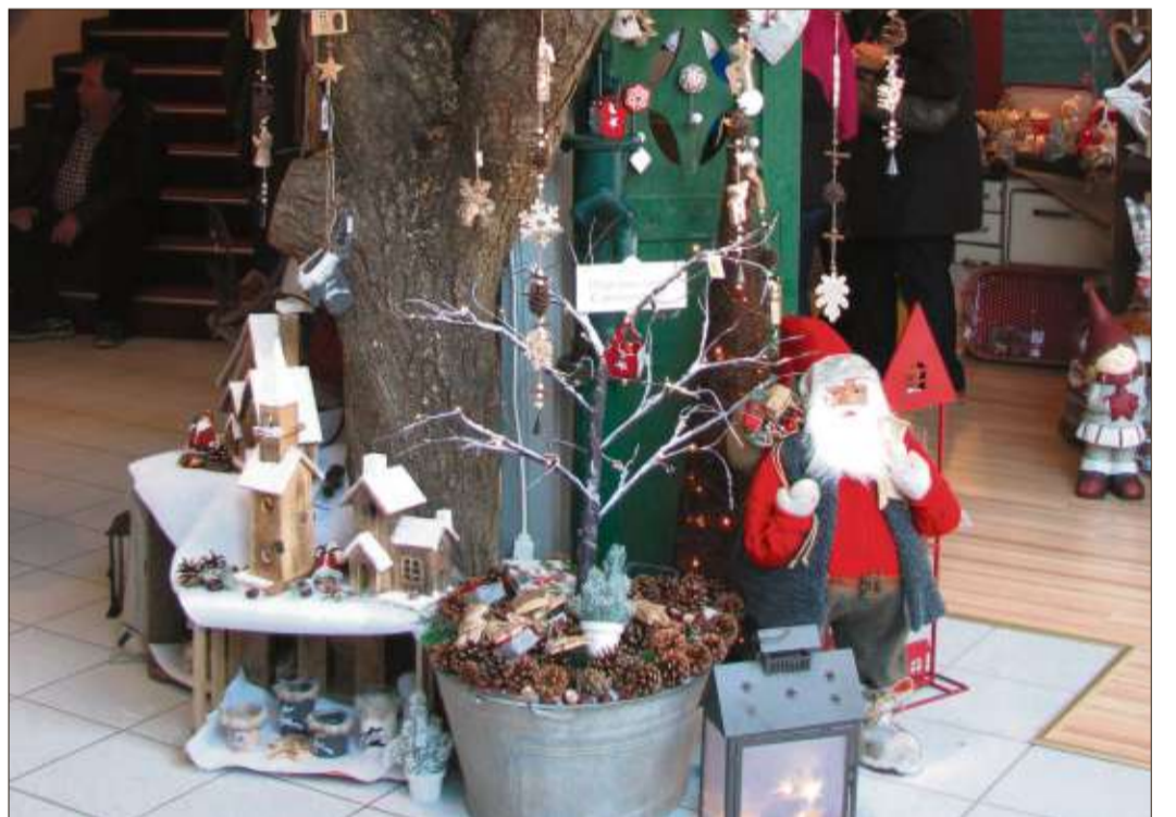
Im Möbelhaus Rudolf sieht es schon sehr weihnachtlich aus.

Ein noch sehr junger Brauch, der erst zu Beginn des 19. Jahrhunderts von den meisten Familien in Deutschland und Österreich übernommen wurde.