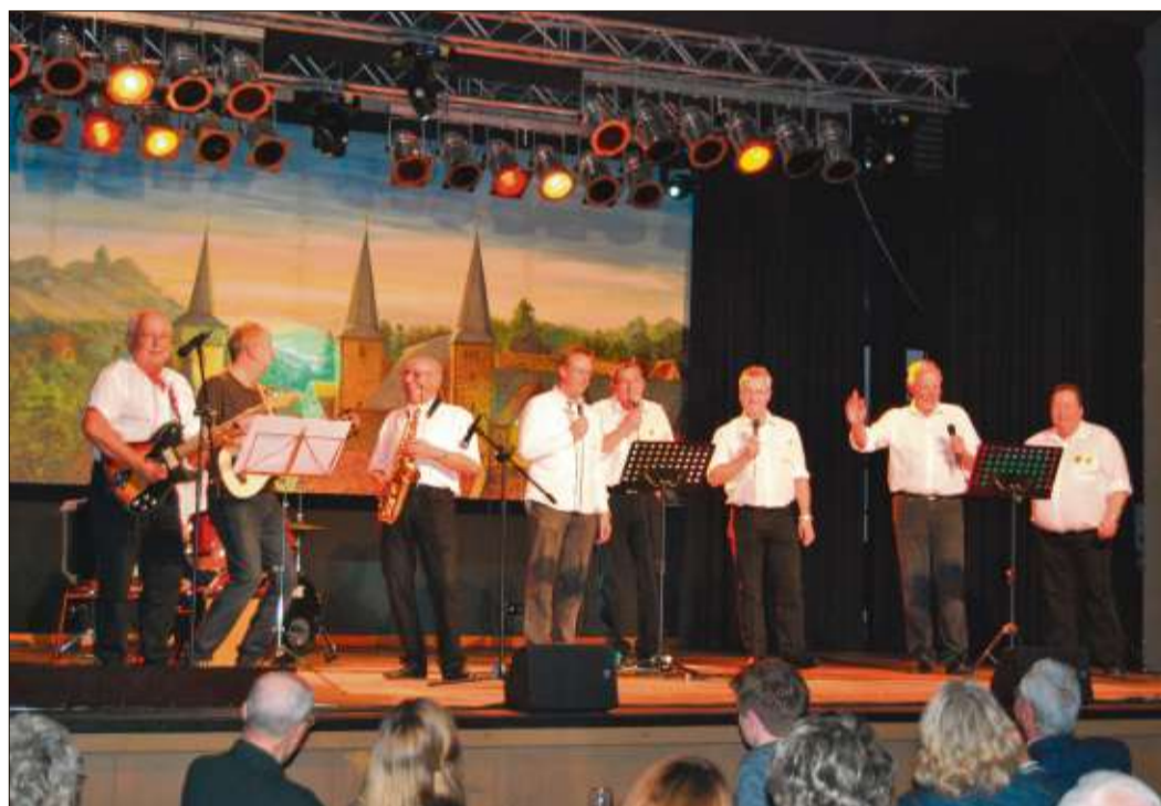
Die „Moarts Kalle Backe“ sangen und begeisterten das Publikum.