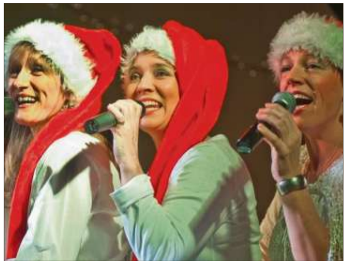
Bei der Ladies Nyght XX-mas Show glitzert und funktelt es musikalisch und optisch.

Neues Auto gefunden! Durch Anzeigen in Ihrem Wochenbote.