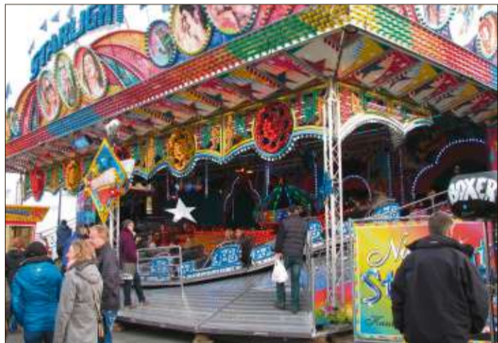
Im Starlight ging es in rasanter Fahrt bergauf und bergab.