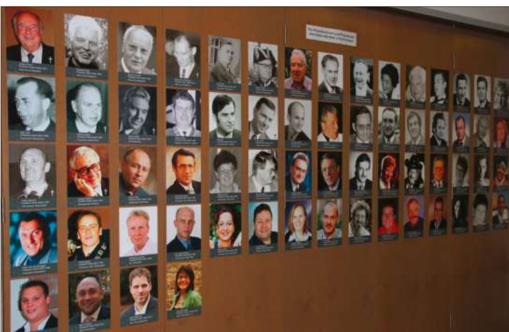
Im Foyer der Stadthalle waren die Porträts aller 64 Kalte-Markt-Präsidenten aufgehängt.