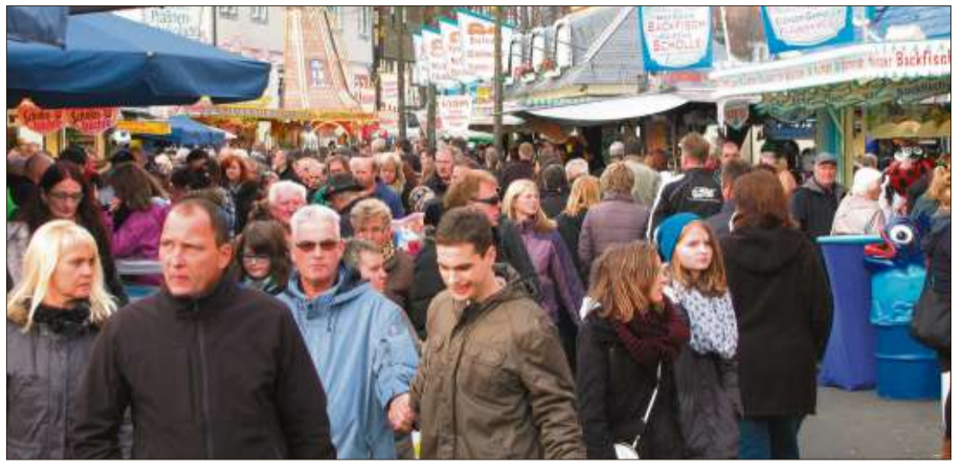
Riesige Menschentrauben schlängelten sich durch die Straßen von Schlüchtern.