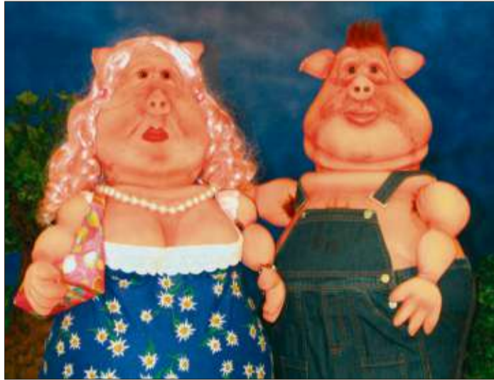
Das Kikeriki-Theater aus Darmstadt gastiert am 28. und 29. November mit dem Puppenspiel für Erwachsene, „Erwin – ein Schweineleben“, in der Stadthalle Schlüchtern.

Karten zum Preis von je 25 Euro sind beim Büro für Touristik, Kultur und Freizeit, Krämerstraße 5 in Schlüchtern, Telefon (06661) 85-359, E-Mail: info@schluechtern.de, erhältlich. Die Platzwahl ist frei. Beginn ist an beiden Abenden um 20 Uhr, Einlass ab 19 Uhr. Weitere Informationen zum Kikeriki-Theater gibt es im Internet unter www.comedy-hall.de.