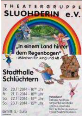
Das Märchen „In einem Land hinter dem Regenbogen“ wird von der Theatergruppe Sluohderin aufgeführt.

lem Einsatz dabei. Seit den Sommerferien wird geprobt, da kann es schon mal sein, dass auch ein Wochenende dran glauben muss. Trotz aller Arbeit freut sich das gesamte Theaterensemble schon jetzt auf die Premiere. Gespielt wird am Dienstag, 20., und Donnerstag, 21. November, jeweils um 10 Uhr für Schulen und Kindergärten. Karten können unter der Nummer (06056) 9196535 vorbestellt werden. Am Freitag, 22., und Samstag, 23. November, gibt es jeweils um 15 Uhr weitere Vorstellungen. Alle Theaterveranstaltungen finden in der Schlüchterner Stadthalle statt. Karten erhalten Theaterfreunde in der Rathaus-Apotheke, der Bergwinkel-Apotheke, der Lotichius-Apotheke sowie im Büro für Kultur, Tourismus und Freizeit der Stadt Schlüchtern.