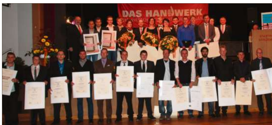
Die frischgebackenen Meister mit ihren Meisterbriefen.