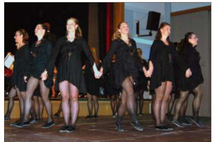
Die Dance Company wird einen irischen Tanz zeigen.

Und sicher gibt es auch noch die eine oder andere Überraschung an diesen Abend.