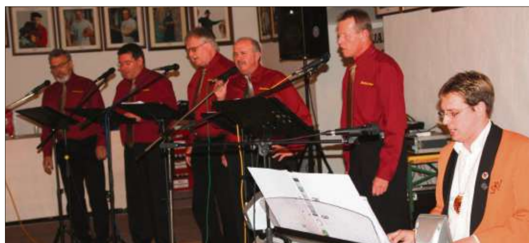
Die Bänkelsänger sorgten musikalisch für Stimmung.