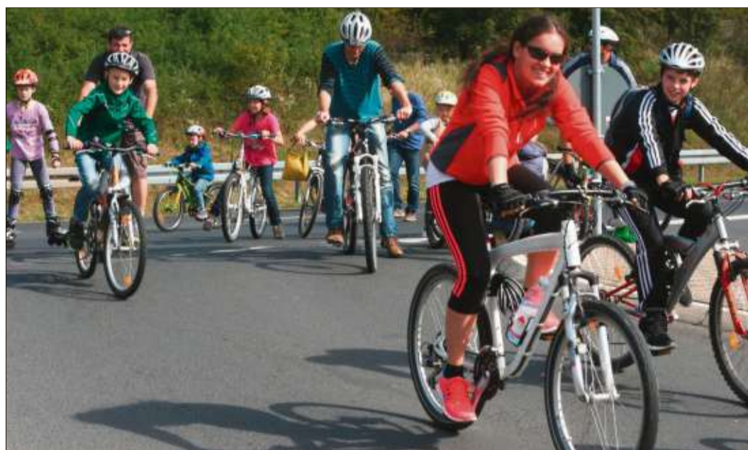
Auf dem Rad ging es am vergangenen Sonntag gut gelaunt durch's Kinzigtal.

Getrübt wurde das Radler-Glück durch einen schweren Unfall. Eine 59-jährige Frau aus Steinau, die keinen Helm trug, stürzte auf der Schlüchterner Umgehungsstraße bei Mader & Vey und zog sich schwere Kopfverletzungen zu. Ein Rettungshubschrauber brachte sie in die Uniklinik nach Frankfurt. Weitere Stürze verliefen nach Angabe der Polizei eher glimpflich.