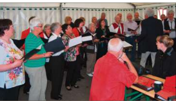
Die Elmer Chorgemeinschaft war nicht nur Gastgeber, sondern bereicherte das Programm auch mit ihrem Gesang.