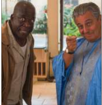
Die Multikulti-Komödie „Monsieur Claude und seine Töchter“ läuft ein letztes Mal im KUKI-Zelt.

große Liebe. Eifrig kritzelt er seine Beobachtungen in ein Notizbuch und kommt zu überraschenden Ergebnissen. Nicht gerade glücklich ist auch der konservative Notar Claude (Christian Clavier) und seine sanfte Gattin Marie (Chantal Lauby) in dem französischen Kassenschlager „Monsieur Claude und seine Töchter“. Denn beide können einfach nicht verstehen, warum ihre Töchter keine netten, katholischen Franzosen geheiratet haben, sondern stattdessen einen Muslim, einen Juden und einen Chinesen. Bei Familientreffen tapen alle in die Fallen des interkulturellen Minenfelds. Das bürgerliche Paar setzt nun all seine Hoffnung auf die Jüngste. Als die einen katholischen, aber tief-schwarzen Verlobten anschneppt, ist der Toleranzvorrat erst einmal aufgebraucht. Der Schwiegervater beschließt: Diese Hochzeit muss verhindert werden, mit allen Mitteln. Mit pointiertem Witz und viel Charme ist die Multikulti-Komödie, die ein letztes Mal am Freitag, 19. September, zu sehen ist, zu einem der Publikums-lieblinge in dieser Sommersaison avanciert.