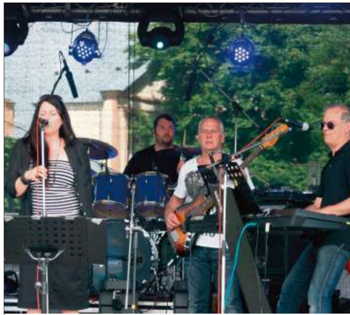
Rock, Blues, Soul und Motown vom Feinsten: Die Band „Good News“ spielt am Samstag, 20. September, ein Konzert zum Abschluss des diesjährigen Kino- und Kultursommers im KUKI-Zelt.

Beginn des Konzerts ist um 20 Uhr. Tickets zum Preis von 7 Euro sind im Internet unter www.kukikino.de und am Servicetelefon unter (06661) 608-410, täglich von 10 bis 12 Uhr, erhältlich, sowie täglich zwischen 19 und 20 Uhr an der Abendkasse im KUKI-Zelt, Kirchstraße 32 in Schlüchtern (im Garten des evangelischen Gemeindehauses). Einlass ist eine halbe Stunde vor Beginn der Veranstaltung. Weitere Infos zur Band sowie Hörproben gibt es online unter www.goodnews-band.de .