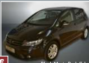
Black Magic Perleffekt

VW Golf Plus 1.4 TSI „Tour“ DSG-Automatik 103 kW (140 PS) EZ: 04/2007, 56.734 km Klima, Regensensor, Sitzheizung, Radio/CD, Ladeboden variabel und herausnehmbar, Berganfahrassistent, Alu-Felgen... nur 9.730,- €