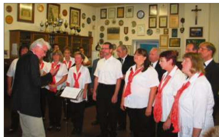
Mit passenden Liedbeiträgen gestaltete der Gesangverein Heimatliebe seinen Kammersabend musikalisch.