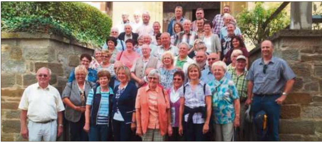
Die Mitglieder des Liederkranz Sterbfritz stellten sich zu einem Erinnerungsfoto.