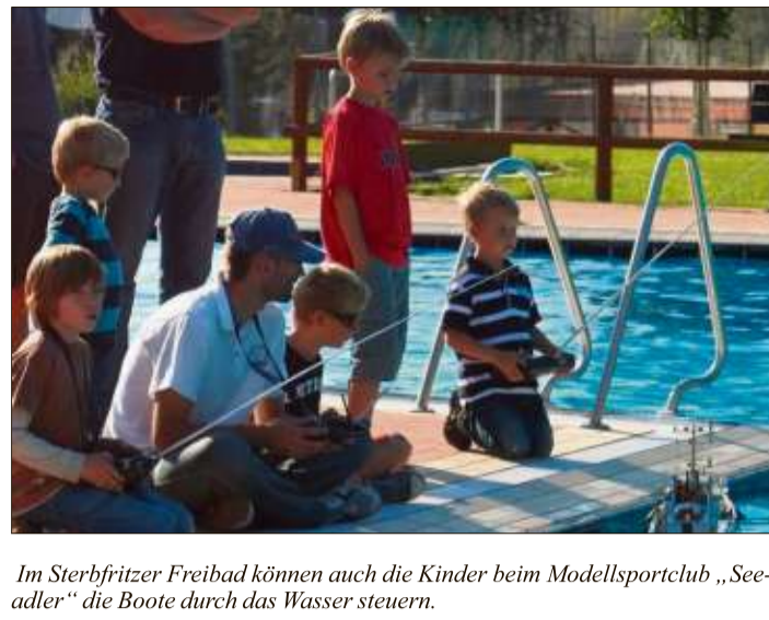
Im Sterbfritzer Freibad können auch die Kinder beim Modellsportclub „Seedler“ die Boote durch das Wasser steuern.