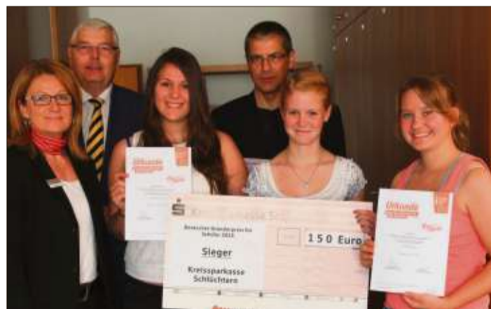
Fröhliche Gesichter bei der Siegerehrung in der Kreissparkasse.

Der Deutsche Gründerpreis ist die bedeutendste Auszeichnung für herausragende Unternehmer in Deutschland. Er wird für vorbildhafte Leistungen bei der Entwicklung von innovativen und tragfähigen Geschäftsideen und beim Aufbau neuer Unternehmen verliehen. Ziel des Deutschen Gründerpreises ist es, ein positives Gründungsklima in Deutschland zu fördern und Mut zur Selbstständigkeit zu machen. Der Deutsche Gründerpreis wird jährlich in den Kategorien Schüler, StartUp (Existenzgründer), Aufsteiger und Lebenswerk verliehen. Damit werden unternehmerische Vorbilder in unterschiedlichen Gründungsphasen ausgezeichnet - vom Schülerplanspiel bis zum Lebenswerk.