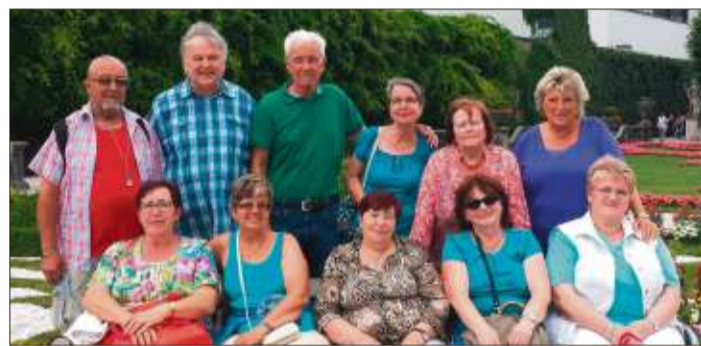
Die „Stammtischler“ in Salzburg im Mirabellgarten.

stung Hohensalzburg besichtigt. Auf der Rückfahrt gab es noch einen Abstecher in den Wallfahrtsort Altötting, bekannt durch seine Gnadenkapelle mit der „Schwarzen Madonna.“