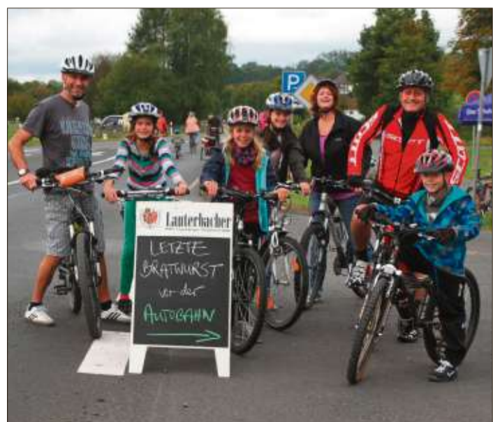
Die letzte Bratwurst vor der Autobahn.