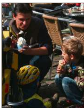
Ein leckeres Eis für zwischendurch gab es in Steinau.

Sterbfritz gefahren. Der war ganz schön voll. Jetzt geht es die 80 Kilometer gemütlich heimwärts. Der Sprit geht uns bestimmt nicht aus.“