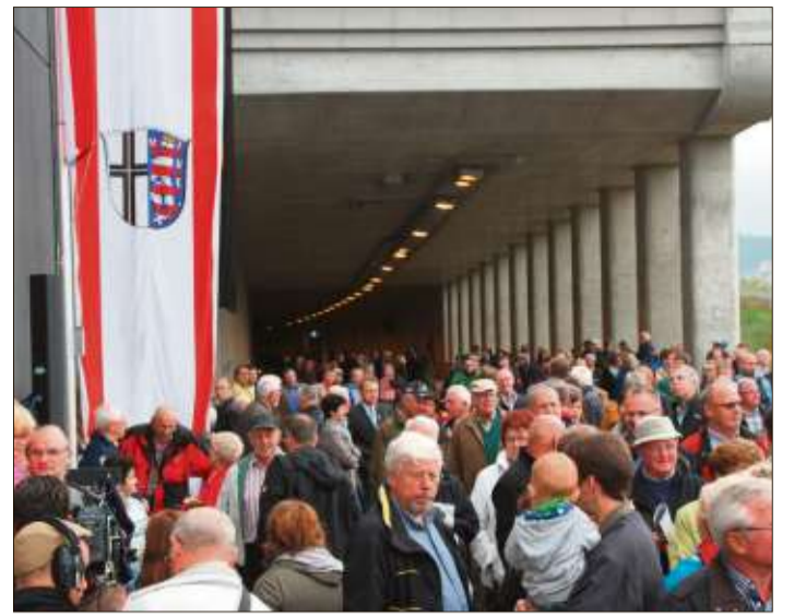
Rund 2000 Gäste wohnten der Freigabe des Neuhofer Tunnels am vergangenen Samstag bei.