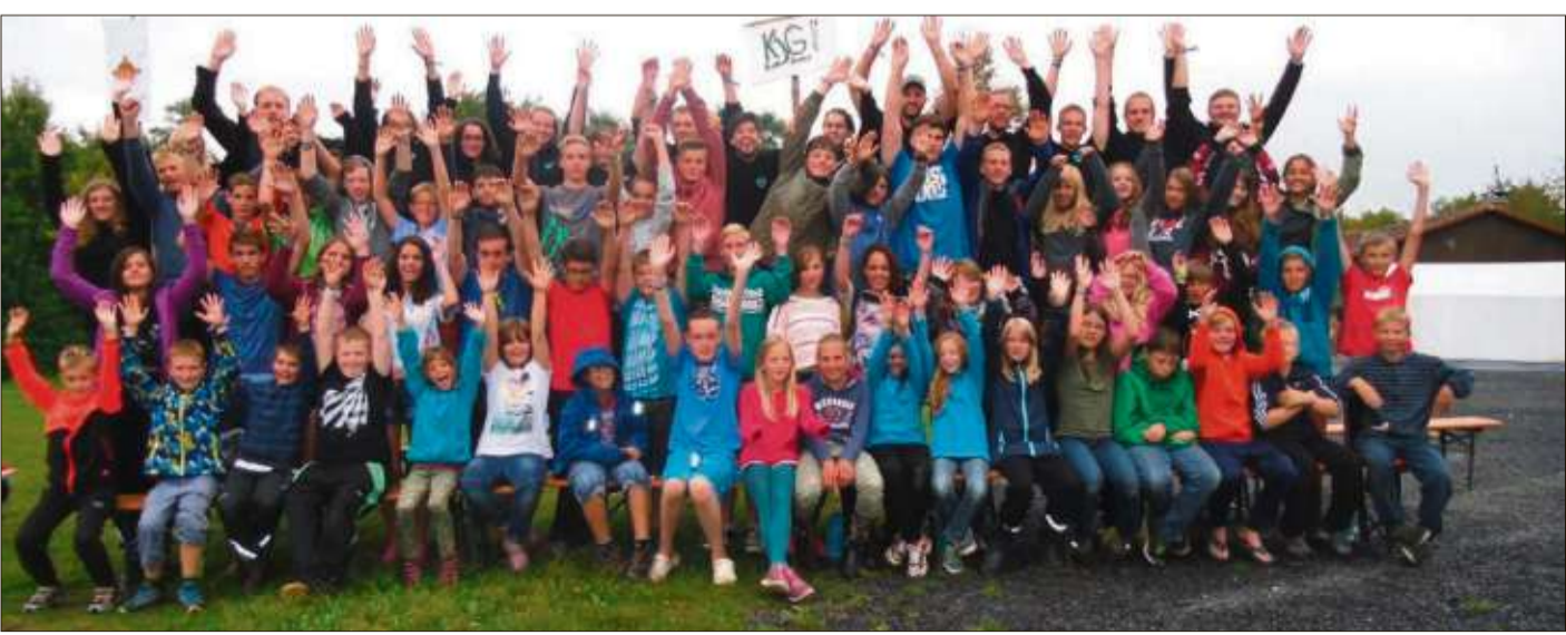
Kinder, Jugendliche und Betreuer stellten sich zu einem Erinnerungsfoto.

Bad Soden-Salmünster (rs). Die KjG Bad Soden weilte mit etwa 60 Kindern und Jugendlichen im Alter von sieben bis 15 Jahren zu einem zehntägigen Zeltlager in Münnerstadt. Neben vielen weiteren Aktionen waren die Nachtwanderung, die Lagerolympiade und das Kanufahren die absoluten Höhepunkte in diesem Jahr. Zum ersten Mal wurde dieses Jahr ein sogenannter „Thementag“ durchgeführt. An diesem Tag drehte sich alles um das Thema Energie. Den Kindern wurden auf spielerische Art und Weise Informationen rund um das Thema alternative Energiequellen nähergebracht. Zuerst wurde ein kinderfreundlicher Dokumentationsfilm gezeigt, auf den anschließend ein Quiz folgte. Danach durften die Kids an verschiedenen Stationen Experimente durchführen. So mussten sie beispielsweise mit einem Wasserrad eine Birne zum Leuchten bringen. Abgeschlossen wurde dieser Tag mit einem gemeinsamen Gottesdienst bei Dämmerung und Lagerfeuer. Auch hier spielte das Thema Energie von Gott eine wichtige Rolle, und die Kinder konnten ihre eigenen Ideen mit in den Gottesdienst einbringen. Eine weitere tolle Aktion war das Geocaching. Ein Programmhöhepunkt war die Zwei-Tages-Wanderung. Die Wanderung wurde mit einem Besuch in einem Erlebnis-Bad verbunden, sodass zwischen den beiden Wandertagen, ein Tag im Schwimmbad entspannt und getobt werden konnte. Übernachtet wurde an beiden Tagen in einem katholischen Pfarrhaus in Mühlbach. Fotos, Eindrücke und weitere Termine der KjG gibt es unter www.kjg-badsoden.de.