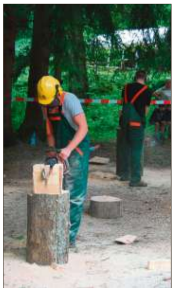
Der Spaß steht beim Kettensägen-Wettbewerb im Mittelpunkt der Veranstaltung.

unter der Telefonnummer (06661) 6092711.