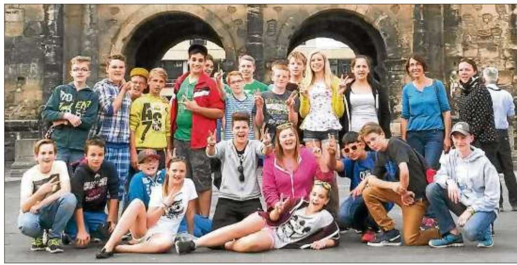
Die Klasse 7d verbrachte drei Tage in Trier.

Bad Soden-Salmünster-Eckardroth (oj). Die Mitglieder der Anglersportgemeinschaft 1977 Eckardroth (ASG) trafen sich in ihren neuen Vereinshemden mit dem Vereinslogo (Foto) zum Angeln am Noltesee in Langenselbold. Die Beschaffung der Vereinshemden wurde Dank der großzügigen Spenden der Firma Tempur Deutschland GmbH (Steinhausen) und der Elektro- und Anlagentechnik Liller (Rodgau) ermöglicht. Die ASG Eckardroth veranstaltet am Samstag, 26., und Sonntag, 27. Juli, im 37. Jahr ihres Vereinsbestehens ihr beliebtes Anglerfest für Jedermann am alten Schwimmbad (Nähe Sportgelände der SG Huttengrund) in Eckardroth. Neben geräuchertem Fisch aus heimischen Gewässern werden Köstlichkeiten vom Grill und hausgemachter Kuchen angeboten. Gäste sind willkommen.