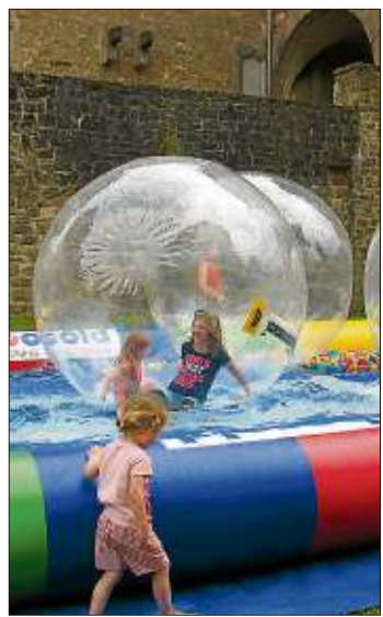
Eine Attraktion des Jockesmarks: Die Aqua-Anlage für Kinder.

Vom Kinderkarussell über die Berg- und Talbahn bis zum Fahrgeschäft „Maxxx Booster“, das sich weithin sichtbar über der Mauerviese erhob, hatte der Vergnügungspark für Alt und Jung vieles zu bieten.