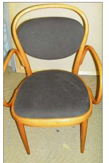
Für einen bequemen Sitz ist der gesamte Aufbau entscheidend.

gebrachten Techniken und unterschiedlichen Materialien auf die individuellen Wünsche abstimmt, um Ihr Lieblingsstück in neuen Glanz erstrahlen zu lassen.