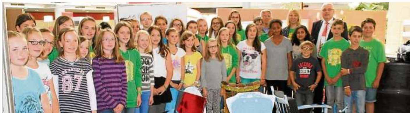
Stolz präsentierten die Schülerinnen und Schüler ihre kleinen und großen Kunstwerke und erhielten dafür viel Lob.