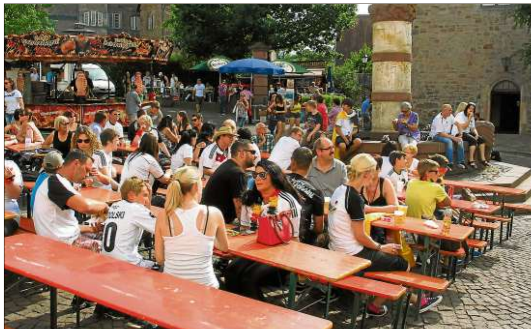
Vor der Großleinwand auf dem Steinauer Kumpen verfolgten die Fußballfans das Spiel Deutschland gegen Frankreich.