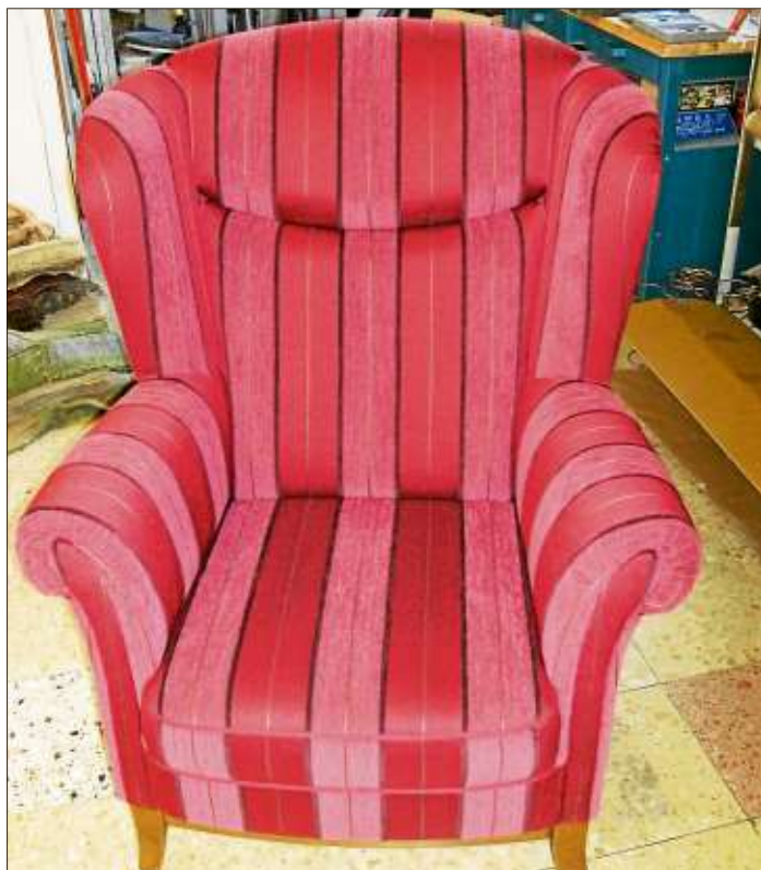
Aus dem alten Lieblingspolstersessel wird ein wahres Kunstwerk.