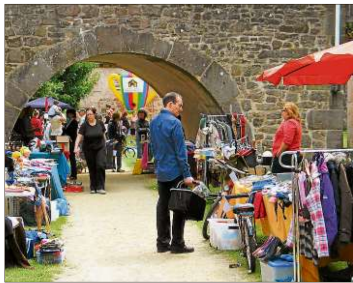
Flohmarktstände gruppierten sich im Hirschgraben und boten allerlei bunte Waren an..