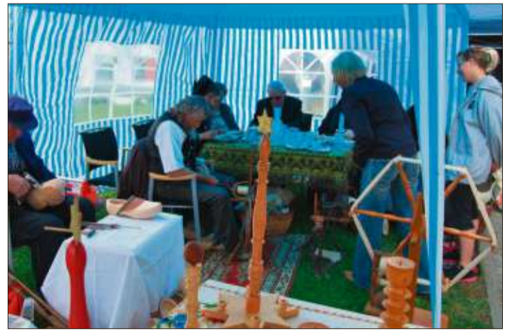
Immer wieder gern gesehene Gäste beim Sommerfest sind die Damen und Herren der Elmer Trachtengruppe.

Gruppen „Lucky Kids“ und die „Sugar Girls“ vom TV Schlüchtern werden mit ihren Tänzen begeistern. Natürlich darf auch bei einem solchen Event die Historische Bürgergarde nicht fehlen. Nach ihrem Aufmarsch wird die Biedermeiergruppe mit Tänzen erfreuen. Gerne gesehene Gäste sind die Damen und Herren der Elmer Trachtengruppe. Als besonderes Glanzlicht konnten in diesem Jahr die „Dirndljäger“ verpflichtet werden. Eine Gruppe, die vielen aus dem Fernsehen wohl bekannt sein dürfte und Garant für Stimmung ist. Um 16.30 Uhr findet ein ökumenischer Abschiedsgottesdienst mit dem Bergwinkelchor und der Chorgemeinschaft Elm statt.