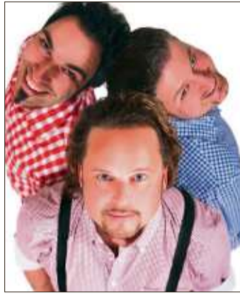
Die „Dirndljäger“ treten auf.