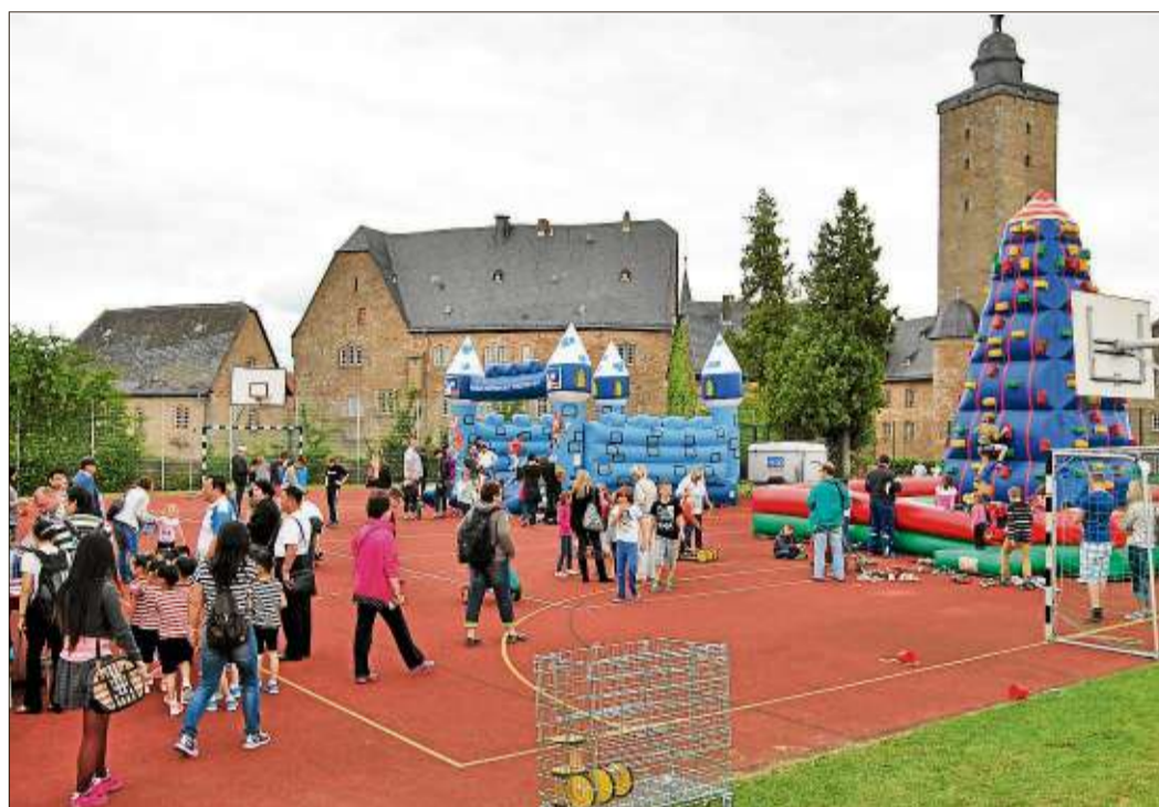
Jede Menge Spaß gab es auf dem Sportplatz mit vielen Spielstationen.

Sinntal-Weiperz (rs). Der Musikverein 1924 Weiperz lädt für Donnerstag, 19. Juni, zum Grillfest am Musikhaus in Weiperz ein. Neben allerlei Grillspezialitäten gibt es auch ein großes Kaffee- und Kuchenbuffet. Auch wird die Jugendkapelle des Vereins ein Platzkonzert geben.