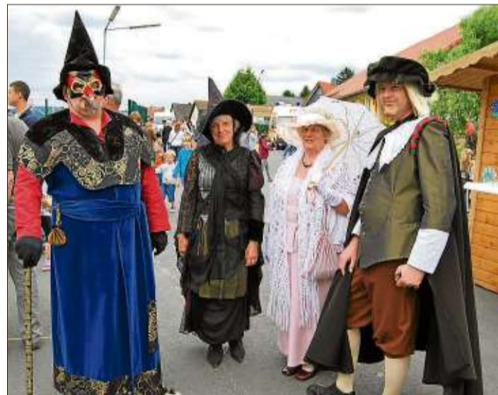
Beim Fest in der Brüder-Grimm-Schule schauten auch Märchenfiguren vorbei.