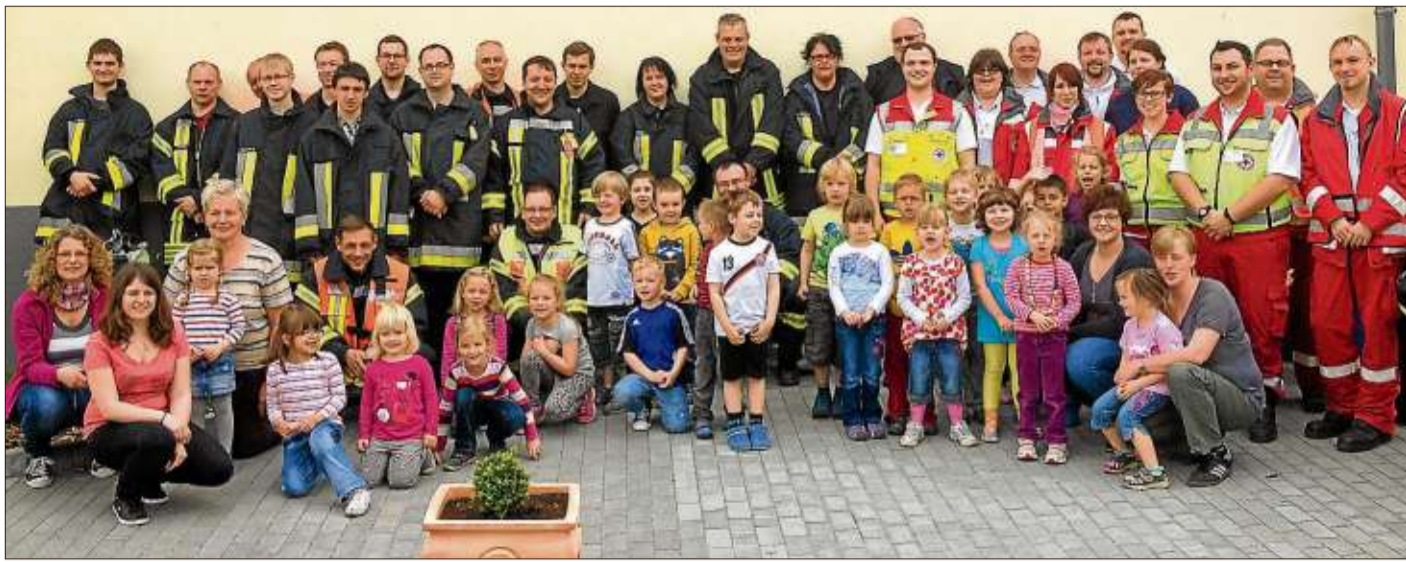
Kinder und Einsatzkräfte übten für den Ernstfall in der Kindertagesstätte „Noahs Arche“.