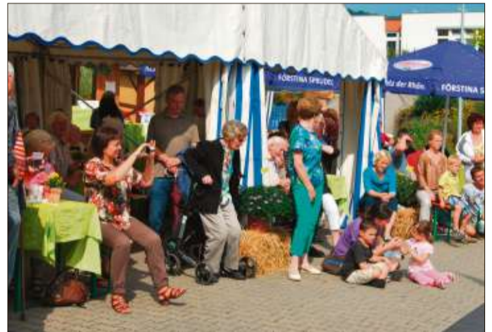
Wie im vergangenen Jahr werden auch diesmal viele Gäste erwartet.