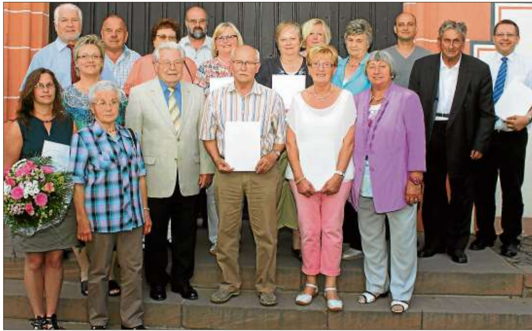
Steinauer Bürger wurden für bürgerliches und ehrenamtliches Engagement von Bürgermeister Walter Strauch geehrt.

Während des Basars gibt es auch Kaffee und Kuchen. Dessen Erlös geht ebenfalls an den Förderverein der Bilzbergerschule.