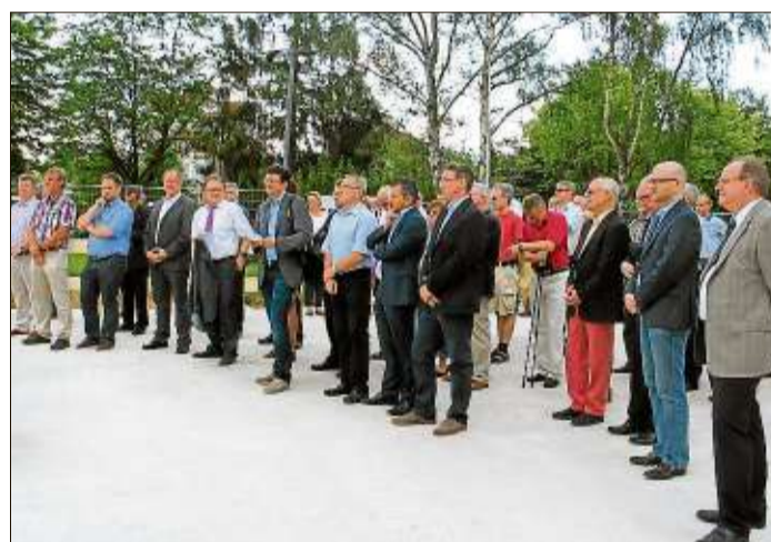
Den Festakt der Grundsteinlegung der Multifunktionshalle verfolgten zahlreiche Vertreter der politischen Gremien und der ausführenden Unternehmen.