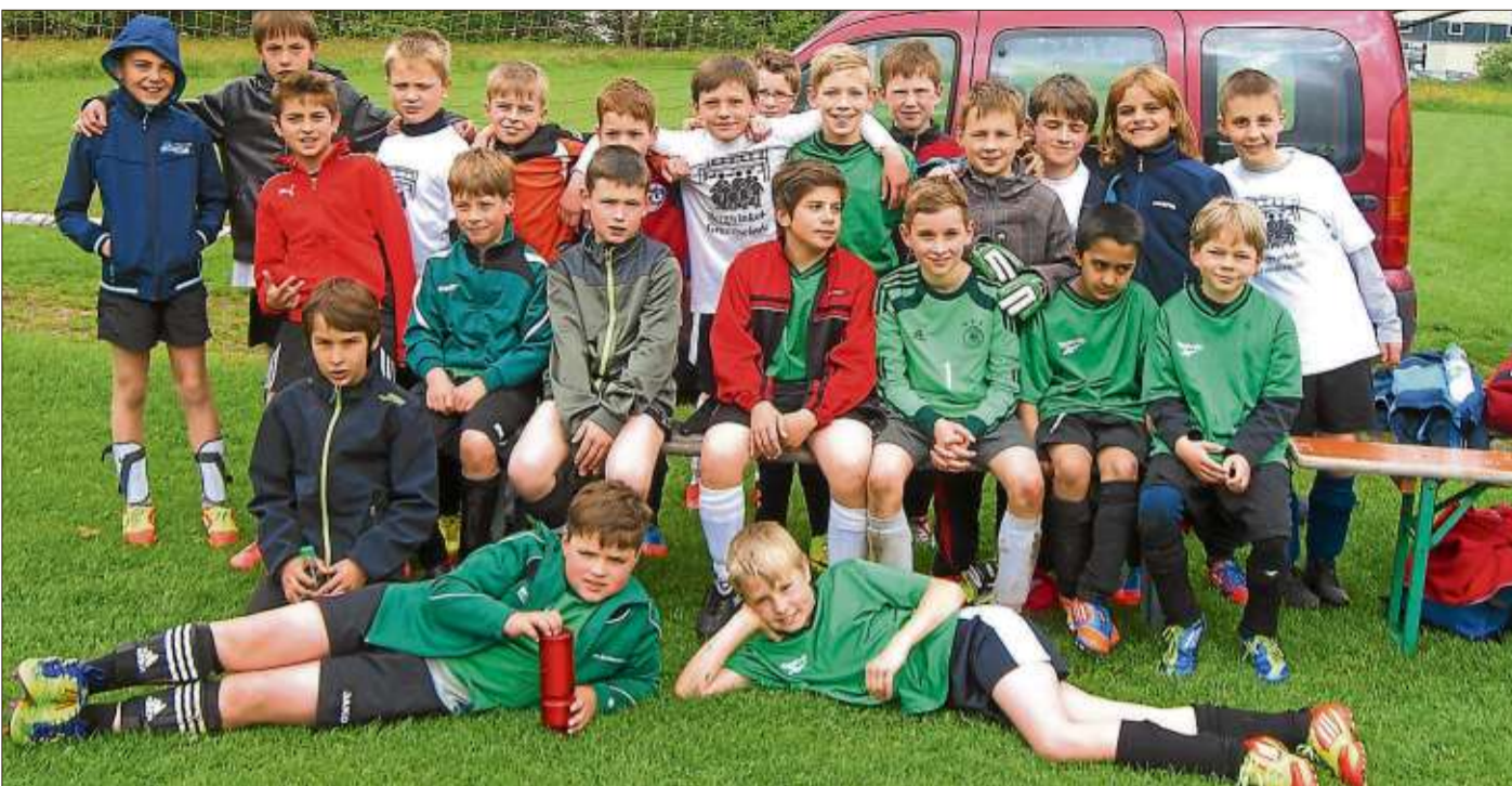
Das Foto zeigt beide Mannschaften der Bergwinkel-Grundschule.