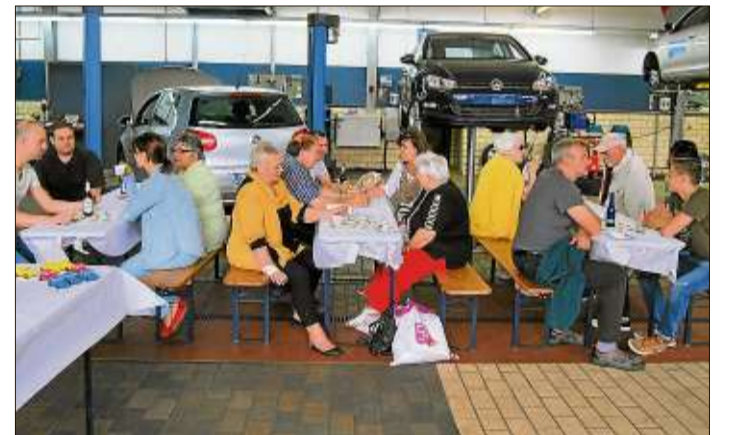
Zahlreiche Besucher waren der Einladung ins Autohaus Atzert und Weber gefolgt.

Für das leibliche Wohl der Gäste war mit Rostbratwürstchen und selbstgebackenen Kuchen sowie diversen Getränken am Familientag bestens gesorgt.