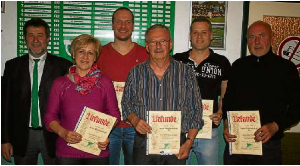
Die in der Jahreshauptversammlung Geehrten des Niederzeller Sportvereins.