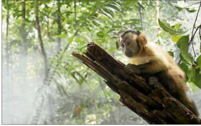
„Amazonia – Abenteuer im Regenwald“ ist ein herausragender Naturfilm für die ganze Familie.

lehrreiche Abenteuer-Doku auf der großen Leinwand zu erleben ist (Filmbeginn: 17 Uhr), geht es bereits ab 15.30 Uhr auf dem Gelände rund ums KUKI-Zelt, Kirchstraße 32 (im Garten des evangelischen Gemeindehauses) heiß her: Während für den Nachwuchs Kinderschminken, Basteln, Malen, Filzen, Theater, Musik oder Zaubern auf dem Programm steht, können die Erwachsenen bei Kaffee und Kuchen im Schatten der alten Bäume entspannen. Der Eintritt für Film und Unterhaltungsprogramm kostet 5 Euro.