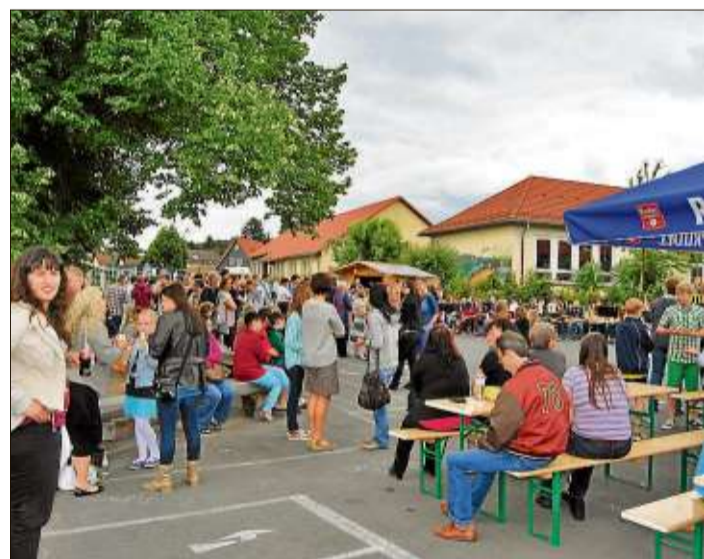
Unzählige Gäste tummelten sich beim Schulfest der Brüder-Grimm-Schule auf dem Schulgelände.