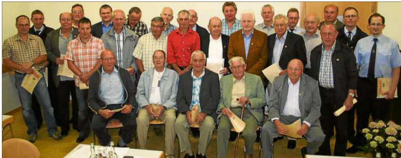
Diese Männer wurden beim Festkommers der Feuerwehr Hintersteinau für 25- und 40-jährige Mitgliedschaft geehrt.