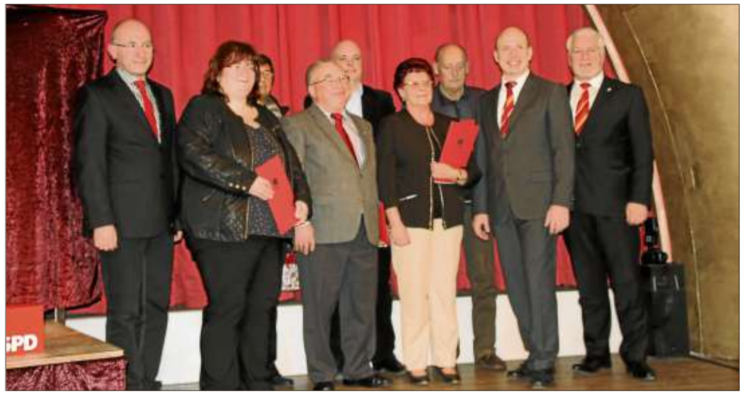
Die Ehrung langjähriger SPD-Mitglieder fand im Rahmen des Neujahrsempfangs statt.

Steinau (rs). Die Arbeitsgemeinschaft Steinauer Vereine lädt interessierte Vereine, Gruppen, Stammtische und Privatpersonen für Samstag, 1. März, zur aktiven Teilnahme am Fastnachtszug ein. Die Teilnahme ist kostenlos, ein Anmeldung ist erforderlich. Eine formlose Anfrage erfolgt über das Internet an die E-Mail-Adresse zugleitung@arge-steinau.de. Allen Interessenten verspricht die Arbeitsgemeinschaft die umgehende Mitteilung aller Formalitäten zur Teilnahme am Fastnachtszug. Weitere Informationen sowie Anmeldeformulare zum Fastnachtszug gibt es unter www.arge-steinau.de.