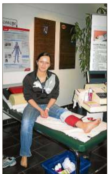
Messung der arteriellen Durchlässigkeit der Beine war am Stand der Klinik Lohrey möglich.