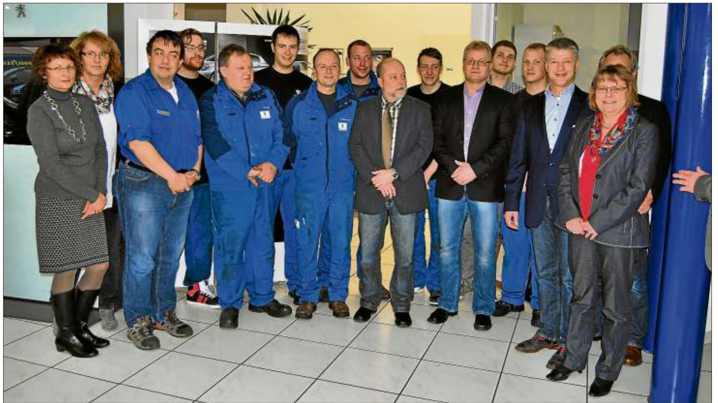
Das gesamte Team des Autohauses Schlichting feierte mit vielen Gästen das 75-jährige Geschäftsjubiläum.

Spessartstr. 77 • Tel. (0 60 50) 70 45 63599 Biebergemünd – Kassel MOTORRÄDER, ATV & ROLLER