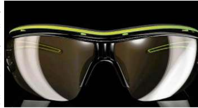
Für den Wintersport ist eine spezielle Sportbrille empfehlenswert.

Rost: Die Kombination von Skisportbrille und Kontaktlinsen ist ideal. Denn hier können Sie je nach Situation Wechselgläser in unterschiedlichen Farben in Ihre Sportbrille einsetzen. Also bei Sonnen-