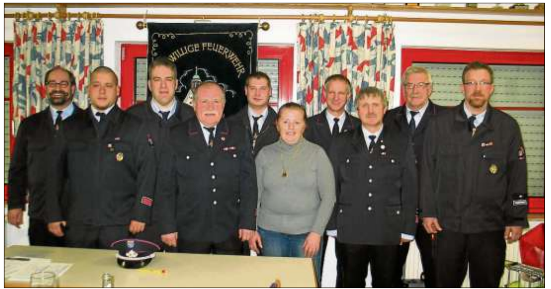
Der Vorstand der Freiwilligen Feuerwehr Ahl.