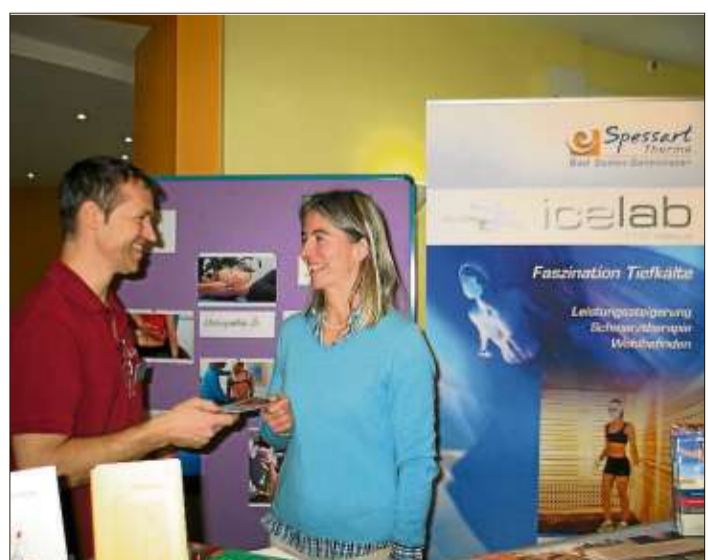
Therapeuten stellten die Angebote der Spessart Therme vor.