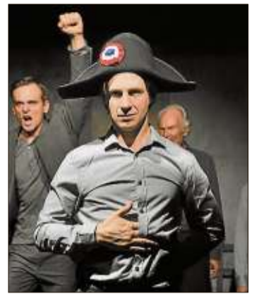
Das Schauspiel „Krieg und Frieden“ wird in der Stadthalle aufgeführt.

Das Schauspiel „Krieg und Frieden“, nach dem Roman von Leo Tolstoi, erzählt vor dem historischen Hintergrund der Napoleonischen Kriege und dem Russlandfeldzug des französischen Kaisers die Geschichte dreier Adelshäuser und deren unterschiedlichen Wertevorstellungen. Karten im Vorverkauf gibt es im Büro für Touristik-Kultur-Freizeit, Krämerstraße 5, Telefonnummer (06661) 85-359 oder unter info@schluechtern.de, in den Buchhandlungen Karman und „Schöne Seiten“ in Schlüchtern. Der Eintritt beträgt zwischen 15 und 18 Euro. Schulklassen zahlen zehn Euro pro Schüler.