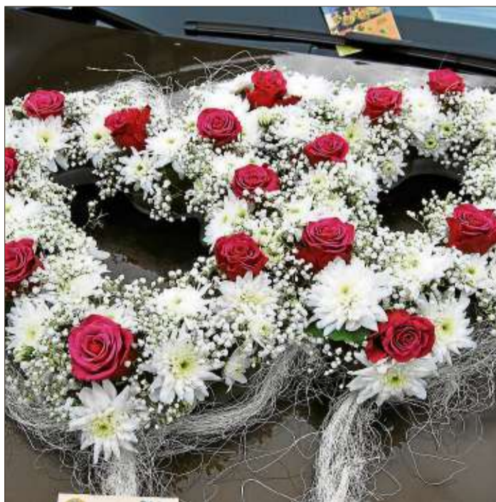
In einer bunten Blütenpracht verbergen sich Botschaften.