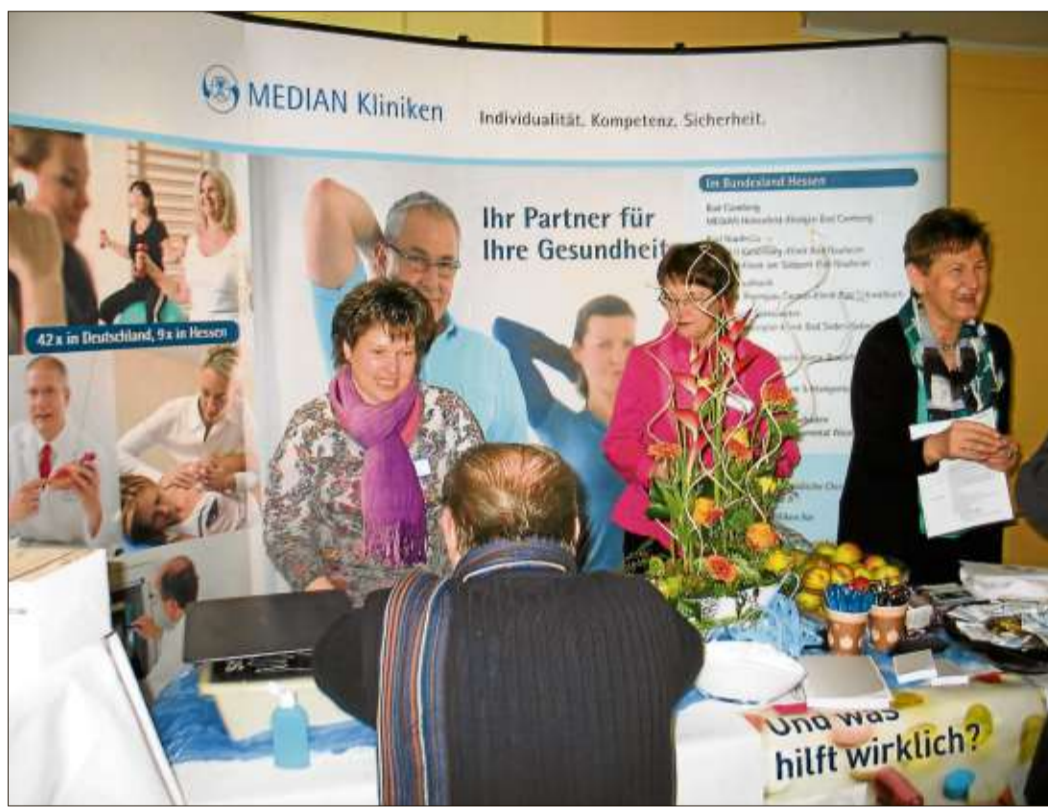
Freundliche Beratung am Stand der Median Kinzigtal Klinik.

Ein umfangreiches Themenspektrum behandelten die Mediziner und Fachreferenten in ihren Vorträgen im Konzertsaal der Spessart Therme. „Vergesslichkeit im Alter“, „Rückenschmerzen“, „Prostataerkrankungen und Harnsteinleiden“, und „Die Bedeutung von multiresistenten Erregern in der Reha“ waren nur einige der vielen Vortragsthemen.