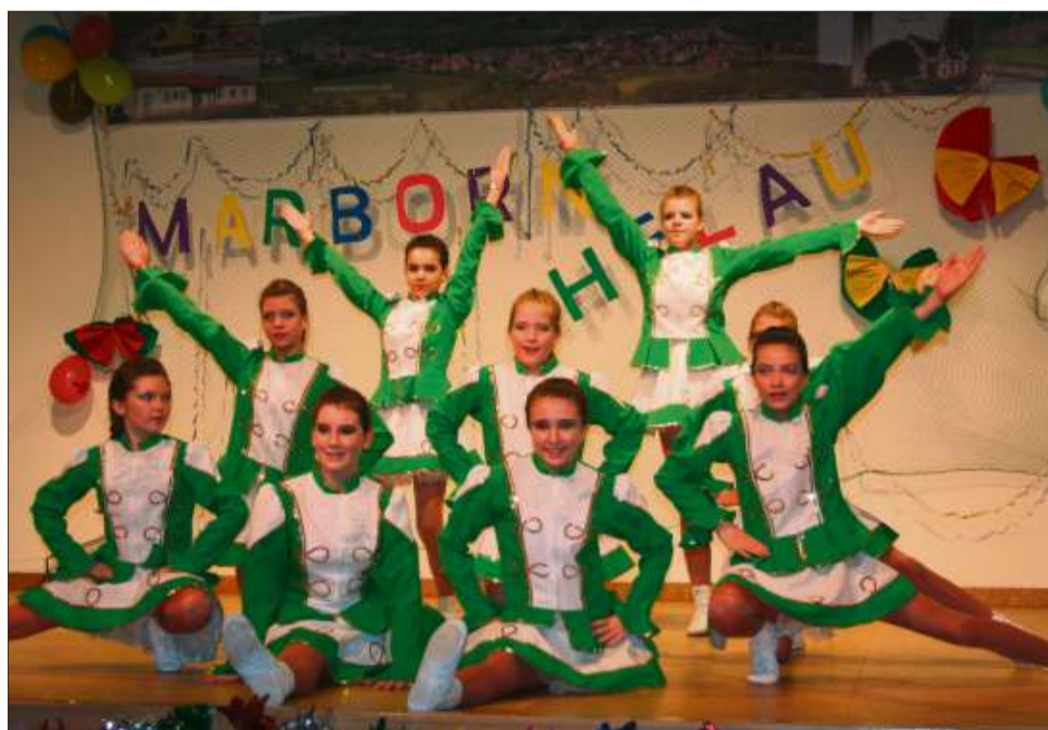
Die gastgebende Marborner Grüne Garde.