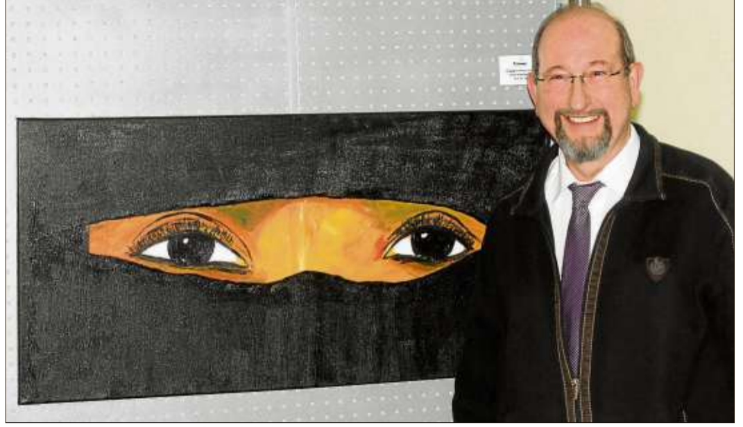
Strotts „Träume“ in Acryl auf Leinwand.

Zahnarzt: Für Notfälle außerhalb der Sprechzeiten ist der diensthabende Arzt über die Zentrale Notdienst-Nummer für den Bereich Zahnmedizin, Tel. (01805) 607011, zu erfragen.