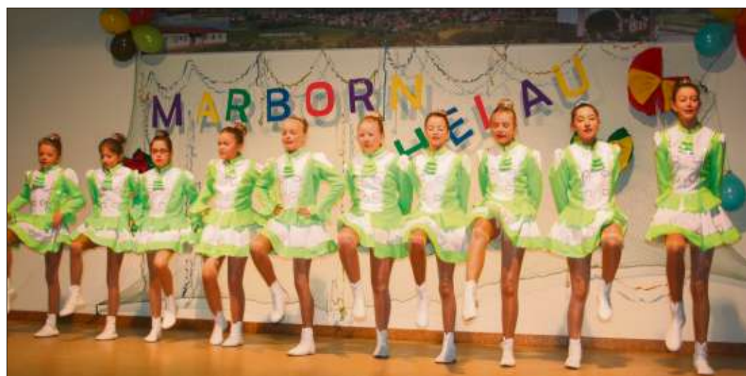
Die Gruppe „Ramba Zamba“ aus Hintersteinau schwang die Beine.