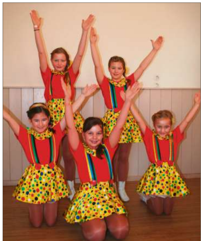
Als Clowns präsentierte sich die Minigarde Marborn.