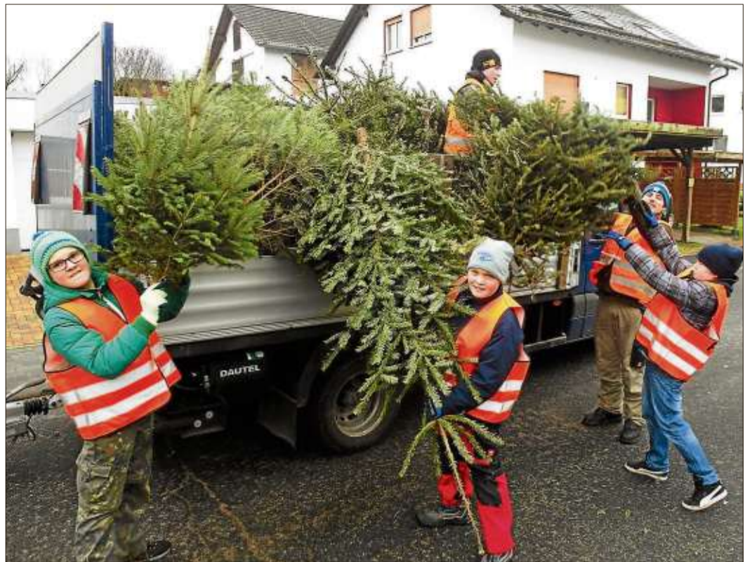
160 ausgediente Weihnachtsbäume sammelte die Feuerwehr Mernes ein.