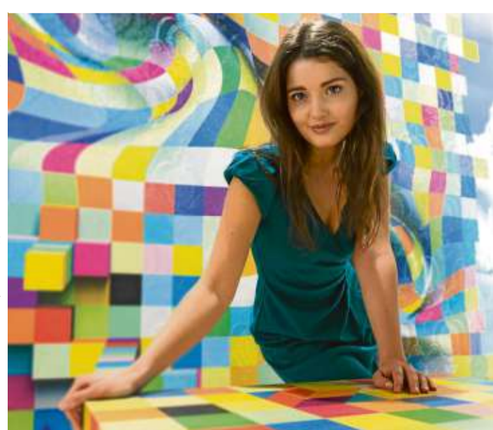
Farbenfrohe Stoffe für die eigenen vier Wände.

Bei den Farben selbst tut sich einiges. Schwarz und Weiß werden in diesem Jahr sehr beliebt im Bereich der Heimtextilien, aber auch farbenfrohe Töne finden sich bei den Ausstellern der Heimtextil. Zu sehen natürlich auch bei den Nachwuchsdesignern. Colorkitchen aus Deutschland etwa deckt das ganze Spektrum an Textilien rund um Ess-tisch und Küche ab: edle Leinentischwäsche, robuste Baumwoll-Ripse, fröhliche Küchenhandtücher und die passenden Kissen.