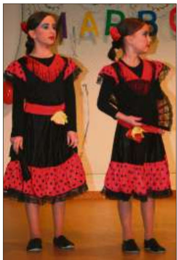
Die Marborner „Butterflies“ wussten als Spanierinnen zu gefallen.

Eine Vielzahl von Tanzgruppen aus der ganzen Region präsentierte sich