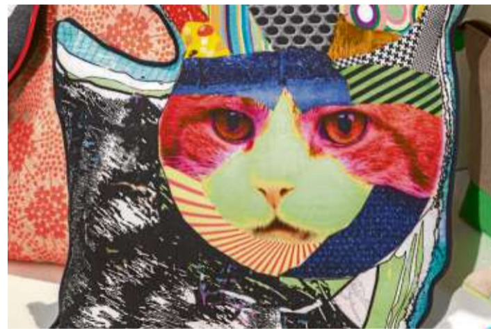
Termotive sind weiterhin sehr beliebt.