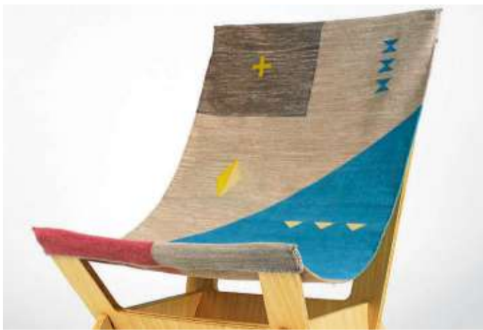
Naturtöne und Materialien sind ein Trend auf der Heimtextil. Foto: Messe Frankfurt Exhibition GmbH. The Dhurrie Chair by Pål Rodenius, photography by Hugh Frost