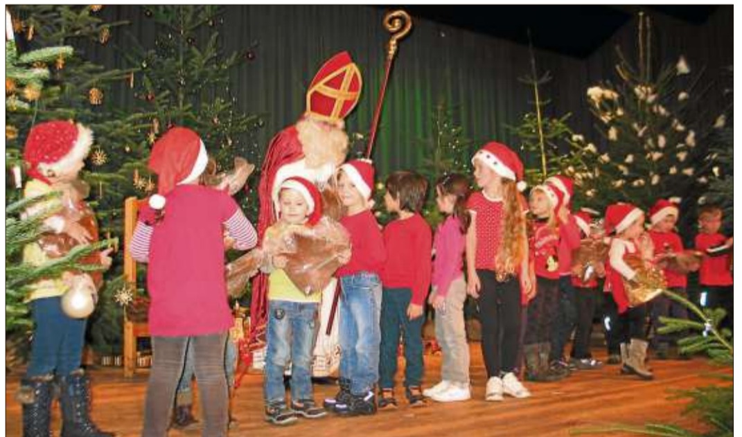
Die Kinder des Sportkindergartens freuen sich nach ihrem bezaubernden Auftritt über die großen Lebkuchenherzen von St. Nikolaus.