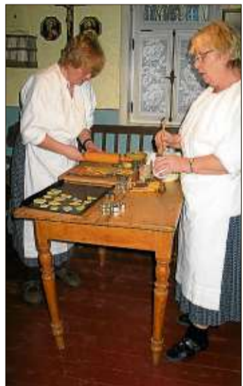
In der Küche des Heimatmuseums dufteten die Plätzchen.

Der Ortsbeirat lädt zum 13. Mal zu diesem stimmungsvollen Weih-