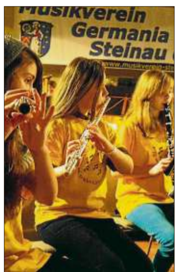
Die Bläserklasse der Brüder-Grimm-Schule bot rockige Lieder.