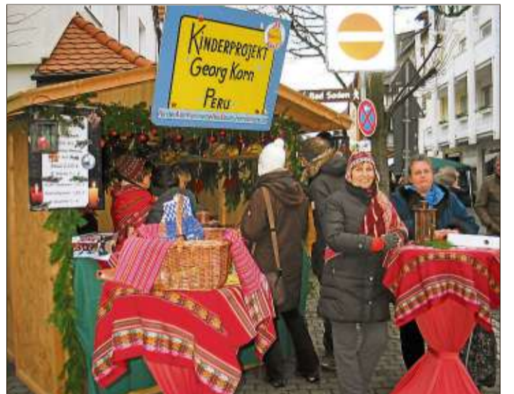
Spezialitäten und Geschenkartikel waren am schön dekorierten Stand zugunsten des Georg-Korn-Projekts zu haben.

achtsmarkt in gemütlichem Ambiente ein. Neben verschiedenen Verkaufsständen, die unterschiedliche Geschenkideen zum Weihnachtsfest sowie handgefertigten Glasschmuck und Geschenkkarten anbieten, wird ein umfangreiches Rahmenprogramm auf die Advents- und Weihnachtszeit einstimmen.