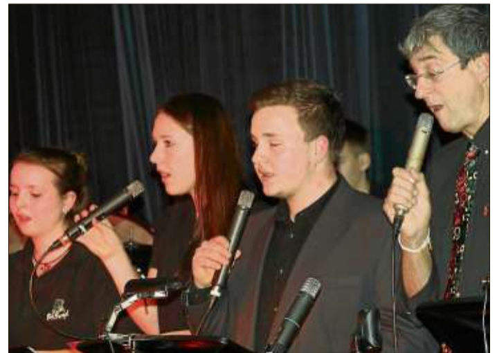
Das neu formierte Huttenquartett bereicherte das Weihnachtskonzert.

dem Lennon-Hit „Happy Xmas“. Mit dem Weihnachtskonzert haben die Klangkörper des Ulrich-von-Hutten-Gymnasiums eindrucksvoll bewiesen, dass sie den Verlust von zwei Abiturjahrgängen und insgesamt 24 Mitglieder der Oberstufe verkraftet und ausgeglichen und bei den jungen Musikern das richtige Gefühl für Musik entwickelt haben.