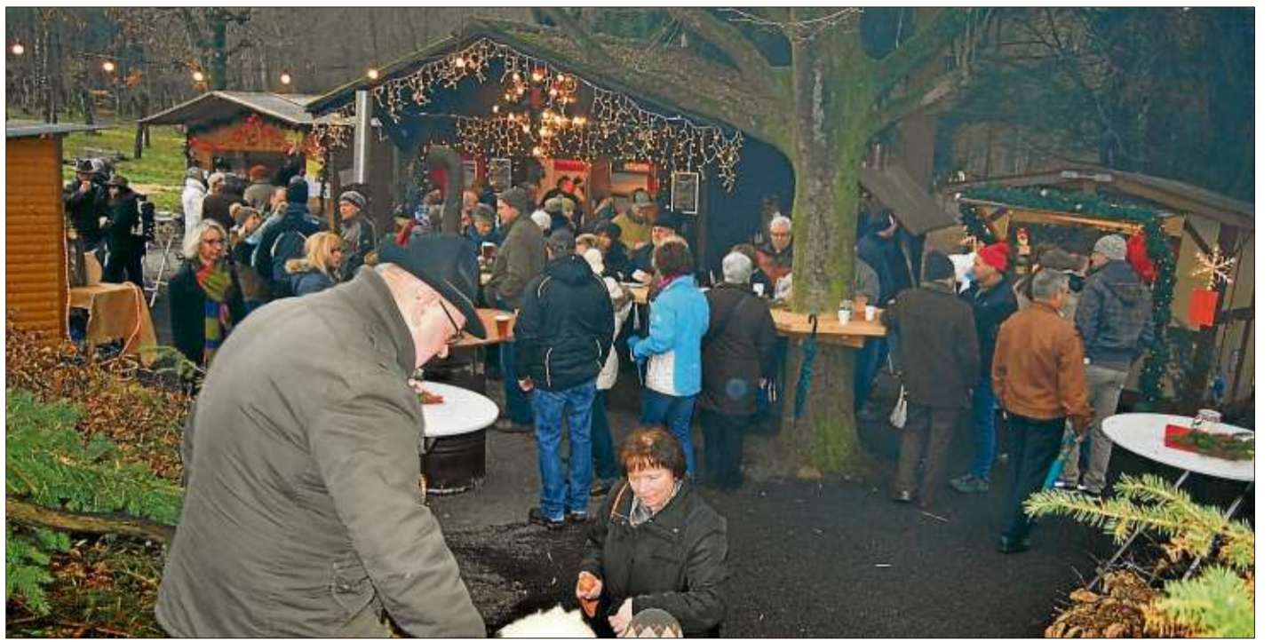
Romantisch und festlich geschmückt präsentierte sich der kleine Weihnachtsmarkt am Acis.