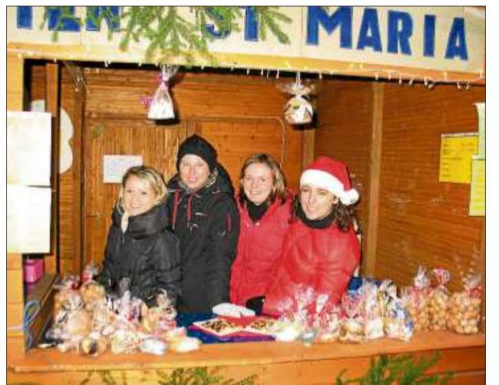
Süße Leckereien gab es am Stand des Kindergartens St. Maria.

penlandschaft aufgebaut war. Das gesamte Museumsgebäude duftete nach frisch gebackenen Butterplätzchen, das Wohnzimmer erstrahlte in weihnachtlichem Glanz und rief Erinnerungen an die Weihnachtsfeste früherer Zeiten wach.