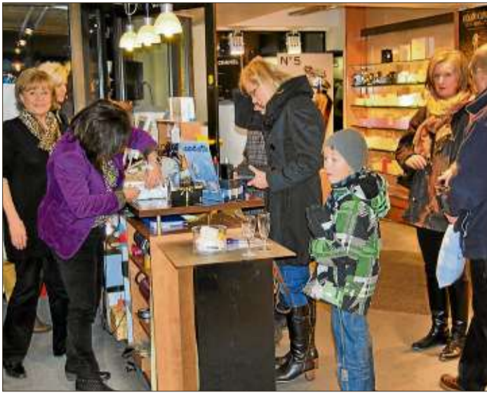
Stets gut besucht war die Parfümerie Roth, wo den Kunden neue Düfte vorgestellt wurden.