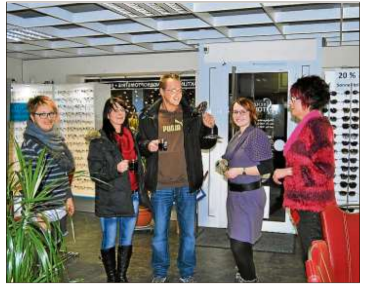
Viel Zeit zum Ausschauen des perfekten Brillengestells hatten diese Kunden im Optikergeschäft Stoffuss.