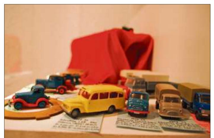
Historische Modellautos im Maßstab 1:87 sind noch bis Ende Februar im Bergwinkel-Museum zu sehen.