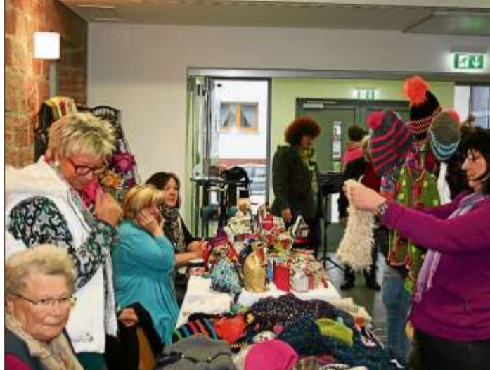
Zahlreiche Anbieter waren am ersten Kressenbacher Kreativ-Markt vertreten.