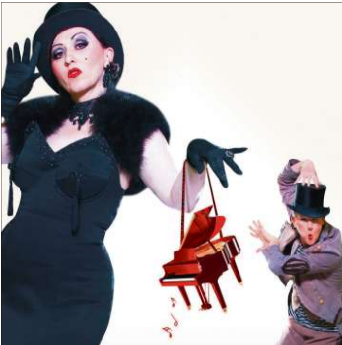
Entertainment, Musik und Comedy heißt es am Sonntag, 15. Dezember, um 19 Uhr mit Miss Evi und Mr. Leu.