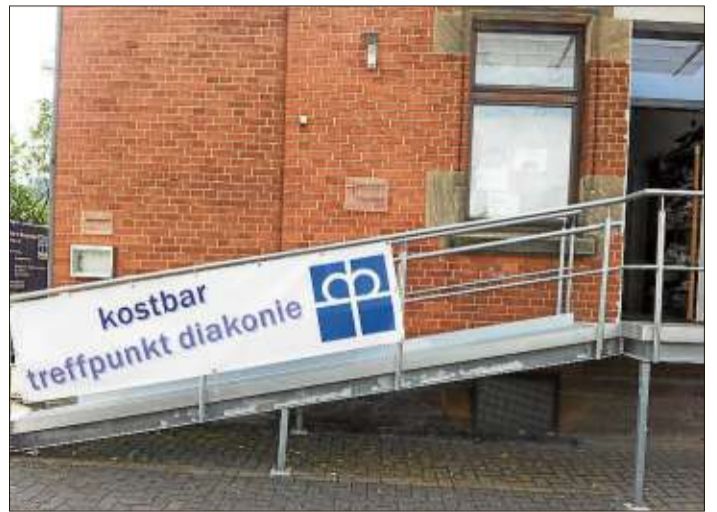
Ein großes Banner prangt am Eingang zu kostbar – treffpunkt diakonie.

Vorab wurden die Probleme und Fortschritte erläutert, und die Reiter legten einen kleinen „Proberitt“ ihrer normalen Arbeitsphase ab. So konnte Hackl einen kurzen Einblick gewinnen und darauf basierte das weitere Vorgehen am Wochenende. Die Teilnehmer waren aus dem Main-Kinzig-