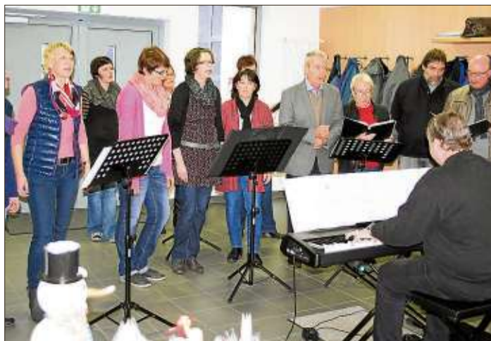
Der Chor Calypso der Chorgemeinschaft Kressenbach/Uerzell unterhielt mit einigen Liedbeiträgen.