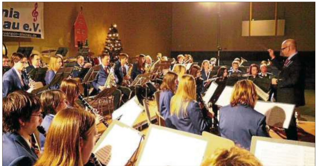
Das Stammorchester bot ein Konzert der Extraklasse und hatte einige Highlights zu bieten.