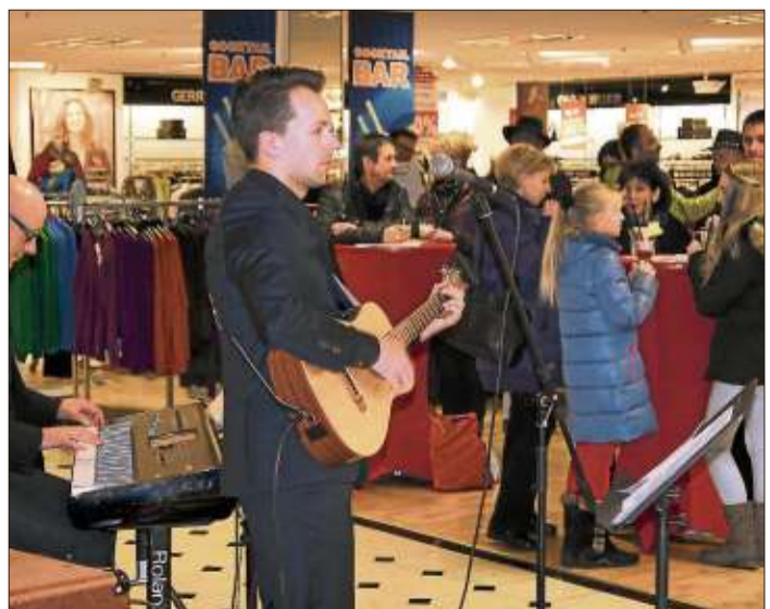
Musik und Cocktails gab es beim Nightshopping im Langer Einkaufsland.

Zahnarzt: Für Notfälle außerhalb der Sprechzeiten ist der diensthabende Arzt über die Zentrale Notdienst-Nummer für den Bereich Zahnmedizin, Tel. (01805) 60 70 11, zu erfragen.