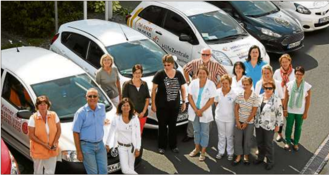
Die Mitglieder des Arbeitskreises Qualitätssicherung Ambulanter Pflege im Main Kinzig Kreis.