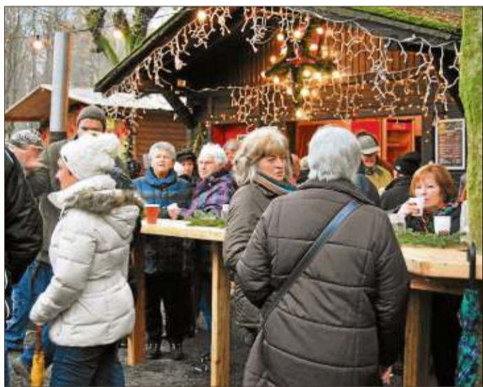
Unzählige Besucher waren zur Waldweihnacht am Acis gekommen, wo an elf Ständen geschlemmt, geschaut und gekauft werden konnte.

ne bestimmte Einkommensgrenze nicht überschreitet, kann sich dort gegen einen Beitrag von drei Euro mit Lebensmitteln versorgen. Geöffnet sind die Tafeln von Montag bis Freitag zwischen 8.30 und 11.30 Uhr. Ausgabestellen gibt es in Bad Soden-Salmünster, Schlüchtern, Sterbfritz und Steinau. Informieren können sich Kunden auch unter Telefon (06661) 6078400.