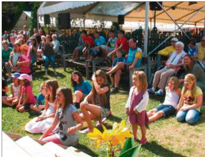
Begeistert verfolgten die Zuschauer die Darbietungen der Künstler auf der Variété-Bühne.