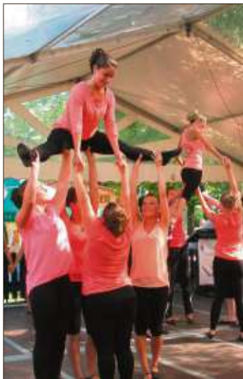
Die Tanzsportlerinnen des TV Haitz zeigen akrobatische Tanzkunst.