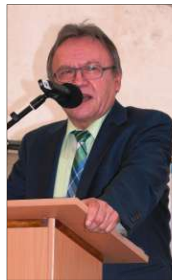
Landrat Erich Pipa.