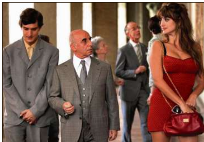
Woody Allens zauberhafte Liebeskomödie „To Rome With Love“ ist in den Originalsprachen Englisch und Italienisch mit deutschen Untertiteln zu sehen.

Nachdem der Mondmann sein lunares Domizil verlassen und auf der Erde angekommen ist, trifft er auf einen garstigen Präsidenten, der sich bereits den gesamten Globus untertan gemacht hat. Er hält den Mondmann für einen gefährlichen Eindringling, der hinter Gitter gehört. Zum Glück lernt der friedliebende Außerirdische den Erfinder van der Dunkel kennen.