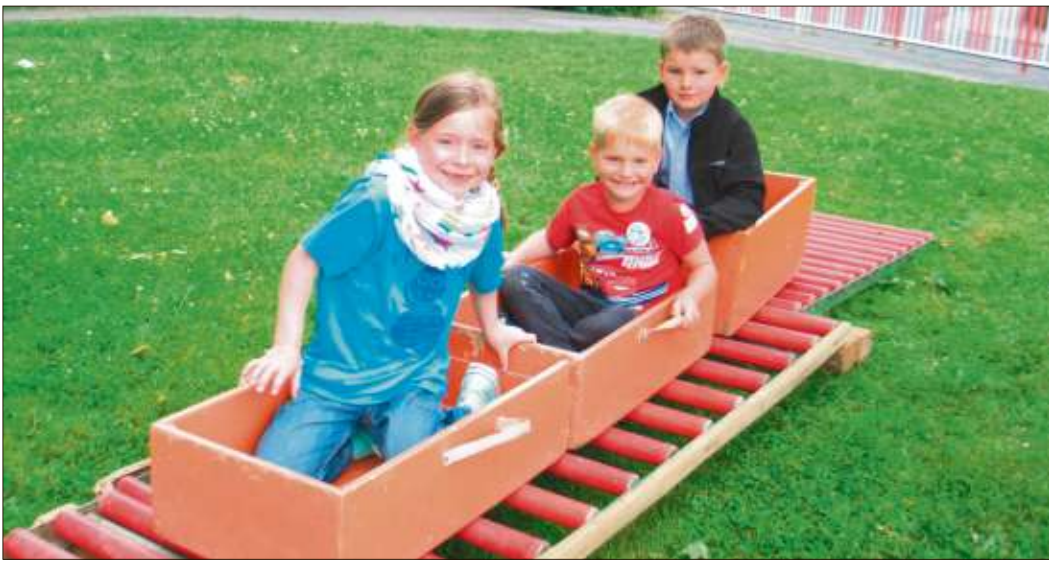
Auf dem Pfarrfest St. Paulus hatten die Kinder viel Freude an der Fahrt auf der Rollbahn.