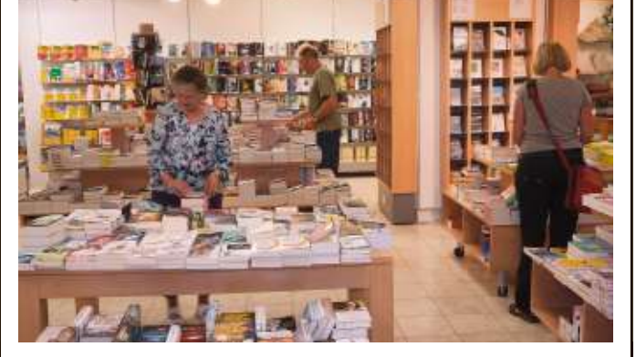
Die Buchabteilung im Erdgeschoss des Kaufhauses findet guten Zuspruch.

man das CoLibri Cover System angeschafft. Die Hüllen werden ohne Klebstoff und Schere erstellt, die Kanten verschweißt. Der Kunde bekommt seine Bücher schützend foliert, wie in einer