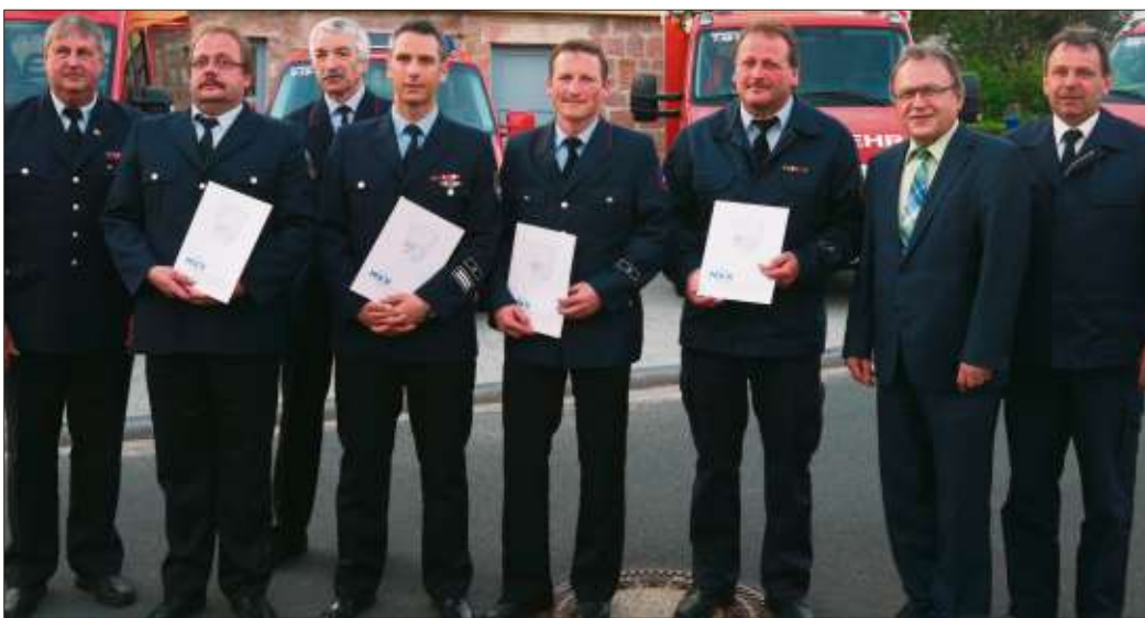
Die Wehrführer aus Hutten, Breitenbach, Kressenbach und Klosterhölfe freuen sich über neue Fahrzeuge.