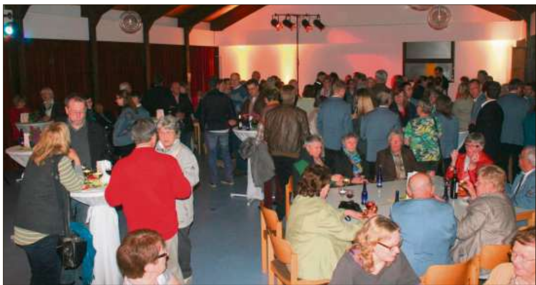
Die Konzertbesucher und Musiker beim gemütlichen Beisammensein nach dem Konzert im Gemeindehaus.

Schlüchtern (vis). Wegen des Sommerfestes des Gama-Altenhilfeszentrums Schlüchtern wird die Straße „An den Lindengärten“ am Dienstag, 20. August, ganztägig gesperrt. Der Verkehr wird über die Lotichiusstraße, die Poststraße und die angrenzenden Gemeindestraßen umgeleitet. Der Parkplatz „An den Lindengärten“ bleibt befahrbar.