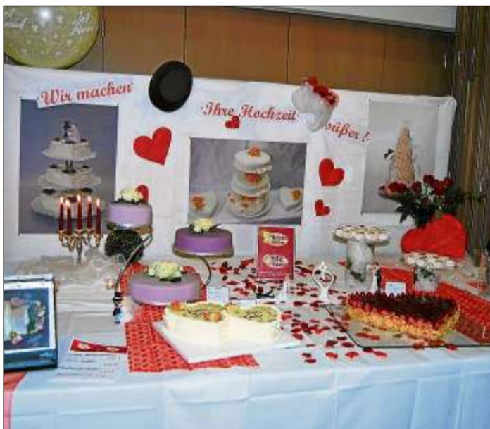
Leckere Hochzeitstorten und -kuchen präsentiert der Fünf-Meister-Bäcker.