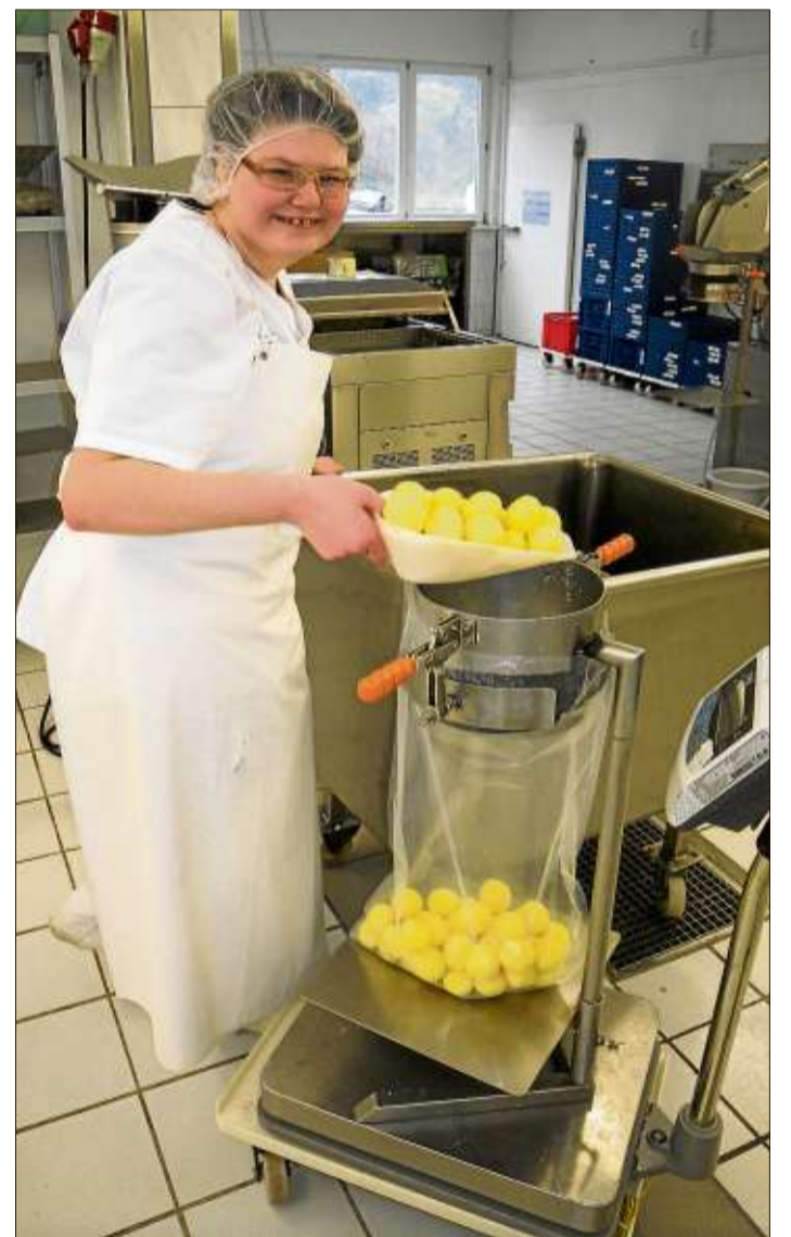
Hier werden die geschälten Kartoffeln abgewogen und verpackt.

Gelnhausen-Roth (rs). In der Kinzhalle in Gelnhausen-Roth findet am Sonntag, 24. Februar, von 10 bis 15 Uhr ein Modelleisenbahn-, Modellauto- und Spielzeugmarkt statt.