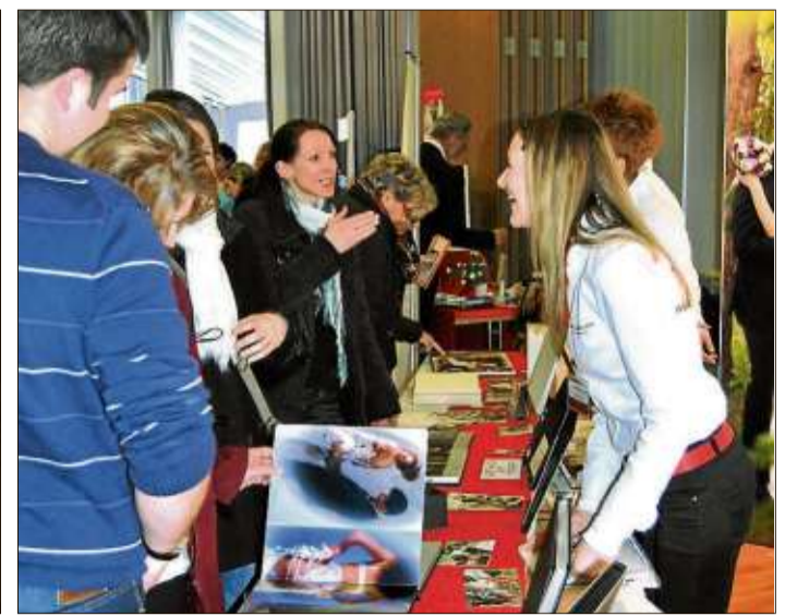
Über moderne Fotografie informierte der Fotofreund.