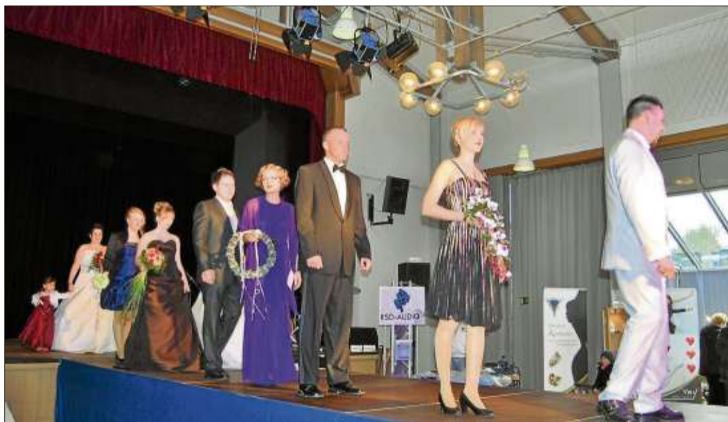
Ob Abend-, Braut-, oder Cocktailkleid, für jede Gelegenheit war etwas bei der Modenschau dabei.