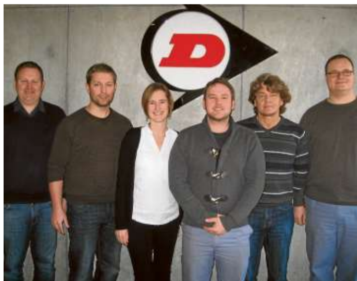
Die Ausbilder der Goodyear Dunlop, die das Programm „Wir entwickeln Persönlichkeit“ begleiten.“

HANAU (ex). Mit unserer Ausbildung, egal in welchem Beruf, sichern Sie sich einen optimalen Start in die Zukunft. Und mit dem neuen Programm „Wir entwickeln Persönlichkeit“, das Sie über die gesamte Zeit begleiten wird, wird Ihre Ausbildung zu einer absolut runden Sache! Während Sie durch die Berufsschule, Ihre Abteilungen, Ihre Ausbilder und innerbetrieblichen Unterricht fachlich gefördert werden, steht bei „Wir entwickeln Persönlichkeit“ die Entwicklung Ihrer persönlichen Kompetenzen im Vordergrund. Die Seminarreihe besteht aus sieben