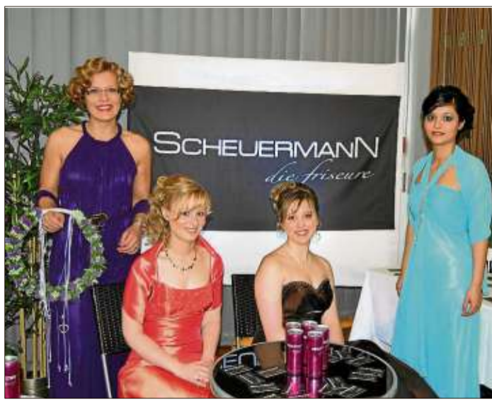
Die Models wurden von Scheuermann – Die Friseur frisiert.