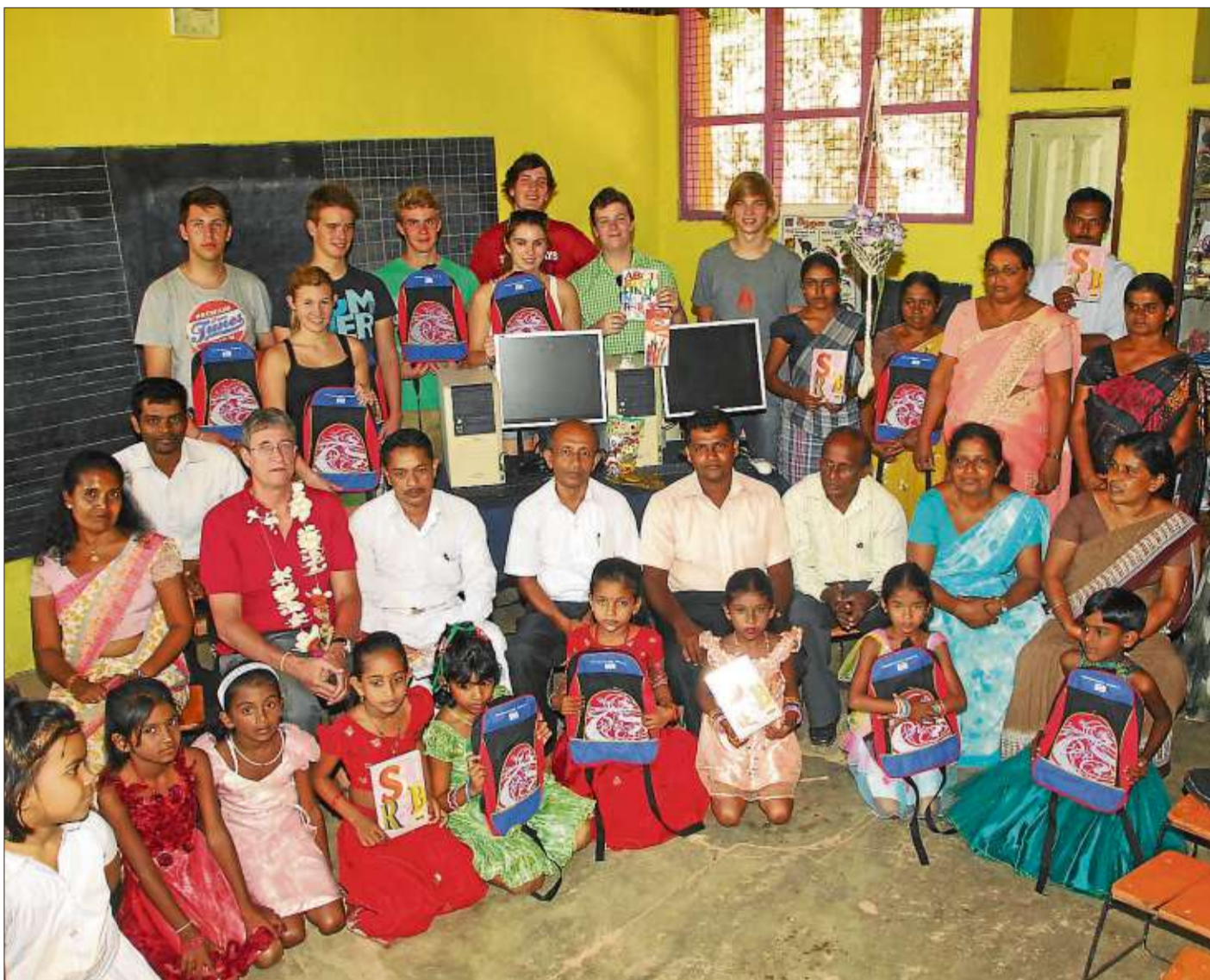
Neben der Patenschule in Ahangama konnte drei weiteren Schulen mit der Ausstattung von Computern, Druckern und anderem geholfen werden.