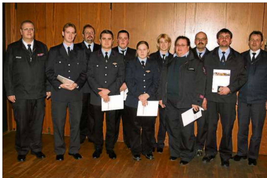
In der Delegiertenversammlung der Jugendfeuerwehren des Unterverbandes Schlüchtern wurden diese Jugendwarte mit der Florianmedaille der hessischen Jugendfeuerwehren ausgezeichnet.