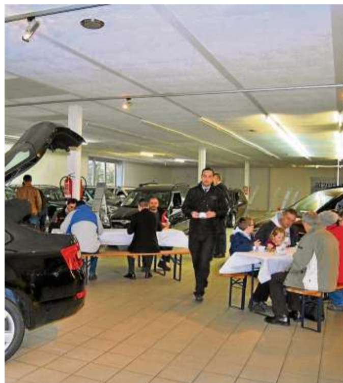
Zahlreiche Besucher kamen um den neuen Skoda Octavia in Augenschein zu nehmen.