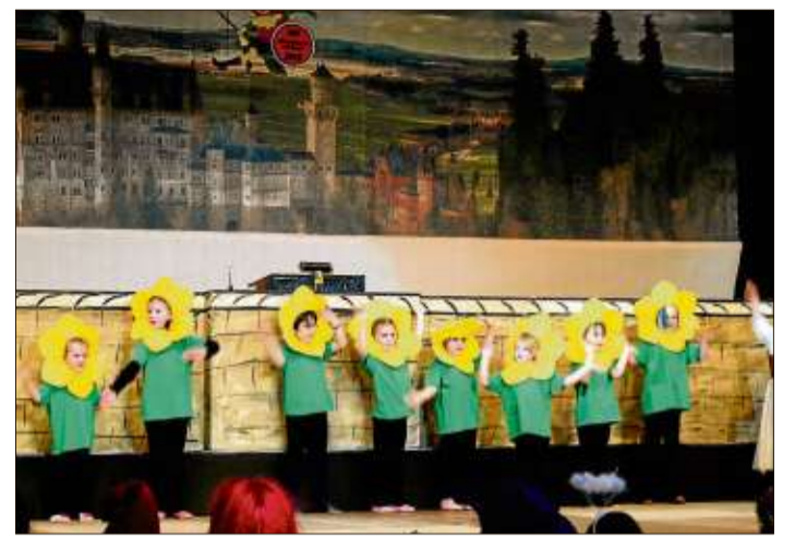
Diese süßen Blümchen sorgten für gute Stimmung.

Neben den aktuellen politischen Themen, sprach Schneider in seinem Rechenschaftsbericht auch andere Vereinsaktivitäten an. Wieder besuchte die JU mit fast 200 Steinauer Jugendlichen die Lohrer Festwoche,