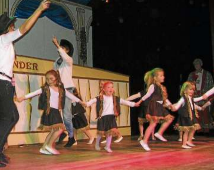
Die kleinste Garde des SCC, die „Minis“, zeigte einen Cowboy-Tanz.

Sinntal-Schwarzfels (rs). Ein Stammtisch des Imkervereins Sinntal findet am Mittwoch, 6. Februar, um 19.30 Uhr im Landgasthof Wittenzellener in Schwarzfels statt. Nach kurzem Gedankenaustausch steht ein Filmabend zum Thema „Bienen“ auf dem Programm. Der Vorstand lädt die Mitglieder der Imkervereine der Umgebung und alle Interessierten ein.