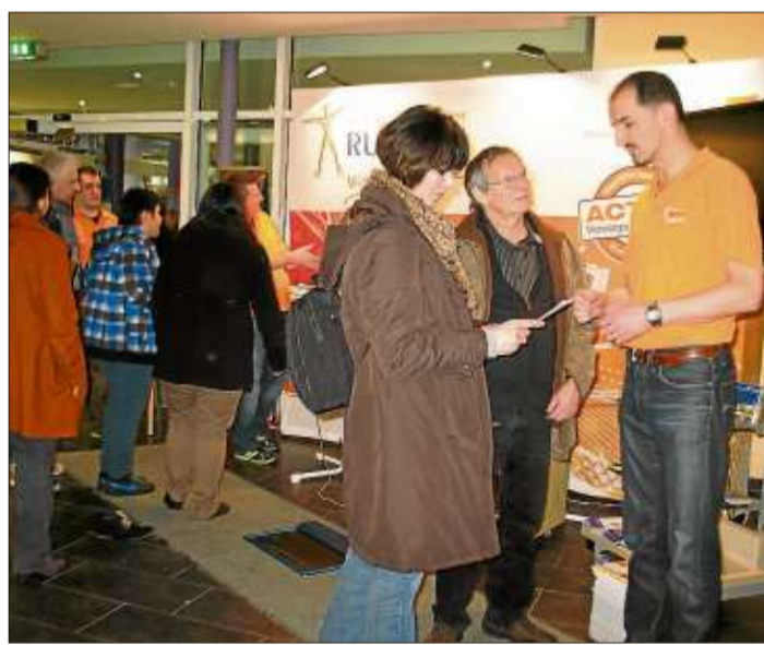
Fußdruckmessungen bei Vitalzentrum Ruppert.

Gesundheits-Checks, wie Blutzucker- und Blutdruckmessungen, Gleichgewichtskontrolle, die Messung des Fußdrucks und ergotherapeutische Übungen konnten die Besucher an den Ständen der Gesundheitsdienstleister problemlos in Anspruch nehmen.