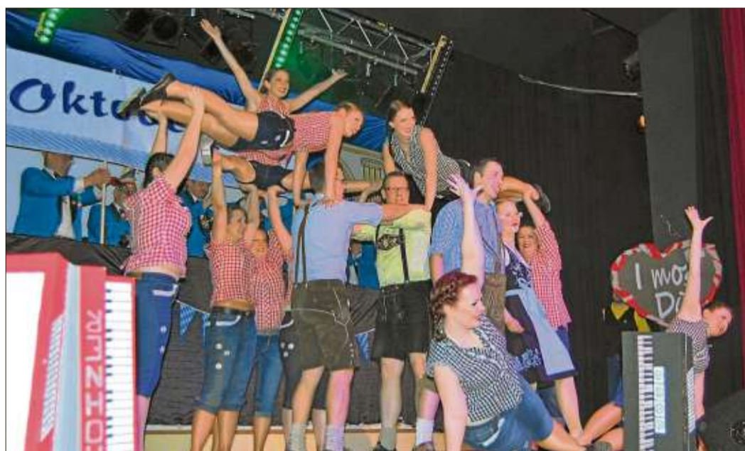
Mit den Knallfröschen ging es zum Oktoberfest.