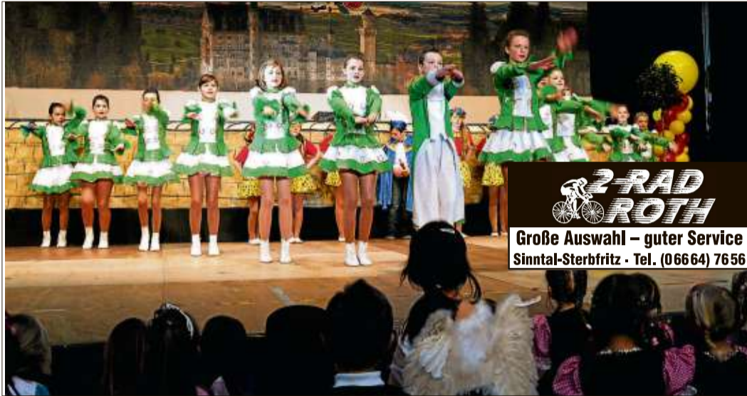
Der Tanz der Grünen Garde aus Marborn faszinierte die kleinen Narren so sehr, dass sie sich an der Bühne drängelten.