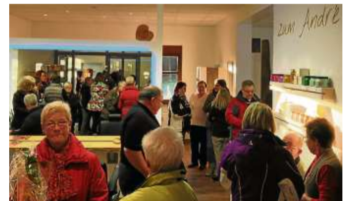
Viele Freunde und Kunden kamen zur Eröffnung.