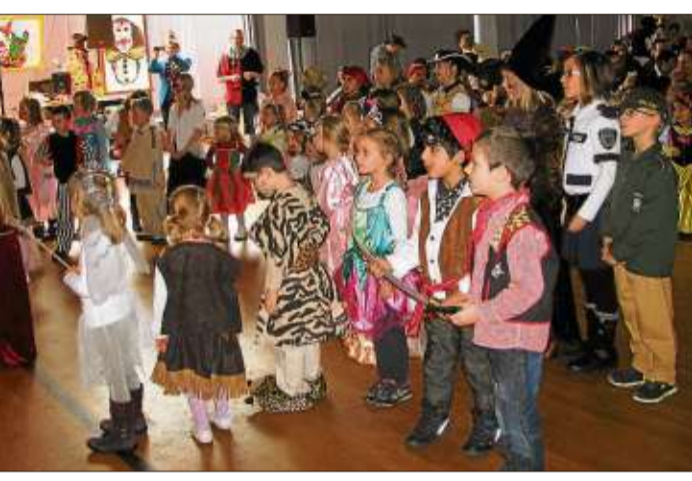
Viel Spaß hatten die kleinen Närrinnen und Narren bei ihrem Kinderfasching in der Stadthalle.