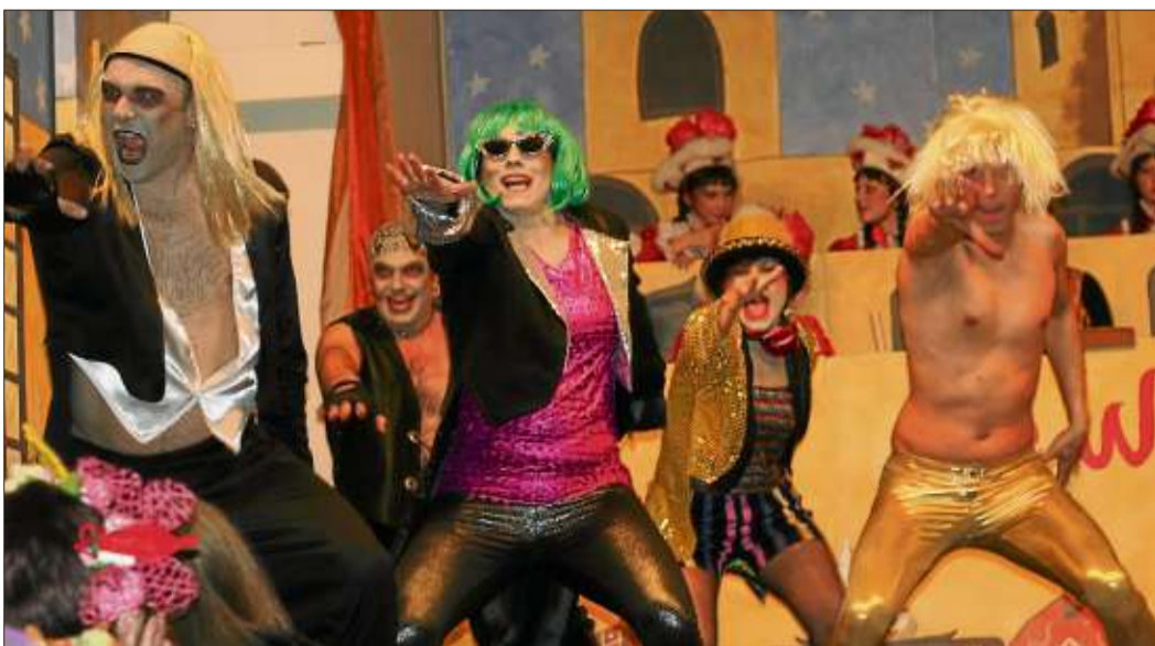
Gelungen: Rocky Horror bei der Wellblooe.