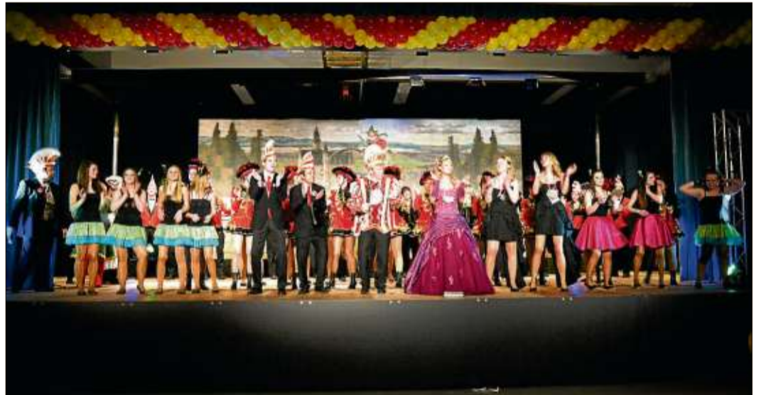
Die Narrenunft aus Mittelkalbach kam mit Kind und Kegel nach Steinau, um gemeinsam mit den Zuschauern eine Party zu feiern.

Die vielen Helfer des Vereins konnten stolz auf den gelungenen Verlauf der Veranstaltung sein und positiv dem Faschingsumzug in Steinau am Samstag, 9. Februar, entgegenblicken. Bevor der bunte Lindwurm aber stattfindet, gibt es für Faschingsbegeisterte noch verschiedene Termine in Steinau. Weitere Informationen unter www.skv-hanneklasia.de .