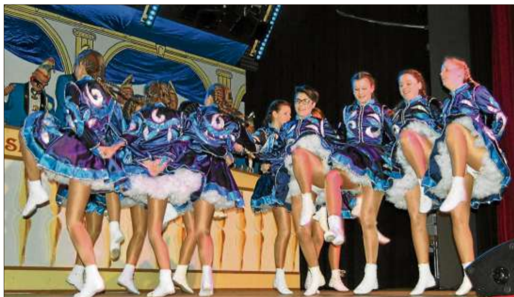
Die Zündhölzchen zeigten einen Gardetanz.