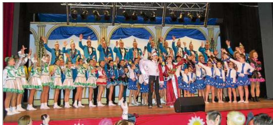
Nach dem Einmarsch bot sich ein farbenprächtiges Bild.