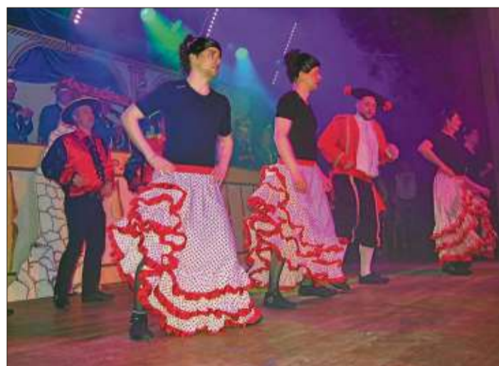
Das Männerballett mit einer turbulenten Bühnenshow.