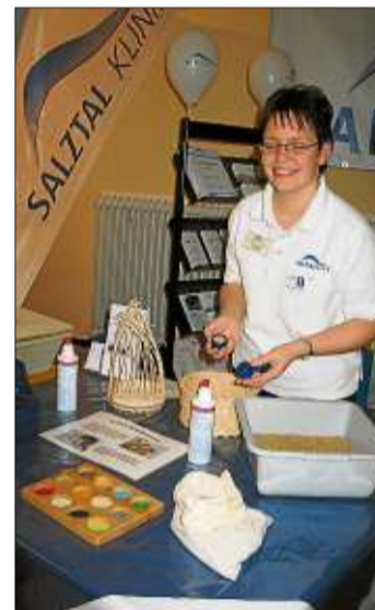
Fühl-Memories konnten die Besucher am Stand der Salztalklinik ausprobieren.

Die Diagnose eines Aneurysmas mit anschließender Herzoperation setzte seiner sportlichen Laufbahn 2011 ein jähes Ende. Das baldige Ende der Sportkarriere hatte er aus familiären Gründen sowieso geplant, sagte der zweifache Vater. Die Erkrankung nahm ihm diese Entscheidung ab.