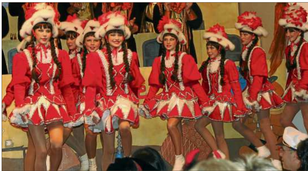
Einzug der Confetti-Garde.