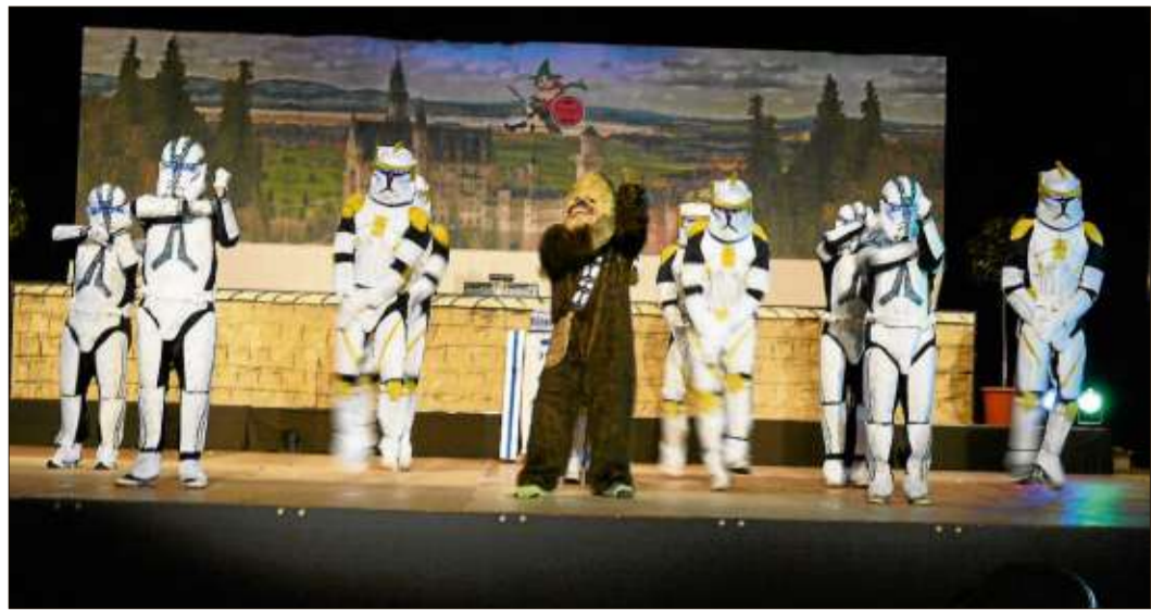
Gewusst wie! Das Männerballett der Schickeria Kothen ließ Frauenherzen schneller schlagen.

Schlüchtern (rs). Die nächste Monatsversammlung des Kleintierzuchtvereins Schlüchtern findet am Donnerstag, 31. Januar, um 20 Uhr in der Gaststätte Hausmann statt.