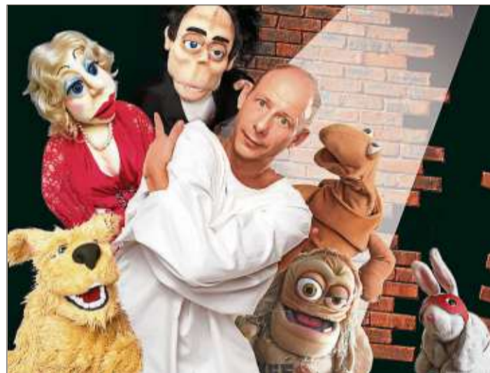
Der Puppenflüsterer gastiert im Eulenspiegel.

Tickets gibt es unter www.eulenspiegel-seidenroth.de .