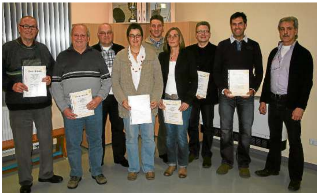
Langjährige Mitglieder wurden in der Jahreshauptversammlung der Feuerwehr Breitenbach geehrt.

Die Sekos ist erreichbar unter den Nummern (06051) 41 62/41 63 und (0160) 431 1424.