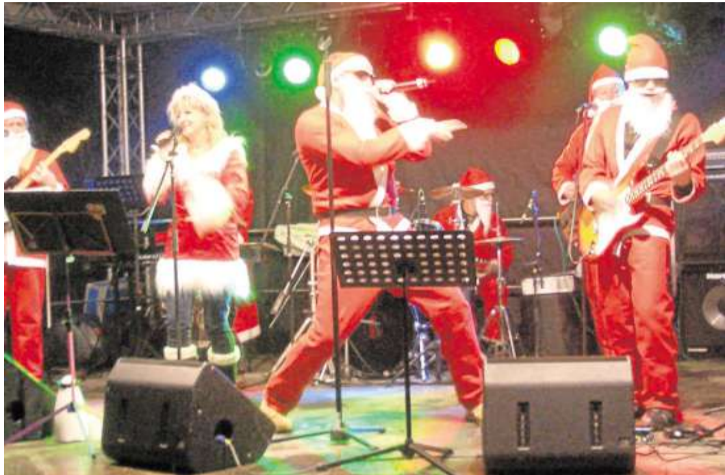
Rockende Weihnachtsmänner unterhalten die Besucher der „Erlebnis-Weihnacht“.

All Neuerungen und Verbesserungen werden sicherlich dazu beitragen, dass der einheitliche Tenor der Besucher der letzten ErlebnisWeihnacht: „das war der beste und außergewöhnlichste Weihnachtsmarkt im ganzen Rhein-Main-Gebiet, einfach fan-