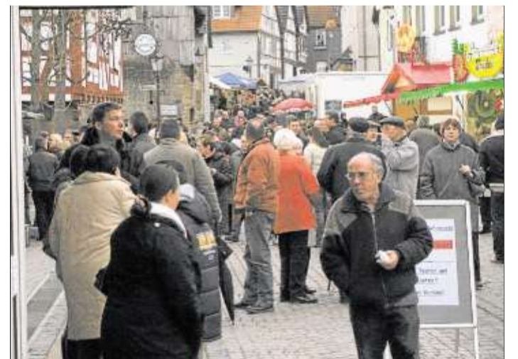
In der Brüder-Grimm-Straße bieten zahlreiche Händler und Gewerbetreibende ihre Waren an.