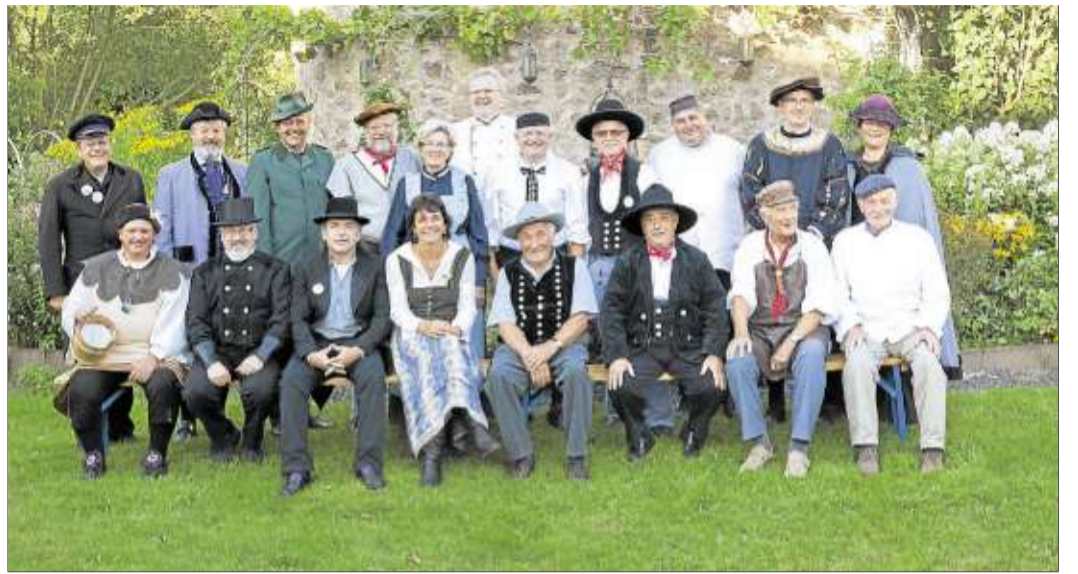
Die Katharinenmarktmeister in ihren schönen Zunftkleidungen.