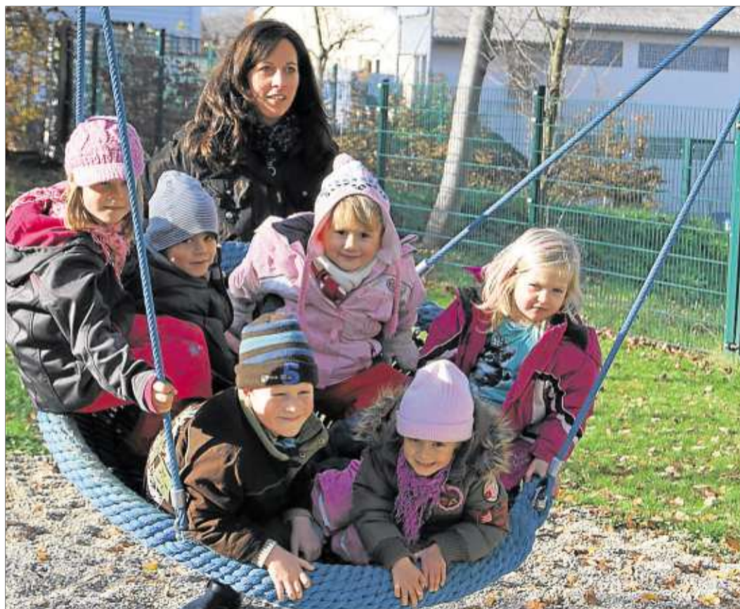
Mit viel Liebe betreut die neue Katharinenmarktmeisterin die Kleinen in der evangelischen Kindertagesstätte Märchenwald, deren Leiterin sie ist.