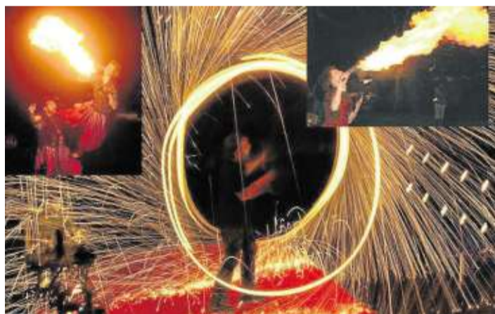
Den Besuchern bieten sich stimmungsvolle Bilder.

Auf dem Rundweg mit Marktplatz werden kleine Schauplätze entstehen, an denen z.B. Kunst-Flammkuchen, Waffeln, Würstchen aller Art, Fisch, Fleischspieße, Champignons, Steaks vom Schwenkgrill, Räuberpfanne, Naschereien, uvam. gesorgt. Für weihnachtliches Ambiente sorgt wieder eine tolle romantische Waldillumination. Zwischen-durch trifft man sich immer wieder vor der Erlebnisbühne, auf der ein tolles Bühnenprogramm dargeboten wird, welches kleine und/oder große Zuhörer in ihren Bann ziehen wird. Zum Beispiel wird man tolle Feuerspektakel /Feuershows erleben und die eigens für die ErlebnisWeihnacht zusammengestellte „Xmas-Band“ wird in entsprechendem Outfit die beliebtesten und bekanntesten internationalen Christmas-Schmalzbrote, Bratäpfel, Crepes, Rock/Popsongs spielen.