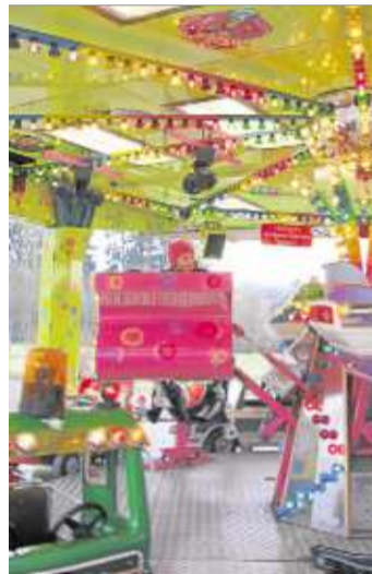
Die Kleinen können sich auf dem Kinderkarussell den Wind um die Nase wehen lassen.