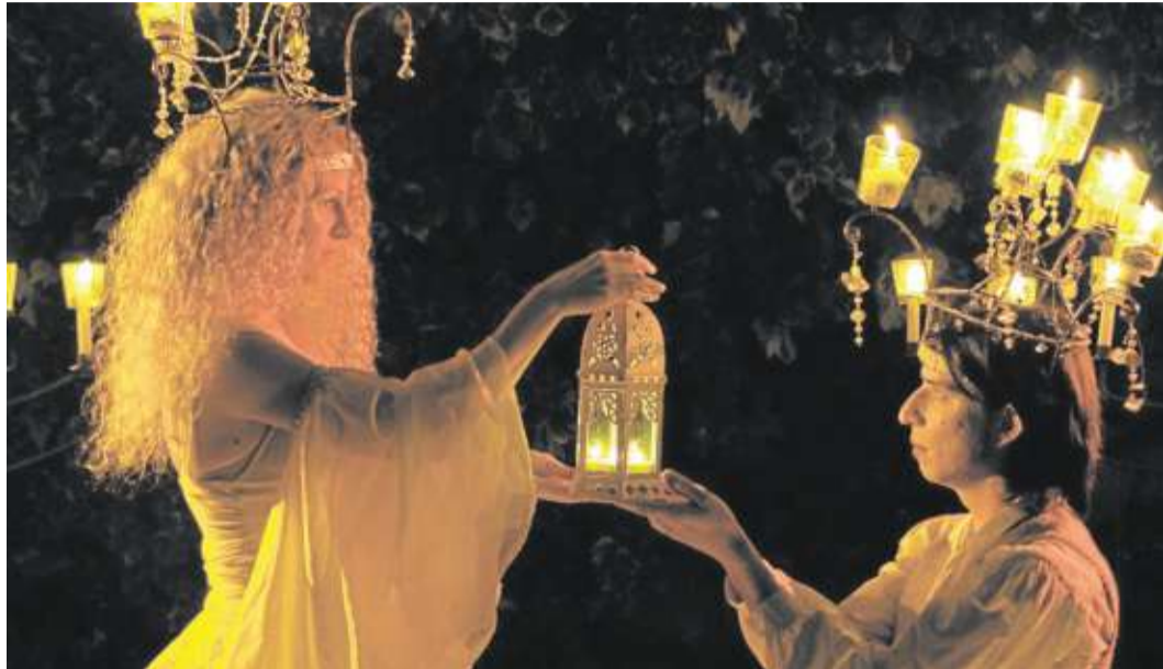
Die verschiedenen Shows der „Erlebnis-Weihnacht“ werden die Besucher in ihren Bann ziehen.

Der ErlebnisWeihnachtRundweg schlängelt sich zwischen Bäumen entlang und überall säumen stimmungsvoll beleuchtete Weihnachtsstände den herzförmigen Rundweg. In der Mitte findet der Besucher ein marktähnliches Areal mit vielen Attraktionen, u.a. auch die Erlebnisbühne. Fackeln oder Lichter-