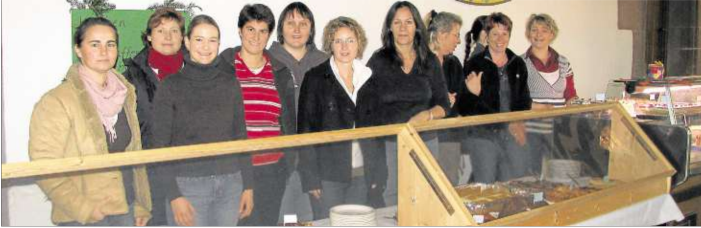
Neben den Schulen bieten auch die Kindergärten eine Kaffee- und Kuchentheke in der Markthalle an.