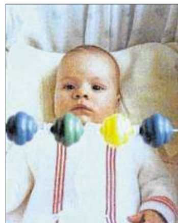
Mit viereinhalb Monaten wusste Klein-Moni noch nichts vom Katharinenmarkt.