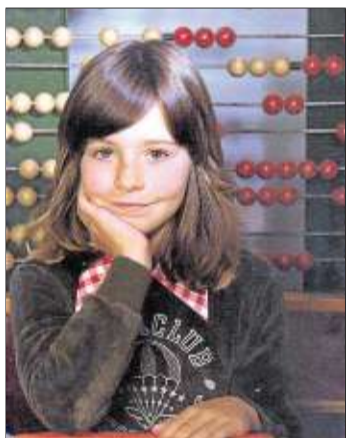
Im Jahr 1979 begann mit der Einschulung der Ernst des Lebens.