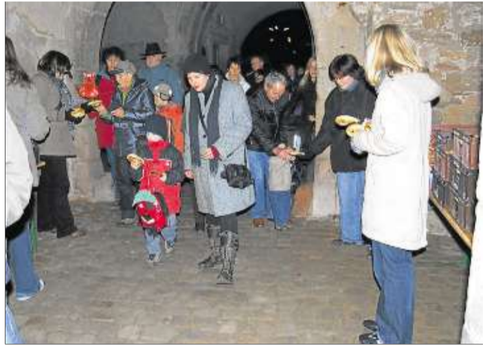
Auch in diesem Jahr werden wieder Brezel an die Kinder verteilt.