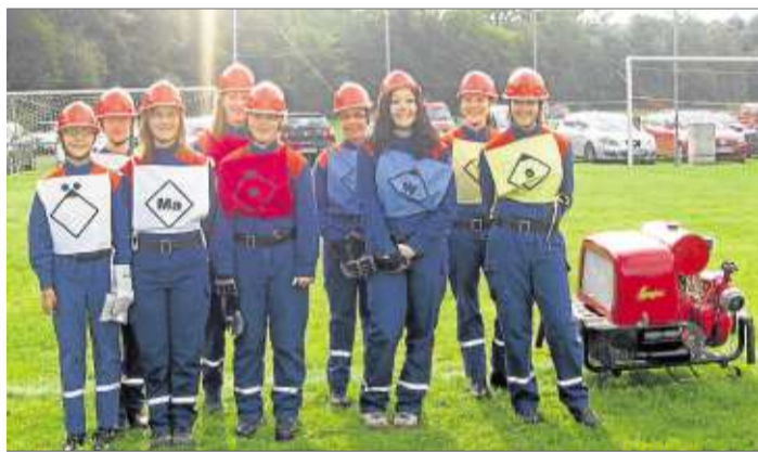
Um die Sieger Die beste Mädchenmannschaft auf dem Platz kam aus Vollmerz.

des Wettbewerbs zu küren, musste das Schiedsrichterteam erst mal rechnen. Das Resultat: Den ersten Platz der Gruppen bei der Stadtmeisterschaft belegte die Jungmannschaft aus Vollmerz, gefolgt von Gundhelm und den Mädchen aus Vollmerz, die somit auch als beste Mädchenmannschaft ausgezeichnet wurden. Beim offenen Pokalwettbewerb der Gruppen gewann Ulmbach den Siegerpokal. Zweiter wurde Breunings, gefolgt von Seidenroth. Den Staffeltwettbewerb