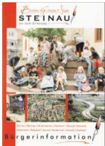
Die Neuauflage der Bürgerinformationsbroschüre ist unter anderem im Rathaus erhältlich.

Bereits zum fünften Mal gibt die Stadt Steinau in Zusammenarbeit mit dem mediaprint infoverlag diesen Wegweiser heraus. Sie möchte ihren Bürgern mit dieser Publikation ein breites Nachschlagewerk rund um das Rathaus und weitere Behörden bieten, aber auch eine Orientierungshilfe zu Freizeit- und Bildungseinrichtungen an die Hand geben. Erhältlich ist die Broschüre ab sofort im Rathaus, im Bürgerbüro und im Verkehrsbüro der Stadt Steinau.