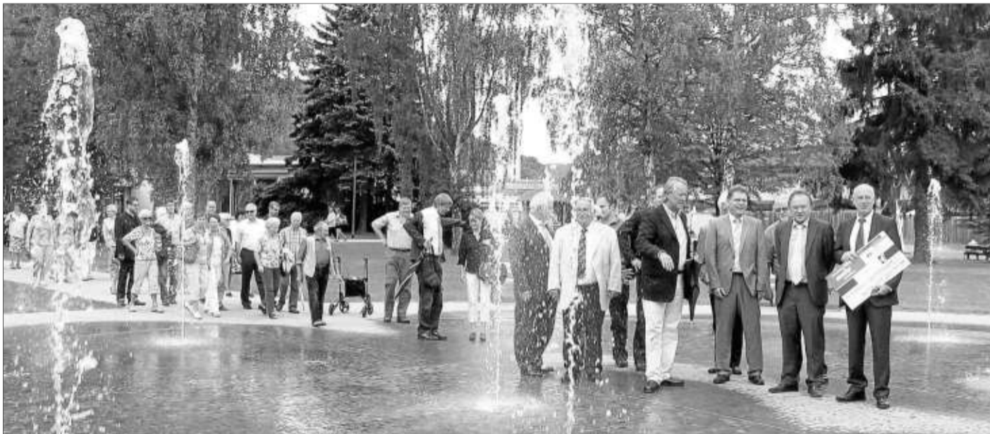
Beim Rundgang durch den neu angelegten Kurpark durchschritten die Gäste mutig den Fontänengarten.