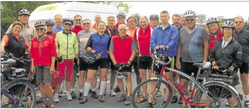
Unser Bild die Radler des Freundeskreises Märchenstraße nach ihrer Ankunft.