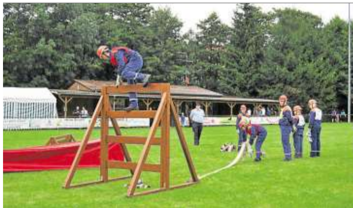
Die Mannschaft aus Breunings auf dem Parcours.

Die einzelnen Wettkämpfe waren in verschiedene Aufgaben unterteilt. So zum Beispiel ging es durch einen Kriechtunnel, über eine Sprossenleiter, bis am Ende der Strecken spezielle Knoten geknüpft werden mussten. Auf der Strecke verlegten die Jugendlichen zusätzlich noch Schlauchleitungen. Der Staffellauf mit einer Gesamtlänge von rund 400 Metern war mit Hindernissen und Aufgaben gespickt, die es zu überwinden und zu lösen galt. Trotz des regnerischen Wetters gaben die jungen Feuerwehrleute ihr Bestes.