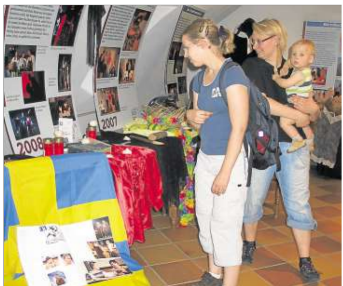
Zehn Jahre Theaterarbeit: Eine Ausstellung dokumentierte die Entwicklung des Ensembles.