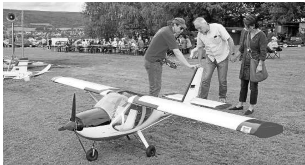
Erfahrungsaustausch war ebenso wichtig wie der eigentliche Flug durch die Lüfte.

Und er hat schon viele Ideen, was er damit machen kann, beispielsweise Plakate drucken und Flyer erstellen für das Kirchenkino oder das Backhausfest, Unterlagen für die Konfirmanden einscannen und vielfältigen. Auch der Förderverein des evangelischen Kindergartens kann die das Hochleistungs-Kopiergerät nutzen.