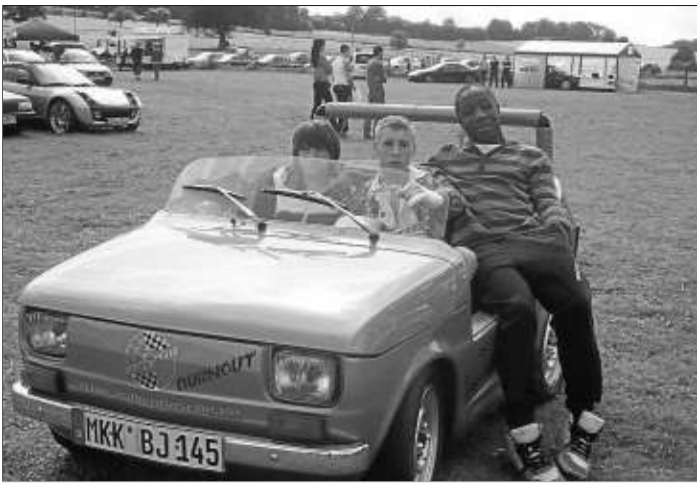
Eine eigenwillige Eigenkonstruktion aus Breitenbach.