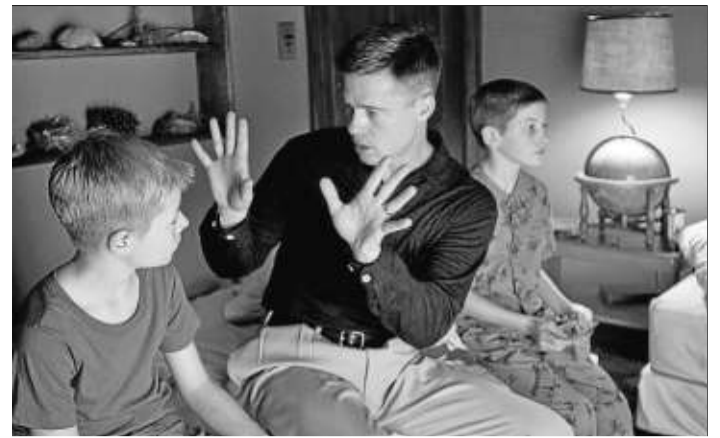
Der Vater (Brad Pitt) glaubt, seine Söhne auf die Härten des Lebens nur vorbereiten zu können, indem er sie mit entsprechend harter Hand von Kindern zu Männern macht.

kino denn je. „The Tree of Life“ ist vielmehr ein einzigartiges Erlebnis, ein geradezu kosmischer Trip, perfekt durchkomponiert und in Szene gesetzt, berührend und nachdenklich stimmend. Alle drei Vorstellungen beginnen um 20 Uhr. Tickets und weitere Infos zum Programm gibt es unter www.kuki-kino.de .