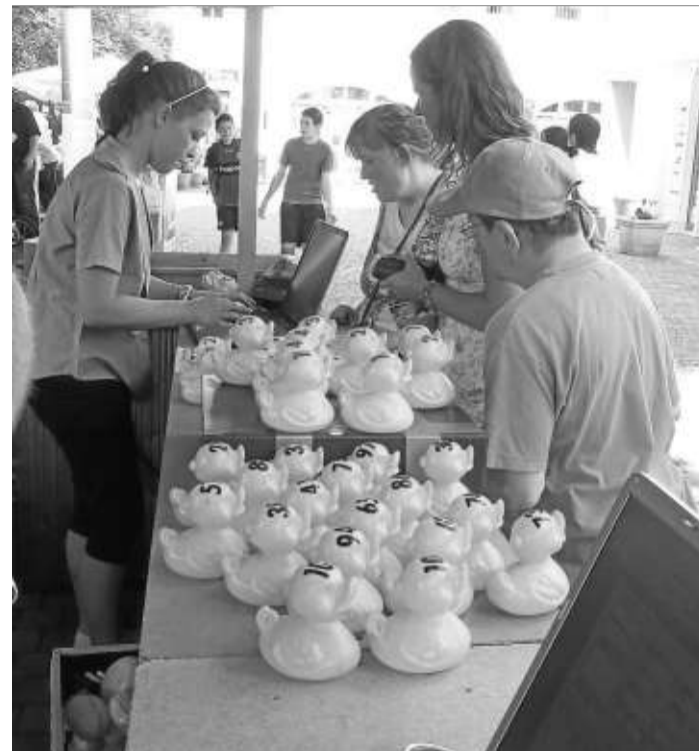
Der Renner waren die gelben Renn-Enten.