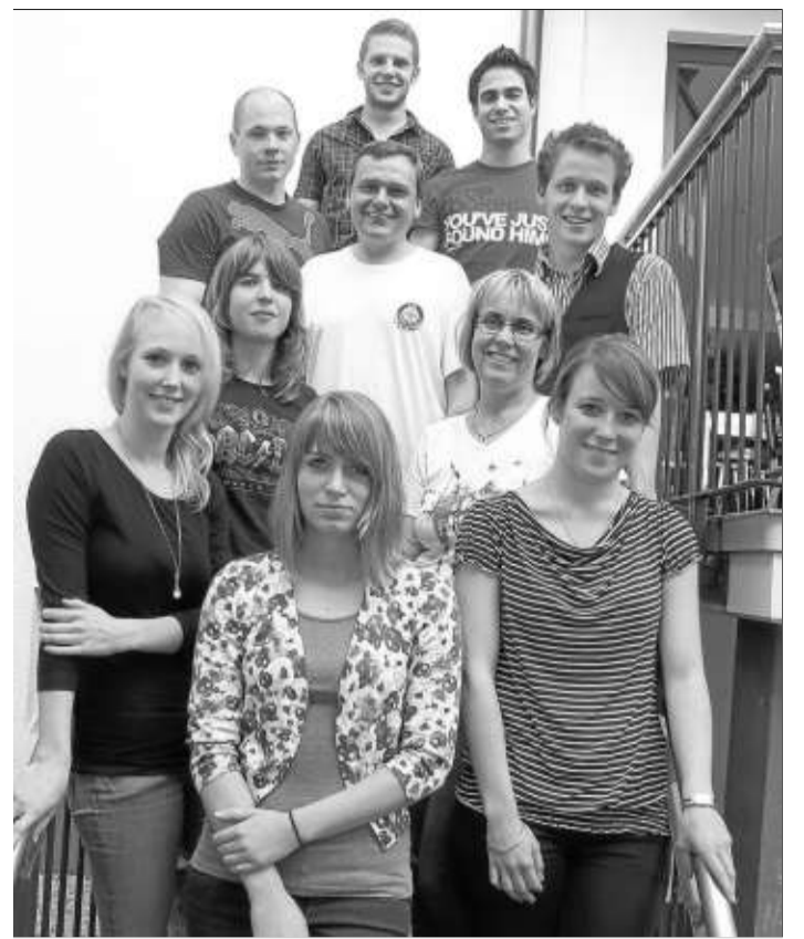
Die Absolventen der Ausbildung zum Deutschen Rettungsschwimmabzeichen mit ihren Trainern.