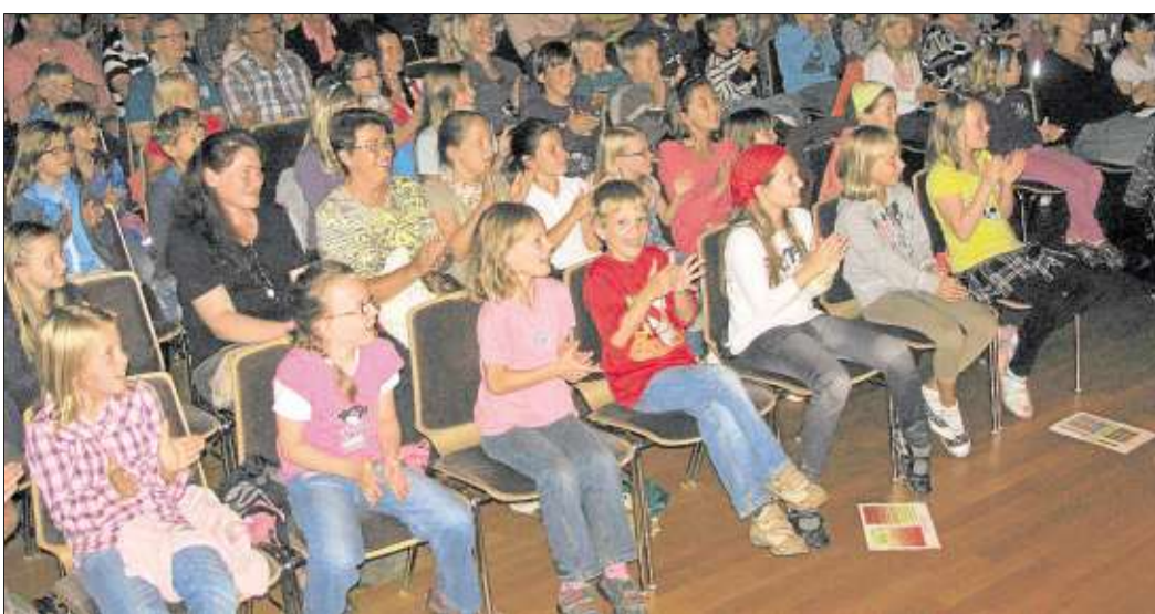
Gemeinsam mit Käpt'n Karl gingen die Ferienspielkinder auf Abenteuerfahrt zu den Piraten.