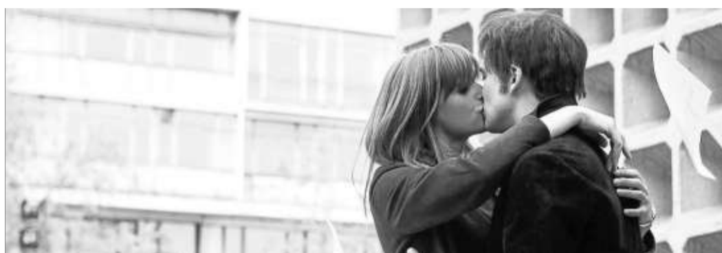
Eine bedingungslose Liebe: Gudrun Ensslin und der radikale Andreas Baader.

meinsamen Verlag, gehen nach Berlin. Gudrun verlässt für den radikalen Andreas Baader (Alexander Fehling) Mann und Kind, drifft in die Terrorismusszene, während Vesper sich auf Drogentrips verliert. Filmbeginn ist jeweils um 20 Uhr. Tickets und weitere Informationen zum Programm gibt es unter www.kukikino.de . / Foto: Senator