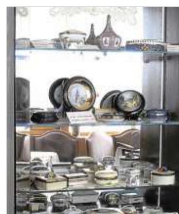
Die Ausstellung in der Vitrine im Café Egner ist noch bis zum Jahresende zu sehen.