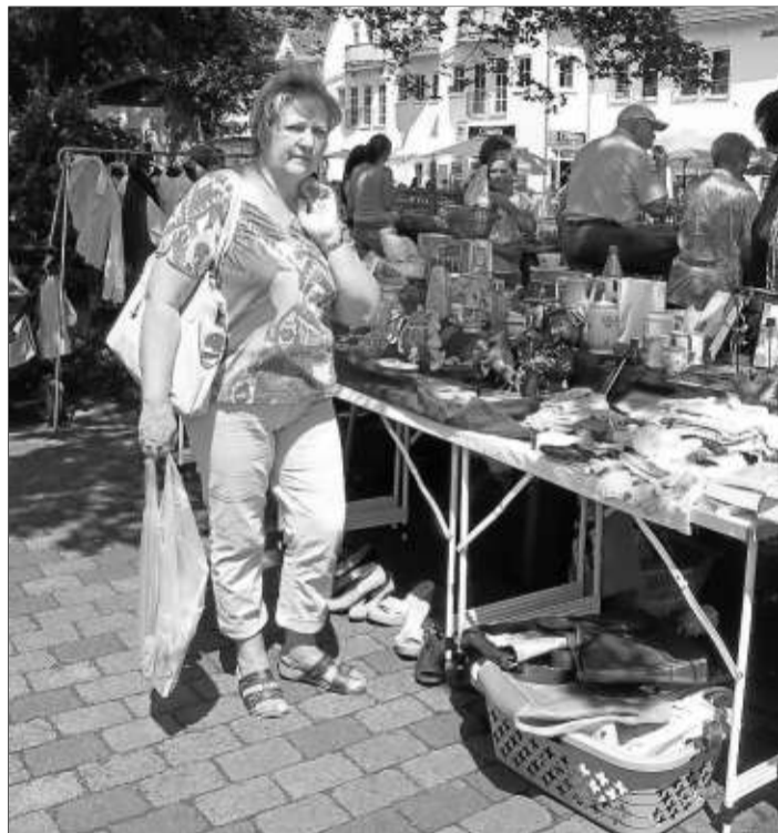
Schönes und Nützliches gab es auf dem Flohmarkt.