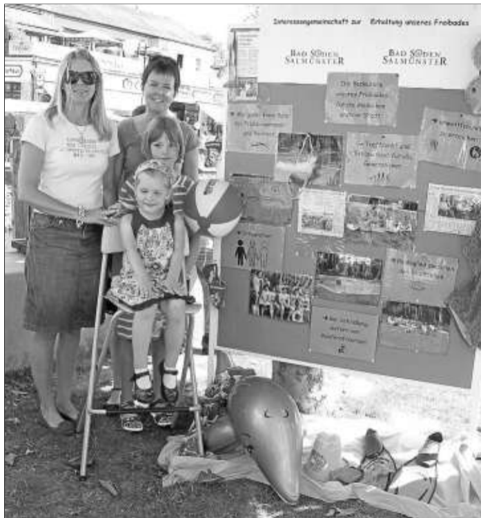
Die Initiative zur Erhaltung des Sodener Freibades informiert.