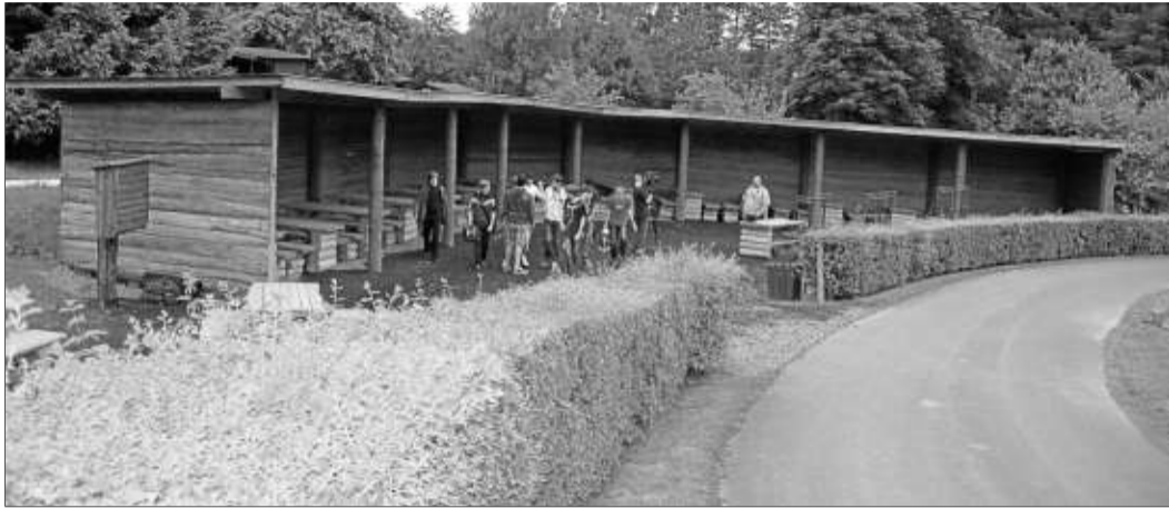
Die Riesengrillhütte bietet Platz für mehr als 200 Personen und umfasst drei Grill-Terminals sowie zahlreiche Holzische und -bänke.

Die Gewinner werden benachrichtigt und erhalten ihre Eintrittskarten per Post. Viel Glück!