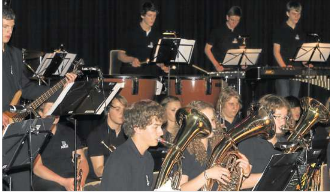
Die Big Band konzertierte auf hohem Niveau.