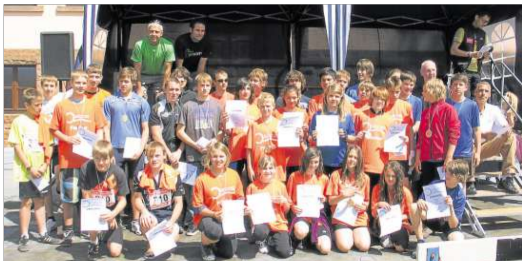
Die jugendlichen Sieger des Spessart-Therme-Duathlons freuen sich über ihre Medaillen und Urkunden.