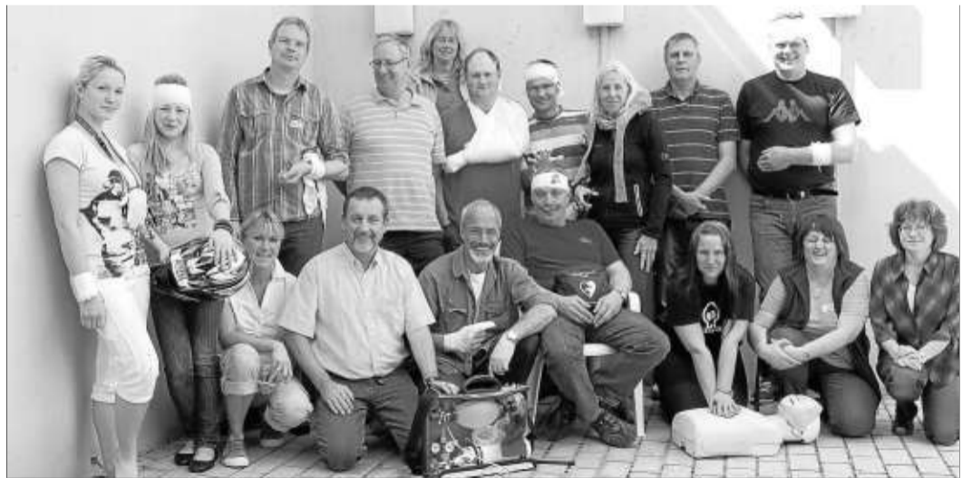
Schwimmbadpersonal aus verschiedenen Orten nahm an einem Seminar im Schlüchterner Hallenbad teil.

tern, Hutten, Sterbfritz, Altengronau, Langenbieber, und Erlensee. Alle Teilnehmer waren mit großem Eifer bei der Sache und sich einig darin, dass dies eine lehrreiche und sinnvolle Fortbildungsveranstaltung war, bei der auch der Spaß nicht zu kurz kam.