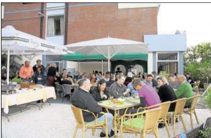
Auf der neugestalteten Terrasse des Landhotels Betz lässt es sich in geselliger Runde und bei einem Getränk gut aushalten.

Gern gesehen sind Biker und eine Besonderheit ist das Angebot „Klavier sucht Chor“. „Wir haben zwei Klaviere und bieten Chören die Möglichkeit in angenehmer Ambiente Ihre Spätfrühlingsabend bei Grilltem.“