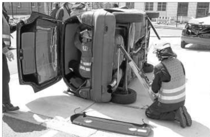
Eine eingeklemmte Person musste aus einem auf der Seite liegenden Fahrzeug gerettet werden.

Außer dem Wissen über die Techniken muss auch ein sicherer Umgang mit den entsprechenden Gerät-