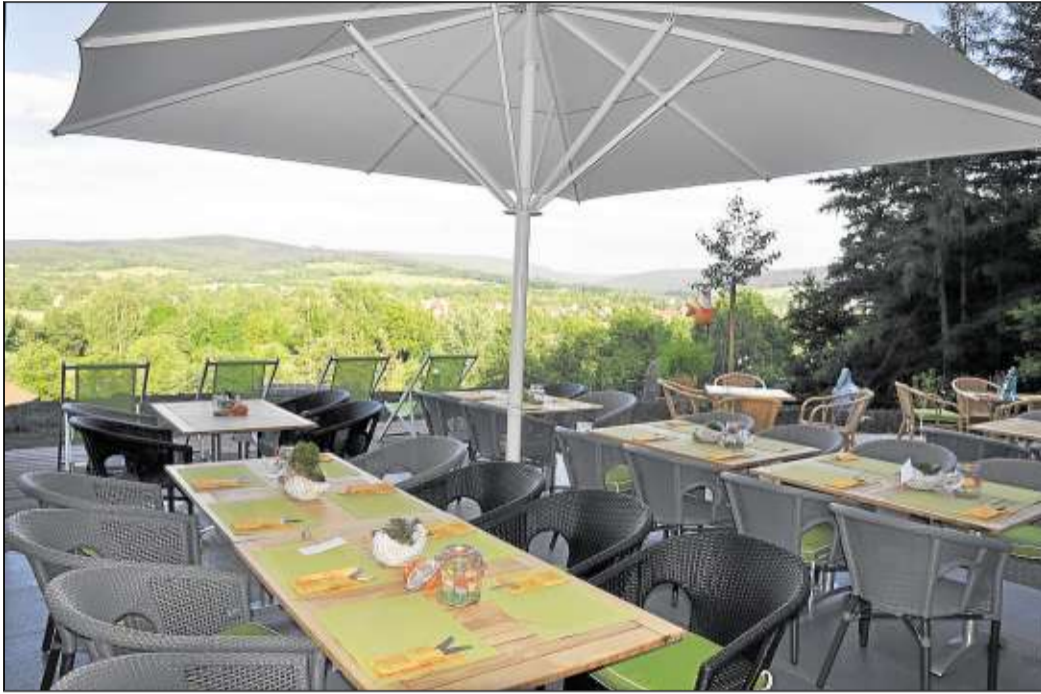
Ein unvergleichlich schöner Blick über Salz- und Kinzigtal bietet sich den Gästen des Landhotels Betz in Bad Soden-Salmünster.