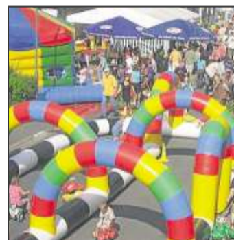
Mit den Bobby-Cars geht es durch die Kurven.

Das kulinarische Zelt des Vereins „Das Kunterbunte Kinderzelt“ steht bei Langer. Dort können sich die Besucher mit Kartoffelpfannkuchen und Leberkäse verwöhnen lassen.