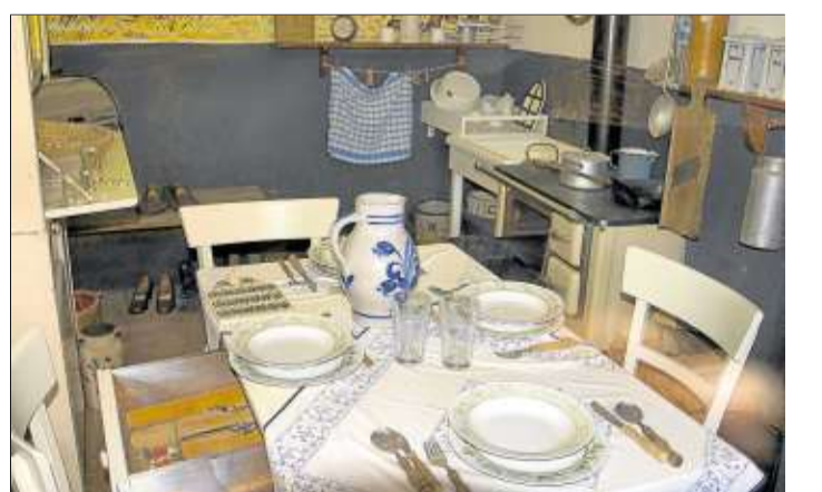
Die Zeitreise führt den Besucher durch den Bauernalltag um 1920.

ten haben oder dass der Waschkessel ein multifunktionales Gerät war, in dem nicht nur gewaschen, sondern auch gekocht wurde. Das System funktioniert mit jedem internetfähigen Mobiltelefon, das über einen Barcode-Scanner verfügt. An jeder Station finden sich quadratische Codes zum Scannen. Solche so genannten QR-Tags erfreuen sich auch in Printpublikationen immer größerer Beliebtheit. Das innovative Leit- und Informationssystem wurde deutschlandweit erstmals in der Stadt Steinau eingesetzt und erstreckt sich auf die dortigen Museen und weitere historischen Orte. Der Multimedia-Guide ist nicht nur vor Ort, sondern darüber hinaus über das Internet abrufbar unter www.erlebnispark-steinau.de/satelles .