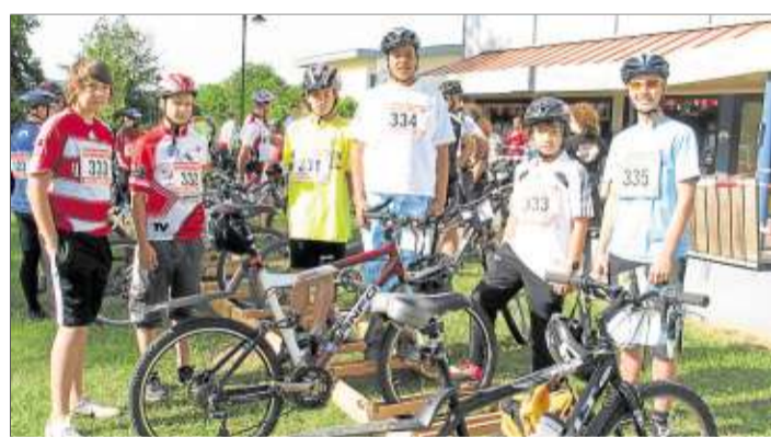
Schüler der Stadtschule Schlüchtern nahmen mit etlichen Teams am Spessart-Therme-Duathlon teil.