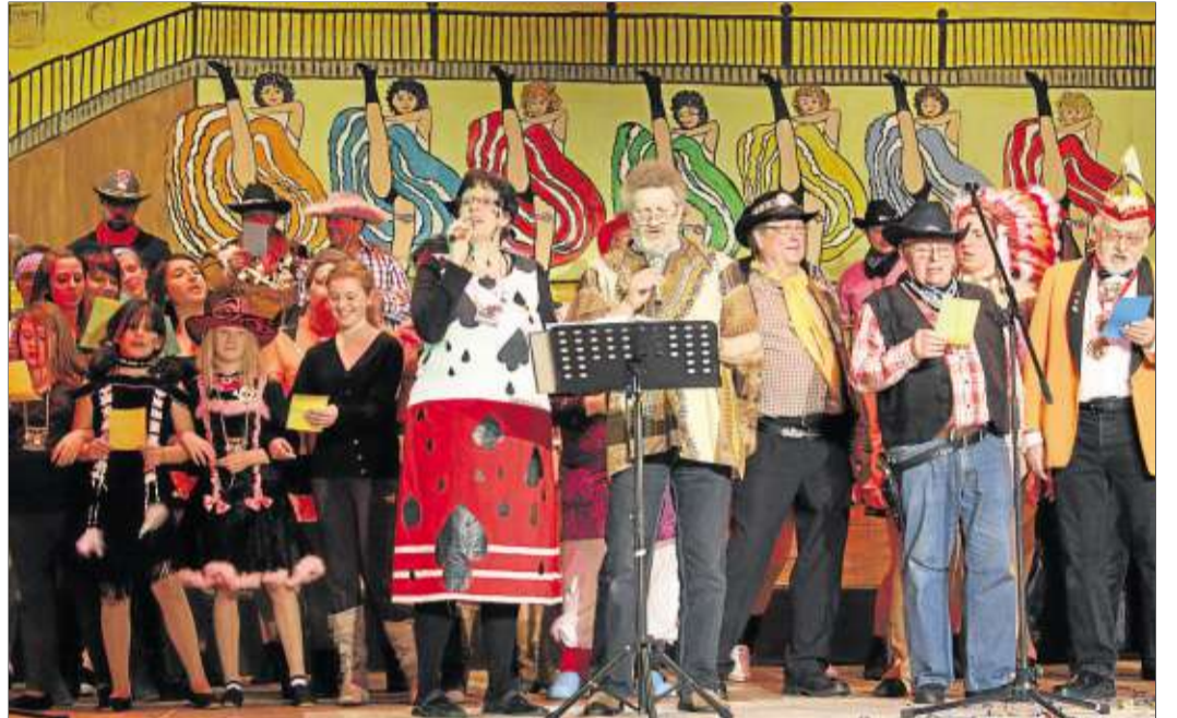
Am Ende einer kurzweiligen Prunkfremdensitzung kamen alle Akteure zum Finale auf die Bühne.