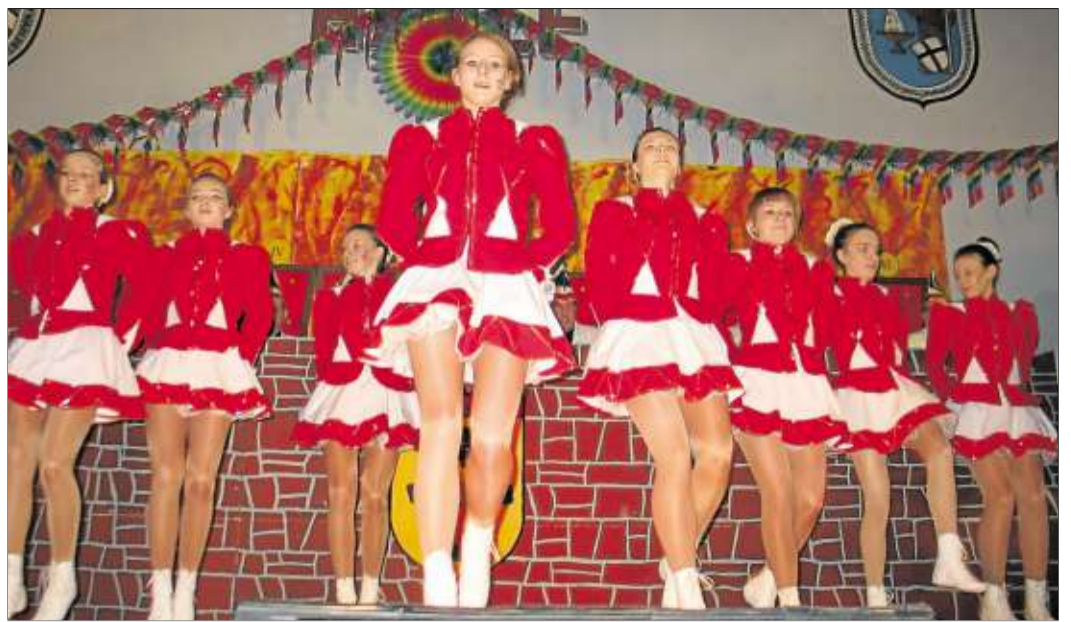
Anmutige Tanzleistung: Die Rote Garde Marborner Sternchen.