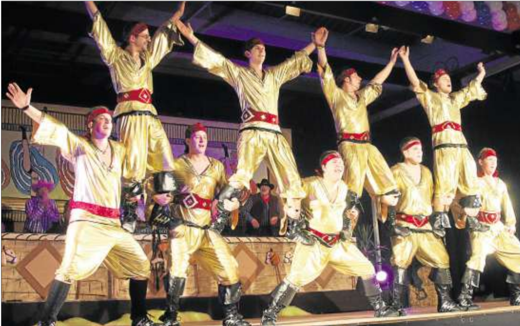
Der Auftritt der „Chopperklopfer“ aus Hintersteinau wurde vom Publikum begeistert gefeiert.