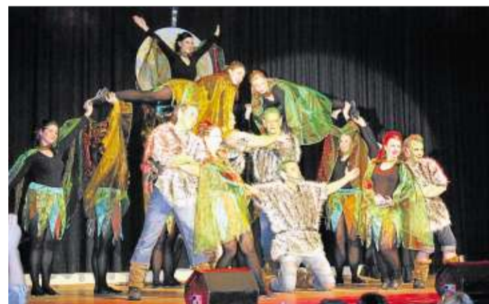
Einen Besuch im Zauberwald ermöglichten die Knallfrösche mit ihrem Showtanz.