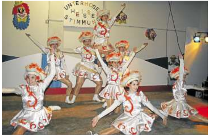
Die Präsidengarde Jossa gefiel neben vielen anderen Gruppen bei der ersten Garde- und Showtanzrevue der Hintersteinauer Faschingsfreunde Halodries.