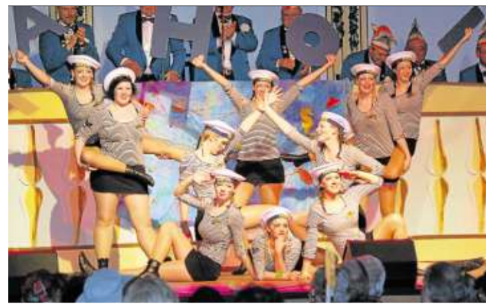
Die Glühwürmchen zeigten einen Matrosentanz.