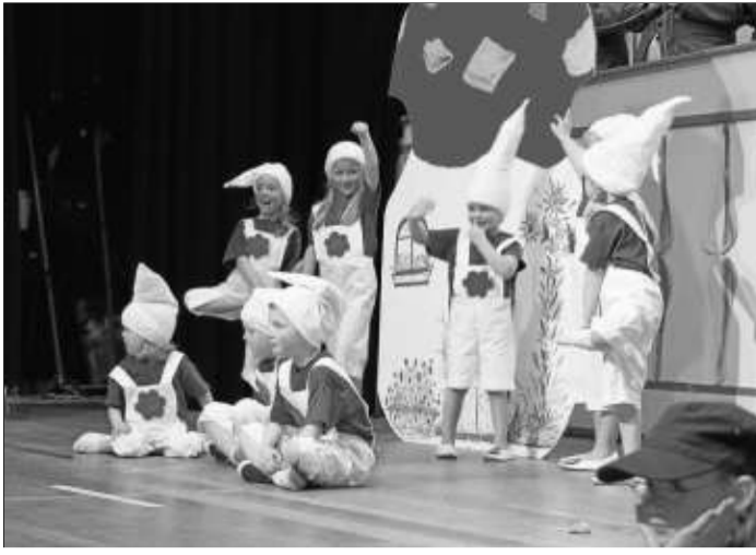
Die Jüngsten der „Minis“ sind gerade mal drei Jahre alt.

Zur Disco-Party luden die Dance Girls vom Wallrother Carnevalsverein ein. Ein weiterer Export aus Wallroth waren die „Mini-Hoppers“, mit ihnen ging es auf Safari nach Afrika. Die Konfettigarde, ebenfalls aus Wallroth, rundete das Bühnenprogramm ab. Die fleißigen Frauen des SCC hatten für eine reich gedeckte Kaffee- und Kuchentafel gesorgt.