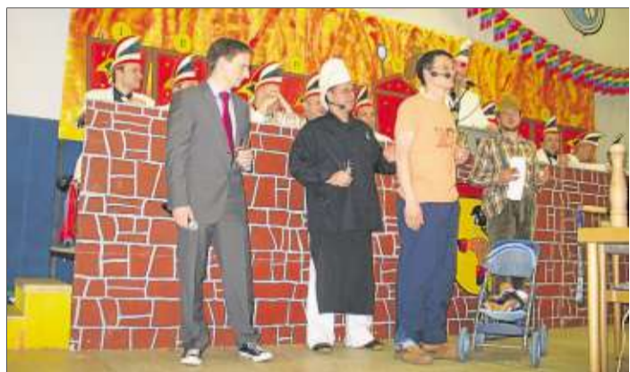
Sportreporter, Fernsehkoch, Babynator und Hessenbauer berichteten im „Huttengrund-TV.“

Sinntal-Weichersbach (rs). Für die Abendveranstaltungen des GFV Weichersbach am Samstag, 26. Februar, und am Samstag, 5. März, unter dem Motto „Weichersbach wird 700 Jahr, der GVf feiert mit, ist doch klar!“ sind noch Eintrittskarten in der Gaststätte Kissner erhältlich.