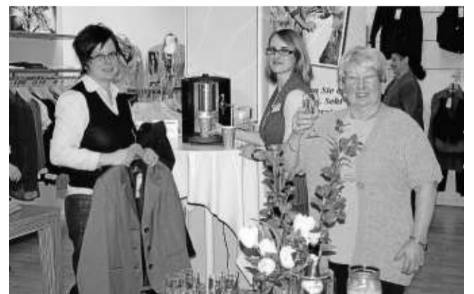
Impressionen vom vergangenen Freunde-Tag.

Gerry Weber berät die Kundinnen in der Damen Modeabteilung. Dazu gibt es eine Verlosung von drei praktischen original Gerry-Weber-Strandtaschen. Auch gibt es wie zu jeder Freunde-Aktion ein besonderes Angebot, in dieser Woche ein Kassetten-Daunenbett. Hofmann weist darauf hin, dass man auch noch kurzfristig ein Freund des Hauses werden kann. Einfach an den Kassen ein Formular ausfüllen, dann erhält man gleich eine Freunde-Karte, die am Samstag gültig ist.