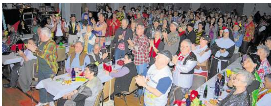
Das Publikum ließ sich vom kurzweiligen Programm mitreißen.