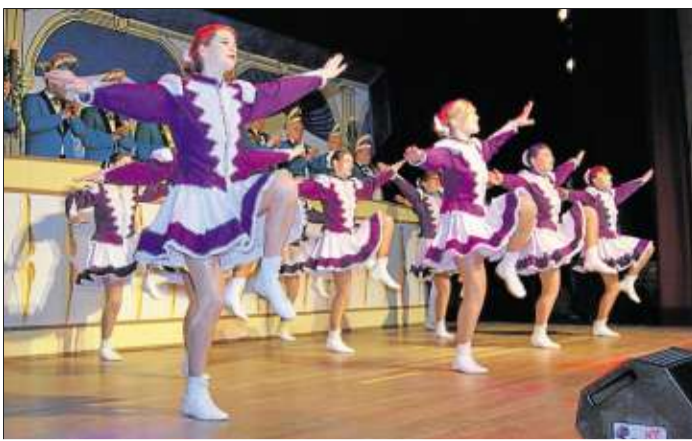
Die Knallfunken begeisterten mit einem Gardetanz.