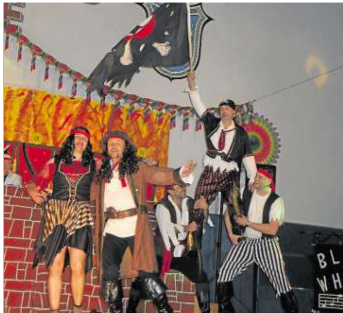
Spektakuläres Finale mit dem Elferrat als Wikinger und Piraten.