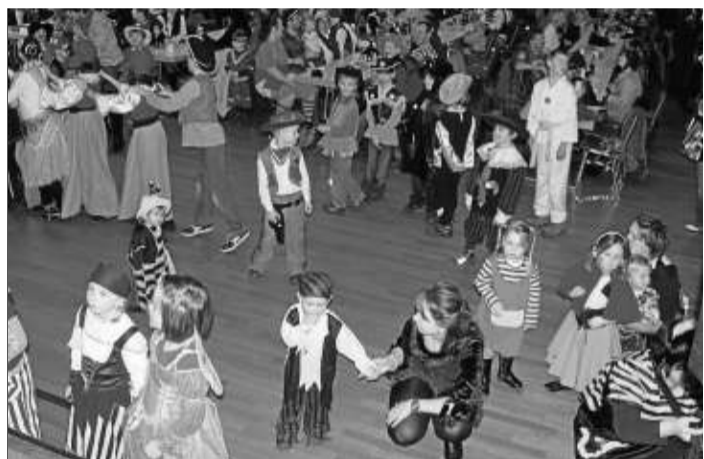
Bei lustigen Spielen konnten sich die kleinen Narren in der Stadthalle richtig austoben.

Nachdem die Spendenaktion für die Installation einer Turmuhr abgeschlossen ist, soll jetzt der Veranstaltungserlös für Verbesserungen der Ausstattung des Bürgerhauses dienen.