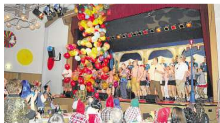
Beim großen Finale verabschiedeten sich rund 120 Aktive von einem begeisterten Publikum.