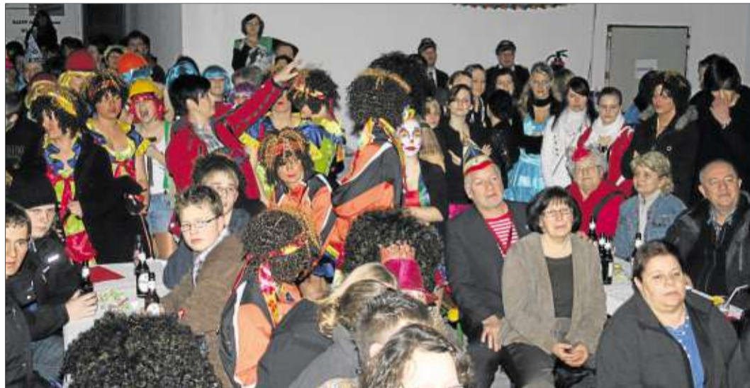
Inmitten der zahlreichen Besuchern war auch Bürgermeister Walter Strauch mit Gattin.