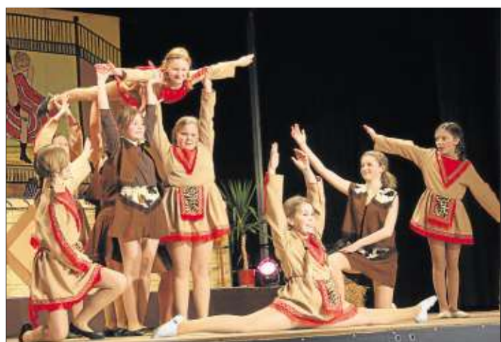
„Country Roads“ erklang beim Auftritt der „roten Funken“. Die Mädchen waren als Cowboys und Indianer verkleidet.